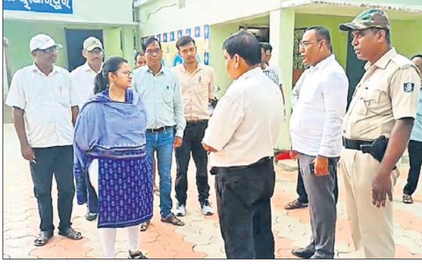
ଧାରପୁର ବାଲିକା ଉଚ୍ଚ ବିଦ୍ୟାଳୟରେ ଜିଲାପାଳ ଓ ଅନ୍ୟମାନେ।