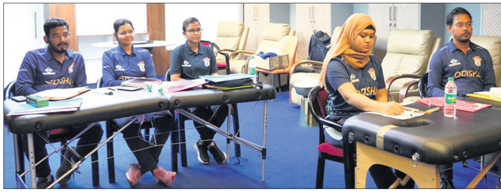
ଓସିଏ ପକ୍ଷରୁ ଆୟୋଜିତ କର୍ମଶାଳାରେ ଉପସ୍ଥିତ ଫିଜିଓ।

ଭୁବନେଶ୍ୱର, ୪୯ (ସରୋଜ କେନା) ନ୍ୟାଶନାଲ୍ କ୍ରିକେଟ୍ ଏକାଡେମୀ (ଏନ୍‌ସିଏ) ସହାୟତାରେ ଓଡ଼ିଶା କ୍ରିକେଟ୍ ଆସୋସିଏସନ୍ ପକ୍ଷରୁ ଫିଜିଓପେରାପିଷ୍ଟଙ୍କ ପାଇଁ ଏକ କର୍ମଶାଳା ଆୟୋଜିତ ହୋଇଯାଇଛି। ମଙ୍ଗଳବାର ଆରମ୍ଭ ହୋଇଥିବା ଏହି କର୍ମଶାଳା ଗୁରୁବାର ଶେଷ