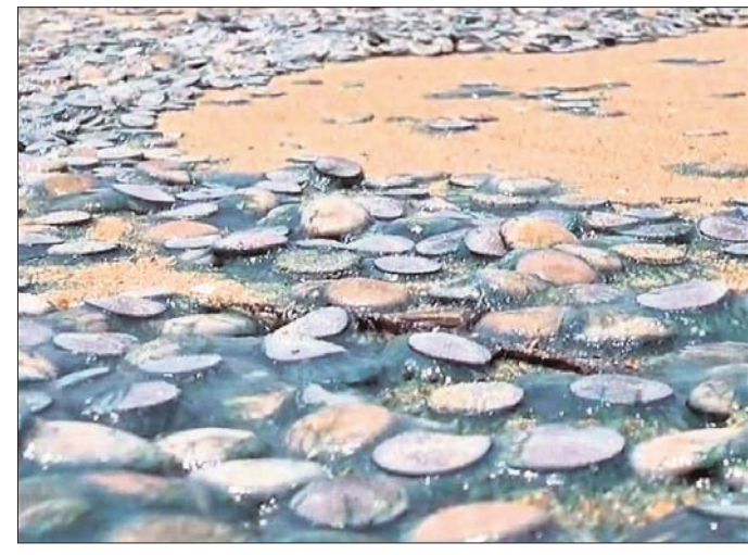
ଜାହାଜିଆ ବେଳାଭୂମିରେ ମରିପଡ଼ିଥିବା ଜେଲିଫିଶ୍।

ଅସ୍ତରଙ୍ଗ, ୪୯ (ପ୍ରଦୀପ କୁମାର ଦାଶ) ପୁରୀ ଜିଲ୍ଲା ଅସ୍ତରଙ୍ଗ ଉପକୂଳ ଜାହାଜିଆ ବେଳାଭୂମିରେ ରୂପବାର ଶିତାଧିକ ଜେଲିଫିଶ୍ ମୃତଦେହ ପଡ଼ିଥିବା ଦେଖାଯାଇଛି। ଅସ୍ତରଙ୍ଗଠାରୁ କୋଣାର୍କ ପର୍ଯ୍ୟନ୍ତ ବେଳାଭୂମି ସମସ୍ତ କୁଳରେ ବହୁସଂଖ୍ୟାରେ ଜେଲିଫିଶ୍ ଭାସୁଛନ୍ତି। ଜେଲିଫିଶ୍ ବାହାରୁଥିବା ଲାଲ ସମୁଦ୍ରରେ ଗାଧୋଇଥିବା ପର୍ଯ୍ୟଟକଙ୍କ ପାଇଁ ବିପଦ ସୃଷ୍ଟି କରିଛି। ଏହାକୁ ଦେଖି ପର୍ଯ୍ୟଟକମାନେ ଅସନ୍ତୋଷବ୍ୟକ୍ତ କରିଛନ୍ତି। ଜେଲିଫିଶ୍ ଲାଲ ଶିରୀରରେ ଲାଗିବା ଦ୍ୱାରା ଦେହ କୁଣ୍ଡେଇ ହେବା ସହ ନାଲି ପଡ଼ିଯାଏ। ବର୍ତ୍ତମାନ ସୁଦ୍ଧା କୋଣାର୍କ ପର୍ଯ୍ୟଟକ ଆହତ ହୋଇ ନ ଥିବାବେଳେ ଜେଲିଫିଶ୍ ସମୁଦ୍ରକୂଳରେ ଲାଗିଥିବାରୁ ଲୋକେ ସେତେ ମାତ୍ରାରେ ସ୍ନାନ କରୁନାହାନ୍ତି। ଗତ କିଛି ଦିନ ହେବ ଖରାପ ପ୍ରକାୟ ବଢ଼ିଥିବାରୁ ସମୁଦ୍ର ଭିତରେ ଗତି ପ୍ରବଳ