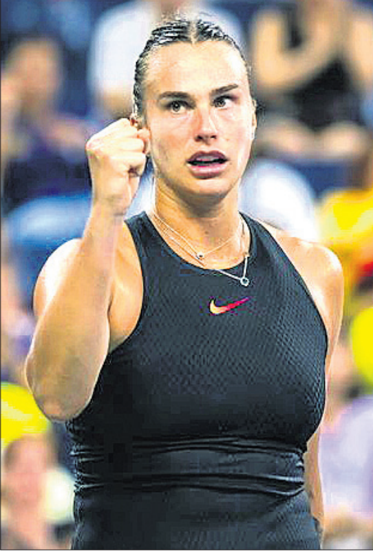
ମ୍ୟାଚ୍ ଜିତିବା ପରେ ଆରିନା ସାବାଲେଙ୍କା ଚେଲର ଫ୍ରାନ୍ସ।

ଅନ୍ୟ ଏକ ମ୍ୟାଚ୍ରେ ଫ୍ରାନ୍ସିସ ଚିଆପୋ ଖୁବ୍ ଉତ୍ତମ ପାଇଁ ସେମିରେ ପ୍ରବେଶ କରିଛନ୍ତି। ମହିଳା ସିଙ୍ଗଲ୍ସ ବର୍ଗରେ ବିଶ୍ୱ ମାନ୍ୟତାର ବିତାଣ ଗ୍ରାଣୀରେ ଥିବା ଆରିନା ସାବାଲେଙ୍କା ଅଲିକ୍ସିନ୍ଦ୍ରା ପାବ୍ଲୋସ୍ ବିଜେତା କ୍ୱିନଫେନ ଝାଙ୍ଗୁ ପରାସ୍ତ କରିଥିଲେ। ଦୀର୍ଘ ୧୮ ବର୍ଷ ପରେ ଯୁବକ ଓପନ ଫାଇନାଲରେ ଜଣେ ଆମେରିକୀୟ ନଜର ଆସିବେ। ଫ୍ରାନ୍ସିସ ଚିଆପୋ ଓ ଚେଲର ଫ୍ରାନ୍ସ ସେମି ଫାଇନାଲରେ ପରସ୍ପର ବିପକ୍ଷରେ ଖେଳିବାକୁ ଯାଉଥିବା ବେଳେ ଯିଏ ବି ବିଜୟୀ ହେଲେ ଜଣେ ଆମେରିକୀୟ ଫାଇନାଲରେ ପ୍ରବେଶ କରିବେ। ୨୦ ନମ୍ବର ସିଡ୍ ଚିଆପୋ ୬-୩, ୬-୬(୫/୮), ୬-୩ ଓ ୪-୧ରେ ଗ୍ରିଗୋର ଦିମିତ୍ରୋଭିଚ୍ ବିପକ୍ଷରେ