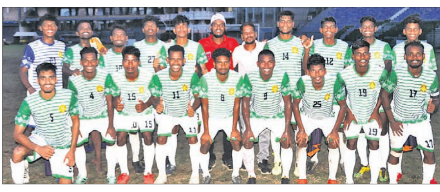
କଟକ ବାରବାଟୀ ଷ୍ଟାଡ଼ିୟମରେ ବୁଧବାର ଅନୁଷ୍ଠିତ ଏମ୍ବିଏସ୍ ଫାଏଁ ଲିଗ୍ ୨୦୨୪ (୨ୟ ଡିଭିଜନ) ଫାଇନାଲରେ ଭଦ୍ର କୁବକୁ ୨-୦ ଗୋଲରେ ପରାସ୍ତ କରି ଚାମ୍ପିୟନ ହୋଇଥିବା ଓଡ଼ିଶା ଏମ୍ବିଏସ୍ ଟୋପର କ୍ଳବର ଖେଳାଳିମାନେ ।