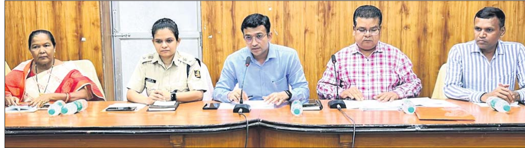
ଖବରଦାତା ସମ୍ମିଳନୀରେ ଜିଲ୍ଲାପାଳ ଓ ଏସପିଙ୍କ ସହ ପ୍ରଶାସନିକ ଅଧିକାରୀ ।

ବାଲେଶ୍ୱର ଜିଲ୍ଲାରେ 'ସୁଭଦ୍ରା' ଯୋଜନାର କାର୍ଯ୍ୟକାରୀତା ସମ୍ପର୍କରେ ରୁଧିରୀ ସଂଘର ସଂଗୋଧନ ପାଇଁ ଅନେକ ଶହ ଲୋକ ଭିଡ଼ କମ୍ପାଉଣ୍ଡରୁ ଉଦ୍ଦେଶ୍ୟାତମକ ଭାବରେ ପରିଚ୍ଛା ହୋଇଥିଲା । ବଡ଼ ସଂଖ୍ୟାରେ ଯୋଗ ଦେଇଥିବା ଏକ ଖବରଦାତା ସମ୍ମିଳନୀ ଅନୁଷ୍ଠିତ ହୋଇଯାଇଛି । 'ସୁଭଦ୍ରା' ଯୋଜନାରେ ଆବେଦନ ପାଇଁ ପର୍ଯ୍ୟାପ୍ତ ସମୟ ଅଛି । ଏହା ନିରନ୍ତର ପ୍ରକ୍ରିୟା । ଏଥିପାଇଁ ଜିଲ୍ଲାରେ ମୋଟ ୨୨୦୦ଟି ସୁଭଦ୍ରା କ୍ୟାମ୍ପ ଖୋଲା ଯାଇଛି । ଜିଲ୍ଲାର ସମସ୍ତ ଅଞ୍ଚଳରେ କେନ୍ଦ୍ରକୁ ଲକ୍ଷ୍ୟ କରି ପ୍ରଦାନ କରାଯାଇଛି । ହିତାଧିକାରୀମାନେ ଦରଖାସ୍ତ ପୂର୍ଣ୍ଣ ଅଞ୍ଚଳରେ କେନ୍ଦ୍ରକୁ ଗ୍ରହଣ କରିପାରିବେ ।