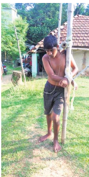
ଅଭିଯୁକ୍ତଙ୍କୁ ଏକ ଖୁଣ୍ଟରେ ବାନ୍ଧି ପକାଇଛନ୍ତି ପଡ଼ୋଶୀ ।