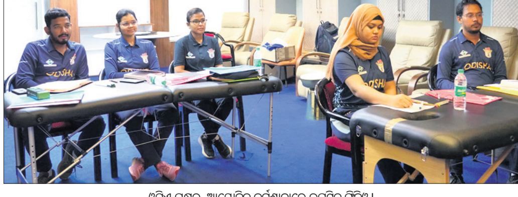
ଓସିଏ ପକ୍ଷରୁ ଆୟୋଜିତ କର୍ମଶାଳାରେ ଉପସ୍ଥିତ ଫିଜିଓ।

ଭୁବନେଶ୍ୱର, ୪୯ (ସରୋଜ କେନା) ନ୍ୟାଶନାଲ୍ କ୍ରିକେଟ୍ ଏକାଡେମୀ (ଏନ୍ସିଏ) ସହାୟତାରେ ଓଡ଼ିଶା କ୍ରିକେଟ୍ ଆସୋସିଏସନ୍ ପକ୍ଷରୁ ଫିଜିଓପେରାପିଷ୍ଟକ ପାଇଁ ଏକ କର୍ମଶାଳା ଆୟୋଜିତ ହୋଇଯାଇଛି। ମଙ୍ଗଳବାର ଆରମ୍ଭ ହୋଇଥିବା ଏହି କର୍ମଶାଳା ଗୁରୁବାର ଶେଷ