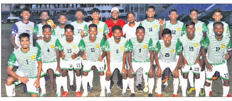
କଟକ ବାରବାଟୀ ଷ୍ଟାଡ଼ିୟମରେ ବୁଧବାର ଅନୁଷ୍ଠିତ ଏମ୍ପିଏସ୍ ଫାଏଁ ଲିଗ୍ ୨୦୨୪ (୨ୟ ଡିଭିଜନ) ଫାଇନାଲରେ ଭବିନା କୁବକୁ ୨-୦ ଗୋଲରେ ପରାସ୍ତ କରି ଚାମ୍ପିୟନ ହୋଇଥିବା ଓଲବ୍ୟପ୍ଟି ଚୌପାର କୁବର ଖେଳାଳିମାନେ।