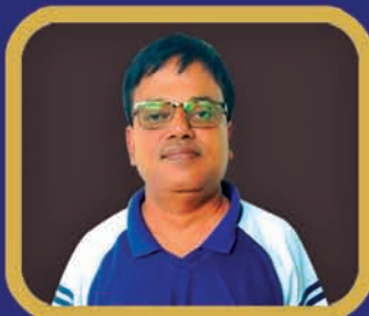
ଭାରତ ଗୌରବ ଡ. ସରୋଜ କୁମାର ପାଣିଗ୍ରାହୀ (ପୂର୍ବ ବିଜ୍ଞାନ, ଡି. ବି. ଆର୍. ଆର୍)