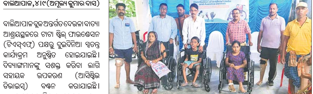
ଦିବ୍ୟାଙ୍କୁ ସହାୟକ ଉପକରଣ ବଣ୍ଟନ କରାଯାଇଛି ।

ଉପକରଣ ବଣ୍ଟନ କାର୍ଯ୍ୟକ୍ରମ ଆୟୋଜନ କରାଯାଇଥିଲା । ପ୍ରସ୍ତାବିତ ସୁବର୍ଣ୍ଣବେଶା ପୋର୍ଟ ପ୍ରାଇଭେଟ ଲିମିଟେଡ଼ର ସାମଗ୍ରିକ ଗୁଣାତ୍ମକ ମାନରେ ଉନ୍ନତ ଆଣିବା ଲକ୍ଷ୍ୟ ନେଇ ଏହି ସହାୟକ