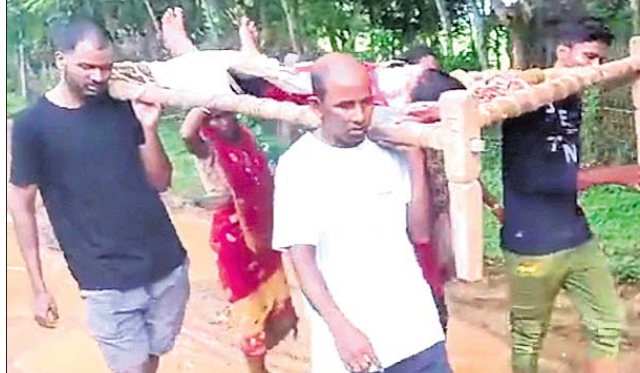
ମହିଳାଙ୍କୁ ଖଟିଆରେ ବୋହି ନିଆଯାଇଛି ।