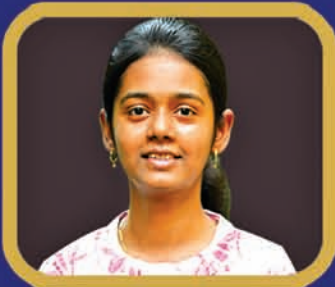
ବିଦ୍ୟା ଭାରତ ସମ୍ମାନ ପ୍ରଞ୍ଜା ପାରିମିତା ବିରି (+୨ ବିଜ୍ଞାନ)