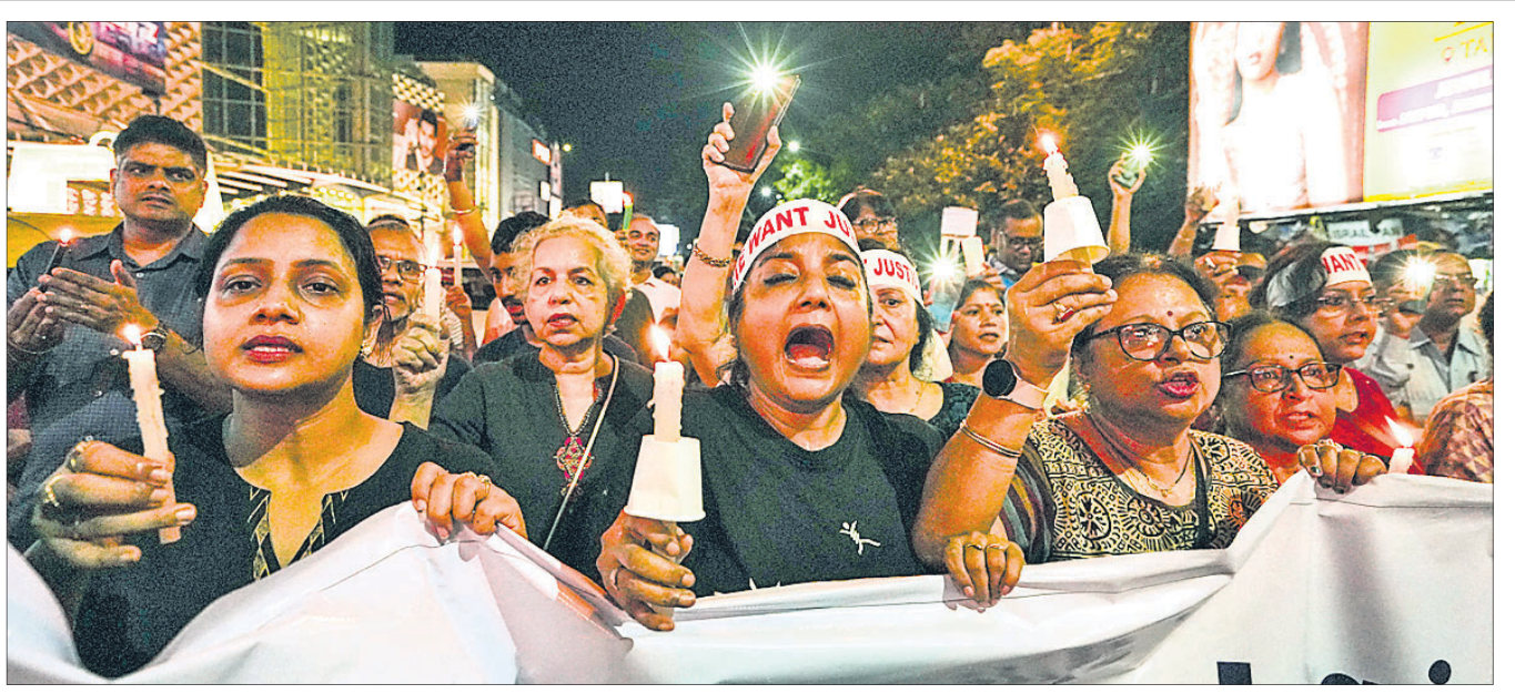
ଆର.ଜି. କର ହସ୍ପିଟାଲରେ ଅଗଣା ଗାନ୍ଧୀ ଗୀତିରେ ବଳାକାଠା ଓ ହତ୍ୟାର ଶିକାର ହୋଇଥିବା ମହିଳା ତାଙ୍କୁ ନ୍ୟାୟ ପ୍ରଦାନ ଦାବିରେ ରୁଧିରା ଗୀତିରେ କୋଳକାତାରେ ଅନେକ ହଜାର ଲୋକ କ୍ୟାଣ୍ଡେଲ ଶୋଭାଯାତ୍ରା କରିଛନ୍ତି।