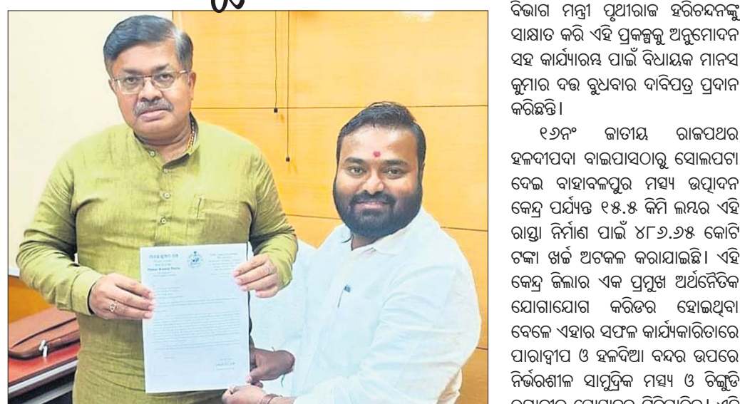
ମନ୍ତ୍ରୀଙ୍କୁ ଦାବିପତ୍ର ପ୍ରଦାନ କରୁଛନ୍ତି ବିଧାୟକ ।

ବାଲେଶ୍ୱର ନିର୍ବାଚନମଞ୍ଚଳାର କମ୍ପ୍ୟୁଟର ମହାଶାସତ୍ର ଥିବା ବାହାରଳପୁର ମାଛଧରା ଜେଟି ଏକ ପ୍ରମୁଖ ବ୍ୟବସାୟିକ କେନ୍ଦ୍ର । ସେଠାରୁ ବିଭିନ୍ନ ରାଜ୍ୟକୁ ମାଛ ରପ୍ତାନୀ ହୋଇଥାଏ । ହେଲେ ୧୬୯୯ ଜାତୀୟ ରାଜପଥର ହଳଦୀପଦାକୁ ବାହାରଳପୁର ପର୍ଯ୍ୟନ୍ତ ଥିବା ସଂକୀର୍ଣ୍ଣ ବୁଦ୍ଧି ରଖିଥିଲେ । ଏହି ପ୍ରତିଯୋଗିତାରେ କୁଳର ୧୧୨ ବିଧାନସଭା ୧୫୦ରୁ ଉର୍ଦ୍ଧ୍ୱ ଛାତ୍ରୀଛାତ୍ର ଅଂଗ୍ରହଣ କରିଥିଲେ । କୃତୀ ପ୍ରତିଯୋଗୀମାନଙ୍କୁ ପୁରସ୍କାର ପ୍ରଦାନ କରାଯାଇଥିଲା । ବିଆର୍ସିସି ପୋଲିସ୍ ଚନ୍ଦ୍ର ଯେନା ଧନସ୍ୟାବଦ ଦେଇଥିଲେ ।