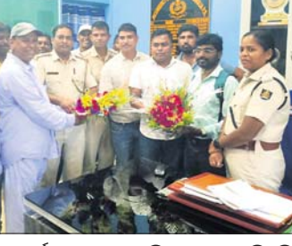
ଆଇଆଇସି ସମ୍ପର୍କ କଲେ ଗରବଜା ଗ୍ରାମବାସୀ