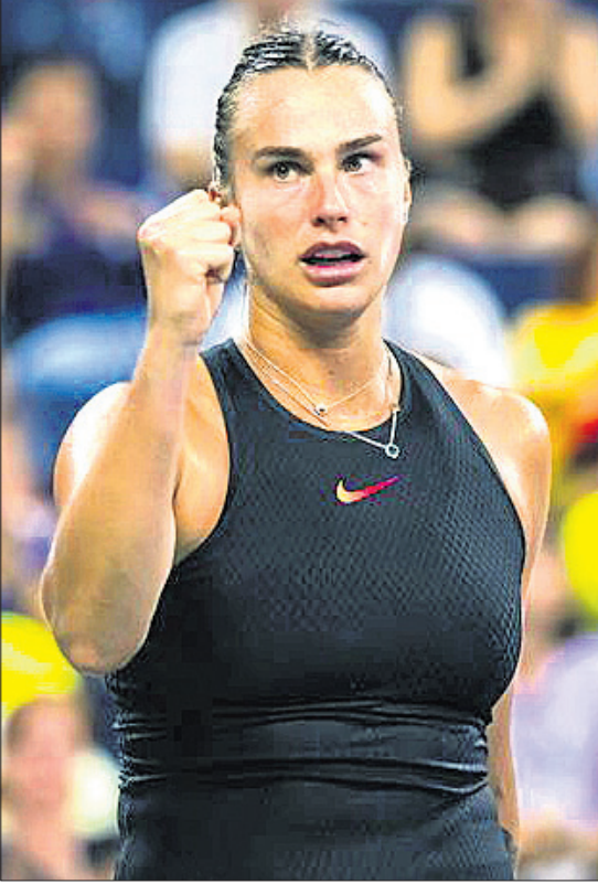
ମ୍ୟାଚ୍ ଛିଡ଼ା ପରେ ଆରିନା ସାବାଲେଙ୍କା ଚେଲର ଫ୍ରାନ୍ସ।

ଅନ୍ୟ ଏକ ମ୍ୟାଚ୍ରେ ଫ୍ରାନ୍ସ ଚିଆପୋ ଖୁବ୍ ଉତ୍ତମ ପାଇଁ ସେମିରେ ପ୍ରବେଶ କରିଛନ୍ତି। ମହିଳା ସିଙ୍ଗଲ୍ସ ବର୍ଗରେ ବିଶ୍ୱ ମାନ୍ୟତାର ବିତାଣ ଗ୍ରାଣରେ ଥିବା ଆରିନା ସାବାଲେଙ୍କା ଅଲିକ୍ସିନ୍ଦ୍ରା ପ୍ୟାଣ୍ଟିଙ୍କୁ ବିଜେତା କ୍ଲିନଫ୍ରେନ୍ ଝାଙ୍ଗୁଙ୍କୁ ପରାସ୍ତ କରିଥିଲେ। ଦୀର୍ଘ ୧୮ ବର୍ଷ ପରେ ସ୍ତୁପ ଓପନ ଫାଇନାଲରେ ଜଣେ ଆମେରିକୀୟ ନଜର ଆସିବେ। ଫ୍ରାନ୍ସ ଚିଆପୋ ଓ ଚେଲର ଫ୍ରାନ୍ସ ସେମି ଫାଇନାଲରେ ପରସ୍ପର ବିପକ୍ଷରେ ଖେଳିବାକୁ ଯାଉଥିବା ବେଳେ ଯିଏ ବି ବିଜୟୀ ହେଲେ ଜଣେ ଆମେରିକୀୟ ଫାଇନାଲରେ ପ୍ରବେଶ କରିବେ। ୨୦ ନମ୍ବର ସିଡ୍ ଚିଆପୋ ୬-୩, ୬-୭(୫/୮), ୬-୩ ଓ ୪-୧ରେ ଗ୍ରୀସୋର ଦିମିତ୍ରୋଭିକ୍ ବିପକ୍ଷରେ