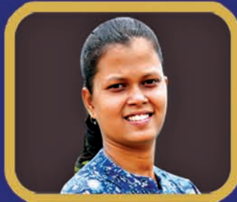
ବିଦ୍ୟା ଭାରତ ସମ୍ମାନ ମିଲିତା ମାତୁ (+୨ ବାଣିଜ୍ୟ)