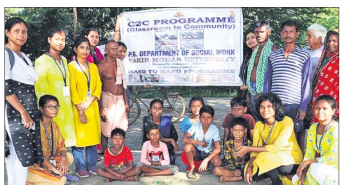
ରସକପୁର ଗ୍ରାମବାସୀଙ୍କ ଗହଣରେ ଛାତ୍ରୀମାନେ ।