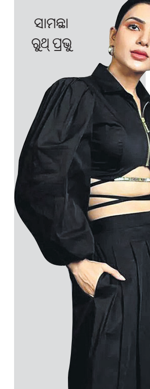
ସାମାଜିକ ରୁଧି ପ୍ରଭୁ

ଦେଖିବାକୁ ମିଳିଛି। ଆମେରିକା, କଣ୍ଠେଷ୍ଟ୍ର କ୍ରିଏଟିଭ କେନ୍ଦ୍ର ଖାଙ୍ଗ ଉଚ୍ଚ ଭିଡିଓକୁ ନିଜ ଇନ୍‌ଷ୍ଟାଗ୍ରାମ ଆକାଉଣ୍ଟରେ ପୋଷ୍ଟ କରିଛନ୍ତି। ଭିଡିଓରେ ସେ ସ୍ନେକ୍ ଯୋଗାସନ ବିଷୟରେ ନିଜ ଫଲୋଅର୍ସମାନଙ୍କୁ ରୁଖାଇବା ସହ ଏହାକୁ ପ୍ରଦର୍ଶିତ ମଧ୍ୟ କରୁଛନ୍ତି। ସେ ନିଜ ଶରୀରରେ ଏକ ଜିଆଡ଼ା ସାପକୁ ଗୁଡ଼ାଇ ଯୋଗ କରୁଥିବା ନେଇ ଏହି ଭିଡିଓରେ ଦେଖିବାକୁ ମିଳୁଛି। ଭିଡିଓରେ ଖାଙ୍ଗ କହିଛନ୍ତି, ଲକ୍ଷ୍ମୀ ସଂଖ୍ୟାଲକ୍ଷ 'ଏଲ୍ ଏକ୍ ଆର୍ ପାଇଥର୍' ଯୋଗ କେନ୍ଦ୍ର ହେଉଛି ବିଶ୍ୱର ଏକମାତ୍ର ସ୍ଥାନ ଯେଉଁଠାରେ ସ୍ନେକ୍ ଯୋଗାସନର ପ୍ରଶିକ୍ଷଣ ଦିଆଯାଇଥାଏ। ସ୍ନେକ୍ ଯୋଗାସନ ସବୁବେଳେ ତାଙ୍କୁ ଏକ ନିଆରା ଅନୁଭୂତି ପ୍ରଦାନ କରିଥାଏ ବୋଲି ଖାଙ୍ଗ କହିଛନ୍ତି। ଉଚ୍ଚ ଯୋଗକେନ୍ଦ୍ରରେ ଶରୀରରେ ସାପ ରଖି ଯୋଗ କରିବା ବାଧ୍ୟତାମୂଳକ ବୋଲି ସେ କହିଛନ୍ତି।