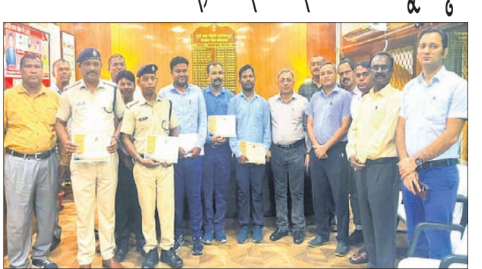
ରେଳ ମଣ୍ଡଳ ପ୍ରବନ୍ଧକ ଓ ଅନ୍ୟ ଅଧିକାରୀଙ୍କ ସମ୍ମାନରେ ପୁରସ୍କୃତ ଲୋକୋ ପାଳନ ଓ ଆରପିଏସ୍ କର୍ମଚାରୀ । ସମ୍ବଲପୁର, ୫୮୯ (ପ୍ରମୋଦ ବହିଦାର)

ରେଳ ମଣ୍ଡଳ ପ୍ରବନ୍ଧକ ଓ ଅନ୍ୟ ଅଧିକାରୀଙ୍କ ସମ୍ମାନରେ ପୁରସ୍କୃତ ଲୋକୋ ପାଳନ ଓ ଆରପିଏସ୍ କର୍ମଚାରୀ