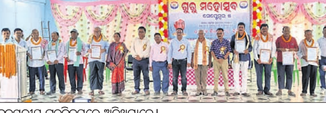
ବୁଦ୍ଧପୁରୀୟ ଗୁରୁଦିବସରେ ଅତିଥିମାନେ।

ତାଙ୍କ ବକ୍ତାବଳୀରେ ଗୁରୁଜୀଗୁରୁମାନଙ୍କ ସମ୍ପର୍କ ନିଜ କର୍ତ୍ତବ୍ୟ ସ୍ୱତନ୍ତ୍ରତାରେ ପାଳନ କରିବାକୁ ଆହ୍ୱାନ ଦେଇଥିଲେ।