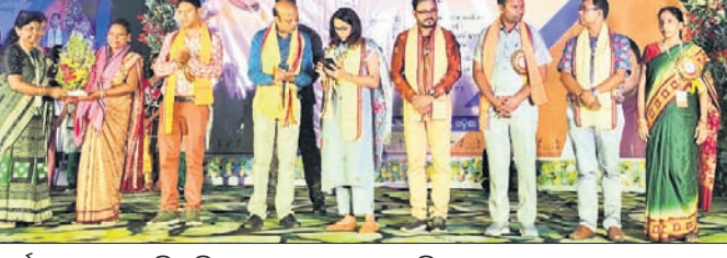
କାର୍ଯ୍ୟକ୍ରମରେ ଉପସ୍ଥିତ ଲୋକମାନଙ୍କ ସହ ଅନ୍ୟ ଅତିଥିଗୁଣ୍ଠ।

ଘାଣୀୟ ରୂପାପତା ବୁଝାମଣା ପାଇଁ ପ୍ରସ୍ତୁତ ହେବ। ୧୫ ତାରିଖରେ ବାର୍ଷିକ ବନ୍ଧନକାରୀ କଳାଗୁଞ୍ଜ ସ୍ଥାପନା କରାଯାଇଛି। ଚଳିତବର୍ଷ ପ୍ରଥମ ଥର ପାଇଁ ମେଳାରେ ଆକର୍ଷଣୀୟ କଂସ ଦରବାର ଆୟୋଜିତ ହେବ। କଂସ ମହାରାଜ ହାତୀ ପିଠିରେ ବସି ପୌରାଧିକାରୀ ୧୧ଟି ଖାର୍ଡ ପରିକ୍ରମା କରିବା କାର୍ଯ୍ୟକ୍ରମ ରହିଛି। ଏ ଗାରିଖରେ ଭବ୍ୟ କଳା ଶୋଭାଯାତ୍ରା ଓ ଅଧିକାର କାର୍ଯ୍ୟକ୍ରମ ରହିଥିବା ବେଳେ ୧୬ ୧୫ ତାରିଖ ପର୍ଯ୍ୟନ୍ତ ଗ୍ରହଗଣା ଶ୍ରୀଗଣେଶଙ୍କ ପୂଜା ଆରାଧନା କରାଯିବ। ପରେ ୧୬ ତାରିଖରେ ପୂଜା ଉପରେ ମଧ୍ୟ ବିଶେଷ ଗୋଷ୍ଠୀ ଗୁଞ୍ଜମାନଙ୍କ ମନୋରଞ୍ଜନ ନିମନ୍ତେ ପ୍ରତ୍ୟେକ ସମ୍ଭାରେ ଗୋପସ୍ୱତ୍ୱ ଭାବରେ ସାଂସ୍କୃତିକ ମଞ୍ଚ ପ୍ରଦର୍ଶନ ଆରମ୍ଭ ହେବ।