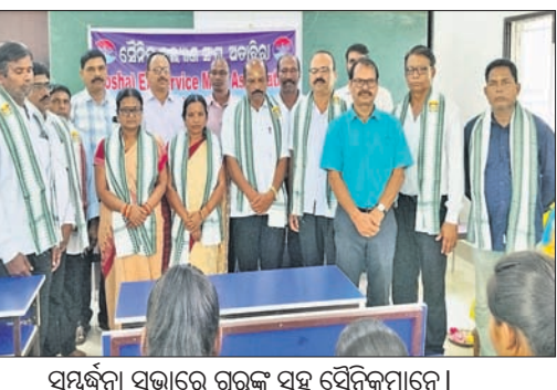
ସମର୍ଥନ ସଭାରେ ଗୁରୁଙ୍କୁ ସହ ସୈନିକମାନେ।