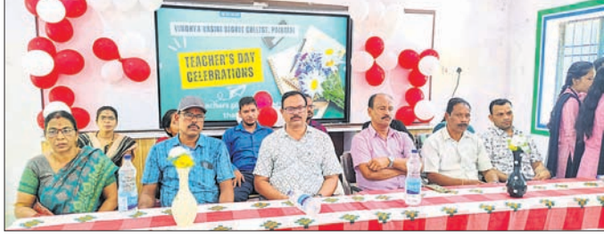
ପାଇକମାଳ ବିନ୍ୟାସନୀୟା ସ୍ୱାତନ୍ତ୍ର ମହାବିଦ୍ୟାଳୟରେ ମଞ୍ଚସ୍ଥାନ ଅଧ୍ୟାପିକା ଅଧ୍ୟାପକ(ବାମ)।