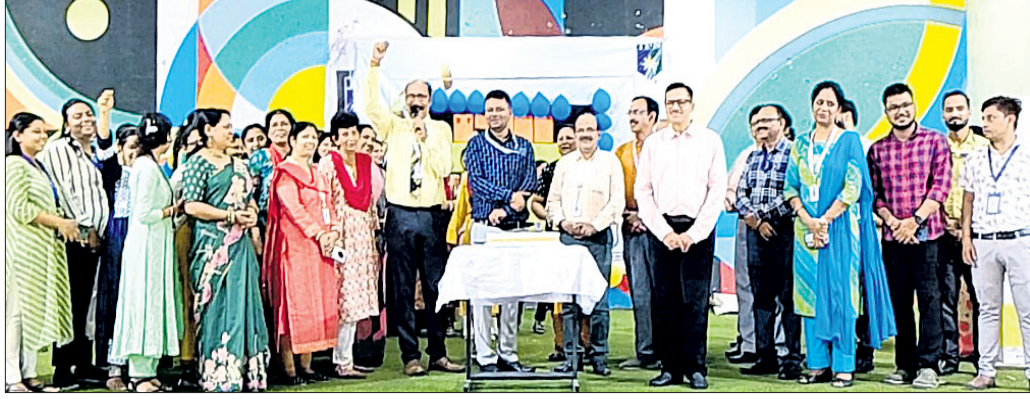
ଈତିହାସ ପଢ଼ିବା ସ୍ଥଳରେ ଗୁରୁ ପୂଜନ ଓ ଗୁରୁ ଦିବସ କାର୍ଯ୍ୟକ୍ରମରେ ଅତିଥି ଓ ଅନ୍ୟମାନେ ।