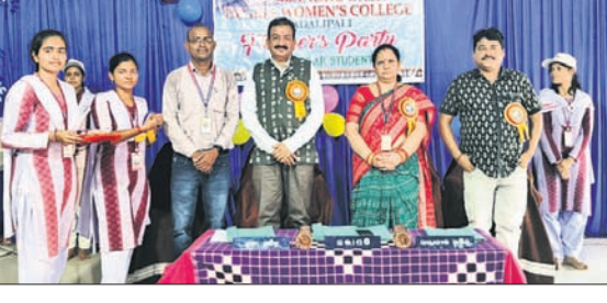
ପାଇକମାଳ ବିନ୍ୟାସନୀୟା ସ୍ୱାତନ୍ତ୍ର ମହାବିଦ୍ୟାଳୟରେ ମଞ୍ଚସ୍ଥାନ ଅଧ୍ୟାପିକା ଅଧ୍ୟାପକ(ବାମ)।