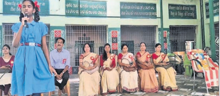
ରାଣାପ୍ରତାପ ସ୍କୁଲରେ ଗୁରୁ ଦିବସ ଉପରେ ବକ୍ତବ୍ୟ ରଖୁଛନ୍ତି