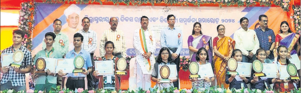
ଜିଲାପ୍ରଧାନ ଗୁରୁ ଦିବସ, ବିଦ୍ୟାର୍ଥୀ ସମର୍ପଣ ଯମରୋହରେ ଅତିଥିକ ଗହଣରେ କୃତା ଛାତ୍ରାଛାତ୍ରୀ