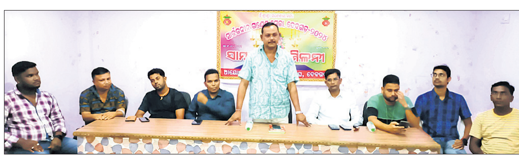
ଆୟୋଜିତ ଖବରଦାତା ସମ୍ମିଳନୀରେ କମିଟି ପକ୍ଷରୁ ପୂର୍ଣ୍ଣା ବିସ୍ତାରିତ।

ରାଜ୍ୟର ଅନ୍ୟତମ ପ୍ରସିଦ୍ଧ ଦେବଗଡ଼ ସାର୍ବଜନୀନ ଗଣେଶ ମେଳା ଚଳିତବର୍ଷ ୭୬ ବର୍ଷରେ ପର୍ବାର୍ପଣ କରୁଥିବା ବେଳେ ଏଥିପାଇଁ ସାର୍ବଜନୀନ ଗଣେଶ ମେଳା କମିଟି ତଥା ଆୟୋଜକ ବ୍ୟବସାୟୀ ଏବଂ ପକ୍ଷରୁ ପ୍ରସ୍ତୁତ ରୂପାୟନରେ ପହଞ୍ଚିଛି। ଏହି ମେଳା ଆୟୋଜନ ନିମନ୍ତେ ଚଳିତବର୍ଷ ୫୦ ଲକ୍ଷ ଟଙ୍କାର ବ୍ୟୟ ଅଟକଳ ପ୍ରସ୍ତୁତ କରାଯିବ। ଏହା ଅନ୍ୟତମ ଦେବଗଡ଼ ଚଳିତବର୍ଷ ଗଣେଶ ମେଳା ଉଦ୍ଦ୍ୟମ ପାଇଁ ପ୍ରସ୍ତୁତ ହେବାକୁ ପଡ଼ିବ।