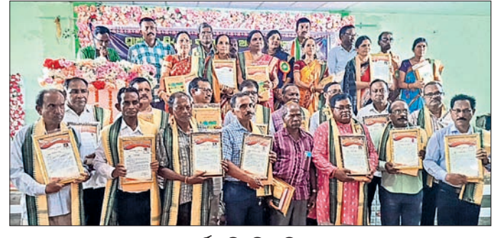
ସମର୍ପଣ କରୁଥିବା ଶିକ୍ଷକ