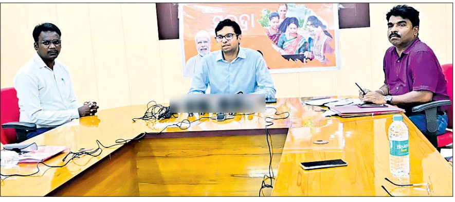
ଖବରଦାତା ସମ୍ମିଳନୀରେ ଜିଲାପାଳ ଏବଂ ଅନ୍ୟ ଅଧିକାରୀ

ବରଗଡ଼ ଜିଲ୍ଲାରେ ସୁଭଦ୍ରା ଯୋଜନା କାର୍ଯ୍ୟକାରୀ କରିବା ପାଇଁ ଜିଲାପାଳ ଏବଂ ଅନ୍ୟ ଅଧିକାରୀଙ୍କ ମଧ୍ୟରେ ଏକ ସମ୍ମିଳନୀ ଅନୁଷ୍ଠିତ ହୋଇଥିଲା।