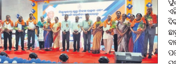
ଜିଲ୍ଲାସ୍ତରୀୟ କାର୍ଯ୍ୟକ୍ରମରେ ମହାସଭା ଅଭିଭାବନା ଅଧିକାରୀ ଉପସ୍ଥିତ।

ଦେବଗଡ଼ ମହାବିଦ୍ୟାଳୟ ବିଜୁ ପଟ୍ଟନାୟକଙ୍କ ଅଧିକାରୀମାନଙ୍କଦ୍ୱାରା ଜିଲ୍ଲା ଶିକ୍ଷା ବିଭାଗ ପକ୍ଷରୁ ଜିଲ୍ଲାସ୍ତରୀୟ ଗୁରୁତ୍ୱପୂର୍ଣ୍ଣ ବିଦ୍ୟାର୍ଥୀଙ୍କ ସମର୍ଥନା ସମାରୋହ ଅନୁଷ୍ଠିତ ହୋଇଛି। ଜିଲ୍ଲାପାଳ କବୀନ୍ଦ୍ର କୁମାର ସାହୁଙ୍କ ସଭାପତିତ୍ୱରେ ଆୟୋଜିତ ସଭାରେ ବରଷା ଅଭିଭାବନା ପ୍ରତିଷ୍ଠାପନ, ଜିଲ୍ଲାପାଳ ସାହୁଙ୍କ ଅଧିକାରୀମାନଙ୍କ ଉପସ୍ଥିତିରେ ଶିକ୍ଷା ବିଭାଗରେ କାର୍ଯ୍ୟକ୍ରମର ଆବଶ୍ୟକତା ଉପରେ ଆଲୋଚନା କରାଯାଇଥିଲା।