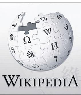
ଓଡ଼ିପେଡିଆ ପସରୁ ଆଇନଜୀବୀ ତିନି ଆକ୍ରମଣ କୋର୍ଟକୁ କହିଥିଲେ ଯେ, ଅପାଲଟଙ୍କ ନିର୍ଦ୍ଦେଶ ଉପରେ କେତେକ ତଥ୍ୟ ଉପସ୍ଥାପନ କରିବାକୁ ଥିବାରୁ ହାଇକୋର୍ଟ ଓଡ଼ିପେଡିଆର ଅଧିକ ଭାରତରେ ନାହିଁ।

ଓଡ଼ିପେଡିଆରେ ଅନେକ ଭୁଲ୍ ତଥ୍ୟ ପ୍ରକାଶ ପାଉଥିବା ନେଇ ଅଭିଯୋଗ ହେଉଥିବାବେଳେ ଭାରତରେ ଏହାର ବ୍ୟବସାୟ ବନ୍ଦ କରି ଦିଆଯିବ ବୋଲି ରୁଧିରାଜ ଦିଲ୍ଲୀ ହାଇକୋର୍ଟ ଚେତାବନୀ ଦେଇଛନ୍ତି।