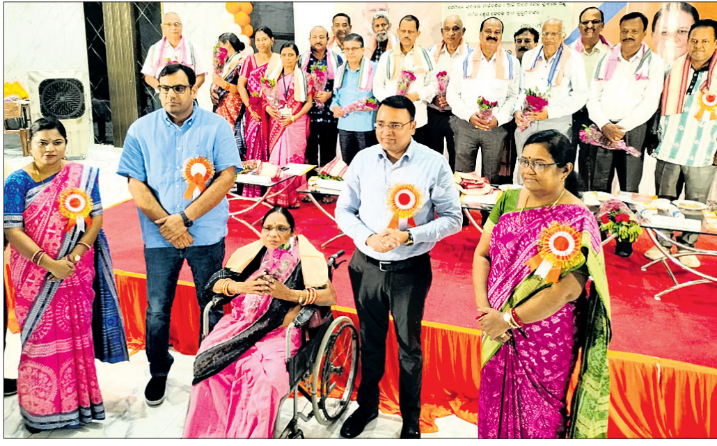
ଜିଲ୍ଲାପ୍ରଧାନ ଗୁରୁଦିବସ କାର୍ଯ୍ୟକ୍ରମରେ ଅତିଥିକ ସହ ସମ୍ବର୍ଦ୍ଧିତ ଶିକ୍ଷୟିତ୍ରୀ ଶିକ୍ଷକ ।

ଜିଲ୍ଲାପ୍ରଧାନ ଗୁରୁଦିବସ, ବିଦ୍ୟାର୍ଥୀ ସମ୍ବର୍ଦ୍ଧନା ସମାବେଶ