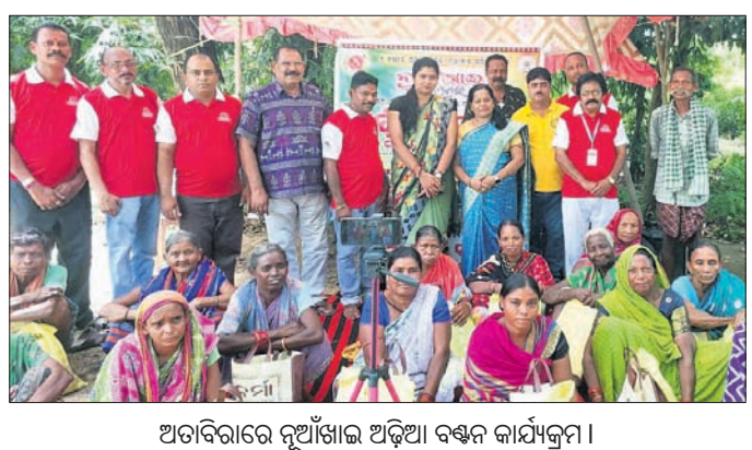
ଅତୀତକାଳରେ ନୂଆଁଖାଇ ଅଡ଼ିଆ ବନ୍ଧନ କାର୍ଯ୍ୟକ୍ରମ।