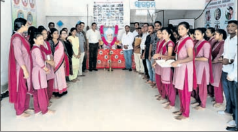
ପାଇକମାଳ ବିନ୍ୟାସନୀୟା ସ୍ୱାତନ୍ତ୍ର ମହାବିଦ୍ୟାଳୟରେ ମଞ୍ଚସ୍ଥାନ ଅଧ୍ୟାପିକା ଅଧ୍ୟାପକ(ବାମ)।