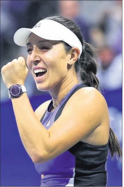
ବିଜୟ ପରେ ଉଲ୍ଲାସିତ ଜେସିକା ପେଗୁଲା।

ଜେସିକା ପେଗୁଲା ଉଗାଣ୍ଡା ଅଲିମ୍ପିଆନଙ୍କ ମୃତ୍ୟୁ ଘଟଣାରେ ପ୍ରାଣ ହରାଇଛନ୍ତି। ରବିବାର ୩୩ ବର୍ଷୀୟା ଉଗାଣ୍ଡା ଚାକ୍ ପ୍ରେମିକ ନିଆଁ ଲଗାଇ ଦେଇଥିଲେ। ତାଙ୍କ ଶରୀର ୮୦ ପ୍ରତିଶତ ଜଳ ଯାଇଥିବା ବେଳେ ଚିକିତ୍ସାରେ ତାଙ୍କୁ ହସ୍ପିଟାଲରେ ଭର୍ତ୍ତି କରାଯାଇଥିଲା। ଗୁରୁବାର ତାଙ୍କର ବିଚାରଣା କରାଯାଇଛି। ଉଲ୍ଲାଖଯୋଗ୍ୟ ଯେ, ପୁରୋଭା ୨୦୨୩ରେ ଫ୍ରେଞ୍ଚିସ୍ ଓପନରେ ରନର ଅପ୍ ରହିଥିଲେ। ମହିଳା ସିଙ୍ଗଲ୍ ଅନ୍ୟ ସେମିଫାଇନାଲଟି