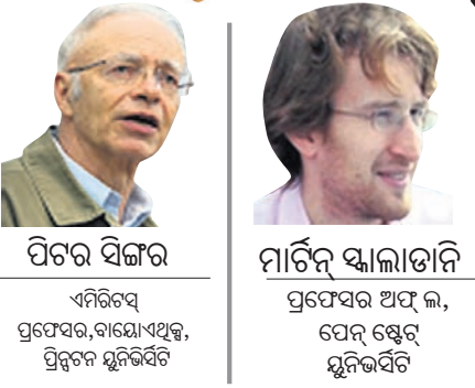
ପିଟର ସିଙ୍ଗର ଏମିରିସ୍ ପ୍ରଫେସର, ବାୟୋଏଥିକ୍ସ, ପ୍ରତ୍ୟକ୍ଷ ଉପାଦେୟ

ଜୀବନର ପ୍ରଥମ ପଦକ୍ଷେପ ଗ୍ରହଣ କରିବା ପରେ ଉପରେ ପଡ଼ିଥିବା ପ୍ରତିଭାକୁ ପ୍ରତିଫଳିତ କରିବା ପାଇଁ ପ୍ରତିଯୋଗିତାରେ ବାଧ୍ୟ ହୁଏ। ସେମାନେ ପ୍ରତିଭାକୁ ପ୍ରତିଫଳିତ କରିବା ପାଇଁ ପ୍ରତିଯୋଗିତାରେ ବାଧ୍ୟ ହୁଏ। ସେମାନେ ପ୍ରତିଭାକୁ ପ୍ରତିଫଳିତ କରିବା ପାଇଁ ପ୍ରତିଯୋଗିତାରେ ବାଧ୍ୟ ହୁଏ। ସେମାନେ ପ୍ରତିଭାକୁ ପ୍ରତିଫଳିତ କରିବା ପାଇଁ ପ୍ରତିଯୋଗିତାରେ ବାଧ୍ୟ ହୁଏ।