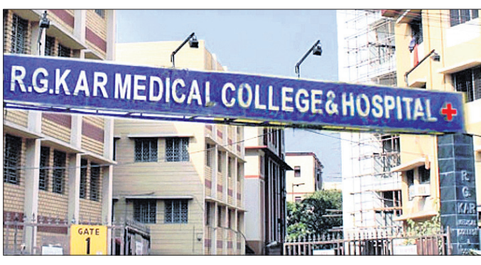
ବିରୋଧରେ ଅନେକ ସଜ୍ଜିନ ଅଭିଯୋଗ ଆଣିଛନ୍ତି।

ଆର୍.ଜି. କର ମେଡିକାଲ କଲେଜ ଆଣ୍ଡ ହସ୍ପିଟାଲରେ ବଳାଙ୍ଗୀର ଓ ହତ୍ୟାର ଶିକାର ହୋଇଥିବା ପିଠି ଛାତ୍ରୀଙ୍କ ବାପା କୋଲକାତା ପୋଲିସ୍ ବିରୋଧରେ ସାଂଘାତିକ ଅଭିଯୋଗ ଆଣିଛନ୍ତି।