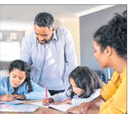
ପଢ଼ିବା ପାଇଁ ପ୍ରତିଯୋଗିତାରେ ବାଧ୍ୟ ହୁଏ। ସେମାନେ ପ୍ରତିଭାକୁ ପ୍ରତିଫଳିତ କରିବା ପାଇଁ ପ୍ରତିଯୋଗିତାରେ ବାଧ୍ୟ ହୁଏ।

ସନ୍ତାନ ସତତକୁ ଘରେ ଯେତେ ସମୟ ରହୁଛନ୍ତି ନିଜ ନଜରରେ ରଖିବା ସହିତ କର୍ମସୂଚକ ମଧ୍ୟ ତାଙ୍କୁ ଧରି ଯାଇପାରିବେ। ଆଜିକାଲି ଆମେ ଦେଖୁଛୁ ବହୁତ କମ୍ ବୟସର ଶିଶୁ ଚେଲିଭିଜନ ବା ସ୍ଥୂଳବରେ ବହୁତ କଠିନ ଶ୍ଳୋକ ଭଳି ଜିନିଷ ମୁଖ୍ୟ କରି ଶୁଣାଉଛନ୍ତି। ଏଥିରୁ ଜଣାପଡ଼ୁଛି ଯେ ମାଆବାପା ନିଶ୍ଚିତ ରୂପେ ଶିଶୁକୁ ତାହା ଅଭିଯାନ କରିବାରେ ସାହାଯ୍ୟ କରିଥିବେ। ତା' ହେଲେ ମାଆବାପା ଯଦି ଚାହଁବେ ଶିଶୁଙ୍କୁ ଅକ୍ଷର ଶିଖିବା, ବହି ପଢ଼ି ଶିଖିବା, ଯୋଗ, ବିଭାଗ ଭଳି କାର୍ଯ୍ୟ କରିବାକୁ ଅନୁରୋଧ କରନ୍ତୁ। ତାହା ହେଲେ କିଛି ସମୟରେ ମାଆବାପା ସେତେ ମାତ୍ରାରେ ଶିକ୍ଷିତ ହୁଅନ୍ତି ବା ତାଙ୍କ ପାଖରେ ସେତେ