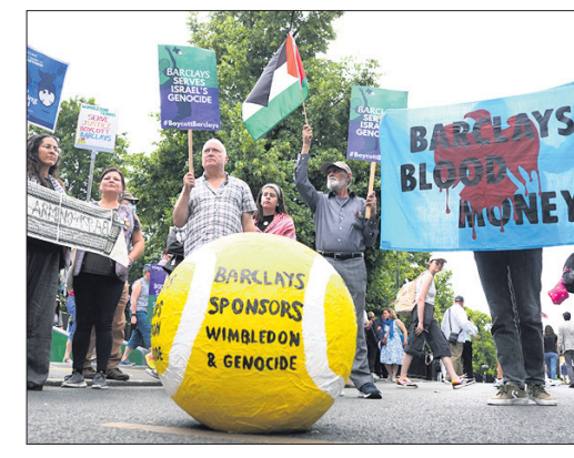
ପ୍ରତିଯୋଗିତାରେ ବାଧ୍ୟ ହୁଏ। ସେମାନେ ପ୍ରତିଭାକୁ ପ୍ରତିଫଳିତ କରିବା ପାଇଁ ପ୍ରତିଯୋଗିତାରେ ବାଧ୍ୟ ହୁଏ।

ପୃଥିବୀର ଉତ୍ତମ ଓଷଧି ଆନ୍ତର୍ଜାତୀୟ ପ୍ରତିଯୋଗିତାରେ ବାଧ୍ୟ ହୁଏ। ସେମାନେ ପ୍ରତିଭାକୁ ପ୍ରତିଫଳିତ କରିବା ପାଇଁ ପ୍ରତିଯୋଗିତାରେ ବାଧ୍ୟ ହୁଏ। ସେମାନେ ପ୍ରତିଭାକୁ ପ୍ରତିଫଳିତ କରିବା ପାଇଁ ପ୍ରତିଯୋଗିତାରେ ବାଧ୍ୟ ହୁଏ। ସେମାନେ ପ୍ରତିଭାକୁ ପ୍ରତିଫଳିତ କରିବା ପାଇଁ ପ୍ରତିଯୋଗିତାରେ ବାଧ୍ୟ ହୁଏ।