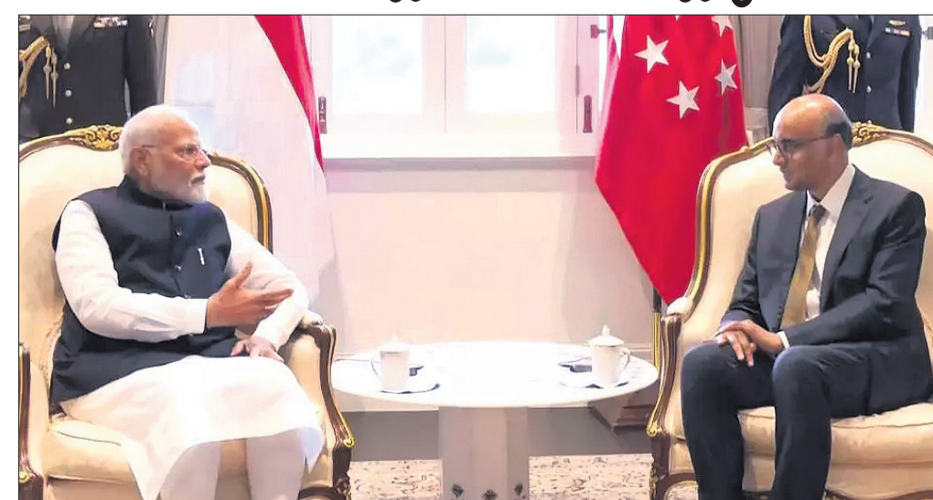
ସିଙ୍ଗାପୁର ରାଷ୍ଟ୍ରପତି ଥର୍ମାନ ଶନମୁଗରାଜ୍‌ଙ୍କ ସହ ପ୍ରଧାନମନ୍ତ୍ରୀ ନରେନ୍ଦ୍ର ମୋଦି ଦ୍ୱିପାକ୍ଷିକ ଆଲୋଚନା କରୁଛନ୍ତି।

ସିଙ୍ଗାପୁର, ୫୯ (ପି.ଟି.) ପ୍ରଧାନମନ୍ତ୍ରୀ ନରେନ୍ଦ୍ର ମୋଦି ଗୁରୁବାର ସିଙ୍ଗାପୁର ରାଷ୍ଟ୍ରପତି ଥର୍ମାନ ଶନମୁଗରାଜ୍‌ଙ୍କୁ ସାକ୍ଷାତ୍‌କରି ଦ୍ୱିପାକ୍ଷିକ ସମ୍ପର୍କ ବୃଦ୍ଧି ନେଇ ଆଲୋଚନା କରିଛନ୍ତି।