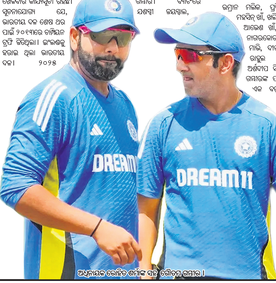
ଅଧିନାୟକ ରୋହିତ ଶର୍ମାଙ୍କ ସହ ଗୌତମ ଗମ୍ଭୀର।

ପୀର୍ ୧୧ବର୍ଷ ପରେ କ୍ରିକେଟର ୩ଟି ଫର୍ମାଟ୍‌ରେ ସଫଳ ଅଧିନାୟକ ରୋହିତ ଶର୍ମାଙ୍କ ନେତୃତ୍ୱରେ ଡିଏମ୍ ବିଶ୍ୱକପ ଜିତିବା ଭାରତୀୟ ଦଳ। ଦୀର୍ଘ ଦିନର ସ୍ୱପ୍ନ ସାଥିକ ହେଲା। ଏଥି ମଧ୍ୟରେ ଭାରତୀୟ ଦଳର ମୁଖ୍ୟ କୋଚ୍ ଦାୟିତ୍ୱ ଭାରତୀୟ ଦଳର ପୂର୍ବତନ ଓପନର ଗୌତମ ଗମ୍ଭୀରଙ୍କ ଉପରେ ନ୍ୟସ୍ତ କରିଛି ଭାରତୀୟ କ୍ରିକେଟ କଣ୍ଟ୍ରୋଲ ବୋର୍ଡ। ମୁଖ୍ୟ କୋଚ୍ ରେସ୍‌ଭେ କେତେଜଣ ବିଦେଶୀ ଖେଳାଳି ରହିଥିଲେ ମଧ୍ୟ ସମସ୍ତଙ୍କୁ ପଛରେ ପକାଇ ଅନେକ ସର୍ତ୍ତ ସହ ଭାରତୀୟ ଦଳର ମଙ୍ଗ ଚାଲିଛନ୍ତି ଗମ୍ଭୀର। ମୁଖ୍ୟକୋଚ୍ ରୂପେ ୨୦୨୭ ଡିସେମ୍ବର ପର୍ଯ୍ୟନ୍ତ ତାଙ୍କର କାର୍ଯ୍ୟକାଳ ରହିବ। ଶ୍ରୀଲଙ୍କା ବିପକ୍ଷ ଡିଏମ୍ ଓ ଏକଦିବସୀୟ ସିରିଜର ସେ କାର୍ଯ୍ୟ ଆରମ୍ଭ କରିଥିଲେ ଏବଂ ଏହି ସିରିଜ ସେତେତା ଭଲ ଅନୁଭୂତି ଦେଇନାହିଁ। ଯଦିଓ ଭାରତୀୟ ଯୁବ ଦଳ ଡିଏମ୍ ସିରିଜକୁ କ୍ରିକ୍ ସୁଇଚ୍ କରିଛନ୍ତି ମାତ୍ର ଦୀର୍ଘ ୨୭ ବର୍ଷ ପରେ ଖରାପ ଫର୍ମରେ ଥିବା ଶ୍ରୀଲଙ୍କା ଦଳ ଏକଦିବସୀୟ ସିରିଜକୁ ୨-୦ରେ ଜିତିଛି। ରୋହିତ ଶର୍ମା ଓ ବିରାଟ କୋହଲିଙ୍କ ପରି ଅଭିଜ୍ଞ ଖେଳାଳି ଏହି ସିରିଜ ଖେଳିଥିଲେ ମଧ୍ୟ ବୋଲିଂରେ ଯଶସ୍ୱାତ୍ ରୁମରା ଓ ମହମ୍ମଦ ସାମିଙ୍କ ପରି ଅଭିଜ୍ଞ ପେସ୍ ବୋଲରଙ୍କ ଅଭାବ ପରିଲକ୍ଷିତ ହୋଇଥିଲା। ଆଗକୁ ଭାରତକୁ କେତେଗୁଡ଼ିଏ ଚୁକ୍ତିପୂର୍ଣ୍ଣ ଚୁକ୍ତିନାମା ଓ ଦ୍ୱିପାକ୍ଷିକ ସିରିଜ ଖେଳିବାକୁ ଅଛି। ଚାମ୍ପିୟନ୍ ଟ୍ରଫି, ବିଶ୍ୱଚେଷ୍ଟ ଚାମ୍ପିୟନଶିପ୍, ଏସିଆ କପ, ବାଂଲାଦେଶ ବିପକ୍ଷରେ ୨ ଚେଷ୍ଟ ଓ ୩ଟି ଡିଏମ୍, ଯରୋଇ ମାଟିରେ ଶକ୍ତିଶାଳୀ ନ୍ୟୁଜିଲାଣ୍ଡ ବିପକ୍ଷରେ ୩ ଚେଷ୍ଟ, ଦକ୍ଷିଣ ଆଫ୍ରିକା ସହିତ ୪ଟି ଡିଏମ୍ ଓ ବିଶ୍ୱଚେଷ୍ଟ ଚାମ୍ପିୟନ ଅଷ୍ଟ୍ରେଲିଆ ସହିତ ବର୍ତ୍ତମାନ-ଗାଭାୟର ଟ୍ରଫିରେ ୫ ଚେଷ୍ଟ ଖେଳିବ ଟିମ୍ ଇଣ୍ଡିଆ। ତା'ପରେ ଯରୋଇ ମାଟିରେ