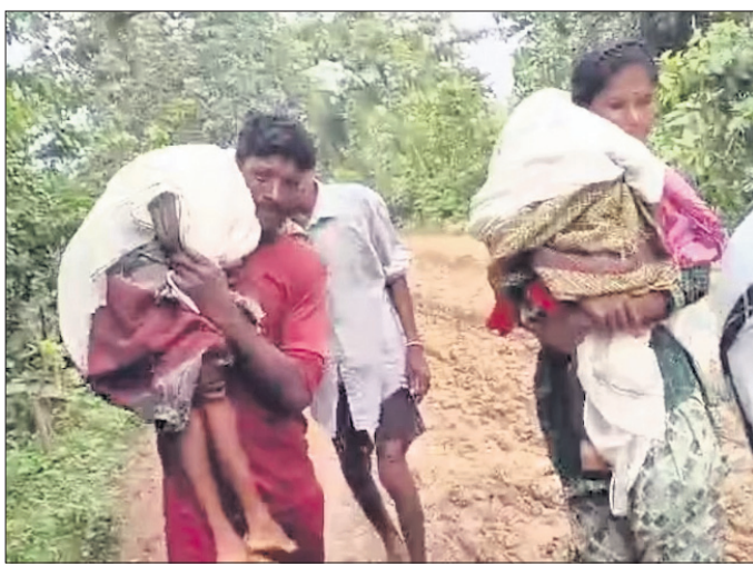
କାନ୍ସୁ ରାସ୍ତାରେ ଚାଲିଚାଲି ଜଳାଗଣା ହସ୍ପିଟାଲରେ ପହଞ୍ଚିଥିଲେ।

ମହାରାଷ୍ଟ୍ରର ଗଡ଼ଚିରୋଲି ଜିଲ୍ଲା ଅହେରି ତହସିଲ ପରିଗାଠି ଗ୍ରାମରେ ଏକ ଅଭାବନୀୟ ଘଟଣା ଦେଖିବାକୁ ମିଳିଛି। ଆୟୁଲ୍ୟାନ୍ ଓ ଯାତାୟାତ ବୁକିଂ ଠିକ୍ ନ ଥିବାରୁ ୨ ଶିଶୁଙ୍କର ଠିକ୍ ସମୟରେ ଚିକିତ୍ସା ହୋଇ ନ ପାରିବାରୁ ସେମାନଙ୍କର ମୃତ୍ୟୁ ଘଟିଛି।