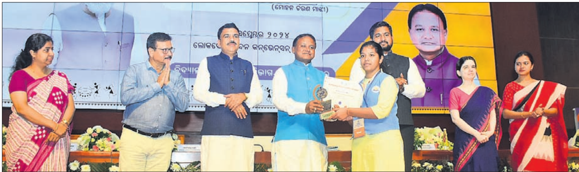
ରାଜ୍ୟସ୍ତରୀୟ ଗୁରୁଦିବସ ଉତ୍ସବରେ ଜଣେ କୁଟା ଛାତ୍ରୀଙ୍କୁ ମୁଖ୍ୟମନ୍ତ୍ରୀ ମୋହନ ଚରଣ ମାଝୀ ପୁରସ୍କୃତ କରୁଛନ୍ତି।