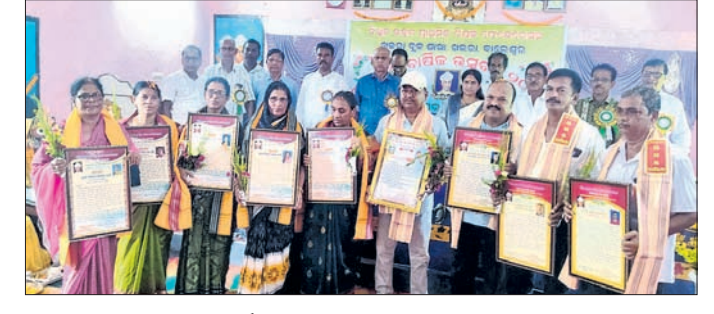
ଅତିଥିମାନଙ୍କ ଗହଣରେ ସମର୍ଦ୍ଧିତ ଅବସରପ୍ରାପ୍ତ ଶିକ୍ଷୟିତ୍ରୀଶିକ୍ଷକ ।