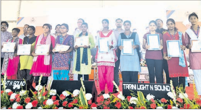
ପୁରସ୍କାର ସହ କୃତୀ ଛାତ୍ରାଛାତ୍ରୀମାନେ।

ବରିପଦା ଚକଟପୁରଠାରେ ଜିଲ୍ଲାସ୍ତରୀୟ ଗୁରୁ ଦିବସ, ବିଦ୍ୟାର୍ଥୀ ସମର୍ଦ୍ଧନା ସମାରୋହ-୨୦୨୪ ଓ ମୁଖ୍ୟମନ୍ତ୍ରୀ ଶିକ୍ଷା ପୁରସ୍କାର ପ୍ରଦାନ ଉତ୍ସବ ଅନୁଷ୍ଠିତ ହୋଇଯାଇଛି। ଏଥିରେ ସମଗ୍ର ଜିଲାର ବିଭିନ୍ନ ବିଭାଗରୁ ସମୁଦାୟ ୨୮୮୭ ଜଣ କୃତୀ ଛାତ୍ରାଛାତ୍ରୀଙ୍କୁ ପୁରସ୍କାର ଦିତରଣ କରାଯାଇଥିଲା। ପ୍ରତ୍ୟେକ ବ୍ଲକ ତରଫରୁ ୧୦୦ ଜଣ ଲେଖାଏଁ, ଜିଲ୍ଲାସ୍ତରୀୟ ଶିକ୍ଷା ବୃତ୍ତିରେ ୨୩୩ ଜଣ, ଜିଲ୍ଲା ଉପାଧିକାରୀଙ୍କୁ ପୁରସ୍କାର ୫୫୦ ଜଣ ଓ ଜିଲ୍ଲା ଉପାଧିକାରୀଙ୍କୁ ପୁରସ୍କାର ୩୮ ଜଣ ପାଇଥିଲେ। ଅତିରିକ୍ତ ଜିଲ୍ଲାପାଳ ନେତ୍ରାଂଜନ ମଲିକଙ୍କ ସଭାପତିତ୍ଵରେ ସଭା ସଭିଏର ଯୋଗ୍ୟତା ନାହିଁ ବୋଲି କହିବାକୁ ମୁହଁଟକି ହୋଇଥିଲା ବୋଲି କହିଛନ୍ତି।