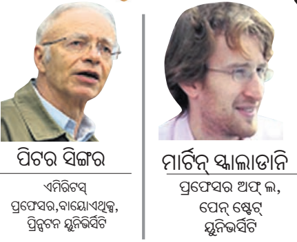
ପିଟର ସିଙ୍ଗର ଏମିରିକନ୍ ପ୍ରଫେସର, ବାୟୋଏଥିକ୍ସ, ପ୍ରତ୍ୟକ୍ଷ ଉପାଦାନ

ଜୀବନୀୟ ପ୍ରଦର୍ଶନକାରୀମାନେ ଓଡ଼ିଆରେ ଚେତନା ପ୍ରତିଯୋଗିତାରେ ବାଧ୍ୟ ସୃଷ୍ଟି କରିଥିଲେ । ସେମାନେ ପ୍ରସିଦ୍ଧ ଚିତ୍ରକଳାକୁ ସୁରକ୍ଷା ଦେଉଥିବା ଗ୍ରାମ୍ୟ ଉପରକୁ ଚଳାନ୍ତେ ସର୍ବ ପକାଇଥିଲେ । ଏହାସହ ପୁରାତନ ଶିଳା ସ୍ମାରକ ଉପରେ କମଳା ପାଉଡର ଛେଦନିବା ସହ ରାସ୍ତା ଅବରୋଧ କରିଥିଲେ । ଏହାର ପ୍ରତିକ୍ରିୟା ସ୍ୱରୂପ, ଯୁରୋପୀୟ ସରକାରମାନେ ପରିବେଶ ବିକ୍ଷୋଭକାରୀଙ୍କ ପ୍ରତି କଠୋର ପଦକ୍ଷେପ ଗ୍ରହଣକରି ସେମାନଙ୍କୁ ଅଟକ ରଖିବା ସହ କ୍ରିମିନା ଆଦାୟ କରୁଛନ୍ତି । ଏପରିକି ଏକ ଫୋନ୍, ଅତି ଓ ତଥା ଭିତ୍ତି ଯୋଗାଯୋଗ ପ୍ଲାଟଫର୍ମରେ ଆଇନ ଅମାନ୍ୟ ଯୋଗୁ ଗୋଟିଏ ମାମଲାରେ ୫ବର୍ଷ କେଲ ଦଣ୍ଡଦେଶ ଶୁଣାଇଛନ୍ତି । ଏକ ନୈତିକ ପ୍ରତିବାଦ ଓ ଆଇନଗତ ପ୍ରତିବାଦ ଭିନ୍ନ ବିଷୟ । ଇଲ୍ୟାକ୍ସର ଟ୍ରିପଲ୍ ହାମ୍ପଟର ଏକ କେଲକୁ ମାର୍ଟିନ ଲୁଥର କିଙ୍ଗ୍ ଜୁନିୟର ଦେଇଥିବା ଚାଲି ଚିଠିରେ ଯୁକ୍ତି ଦର୍ଶାଇଥିଲେ ଯେ, ଆଇନ ଅମାନ୍ୟରେ କଠିର ପ୍ରତିବାଦକାରୀମାନେ ଅହିଂସାମୂଳକ ଆଚରଣ ପ୍ରଦର୍ଶନ କଲେ ମଧ୍ୟ ସେମାନଙ୍କର ଆଇନ ପ୍ରତି ସମ୍ମାନ ଥାଏ ଏବଂ ଆଇନର ଦଣ୍ଡାଦେଶକୁ ଗ୍ରହଣ କରିଥାନ୍ତି । ଏହା ଗ୍ରହଣୀୟ ଯେ, ଏକ ନୈତିକ ପ୍ରତିବାଦରେ ଅହିଂସା ଏକ ଗୁରୁତ୍ୱପୂର୍ଣ୍ଣ ବିଷୟ । ଯେଉଁମାନେ ଗଣତନ୍ତ୍ରରେ ରହୁଛନ୍ତି ସେମାନେ ଅହିଂସାମୂଳକ ରାଜନୈତିକ କାର୍ଯ୍ୟକଳାପ ପାଇଁ ଥିବା ଅତ୍ୟଧିକ ଦଣ୍ଡକୁ ସୁରକ୍ଷା ସକାଶେ ଆଇନଗତ ଦଣ୍ଡକୁ ଗ୍ରହଣ କରିବାକୁ ଇଚ୍ଛୁକ ହେବା ଉଚିତ । କିନ୍ତୁ ଅତ୍ୟଧିକ ଦଣ୍ଡ କହିଲେ, ସମସ୍ୟା ସୃଷ୍ଟି କରୁଥିବା ପ୍ରତିବାଦକାରୀମାନେ ଜନସାଧାରଣଙ୍କୁ କେତେ ଅସୁବିଧାରେ ପକାଇପାରନ୍ତି ତାହା ଉପରେ ନିର୍ଭରକରେ । ଅନ୍ତର୍ଜାତୀୟ ସ୍ତରରେ ସାଫ୍ଟିପ୍ରାପ୍ତ ହେବା ପ୍ରତିପୁଲ ଅଫ୍ ପ୍ରପର୍ସନାଲିଟି ବା ଆତ୍ମପାତିକତାର ନୀତି (ଅର୍ଥାତ୍ ମୁକ୍ତରେ ସମାପ୍ୟ ଲାଭ ପାଇଁ ଅଧିକ ନାଗରିକଙ୍କ