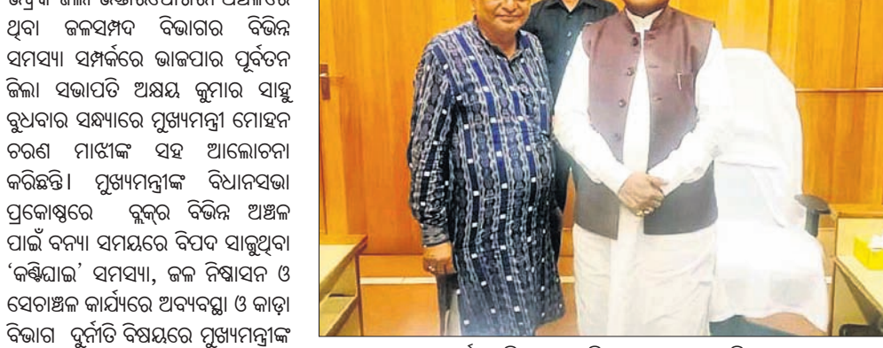
ମୁଖ୍ୟମନ୍ତ୍ରୀଙ୍କ ସହ ପୂର୍ବତନ ଜିଲ୍ଲା ସଭାପତି ଆଲୋଚନା କରୁଛନ୍ତି।

ଭଦ୍ରକ ଜିଲ୍ଲା ଉଦ୍ଘାଟନା କରାଯାଇଥିବା ଉପକ୍ରମ ଉପରେ ନିର୍ବାଚନ ଅନୁଯାୟୀ ନେଇ ରୁକ୍ମିଣୀ ମାମଲାରୁ ବିଧାୟକ ସଞ୍ଚାଳନା ପାଇଁ ନୋଟିସ୍ କରାଯାଇଛି।