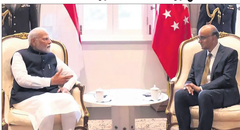
ସିଙ୍ଗାପୁର ରାଷ୍ଟ୍ରପତି ଥର୍ମାନ ଶନମୁଗରାଜ୍‌ଙ୍କ ସହ ପ୍ରଧାନମନ୍ତ୍ରୀ ନରେନ୍ଦ୍ର ମୋଦି ଦ୍ୱିପାକ୍ଷିକ ଆଲୋଚନା କରୁଛନ୍ତି।

ସିଙ୍ଗାପୁର, ୫୧୯ (ପି.ଟି.) ପ୍ରଧାନମନ୍ତ୍ରୀ ନରେନ୍ଦ୍ର ମୋଦି ଗୁରୁବାର ସିଙ୍ଗାପୁର ରାଷ୍ଟ୍ରପତି ଥର୍ମାନ ଶନମୁଗରାଜ୍‌ଙ୍କୁ ସାକ୍ଷାତ୍‌କରି ଦ୍ୱିପାକ୍ଷିକ ସମ୍ପର୍କ ବୃଦ୍ଧି ନେଇ ଆଲୋଚନା କରିଛନ୍ତି।