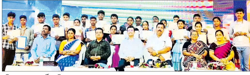
ଅତିଥିକ ଗହଣରେ ସମର୍ଦ୍ଧିତ ପ୍ରତିଭା ।