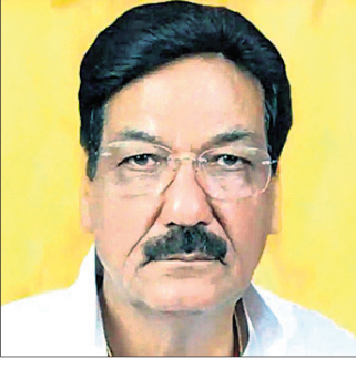
ରଞ୍ଜିତ ସିଂହ ଚୌତାଲା