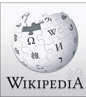
ଓଡ଼ିପେଡିଆ ପସରୁ ଆଇନଜୀବୀ ତିନି ଆକ୍ରମଣ କୋର୍ଟକୁ କହିଥିଲେ ଯେ, ଅପାଲଟଙ୍କ ନିର୍ଦ୍ଦେଶ ଉପରେ କେତେକ ତଥ୍ୟ ଉପସ୍ଥାପନ କରିବାକୁ ଥିବାରୁ ହାଇକୋର୍ଟ ଓଡ଼ିପେଡିଆର ଅଧିକ ଭାରତରେ ନାହିଁ।

ଓଡ଼ିପେଡିଆରେ ଅନେକ ଭୁଲ୍ ତଥ୍ୟ ପ୍ରକାଶ ପାଉଥିବା ନେଇ ଅଭିଯୋଗ ହେଉଥିବାବେଳେ ଭାରତରେ ଏହାର ବ୍ୟବସାୟ ବନ୍ଦ କରି ଦିଆଯିବ ବୋଲି ରୁଧିରାଜ ଦିଲ୍ଲୀ ହାଇକୋର୍ଟ ଚେତାବନୀ ଦେଇଛନ୍ତି।