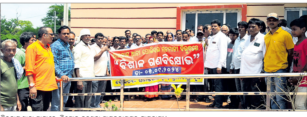
ପରହାଟ ଆନା ସାମ୍ବଲ କରୁଥିବା ସାମାଜିକ ସେବା ସମାଜର ଗ୍ରାମବାସୀ।

ଭଦ୍ରକ ଜିଲ୍ଲା ଉଦ୍ଘାଟନା କରାଯାଇଥିବା ଉପକ୍ରମ ଉପରେ ନିର୍ବାଚନ ଅନୁଯାୟୀ ନେଇ ରୁକ୍ମିଣୀ ମାମଲାରୁ ବିଧାୟକ ସଞ୍ଚାଳନା ପାଇଁ ନୋଟିସ୍ କରାଯାଇଛି।