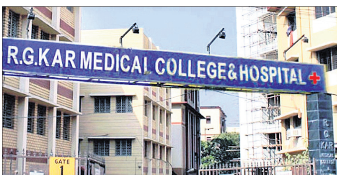
ବିରୋଧରେ ଅନେକ ସଜ୍ଜିନ ଅଭିଯୋଗ ଆଣିଛନ୍ତି।

ଆର୍.ଜି. କର ମେଡିକାଲ କଲେଜ ଆଣ୍ଡ ହସ୍ପିଟାଲରେ ବଳାଙ୍ଗୀର ଓ ହତ୍ୟାର ଶିକାର ହୋଇଥିବା ପିଠି ଛାତ୍ରୀଙ୍କ ବାପା କୋଲକାତା ପୋଲିସ୍ ବିରୋଧରେ ସାଂଘାତିକ ଅଭିଯୋଗ ଆଣିଛନ୍ତି।