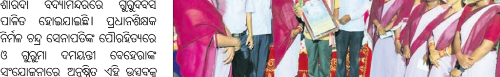
ଶିକ୍ଷକଙ୍କୁ ସମ୍ମାନ କରାଯାଇଛି।

ଭଦ୍ରକ ଜିଲ୍ଲା ଉଦ୍ଘାଟନା କରାଯାଇଥିବା ଉପକ୍ରମ ଉପରେ ନିର୍ବାଚନ ଅନୁଯାୟୀ ନେଇ ରୁକ୍ମିଣୀ ମାମଲାରୁ ବିଧାୟକ ସଞ୍ଚାଳନା ପାଇଁ ନୋଟିସ୍ କରାଯାଇଛି।