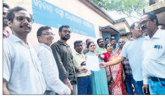
ଜିଲ୍ଲା ମହ୍ୟ ଅଧିକାରୀଙ୍କ କାର୍ଯ୍ୟାଳୟ କର୍ମଚାରୀଙ୍କ ପକ୍ଷରୁ ଜନ ପ୍ରତିନିଧିମାନଙ୍କୁ ଲିଖିତ ପ୍ରତିଶ୍ରୁତି ପ୍ରଦାନ କରାଯାଇଛି।

ସରକାରୀ କାର୍ଯ୍ୟାଳୟ ଅନ୍ୟତ୍ର ସ୍ଥାନାନ୍ତର ଉଦ୍ଦେଶ୍ୟ ରିଭୋଧ