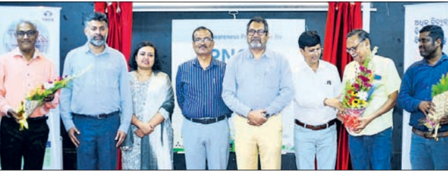
ଉଦ୍‌ଘାଟନା ଉପରେ ଚିପିଏନ୍‌ଡିଏଲର ଅଧିକାରୀଙ୍କ । ବାଲକେଶ୍ୱର, ୫୧୯(ବାଞ୍ଛାନିଧି ଦେ)

ଗିରି ସ୍ମାରକ ଭାଷଣ ଓ ଅତିଥି ପରିଚୟ ପ୍ରଦାନ କରିଥିଲେ । ଏହି ଅବସରରେ ଜିଲାସ୍ତରୀୟ ଏକାଡେମିକ ବର୍ଷରେ ୧୮୭, ୫୫ରୁକ୍ତରାୟ ବର୍ଷରେ ୧୨୨୪ ଏବଂ ପୁଣ୍ୟାମୁଖା ଭାଷାଦ୍ୱାରା ବର୍ଷରେ ୨୭ ଜଣ ଛାତ୍ରାଛାତ୍ର ଓ ଶିକ୍ଷୟିତ୍ରୀଶିକ୍ଷକ ସମର୍ଦ୍ଧିତ ହୋଇଥିଲେ । ପୁଣ୍ୟାମୁଖା ମୋହନଚରଣ ନାଟି ପ୍ରତି ଜିଲାରେ ହେଉଥିବା ଏହି ସମାରୋହକୁ ଆଭାସୀ ମାଧ୍ୟମରେ ଭୁବନେଶ୍ୱରରୁ ଲୋକସେବା ଭବନରୁ ଛାତ୍ରାଛାତ୍ରଙ୍କୁ ଉଦ୍ଦେଶ୍ୟରେ ଉଦ୍‌ବୋଧନ ଦେଇଥିଲେ । ଶେଷରେ ସାଂସ୍କୃତିକ କାର୍ଯ୍ୟକ୍ରମ ପରିବେଷଣ ହୋଇଥିଲା ।