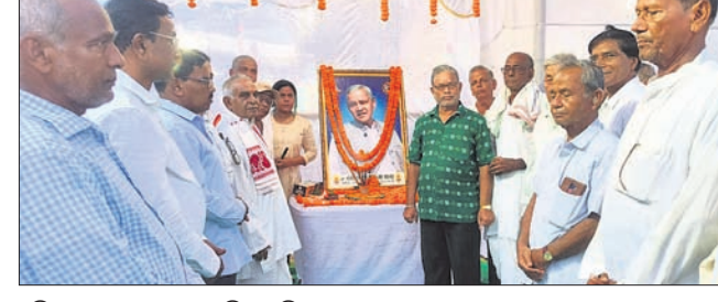
ସ୍ମୃତି ତାରଣ ସଭାରେ ଉପସ୍ଥିତ ଅତିଥିମାନେ।

ଭଦ୍ରକ ଜିଲ୍ଲା ଉଦ୍ଘାଟନା କରାଯାଇଥିବା ଉପକ୍ରମ ଉପରେ ନିର୍ବାଚନ ଅନୁଯାୟୀ ନେଇ ରୁକ୍ମିଣୀ ମାମଲାରୁ ବିଧାୟକ ସଞ୍ଚାଳନା ପାଇଁ ନୋଟିସ୍ କରାଯାଇଛି।