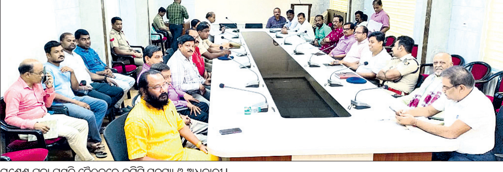
ଗଣେଶ ପୂଜା ପ୍ରସ୍ତୁତି ବୈଠକରେ କର୍ମିତ ସଦସ୍ୟ ଓ ଅଧିକାରୀ।

ଭଦ୍ରକ ଜିଲ୍ଲା ଉଦ୍ଘାଟନା କରାଯାଇଥିବା ଉପକ୍ରମ ଉପରେ ନିର୍ବାଚନ ଅନୁଯାୟୀ ନେଇ ରୁକ୍ମିଣୀ ମାମଲାରୁ ବିଧାୟକ ସଞ୍ଚାଳନା ପାଇଁ ନୋଟିସ୍ କରାଯାଇଛି।