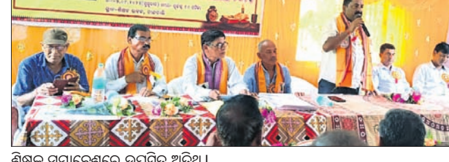
ଶିକ୍ଷକ ସମାବେଶରେ ଉପସ୍ଥିତ ଅତିଥି।

ଭଦ୍ରକ ଜିଲ୍ଲା ଉଦ୍ଘାଟନା କରାଯାଇଥିବା ଉପକ୍ରମ ଉପରେ ନିର୍ବାଚନ ଅନୁଯାୟୀ ନେଇ ରୁକ୍ମିଣୀ ମାମଲାରୁ ବିଧାୟକ ସଞ୍ଚାଳନା ପାଇଁ ନୋଟିସ୍ କରାଯାଇଛି।