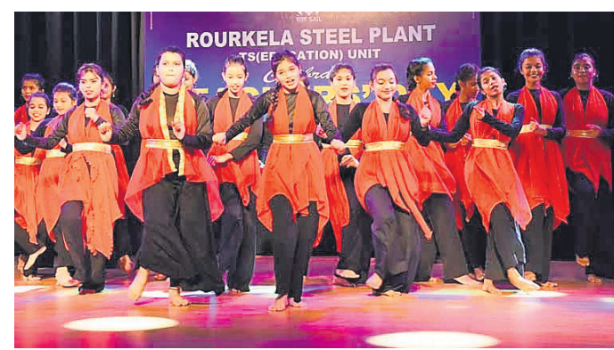
ଛାତ୍ରମାନେ ସାଂସ୍କୃତିକ କାର୍ଯ୍ୟକ୍ରମ ପରିବେଷଣ କରୁଛନ୍ତି।