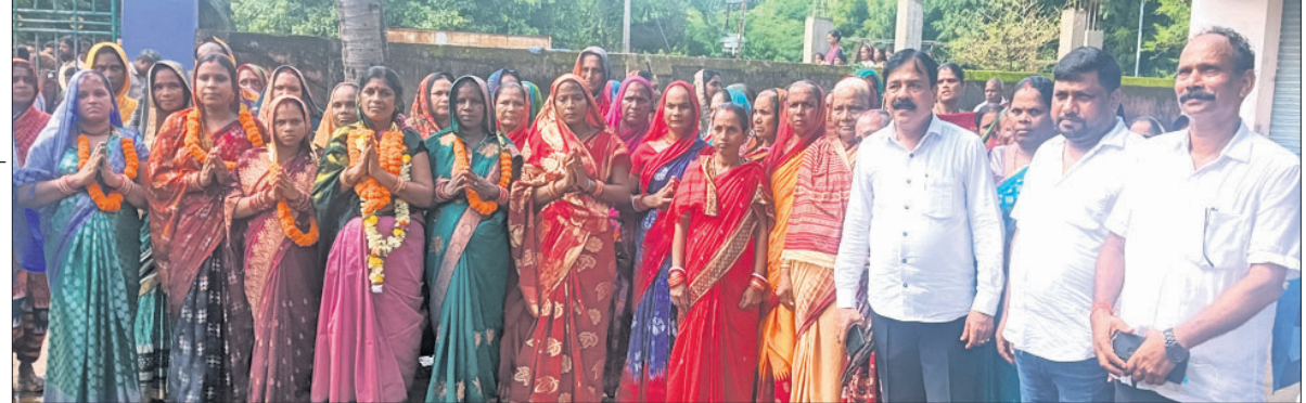
ପଞ୍ଚାୟତ କାର୍ଯ୍ୟାଳୟ ସମ୍ମୁଖରେ ବିଜେଡି ନେତୃମଣ୍ଡଳୀଙ୍କ ଗହଣରେ ଦଳୀୟ ସମର୍ଥକ ପ୍ରାର୍ଥୀ।