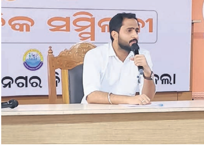
ରାଉରକେଲା ଏଡିଏମ୍ ସୂଚନା ପ୍ରଦାନ କରୁଛନ୍ତି।