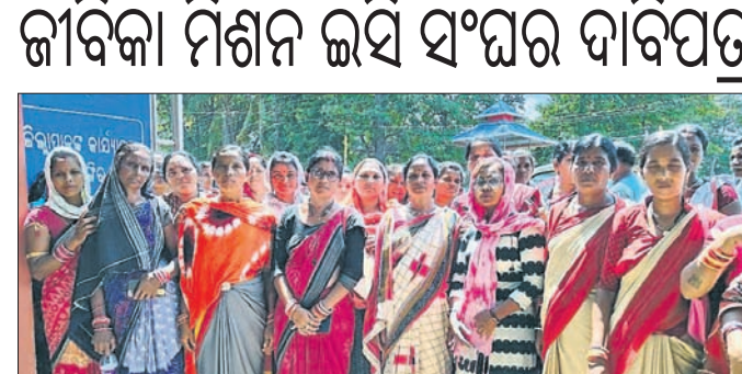
କଲାଙ୍ଗୀର ଜିଲ୍ଲାପାଳ କାର୍ଯ୍ୟାଳୟ ସମ୍ମୁଖରେ ଇସି ସଦସ୍ୟମାନେ ବିକ୍ଷୋଭ ପ୍ରଦର୍ଶନ କରୁଛନ୍ତି ।