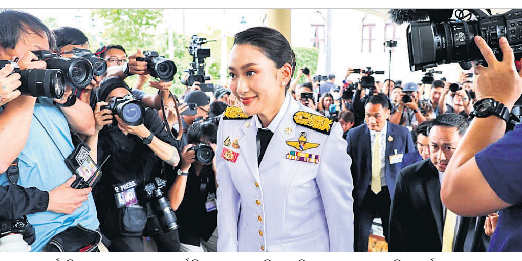
ଆଇଲାଣ୍ଡର ସର୍ବକନିଷ୍ଠ ପ୍ରଧାନମନ୍ତ୍ରୀ ପାଏଗୋଲ୍ଡର୍ ଶିନାଡ଼ାଡ଼ାକ ୩୭ ଜଣିଆ କ୍ୟାବିନେଟ୍ ଶୁଭକାରୀ ବ୍ୟାକ୍ସିଡ଼ିଟ୍ ଗଭର୍ନମେଣ୍ଟ ହାଉସ୍ରେ ଶପଥ ନେଇଛି। ୩୮ ବର୍ଷୀୟ ଶିନାଡ଼ାଡ଼ାକ ନିଜ ଚିମ୍ବ ସହ ଶପଥ ଗ୍ରହଣ ଉପରେ ଯାଉଥିବାବେଳେ ଖବରଦାତାମାନେ ତାଙ୍କ ଫଟୋ ଉଠାଉଛନ୍ତି।

କେନିଆର ଏକ ସ୍କୁଲରେ ନିଆଁ ଲାଗି ୧୭ ଜଣ ପିଲା ଜଳିଯାଇଥିବାବେଳେ ଅନ୍ୟ ୧୩ ଜଣ ଗୁରୁତର ଆହତ ହୋଇଛନ୍ତି। ସେମାନଙ୍କ ମଧ୍ୟରୁ ଅଧିକାଂଶଙ୍କ ଅବସ୍ଥା ସକାଶପାତ୍ର ଥିବାରୁ ମୁକ୍ତାସଂଖ୍ୟା ବଢ଼ିବା ଆଶଙ୍କା କରାଯାଉଛି। ନେମରି କାଉଣ୍ଟି ଅନ୍ତର୍ଗତ ହିଲ୍ସାଇଡ଼ ଏଣ୍ଡରାଶା ପ୍ରାଙ୍ଗଣରେ ଗୁରୁବାର ରାତିରେ ନିଆଁ ଲାଗିଯାଇଥିଲା। ନିଆଁ ଲାଗିବାର କାରଣ ଜଣିବାକୁ ପୋଲିସ୍ ତଦନ୍ତ କରାଯାଇଛି। ଉକ୍ତ ସ୍କୁଲରେ ୧୪ ବର୍ଷ ବୟସ ପର୍ଯ୍ୟନ୍ତ ପିଲା ପଢ଼ୁଥିଲେ। ସ୍କୁଲ ପିଲାଙ୍କ ଶଯ୍ୟା କକ୍ଷରେ ନିଆଁ ଲାଗିଯାଇଥିଲା। ସେତେବେଳେ ସେଠାରେ ୧୫୦ରୁ ଊର୍ଦ୍ଧ୍ୱ ଛାତ୍ର ଥିଲେ।