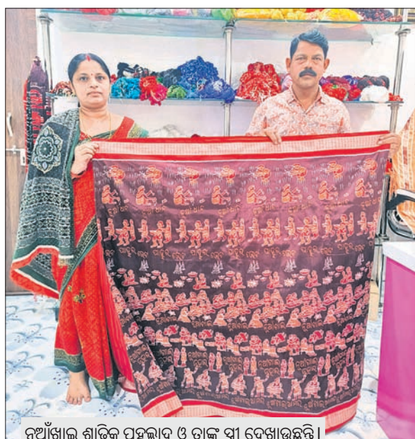
ନୂଆଁଖାଇ ଶାଢ଼ିକୁ ପ୍ରଦର୍ଶନ ଓ ତାଙ୍କ ସ୍ତ୍ରୀ ଦେଖାଉଛନ୍ତି।

ପାଟଣାଡ଼ି, ୭ (ବିଶ୍ୱକର୍ମା ଶ୍ରମିକ) ଘୋଷଣାକଲେ ଆର୍ଡ଼ିସି