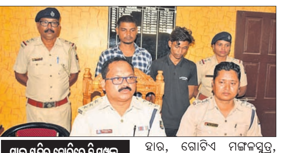
ସାଲ ମନ୍ଦିର ଚୋରିରେ ବି ସମ୍ପୃକ୍ତ

ସମଲପୁର, ୬ (ପ୍ରମୋଦ ବହିରା) ସମଲପୁର ଜିଲା ଅର୍ଦ୍ଧପାଲି ଥାନା ବୁଡ଼ାଗଡ଼ା ପ୍ରଫେସର କଲୋନୀରୁ ଚୋରି ଘଟଣାରେ ସମ୍ପୃକ୍ତ ଅଭିଯୁକ୍ତଙ୍କୁ ଧରିଲେ ପୋଲିସ।