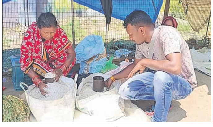
ଜଣେ ଲୋକ ନୂଆଁଖାଇ ପାଇଁ ନୂଆ ରୁଟା କିଣୁଛନ୍ତି।

ଚାଷୀଙ୍କ ଏହି ଦିନ ନିଜ ଜମିରେ ପୂଜା କରିବା ପରମ୍ପରା ରହିଛି। ଘରେ ଥିବା ଗାଈ, ବକ୍ରକୁ ମଧ୍ୟ ପୂଜା କରାଯାଏ। ପରିବାର ଲୋକେ ପିଠା ପଣା ତିଆରିରେ ଲାଗିଥିବା ବେଳେ ଘର ଲିପା ପୋଛା କାର୍ଯ୍ୟ ମଧ୍ୟ ସମାପ୍ତ କରିଛନ୍ତି ଘରର ନୂଆଁଖାଇରେ ବ୍ୟବହୃତ ନୂଆ ଧାନ, ଗୁହାଣିମାନେ। ପିଲାଠୁ ବୟସ୍କ ସମସ୍ତେ ନୂଆ ପୋଷାକ କିଣିବାରେ ଲାଗିଛନ୍ତି। ଏଥିପାଇଁ ଦେଶର ବଜାରରେ ଲାଗୁଛି ପ୍ରବଳ ଭିଡ଼। କପଡ଼ା ଦେଶରେ ଭଲ ବ୍ୟବସାୟ ହେଉଥିବା ପ୍ରକାଶ କରିଛନ୍ତି