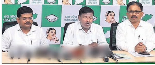
ଖବରଦାତା ସମ୍ମିଳନୀରେ ବିଜେଡି ନେତୃବୃନ୍ଦ।

ରେଭେନ୍ସା ବିଶ୍ୱବିଦ୍ୟାଳୟର ନାମ ପରିବର୍ତ୍ତନ ପ୍ରସଙ୍ଗରେ ରାଜ୍ୟ ସରକାର ତଥା ଭାଜପା ଯେଉଁଭଳି ଭାବେ ବିରୋଧୀ ଦଳଙ୍କ ପାଟି ବନ୍ଦ କରିବାକୁ ମିଛର ସାହାଯ୍ୟ ନେଉଛି ତାହା ଗଣତନ୍ତ୍ର ପାଇଁ ଶୁଦ୍ଧାକାର ନୁହେଁ।