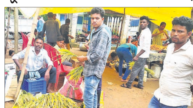
ଖପ୍ରାଖୋଲ ଅଞ୍ଚଳରେ ଜଣେ ବ୍ୟକ୍ତି ନୂଆଖାଇ ବିକ୍ଷୋଭ ।