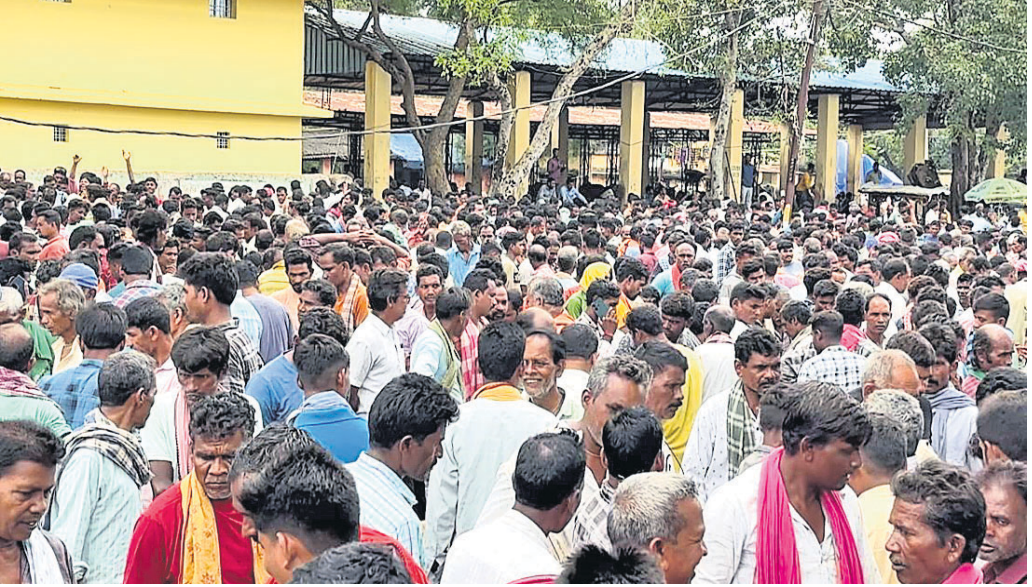
ନୂଆଁଖାଇ ପାଇଁ ବଜାରରେ ଭିଡ଼ ପରିଲକ୍ଷିତ ହୋଇଛି।