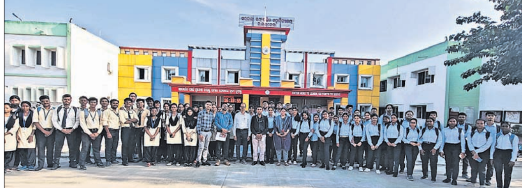
କାର୍ଯ୍ୟକ୍ରମରେ ଉପସ୍ଥିତ ଅତିଥି ଏବଂ ଛାତ୍ରାଛାତ୍ର।

ରାଉରକେଲା, ୧୯ (ସଙ୍ଗୀତା ଜେନା): ଉଦିତନଗର ଥାନା ଅନ୍ତର୍ଗତ ପାଣି ମାଟେକରେ ଥିବା ରାଧିକା କୁଳକର୍ଣ୍ଣର ଶୁକ୍ରବାର ରାତି ୯ଟାରେ ସମସ୍ତ ଲୁଚି ହୋଇଛି। ବୋକାଳରୁ ସାହସିକତା ଯୋଗୁ ଜଣେ ଡକାୟତ ଧରା ପଡ଼ିଛନ୍ତି। ୪ ଜଣ ଡକାୟତ ହାତରେ ବନ୍ଧୁକ ଧରି ବୋକାଳରେ ଲୁଚି ଉଦ୍ୟମ କରିଥିଲେ। ବୋକାଳୀ ପ୍ରତିରୋଧ କରିବାକୁ ସେମାନେ ପକାଇବା ବେଳେ ଜଣେ ଧରାପଡ଼ିଥିଲେ। ପୋଲିସ ଅଟକ ଡକାୟତଙ୍କୁ ପଚରାଉଚୁରା କରୁଥିବା ବେଳେ ଲୁଚରେ ବ୍ୟବହୃତ ଏକ ବାଇକ ଜବତ ହୋଇଛି। ଘଟଣାସ୍ଥଳରେ ପୋଲିସ ତଦନ୍ତ କରୁଛି।