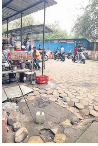
ଭେଣ୍ଡା ଜୋନ୍‌ରେ ପେଭର କ୍ଲକ୍‌ଗୁଡ଼ିକ ସ୍ଥାପିତ ପଡ଼ିଛି।

ଆଜିକୁ ପାଖାପାଖି ବର୍ଷ ତଳେ କୋଲକାତା ରାସ୍ତାରେ ୧ କୋଟି ଟଙ୍କା ବ୍ୟୟରେ ଭେଣ୍ଡା ଜୋନ୍-୨ ନିର୍ମାଣ ହୋଇଥିଲେ ମଧ୍ୟ ରକ୍ଷଣାବେକ୍ଷଣ ଅଭାବରୁ ତାର ଅବସ୍ଥା ଶୋଚନୀୟ ହେବାରେ ଲାଗିଛି। ଅନ୍ୟପକ୍ଷେ ଭେଣ୍ଡା ଜୋନ୍‌ରେ ୭୭ଟି ବୋକାଳରୁ ଏପର୍ଯ୍ୟନ୍ତ ୧୦ଟି ବୋକାଳ ଖୋଲିଛି। ଅନ୍ୟ ବୋକାଳଗୁଡ଼ିକ ବନ୍ଦ ରହିଥିବା ଦେଖିବାକୁ ମିଳିଛି। ସୂଚନା ଅନୁସାରେ, ଉକ୍ତ ଭେଣ୍ଡା ଜୋନ୍‌ରେ ୧୩୦ ଉପାଦାନମାନଙ୍କୁ ଅଧିକାର କରାଯିବା ଲାଗି ଆରବ୍‌ସି ପକ୍ଷରୁ ନିଷ୍ପତ୍ତି ହୋଇଥିଲା। ଏହି