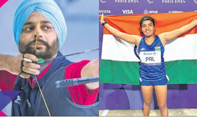
ହରବିନ୍ଦର ସିଂ ପ୍ରୀତି ପାଇଁ

ପ୍ୟାରିସ୍, ୨୯ (ପି.ଟି.) ପ୍ୟାରିସ୍ ପାରାଲିମ୍ପିକ୍ସ ରବିବାର ଉଦ୍‌ଯାପିତ ହେବ। ସର୍ବ ପଦକ ବିଜୟୀ ଆର୍ଚର ହରବିନ୍ଦର ସିଂ ଓ ବ୍ରିଷ୍ଟଲ ପ୍ରୀତି ପାଇଁ ଉଦ୍‌ଯାପନୀ ଉତ୍ସବରେ ତ୍ରିରଙ୍ଗାଧରି ଭାରତର ନେତୃତ୍ୱ ନେବେ। ସର୍ବପ୍ରଥମ ଭାରତୀୟ ମହିଳାଭାବେ ପ୍ରୀତି ପାରାଲିମ୍ପିକ୍ସରେ ୨ଟି ପଦକ ହାସଲ କରିଥିଲେ। ସେହିପରି ୩୩ ବର୍ଷୀୟ ହରବିନ୍ଦର ପ୍ରଥମ ଭାରତୀୟ ଚାରୋକିଭାବେ ପାରାଲିମ୍ପିକ୍ସରେ ସର୍ବ ପଦକ ଅର୍ଜନ କରିଥିଲେ। ୨୦୨୧ରେ ଚୋକିଓରେ ଟ୍ରୋଜି ଜିତିଥିବା ହରବିନ୍ଦର ଏଠାରେ ଶ୍ରେଷ୍ଠ ପ୍ରଦର୍ଶନ ମାଧ୍ୟମରେ ଚାହାକୁ ସର୍ବୋଚ୍ଚ ପଦକ ଜିତିଥିଲେ। “ଭାରତ ପାଇଁ ସର୍ବ ପଦକ ଜିତିବା ସ୍ୱପ୍ନ ସତ ହେବା ପରି କଥା। ଏବେ ଉଦ୍‌ଯାପନୀ ସମାରୋହରେ ଜାତୀୟ ପତାକା ଧରି ଦେଶର ନେତୃତ୍ୱ ନେବା ସବୁଠାରୁ ବଡ଼ ସମ୍ମାନ। ମୋ ଉପରେ ବିଶ୍ୱାସ ରଖିଥିବା ଏବଂ ମୋତେ ଉତ୍ସାହ ଦେଇଥିବା ବନ୍ଧୁ ସମ୍ପର୍କୀତା ବେବାରେ ଚାହାକୁ ସର୍ବୋଚ୍ଚ ପଦକ ଜିତିବା ସମସ୍ତଙ୍କ ପାଇଁ ଏହି ବିଜୟ ଉତ୍ସର୍ଗ” ବୋଲି ହରବିନ୍ଦର ଶେଷ ଉଦ୍‌ଯାପନୀ କରିଛନ୍ତି। ହରବିନ୍ଦର ଶିଶୁ ଅସଲରେ ଚାଲିବା ଆରମ୍ଭ କରିବା ଦିନରୁ ହିଁ ତାଙ୍କ ପାଦ ବୁଜିତ ରୁଟିକ ହୋଇଯାଇଥିଲା।