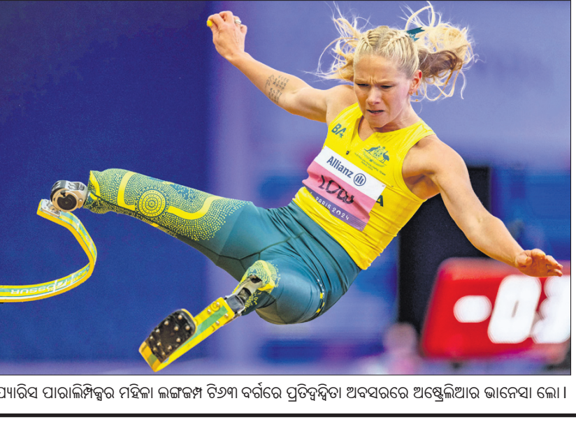
ପ୍ୟାରିସ୍ ପାରାଲିମ୍ପିକ୍ସର ମହିଳା ଲକ୍ଷ୍ୟ ୧୬୩ ବର୍ଗରେ ପ୍ରତିଦ୍ୱନ୍ଦ୍ୱୀତ ଅବସରରେ ଅଲେକ୍ସ ଆର ନେସା ଲୋ।

ପୋଷ୍ଟ କରିବା ସହ ଅବସର ଘୋଷଣା କରିଛନ୍ତି ମୋର୍ଗାନ। ଦ୍ୱିତୀୟ ଥର ପାଇଁ ମାଟୁସ୍ ହାସଲ କରିବାକୁ ଯାଉଥିବାରୁ ଫୁଟବଲ୍‌କୁ ବିଦାୟ ଦେବା ପାଇଁ ଏହା ପ୍ରକୃଷ୍ଟ ସମୟ ବୋଲି କହିଛନ୍ତି ମୋର୍ଗାନ। ଅଲିମ୍ପିକ୍ସ ଫାଇନାଲରେ ଜାପାନ ବିପକ୍ଷରେ ବିଜୟ ସ୍ମୃତକ ଗୋଲ କରିବା ମୋର୍ଗାନଙ୍କ କ୍ୟାରିୟରର ଶ୍ରେଷ୍ଠ ମୁହୂର୍ତ୍ତ ଥିଲା।