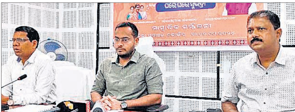
କଲାଙ୍ଗୀର ଜିଲ୍ଲାପାଳ କାର୍ଯ୍ୟାଳୟରେ ଆୟୋଜିତ ଖବରଦାତା ସମ୍ମିଳନୀରେ ଜିଲ୍ଲାପାଳ ସୁଭଦ୍ରା ଯୋଜନା ସମ୍ପର୍କିତ ସୂଚନା ଦେଖାଇଛନ୍ତି ।