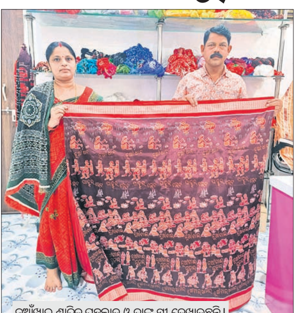
ନୂଆଁଖାଇ ଶାଢ଼ିକୁ ପ୍ରଦର୍ଶନ ଓ ତାଙ୍କ ସ୍ତ୍ରୀ ଦେଖାଇଛନ୍ତି।