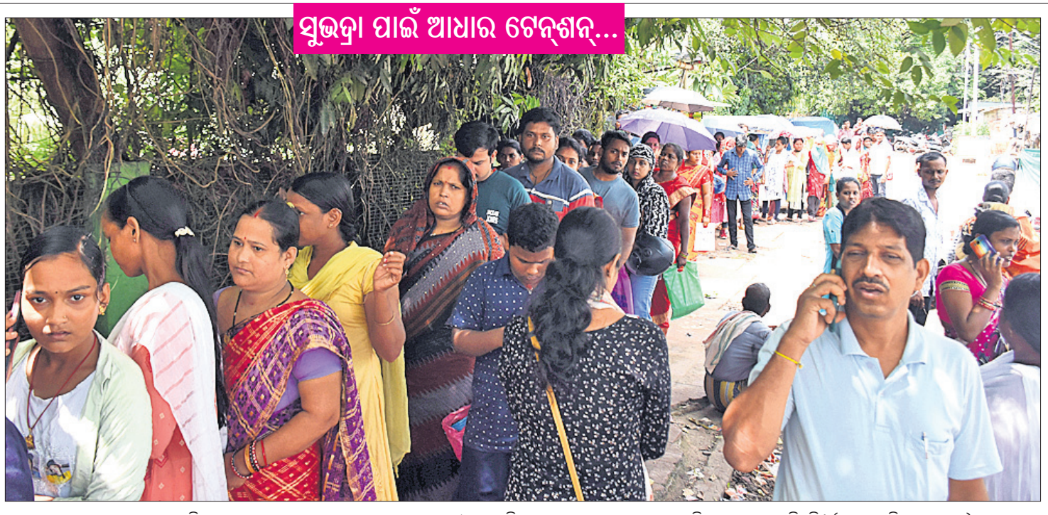
ସୁଭଦ୍ରା ପାଇଁ ଆଧାର ଚେନ୍ଦ୍ରଶା...