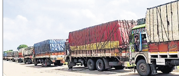
ଅଟକି ରହିଥିବା ଚୁକ୍।

୬୦ନଂ. ଜାତୀୟ ରାଜପଥର ବାଲେଶ୍ୱର ଜିଲ୍ଲା କଳେଶ୍ୱର ନିକଟରେ ଥିବା ପଶ୍ଚିମବଙ୍ଗର ସୀମା ସୁନାକଣିଆ ନାକା ନିକଟରେ ଅଟକିଛି ୭୦ରୁ ଅଧିକ ଅଣ୍ଡା ଓ କୁକୁଡ଼ା ବୋହେଇ ଚୁକ୍। ଓଡ଼ିଶାରେ ବାର୍ଡ଼ ଫୁ ବ୍ୟାପିଥିବାରୁ ଓଡ଼ିଶାକୁ ପଶ୍ଚିମବଙ୍ଗ ଯାଉଥିବା କୁକୁଡ଼ା ଓ ଅଣ୍ଡା ଚୁକ୍ ଉପରେ ପ୍ରତିବନ୍ଧକ ଲଗାଇଛି ପଶ୍ଚିମବଙ୍ଗ ସରକାର। ଗତ ରୁଧିରାଠାରୁ ଦୀର୍ଘ ୩