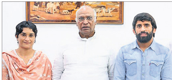
କଂଗ୍ରେସ ଅଧ୍ୟକ୍ଷ ମଲ୍ଲିକାର୍ଜୁନ ଖାର୍ଯ୍ୟକ ସହ କୁସ୍ତିଯୋଦ୍ଧା ଭିନେଶ ଫୋଗଟ ଓ ବଜରଙ୍ଗ ପୁନିଆ।

ସାଧାରଣ ଜୀବନରୁ କେତେକ କଂଗ୍ରେସ ଆଡ଼କୁ ମୁହାଁଇଲେଣି। ସଦସ୍ୟ ଖବରରେ କୁସ୍ତିଯୋଦ୍ଧା ଭିନେଶ ଫୋଗଟ ଓ ବଜରଙ୍ଗ ପୁନିଆ।