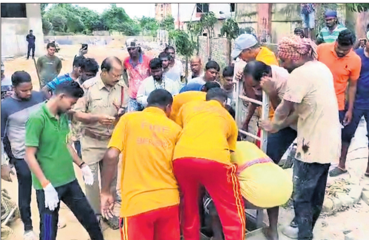
ଅଗ୍ନିଶମ କର୍ମଚାରୀମାନେ ଟାଙ୍କିକୁ ଶ୍ରମିକମାନଙ୍କୁ ଉଦ୍ଧାର କରୁଛନ୍ତି।