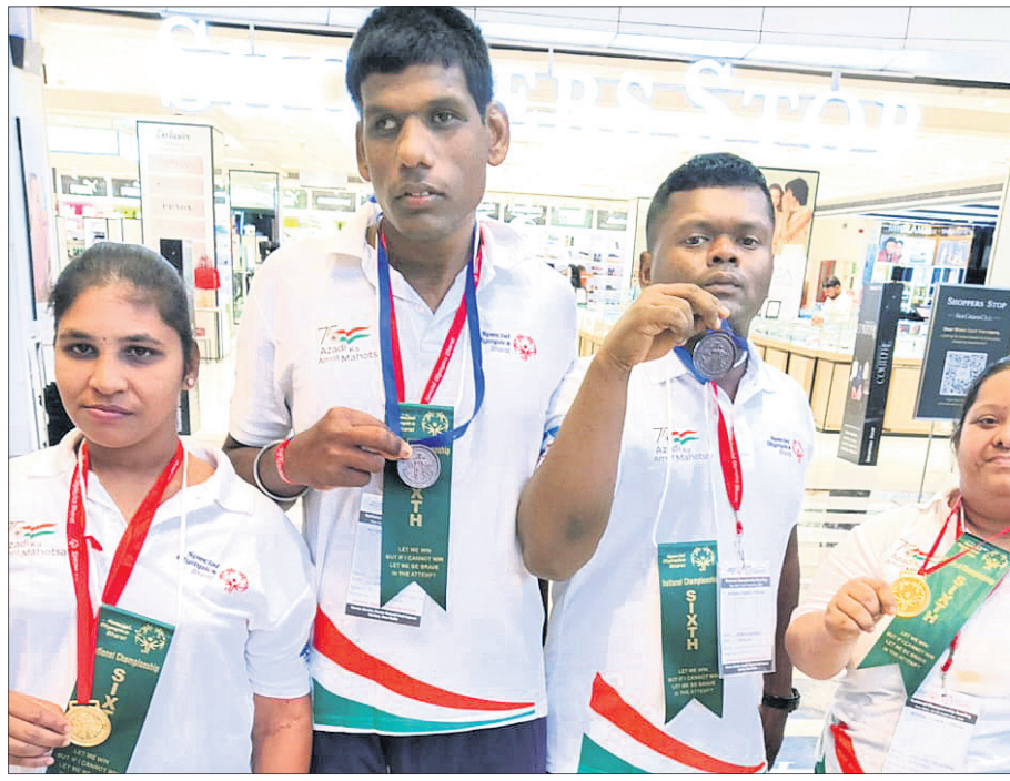
ପଦକ ବିଜେତା ଓଡ଼ିଶା ଖେଳାଳି।

ବିରୋଧରେ ସଂଗ୍ରାମ କରି ରାଜ୍ୟପାଇଁ ଗୌରବ ଆଣିଛନ୍ତି।