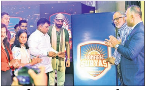
ଅତିଥିମାନେ କୋଶାଳ ଉଦ୍ଘୋଷଣ କରୁଛନ୍ତି।

କୋଶାଳ ସୂର୍ଯ୍ୟସ୍ୱର କ୍ୟାପଟେନ୍ ଇର୍ଫାନ ପ୍ରଥମ ଥର ଓଡ଼ିଶା ଟିମର ଅଂଗ୍ରହଣ କରିଛନ୍ତି।