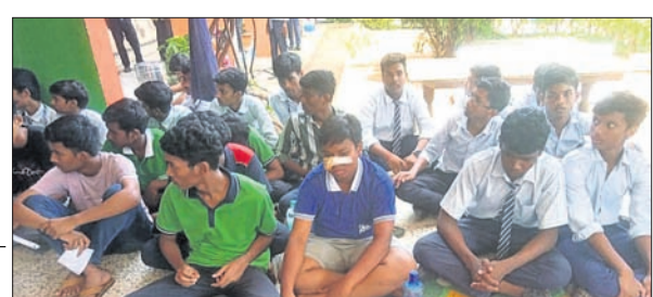
ବିଦ୍ୟାଳୟ ପରିସରରେ ଛାତ୍ରଛାତ୍ରୀ ଧାରଣାରେ ବସିଛନ୍ତି।

ନୂଆପଡ଼ା/କୋମନା, ୬ (ମକାଭୁ ବେମାଲ/ସୋବିନ ଛତ୍ରିଆ)