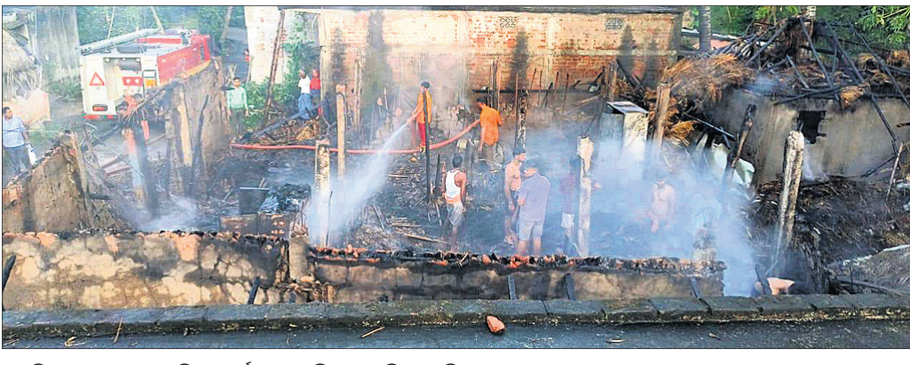
ପୋଡି ଯାଇଥିବା ଘରେ ଅଗ୍ନିଶମ କର୍ମଚାରୀ ପାଣି ପକାଇ ଲିଭାଇଛନ୍ତି ।