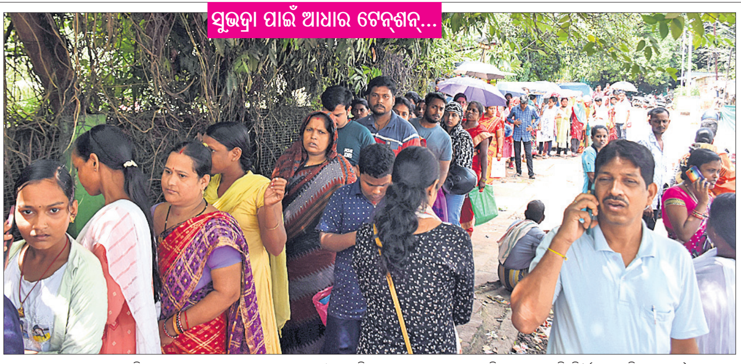
ସୁଭଦ୍ରା ପାଇଁ ଆଧାର ଚେନ୍ଦ୍ରଶେଖର... ଯୁଭଦ୍ରା ଆବେଦନ ଲାଗି ଆଧାର ଅପ୍ଡେଟ୍ କରାଇବାକୁ ଭୁବନେଶ୍ୱର ଶହାଦନଗରସ୍ଥିତ ଆଧାର କେନ୍ଦ୍ରରେ ଲୋକେ ଧାଡ଼ିରେ ଅପେକ୍ଷା କରିଛନ୍ତି।

ହେବ କୌଣସି ମହିଳା ସାମ୍ବାସନା ନାହିଁ। ସେହିପରି ଉଚ୍ଚ ପଞ୍ଚାୟତର ସାଧନାରେ ଉପସାମ୍ବାସନା ମହିଳା ସାମ୍ବାସନା ରହି ନ ଥିବାରୁ ଲୋକେ ଠିକ୍ ଭାବେ ସାମ୍ବାସନା ପାଇନାହାନ୍ତି। ଚେପଟିଆୟାରେ ସମସ୍ତଙ୍କୁ ଝାଡ଼ାବାଡ଼ିରେ ପହଞ୍ଚିବା ପରେ ସେମାନେ ଝାଡ଼ାବାଡ଼ିରେ ପ୍ରାୟ ୧୮୦ ଦିନ ଧରି ରହିଛନ୍ତି। ସେମାନେ ଝରିଗାଁ ଗୋଷ୍ଠୀ ସାମ୍ବାସନା ଅଧୀନ ମୁଖ୍ୟପଦର ଉପସାମ୍ବାସନା ଉପରେ ନିର୍ଭର କରନ୍ତି। ମୁଖ୍ୟପଦର ଉପସାମ୍ବାସନାରେ ସାତ ମାସ ହେବ କୌଣସି ମହିଳା ସାମ୍ବାସନା ନାହିଁ। ସେହିପରି ଉଚ୍ଚ ପଞ୍ଚାୟତର ସାଧନାରେ ଉପସାମ୍ବାସନା ମହିଳା ସାମ୍ବାସନା ରହି ନ ଥିବାରୁ ଲୋକେ ଠିକ୍ ଭାବେ ସାମ୍ବାସନା ପାଇନାହାନ୍ତି। ଚେପଟିଆୟାରେ ସମସ୍ତଙ୍କୁ ଝାଡ଼ାବାଡ଼ିରେ ପହଞ୍ଚିବା ପରେ ସେମାନେ ଝାଡ଼ାବାଡ଼ିରେ ପ୍ରାୟ ୧୮୦ ଦିନ ଧରି ରହିଛନ୍ତି। ସେମାନେ ଝରିଗାଁ ଗୋଷ୍ଠୀ ସାମ୍ବାସନା ଅଧୀନ ମୁଖ୍ୟପଦର ଉପସାମ୍ବାସନା ଉପରେ ନିର୍ଭର କରନ୍ତି। ମୁଖ୍ୟପଦର ଉପସାମ୍ବାସନାରେ ସାତ ମାସ ହେବ କୌଣସି ମହିଳା ସାମ୍ବାସନା ନାହିଁ। ସେହିପରି ଉଚ୍ଚ ପଞ୍ଚାୟତର ସାଧନାରେ ଉପସାମ୍ବାସନା ମହିଳା ସାମ୍ବାସନା ରହି ନ ଥିବାରୁ ଲୋକେ ଠିକ୍ ଭାବେ ସାମ୍ବାସନା ପାଇନାହାନ୍ତି। ଚେପଟିଆୟାରେ ସମସ୍ତଙ୍କୁ ଝାଡ଼ାବାଡ଼ିରେ ପହଞ୍ଚିବା ପରେ ସେମାନେ ଝାଡ଼ାବାଡ଼ିରେ ପ୍ରାୟ ୧୮୦ ଦିନ ଧରି ରହିଛନ୍ତି। ସେମାନେ ଝରିଗାଁ ଗୋଷ୍ଠୀ ସାମ୍ବାସନା ଅଧୀନ ମୁଖ୍ୟପଦର ଉପସାମ୍ବାସନା ଉପରେ ନିର୍ଭର କରନ୍ତି। ମୁଖ୍ୟପଦର ଉପସାମ୍ବାସନାରେ ସାତ ମାସ