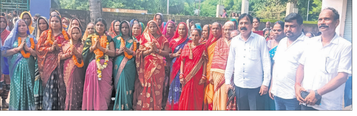
ପଞ୍ଚାୟତ କାର୍ଯ୍ୟାଳୟ ସମ୍ମୁଖରେ ବିଜେଡି ନେତୃମଣ୍ଡଳୀଙ୍କ ଗହଣରେ ଦଳୀୟ ସମର୍ଥକ ପ୍ରାର୍ଥୀ।