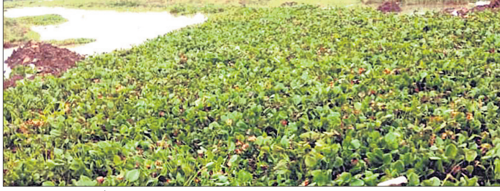
ଗୋବରା ନଦୀରେ ବଳ ଭରି ହୋଇ ରହିଛି ।

ରାଜ୍ୟର ଅଧିକାଂଶ ଜଳ ଉତ୍ସ ପ୍ରଦୂଷିତ । ସାଧାରଣ ଲୋକଙ୍କ ପାଇଁ ଏହାର ଜଳ ବ୍ୟବହାର ଉପଯୋଗୀ ନୁହେଁ । ଜାତୀୟ ଗ୍ରାମ ଡିଭିଜନ (ଏନଡିଡି) ନିକଟରେ କେନ୍ଦ୍ରାପଡ଼ା ପ୍ରଦୂଷଣ ନିୟନ୍ତ୍ରଣ ବୋର୍ଡ (ସିପିସିବି) ପକ୍ଷରୁ ଏପରି ରିପୋର୍ଟ ପ୍ରକାଶ କରିଛି । ଏଥିରେ କେନ୍ଦ୍ରାପଡ଼ା ଜିଲ୍ଲା ଅଛି । ଜିଲ୍ଲାରେ ପ୍ରବାହିତ ମହାନଦୀ, ବାହୁଣୀ ଓ ଦୈତରଣୀ ସିଷ୍ଟମରେ ଥିବା ୭ ନଦୀ ଓ ୨୭ ନାଳ ବିଭିନ୍ନ କାରଣରୁ ପ୍ରଦୂଷିତ ହେଉଛି । ସେହିପରି ଗରବପୁର ବ୍ଲକ ଅଞ୍ଚଳରେ ଭୂଉର୍ତ୍ତ ଜଳ ଦୁଷ୍ଟଗଣିତରେ ଥିବା ପାଇଁ ଗୋବରା ନଦୀର ଜଳ ଉତ୍ସ ପ୍ରଦୂଷଣ ବୃଦ୍ଧି ପାଇଁ ଦାୟିତ୍ୱ ଦିଆଯାଇଛି ।