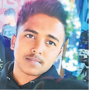
ଧର୍ମଶାଳା, ୬।୯