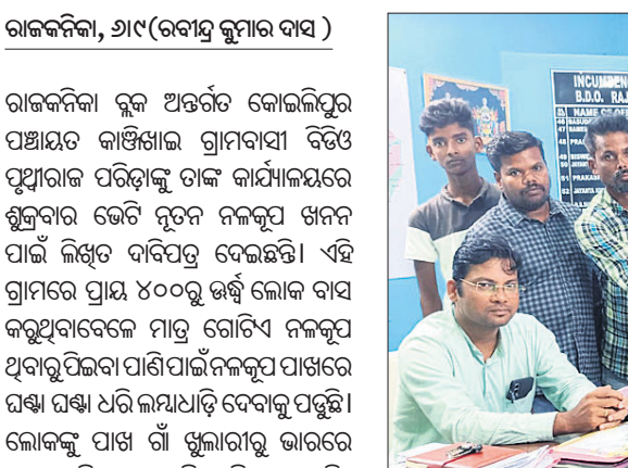
ରାଜକନିକା, ୬୯