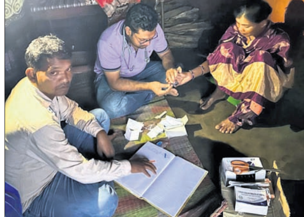
ଗାଁରେ ତାତ୍ତ୍ୱର ଆକ୍ରାନ୍ତ ବ୍ୟାପୁ ପରୀକ୍ଷା କରୁଛନ୍ତି।