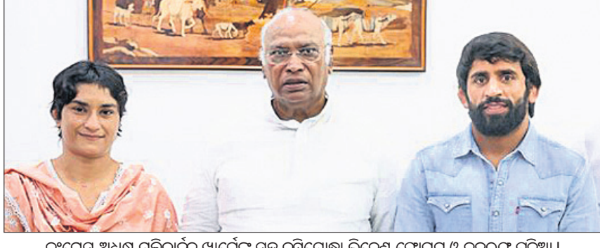
କଂଗ୍ରେସ ଅଧ୍ୟକ୍ଷ ମଲ୍ଲିକାର୍ଜୁନ ଖାରୋଙ୍କ ସହ କୁସ୍ତିଯୋଦ୍ଧା ଭିନେଶ ଫୋରଟ ଓ ବଜରଙ୍ଗ ପୁନିଆ।