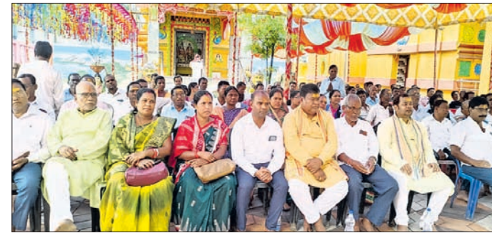
ଜନସମାବେଶରେ ଉପସ୍ଥିତ ବିଭିନ୍ନ ରାଜନୈତିକ ଦଳର ନେତୃବୃନ୍ଦ ଓ ଜନସାଧାରଣ।