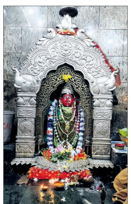
ଅଧିଷ୍ଠାତ୍ରୀ ଦେବୀ ମା' ସୁରେଶ୍ୱରୀ।