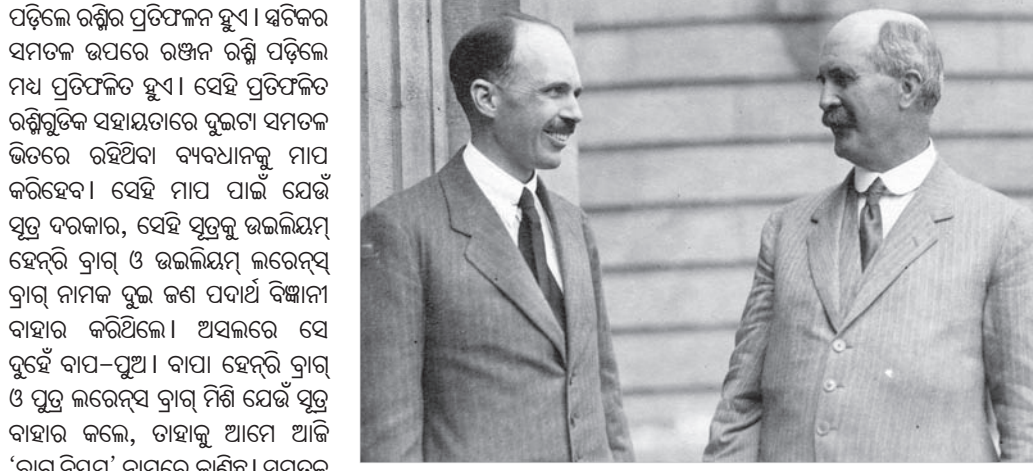
ଲରେନ୍ସ ବ୍ରାଗ୍ ହେନ୍‌ରି ବ୍ରାଗ୍

ସମସ୍ତେ ଜାଣନ୍ତି । ୧୯୦୧ ମସିହାରେ ଏହି ପୁରସ୍କାର ଦିଆଯାଇ ଆସୁଛି । ପଦାର୍ଥ ବିଜ୍ଞାନ, ରସାୟନ ବିଜ୍ଞାନ, ଚିକିତ୍ସାଶାସ୍ତ୍ର, ସାହିତ୍ୟ, ବିଶ୍ୱଶାନ୍ତି ପ୍ରତିଷ୍ଠା ଓ ଅର୍ଥନୀତି କ୍ଷେତ୍ରରେ ଉଲ୍ଲେଖନୀୟ ଅବଦାନ ନିମନ୍ତେ ପ୍ରତିବର୍ଷ ଏହି ପୁରସ୍କାର ପ୍ରଦାନ କରାଯାଇଥାଏ । ସାଧାରଣରେ ଯାହା ଲାଭ୍ୟକରୁ, ନୋବେଲ୍ ବିଜେତାଙ୍କର ବୟସ ୪୦-୫୦ ବର୍ଷରୁ କମ୍ ହୋଇ ନଥାଏ । କିନ୍ତୁ ଉଇଲିୟମ୍ ଲରେନ୍ସ ବ୍ରାଗ୍ ମାତ୍ର ୨୫ ବର୍ଷ ବୟସରେ ଏହି ପୁରସ୍କାର ପାଇବା ପାଇଁ ଯୋଗ୍ୟ ବିବେଚିତ ହୋଇଥିଲେ । ସେ ୧୮୯୦ ମସିହା ମାର୍ଚ୍ଚ ୩୧ ତାରିଖରେ ଅଷ୍ଟ୍ରେଲିଆରେ ଜନ୍ମଗ୍ରହଣ କରିଥିଲେ । ସେ ୧୯୦୮ ମସିହାରେ ବ୍ରାଜିଲ୍‌ସ୍ତରୀୟ କରିବା ପରେ ଇଂଲଣ୍ଡର କେମ୍ବ୍ରିଜ୍ ଟ୍ରିନିଟି କଲେଜରେ ଗଣିତରେ ନାମ ଲେଖାଇଥିଲେ । କାରଣ ମୋ : ୯୪୩୯୫୦୧୨୫୧