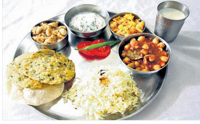
ସନ୍ତୁଳିତ କ୍ୟାଲୋରି ପାଇଁ...

ଆମ ଶରୀରରେ କ୍ୟାଲୋରି ସନ୍ତୁଳିତ ରହିବା ନିହାତି ଜରୁରୀ । ଏହା ଅସନ୍ତୁଳିତ ପ୍ରଣାଳୀରେ ତାହା କେତେକ ରୋଗକୁ ଚଳାଇ ଦେଇଥାଏ । କେବଳ ସେତିକି ନୁହେଁ, ଏହା ଆମ ଶରୀର ପାଇଁ ଅନେକ କ୍ଷତି କାରଣ ମଧ୍ୟ ସୃଷ୍ଟି କରେ । ତେଣୁ କ୍ୟାଲୋରିକୁ ସନ୍ତୁଳିତ ରଖିବା ପାଇଁ ସ୍ୱଚ୍ଛତା ବୃଦ୍ଧି କରିବା ଆବଶ୍ୟକ । ଏହା ଆମ ଶରୀର ପାଇଁ ଅନେକାଂଶରେ ସନ୍ତୁଳିତ ରହିଥାଏ । ସନ୍ତୁଳିତ କ୍ୟାଲୋରି ଆମ ଶରୀର ପାଇଁ