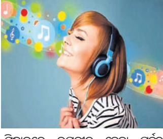
ସ୍ମରଣ ଶକ୍ତି ବୃଦ୍ଧିର ନୂଆ ଉପାୟ

ଆମର ସ୍ମରଣ ଶକ୍ତି ସବୁବେଳେ ପ୍ରଖର ରହିବା ଦରକାର । ଏହା ପ୍ରଭାବିତ ହେଲେ ଆମେ ବିଭିନ୍ନ ପ୍ରକାର ସମସ୍ୟାର ସମ୍ମୁଖୀନ ହୋଇଥାଉ । କିନ୍ତୁ ଏହାକୁ ବୃଦ୍ଧି କରିବାର ଏକ ସରଳ ଉପାୟ ରହିଛି । ଯଦି ଜଣେ ବ୍ୟକ୍ତି ନିଜ ମନ ପସନ୍ଦର ଗୀତ ଶୁଣି ତେବେ ତାହାର ସ୍ମରଣ ଶକ୍ତି ଉପରେ ପଡ଼ିଥାଏ ବୋଲି ଚେତନା ଦେବାକୁ ସୂଚନା ମିଳେ । ବିଶ୍ୱବିଦ୍ୟାଳୟ ମନୋବିଜ୍ଞାନୀମାନେ ମନ ପ୍ରକାଶ କରିଛନ୍ତି । ଉକ୍ତ ବିଶ୍ୱବିଦ୍ୟାଳୟ ପକ୍ଷରୁ ପ୍ରକାଶିତ ରିପୋର୍ଟରେ ଉଲ୍ଲେଖ କରାଯାଇଛି ଯେ, ନିଜର ପ୍ରିୟ ଗୀତକୁ ବାରମ୍ବାର ଶୁଣିବାଦ୍ୱାରା ସ୍ମରଣଶକ୍ତିକୁ ପୂର୍ବପେକ୍ଷା ଆହୁରି ସକ୍ରିୟ ରହିଥାଏ । କଥା ହେଲା, ଏହାର ସ୍ୱପ୍ନାବଳୀ ସ୍ମରଣ ଶକ୍ତି ଉପରେ ମଧ୍ୟ ପଡ଼ିଥାଏ । ଏଭଳି