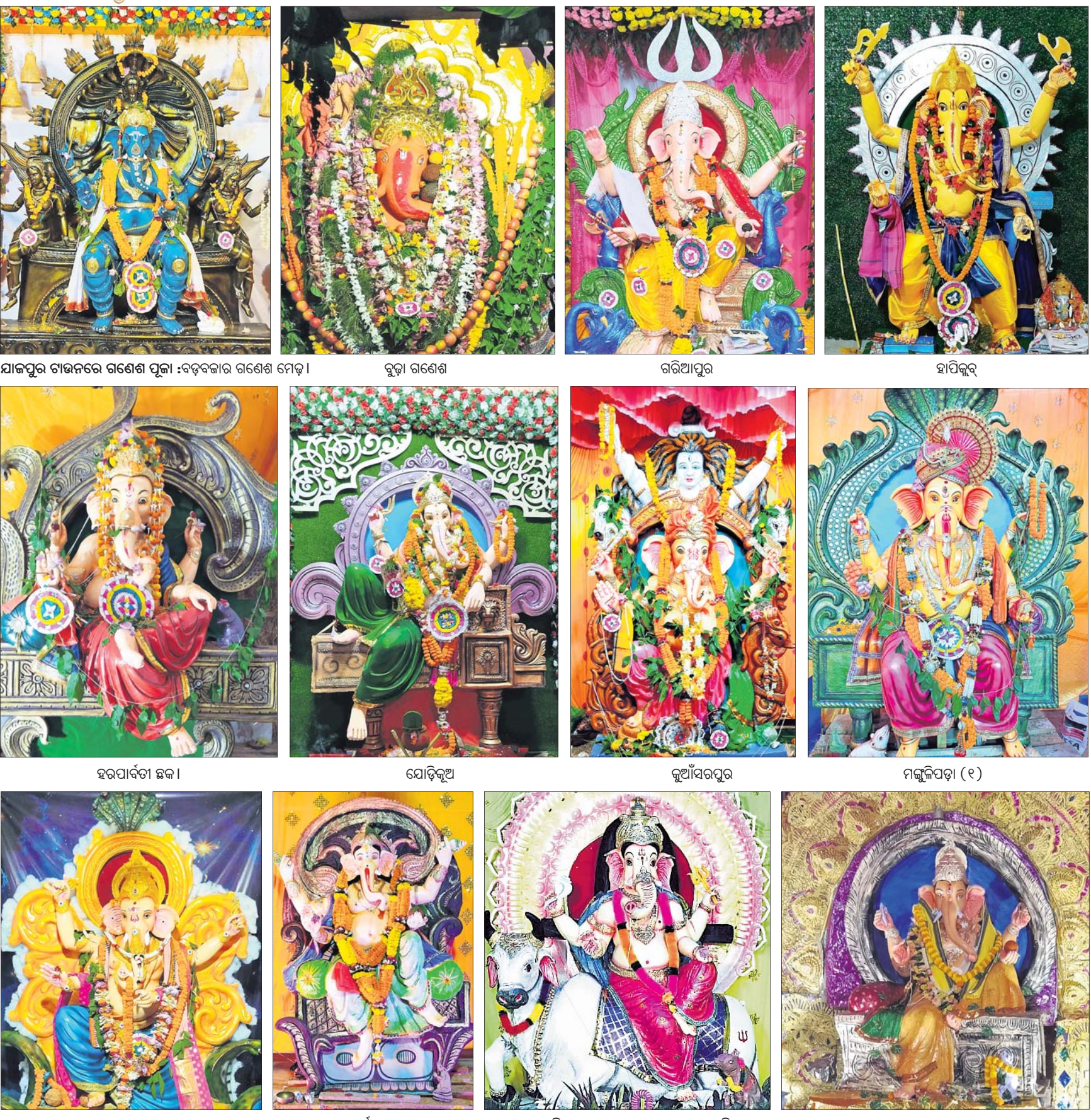
ଯାଜପୁର ଚାନ୍ଦନରେ ଗଣେଶ ପୂଜା : ବଡ଼ବଜାର ଗଣେଶ ମେଢ଼ା । ବୁଢ଼ା ଗଣେଶ । ଗରିଆପୁର । ହାପିକୂର୍ । ହରପାର୍ବତୀ ଛକ । ଯୋଡ଼ିକୂଅ । କୁଆଁସରପୁର । ମଲ୍ଲୁଳିପଡ଼ା (୧) । ଶୀତକେଶ୍ୱର । ମାର୍କେଟ ଛକ । ବରୀ ବୁକ୍ ଅଭିବାଦ ଗ୍ରାମର ଗୋପବନ୍ଧୁ ସେବା ପରିଷଦ କୂଳ । ବଡ଼ତଣା ବୁକର ଏକ ମଣ୍ଡପରେ ଗଜାନନ ।