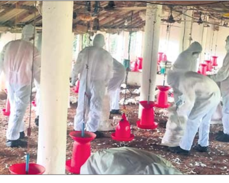
ଡୋରାବିଶି ଅଞ୍ଚଳରେ ସଂକ୍ରମିତ ଗ୍ରାଣାଧିକାରୀଙ୍କୁ ପ୍ରଶାସନ ପକ୍ଷରୁ ବ୍ଲକ୍ ଅଧୀନ ଦରକାରୀଙ୍କୁ ନେବାକୁ ସେ ନିର୍ଦ୍ଦେଶ ଦେଇଥିଲେ ।