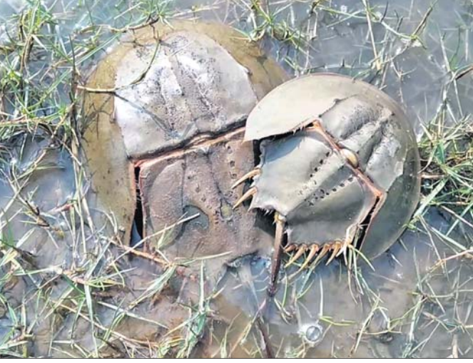
ନୀଳରକ୍ତ କଙ୍କଡ଼ା ସମୂହ ତଟବର୍ଦ୍ଧୀ ବୋରା ମାଟିରେ ନୀଳରକ୍ତ କଙ୍କଡ଼ା ।

ଧରିତ୍ରୀ ପ୍ରଭାଟ ଭିତରକନିକା, ଗହୀରମଥା ସମୂହ ତଟବର୍ଦ୍ଧୀରେ ଦେଶୀୟାଣ୍ଡି ମହାକାଳପଡ଼ା, ଟାଟ(ପ୍ରତାପ ଚନ୍ଦ୍ର ସାଲ) ଗହୀରମଥା ସାମୁଦ୍ରିକ ଅଭୟାରଣ୍ୟ ଓ ଭିତରକନିକା ନଦୀ ଅବବାହିକା ଅଞ୍ଚଳରେ ବହୁସଂଖ୍ୟାରେ ବିରଳ ପ୍ରଜାତିର ସାମୁଦ୍ରିକ ନୀଳରକ୍ତ କଙ୍କଡ଼ା ବା ହାଣ୍ଡିକା ବୃକ୍ଷପତ୍ର, ଅମାବାସ୍ୟାରେ ମିଳନ ପ୍ରକ୍ରିୟା ଦେଖିବାକୁ ମିଳେ । ବିରଳ ପ୍ରଜାତିର ନୀଳରକ୍ତ କଙ୍କଡ଼ା ୪୫କୋଟି ବର୍ଷପୂର୍ବେ ସୃଷ୍ଟି ହୋଇଥିବା ଅନୁମିତ କୃତ୍ୱାଣିକାପାତଳ ସାମୁଦ୍ରିକ ଜୀବ ସର୍ବେକ୍ଷଣ ସଂଗ୍ରା ପଦ୍ଧତିରେ ଆଧାରିତ ବୋଲି କୁହାଯାଇଛି । ଏହି ପ୍ରଜାତିର ସାମୁଦ୍ରିକ ଜୀବ ବିଶେଷକରି ପୃଥିବୀର ପ୍ରାଣୀ ମହାସାଗର ଅବବାହିକା ଓ ବଙ୍ଗୋପସାଗର କୂଳର