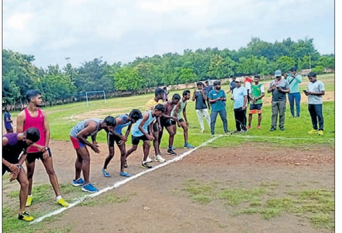
ଚୟନ ଶିବିରରେ ପ୍ରତିଯୋଗୀମାନେ ।