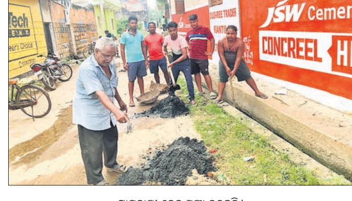
ଗ୍ରାମବାସୀ ଡ୍ରେନ୍ ସଫା କରୁଛନ୍ତି ।