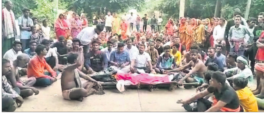
ଅଭିଯୁକ୍ତଙ୍କୁ ଗିରଫ ଦାବିରେ ସାହିବାସିଦା ମୁଦଦେହ ରଖି ରାସ୍ତାରେକୋ କରିଛନ୍ତି।