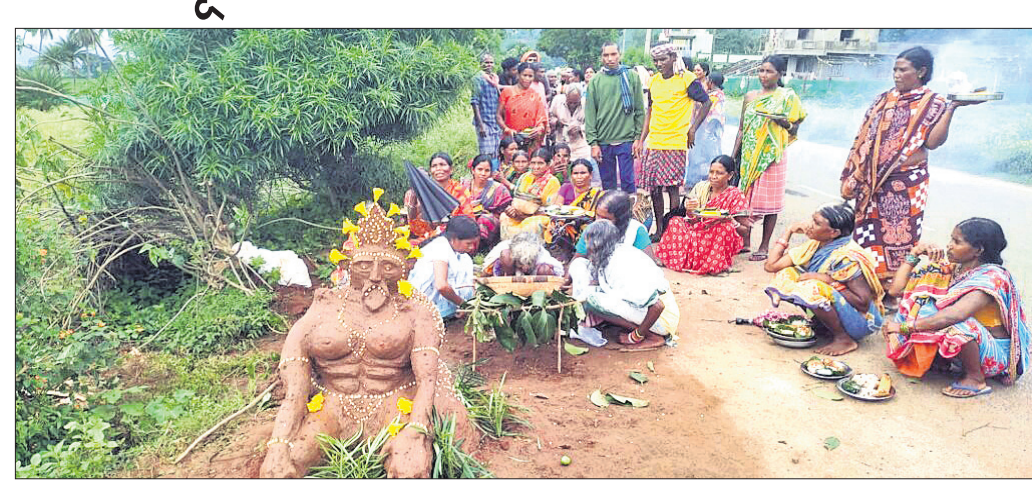
ମାଟିରେ ନିର୍ମିତ ରାକ୍ଷସ ମୂର୍ତ୍ତିକୁ ଆଦିବାସୀମାନେ ପୂଜାର୍ଚ୍ଚନା କରୁଛନ୍ତି ।