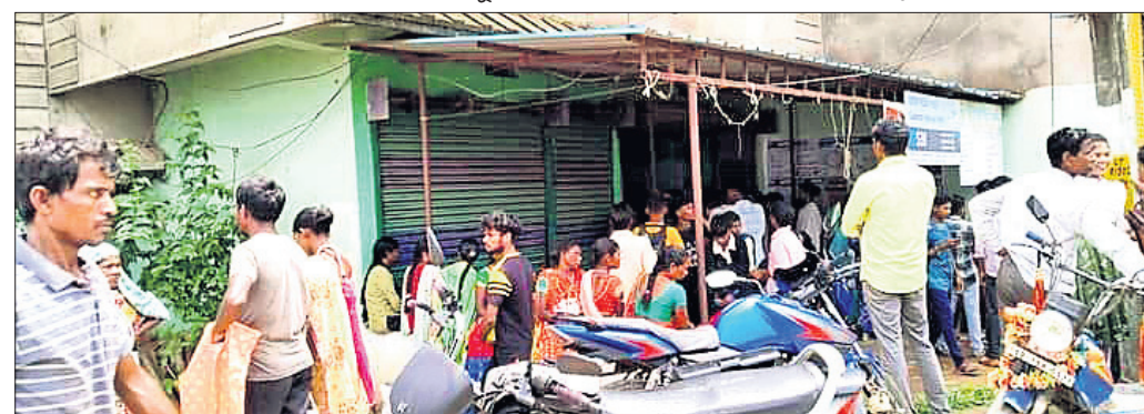
ପୁନିଗୁଡ଼ାରେ ଏକ ଜନସେବା କେନ୍ଦ୍ର ସମ୍ମୁଖରେ ମହିଳାଙ୍କ ଲମ୍ବା ଧାଡ଼ି ।