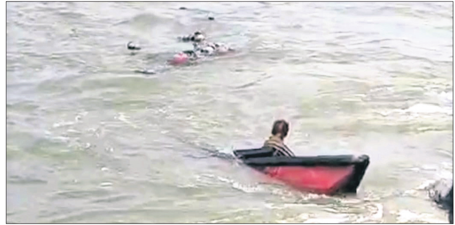
ମହାକାଳପଡ଼ା, ୧୧/୯ (ପ୍ରତାପ ଚନ୍ଦ୍ର ସାହୁ)