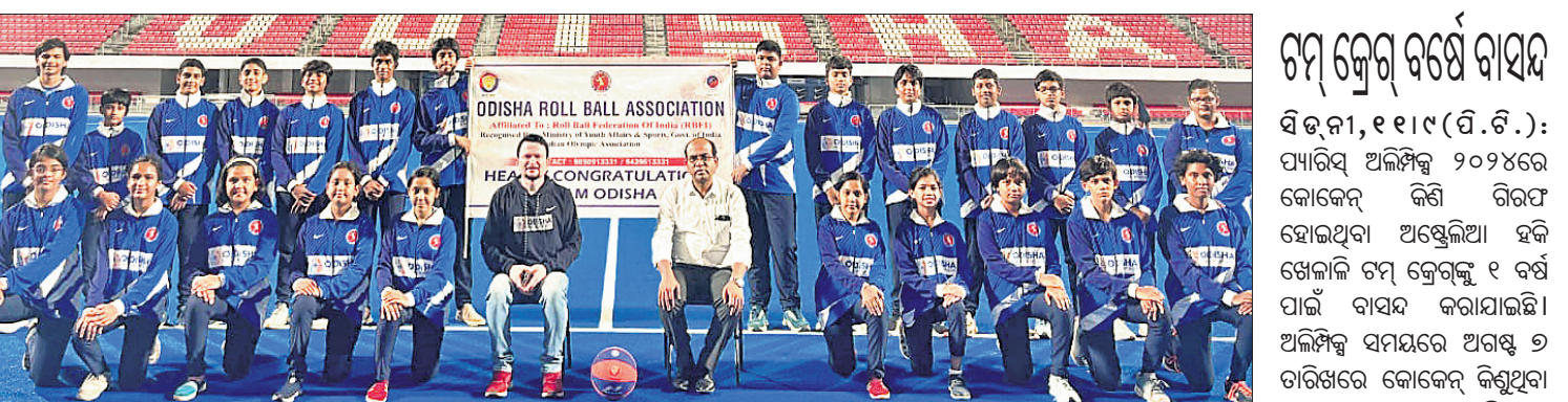
କଲିଙ୍ଗ ସ୍ପୋର୍ଟସ୍‌ମେନ୍ ଅନୁଷ୍ଠିତ ବିଦାୟା ଶୁଭେଚ୍ଛା କାର୍ଯ୍ୟକ୍ରମରେ ଅତିଥିକ ସହ ଜାତୀୟ ରୋଲ ବଲ୍ ପାଇଁ ମନୋନୀତ ଓଡ଼ିଶା ଦଳର ଖେଳାଳି।