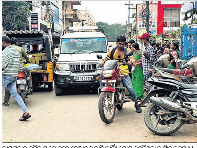
ରାୟଗଡ଼ାର କପିଳାସ ରୋଡ଼ରେ ବେଆଇନ ଗାଡ଼ି ପାର୍କିଂ ଯୋଗୁଁ ଉପସ୍ଥୁଥିବା ଗ୍ରାମିକ ସମସ୍ୟା ।