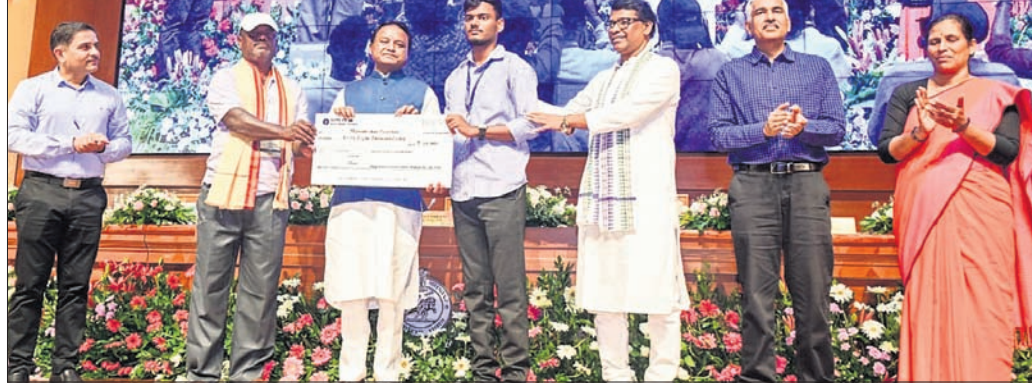
ଭୁବନେଶ୍ୱର, ୧୧୯୯ (ଅନିଲ ଦାସ)

ଦୁର୍ଭିକ୍ଷାଜନିତ ମୃତ୍ୟୁକାଳୀନ ସହାୟତା ରାଶି ୪ ଲକ୍ଷରୁ ହେଲା ୬ ଲକ୍ଷ