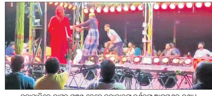
ନକ୍ସାପାଲିରେ ନାଟକ ମଞ୍ଚସ୍ତରରେ କଳାକାରଙ୍କୁ ଦର୍ଶକଙ୍କ ଆକ୍ରମଣର ଦୃଶ୍ୟ।

ସଂଲଗ୍ନ ଲିଲା ସଦର ଆନ ଅର୍ଚ୍ଚିତ ନକ୍ସାପାଲିରେ ରାଜ୍ୟର ଏକ ଅପେକ୍ଷା ଦକ୍ଷ ନାଟକ ପରିବେଷଣ କରୁଥିବା ବେଳେ ମଙ୍ଗଳବାର ଗଣଗୋଲିଆ ପରିସ୍ଥିତି ସୃଷ୍ଟି ହୋଇଥିଲା। ଖଳନାୟକଙ୍କ ନିଷ୍ଠା ଅଭିନୟ କେତେକ ଦର୍ଶକଙ୍କୁ ଉତ୍ସାହିତ କରିଥିଲା। କେତେକ ଦର୍ଶକ ମଞ୍ଚ ଉପରେ ଉଠିବାକୁ ଚାହୁଁଥିଲେ। ଜଣେ ଦର୍ଶକ ମଞ୍ଚକୁ ଚଢ଼ି ଉଠିବାକୁ ଚାହୁଁଥିଲେ। ସହ ଦକ୍ଷତାରେ ଆକ୍ରମଣ କରିଥିଲେ। ପରେ ଆୟୋଜକ ଏଥିରେ ହସ୍ତକ୍ଷେପ କରି ଉତ୍ତମ ଦର୍ଶକଙ୍କୁ ବୁଝାଶୁଣା କରିବା ପରେ ଉତ୍ତରଣ ପ୍ରଶଂସିତ ହୋଇଥିଲା ଏବଂ ନାଟକ ପୁଣି ଯଥାରୀତି ଚାଲିଥିଲା।