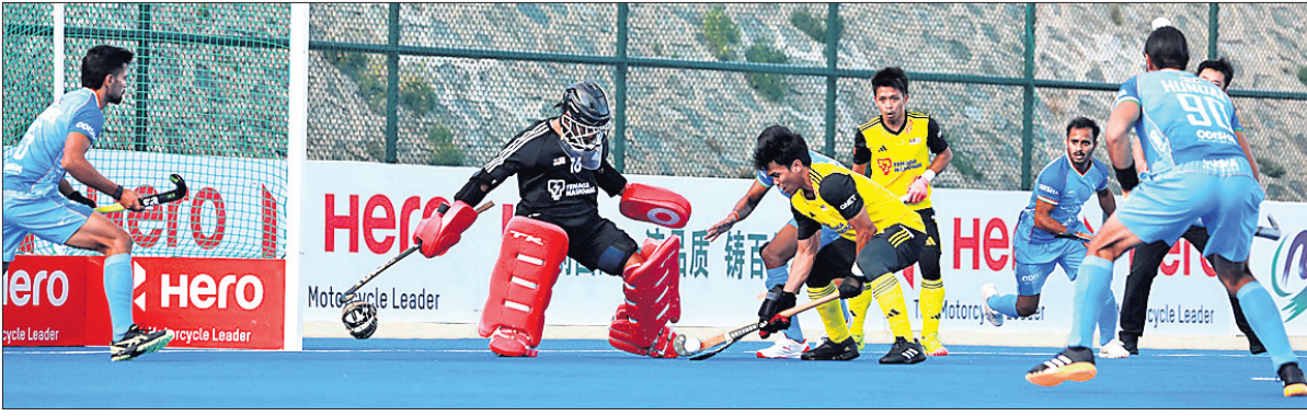
ଭାରତ ଓ ମାଲେସିଆ ମଧ୍ୟରେ ଅନୁଷ୍ଠିତ ମ୍ୟାଚ।

ହୁଲୁବୁଲୁର (ଗଜନା), ୧୧।୯ ଗୋଲକିପର ଭାବେ ଚଳିତ ସିନିଆର ଗୋଲକିପର ଗ୍ରୀଷ୍ମ ଋତୁରେ ପ୍ରବେଶ କରିଛନ୍ତି।