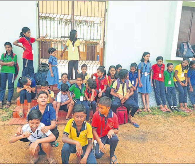
ସ୍କୁଲ ପାଠକରେ ତାଲା ପକାଇ ଛାତ୍ରଛାତ୍ରୀ ବସି ରହିଛନ୍ତି ।