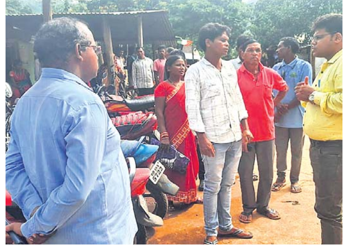
ଉପଜିଲ୍ଲାପାଳ ଆଲୋଚନା କରୁଛନ୍ତି।

ପାରଳାଖେମୁଣ୍ଡି/ନୂଆଗଡ଼, ୧୧/୯ (ଗିରିଧାରୀ ପରିକ୍ଷା/ ଯୋଗ୍ୟବନ୍ତ ପରିକ୍ଷା)