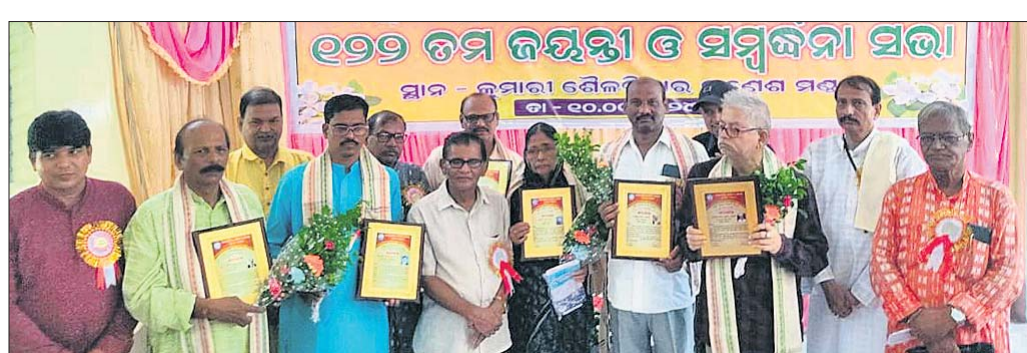
ଅତିଥିକ ଗହଣରେ ସମ୍ବର୍ଦ୍ଧିତ ପ୍ରତିଭା।