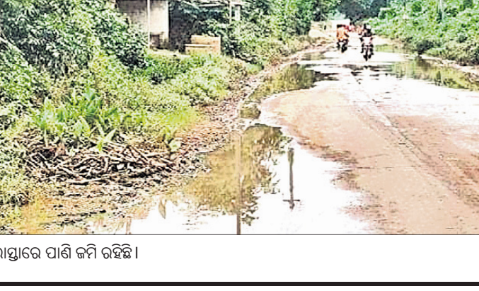
ରାସ୍ତାରେ ପାଣି ଜମି ରହିଛି ।

ଉନ୍ନତୀକରଣ ହୋଇପାରୁନାହିଁ । ମିନି ସ୍ୱିଡିଂମର ୩ଟି ପାର୍ଶ୍ୱ ପାରେ ନିର୍ମାଣ ହୋଇ ନ ଥିବାରୁ ସେହି ସ୍ଥାନ ଗୋରୁ ଓ ଅଧ୍ୟାପକ ବ୍ୟକ୍ତିଙ୍କ ଆଶ୍ରୟସ୍ଥଳୀ ପାଲଟିଛି । କଣ୍ଠିଲୋରେ ଏକ ଗ୍ରାହ୍ୟା ବ୍ୟବସ୍ଥା, ଚ୍ୟାନ୍ସିସ୍ତ୍ର ଓ ଯାତ୍ରା ବିଶ୍ରାମାଗାର ସହ କ୍ୟାମାସନ କାରିଗରମାନଙ୍କ ପାଇଁ ଏକ କଞ୍ଚାମାଲ୍ ତିଆରି ପ୍ରତିଷ୍ଠା ଲାଗି ଜିଲା ପ୍ରଶାସନ ଓ ରାଜ୍ୟ ସରକାର ଦୃଷ୍ଟି ଦେବାକୁ ଅଞ୍ଚଳବାସୀ ଦାବି କରୁଛନ୍ତି । ପ୍ରତିବର୍ଷ ମାଘମାସରେ ଶ୍ରୀନାମାଧ୍ୟାୟକ ମାଘମେଳା ଯାତ୍ରା ଅନୁଷ୍ଠିତ ହୋଇଥାଏ । ହେଲେ ମାଘମେଳା ପଡ଼ିଆକୁ ଯାନବାହନ ପାଇଁ ବ୍ୟବସ୍ଥା କରାଯାଇଥିବାରୁ ବିବାଦ ସୃଷ୍ଟି ହୋଇଛି । ସେହିପରି ଫାଣ୍ଡିଆନାର ମାନ୍ୟତା ପ୍ରଦାନ, ଗାଈପାଳକ ସାମଗ୍ରିକ ବିକାଶ ପାଇଁ ଦାବି ହେଉଛି । କଣ୍ଠିଲୋ ପୂର୍ବ ବିଭାଗ ପରିବର୍ତ୍ତନ ବଜାଳା ପରିସରରେ ପର୍ଯ୍ୟଟକମାନଙ୍କ ପାଇଁ ସମସ୍ତ ଆବଶ୍ୟକ ବ୍ୟବସ୍ଥା ଥାଇ ଏକାଧିକ ଶାନ୍ତତା ନିୟନ୍ତ୍ରିତ କକ୍ଷର ବ୍ୟବସ୍ଥା କରାଗଲେ ପର୍ଯ୍ୟଟକମାନେ ଉପକୃତ ହୋଇପାରିବେ ବୋଲି ସାଧାରଣରେ ମତ ପ୍ରକାଶ ପାଇଛି । ଅଧୋସ୍ଥିତ ବିଦ୍ୟୁତ୍ କାଟ ରୋକିବାକୁ ବି ଗୁରୁତ୍ୱ ଦେବାକୁ ଦାବି ହୋଇଛି ।