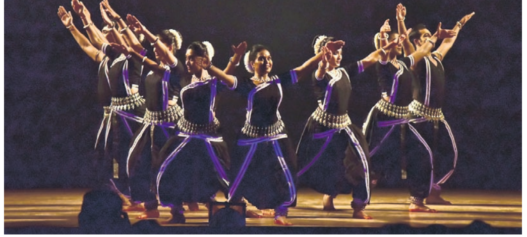
ସୁଜନ ଅନୁଷ୍ଠାନର ଶିଳ୍ପୀଙ୍କ ଦ୍ୱାରା ପରିବେଷିତ ଓଡ଼ିଶା ନୃତ୍ୟାଭିନୟ 'ତନ୍ତୁ'