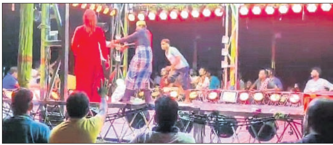
ନକ୍ସାପାଲିରେ ନାଟକ ମଞ୍ଚରୁ ବେଳେ କଳାକାରଙ୍କୁ ଦର୍ଶକଙ୍କ ଆକ୍ରମଣର ଦୃଶ୍ୟ।

ସମ୍ବଲପୁର ଜିଲ୍ଲା ସଦର ଥାନା ଅନ୍ତର୍ଗତ ନକ୍ସାପାଲିଠାରେ ରାଜ୍ୟର ଏକ ଅପେକ୍ଷା ଦକ ନାଟକ ପରିବେଷଣ କରୁଥିବା ବେଳେ ମଙ୍ଗଳବାର ଗଣେଶୋଷା ପରିସ୍ଥିତି ସୃଷ୍ଟି ହୋଇଥିଲା। ଖଳନାୟକଙ୍କ ନିଷ୍ଠା ଅଭିନୟ କେତେକ ଦର୍ଶକଙ୍କୁ ଉତ୍ସାହିତ କରିଥିଲା। କେତେକ ଦର୍ଶକ ମଞ୍ଚ ଉପରେ ଉଠିବାକୁ ଚାହୁଁଥିଲେ। ଜଣେ ଦର୍ଶକ ମଞ୍ଚକୁ ଚଢ଼ି ଉଠିବାକୁ ଚାହୁଁଥିଲେ। ସହାୟତା ପାଇଁ ନାଟକରୁ ଆକ୍ରମଣ କରିଥିଲେ। ପରେ ଆୟୋଜକ ଏଥିରେ ହସ୍ତକ୍ଷେପ କରି ଉତ୍ସାହିତ ଦର୍ଶକଙ୍କୁ ଚାହୁଁଥିଲେ। ଏହାସତ୍ତ୍ୱେ ପରେ ଉତ୍ସାହିତ ଦର୍ଶକମାନେ ମଞ୍ଚ ଉପରେ ଉଠିବାକୁ ଚାହୁଁଥିଲେ। ଏବଂ ନାଟକ ପୂର୍ଣ୍ଣ ଯଥାରୀତି ଚାଲିଥିଲା। ସୂଚନା ଅନୁସାରେ, ନକ୍ସାପାଲିଠାରେ ଗତ ଶୁକ୍ରବାରଠାରୁ ଏକ ଅପେକ୍ଷା ଯାତ୍ରା ପରିବେଷଣ କରୁଥିଲା। ଅତିନ ରଜନୀଙ୍କ 'ସ୍ୱାମୀ ପାଇଁ ପଛେ ନକଲୁ ଯିବି' ନାଟକ ଅଭିନୀତ ହେଉଥିଲା। ଏଥିରେ କର୍ତ୍ତବ୍ୟ କଳାକାରଙ୍କ ଜୀବନ୍ତ ଅଭିନୟରେ ଦର୍ଶକ ଭାବବିହୀନ ହୋଇ ପଡ଼ିଥିଲେ। ରାତ୍ର ପ୍ରାୟ ୨୮ଟାରେ ଧର୍ମାତ୍ମାଙ୍କୁ ନେଇ ଏକ ଦୃଶ୍ୟ ପ୍ରଦର୍ଶନ ହେଉଥିଲା। ଏହାକୁ ନେଇ