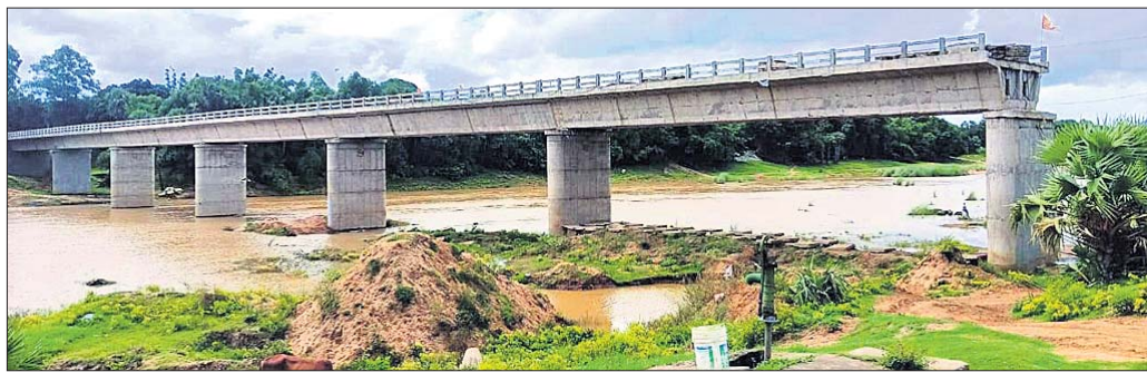
ଅସମ୍ପୂର୍ଣ୍ଣ ଅବସ୍ଥାରେ ଖାଲପଡ଼ା-ବ୍ରହ୍ମବରଦା ରାସ୍ତା।

ଯାଜପୁର ଜିଲ୍ଲାରେ ଗ୍ରାମ୍ୟ ନିର୍ମାଣ ଓ ନିର୍ମାଣ(ପୂର୍ବ) ବିଭାଗ ଦ୍ୱାରା ଚାଲିଥିବା ବିଭିନ୍ନ ଉନ୍ନୟନ କାର୍ଯ୍ୟ ପାଇଁ ଜମି ଅଧିଗ୍ରହଣ ନାମରେ ବ୍ୟାପକ ସରକାରୀ ଅର୍ଥ ବାଟୋରାଣା ହୋଇଛି। ବିଶେଷକରି ନିର୍ମାଣ ବିଭାଗରେ କେତେକ ଶିଳ୍ପୀଙ୍କୁ ଜମି ଅଧିଗ୍ରହଣ ଅନୁମତି ଦିଆଯାଇଛି। ୧୯୮୪ରୁ ଉନ୍ନୟନ କରି କେତେକ ଗ୍ରାମ୍ୟ ନିର୍ମାଣ ବିଭାଗରେ ଜମି ଅଧିଗ୍ରହଣ ହୋଇ ପାରୁ ନ ଥିବାରୁ ପ୍ରସ୍ତାବିତ ପ୍ରକଳ୍ପ କାର୍ଯ୍ୟରେ ବ୍ୟାଧି ପଡ଼ିଛି।