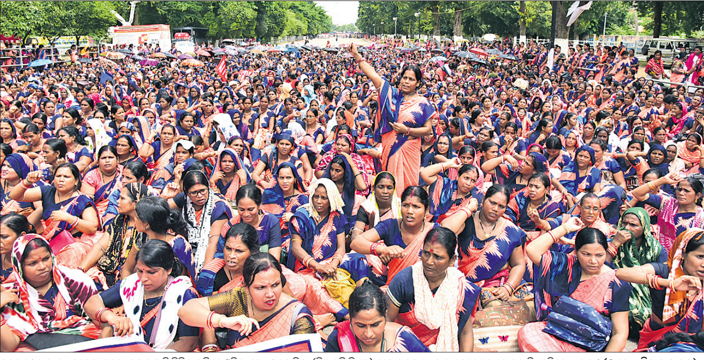
ସରକାରୀ ମାନ୍ୟତା, ବକେୟା ଦରମା ପ୍ରଦାନ ଆଦି ବିଭିନ୍ନ ଦାବିରେ ଓଡ଼ିଶା ଗୋଷ୍ଠୀ ସହାୟିକା (ସିଆର୍ପି ସିଏମ୍) ସଂଘ ପକ୍ଷରୁ ବୁଧବାର ଭୁବନେଶ୍ୱର ଲୋକସଭା ପିଏମ୍‌ଜିରେ ଧାରଣା।