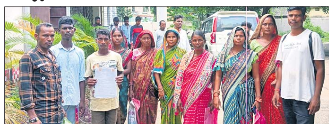
ତହସିଲଦାରଙ୍କୁ ଭେଟିବାକୁ ଆସିଥିବା ଗ୍ରାମବାସୀ।

ପାଣିକୋଇଲି, ୧୧୯ (ବିକାଶ ମଲିକ): କେବଳ ପ୍ରତିଷ୍ଠିତ ମିଳୁଛି। ସରକାର କୋରେଇ ବ୍ଲକ ଅନ୍ତର୍ଗତ ପଥରପଦା ପଞ୍ଚାୟତ ଚାକପୁର ଗ୍ରାମ(ଆଦିବାସୀ ସାହି)ରେ ଦୀର୍ଘ ବର୍ଷ ଧରି ଅନେକ ଆଦିବାସୀ ପରିବାର ବସବାସ କରୁଛନ୍ତି। ସେମାନଙ୍କ ମଧ୍ୟରୁ କେତେକ ଘରବାସି ପଞ୍ଚା ପାଇଥିଲେ ବି ଆହୁରି ଅନେକ ପଞ୍ଚା ପାଇନାହାନ୍ତି। ଫଳରେ ସେମାନେ ସରକାରୀ ସୁବିଧାକୁ ବଞ୍ଚିତ ହେଉଛନ୍ତି। ପଞ୍ଚା ମିଳିବା ପରିବର୍ତ୍ତେ