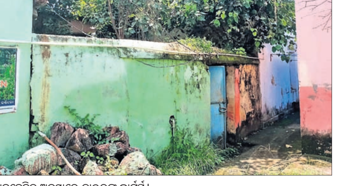
ଅବହେଳିତ ଅବସ୍ଥାରେ ଡାକ୍ତରଙ୍କ କ୍ୱାର୍ଟର ।

ଥିବାରୁ ତାହା ସରୀସୃପଙ୍କ ଆଶ୍ରୟସ୍ଥଳୀ ପାଲଟିଛି । ଘରର କବାଟ ଓରକା ସମ୍ପୂର୍ଣ୍ଣ ନଷ୍ଟ ହୋଇଯାଇଥିବା ବେଳେ ଘର କାନ୍ଧରେ ଫାଟ ସୃଷ୍ଟି ହୋଇଛି । ସେଥିପାଇଁ ମେଡିକାଲ ଅଫିସର ଅନାମ୍ନିତ ଭାବେ ଘରକୁ ଯିବା ପାଇଁ ଅସମର୍ଥ ହୋଇଛନ୍ତି । ଆବଶ୍ୟକ ଚିକିତ୍ସା ପ୍ରଦାନ ପାଇଁ ପରିଲକ୍ଷିତ ହେଉଛି । ଏ ସମ୍ପର୍କରେ ବିଭାଗୀୟ କର୍ତ୍ତୃପକ୍ଷଙ୍କୁ ବାରମ୍ବାର ଜଣାଇଥିଲେ ମଧ୍ୟ କୌଣସି ପଦକ୍ଷେପ ଗ୍ରହଣ କରାଯାଇନାହିଁ ।