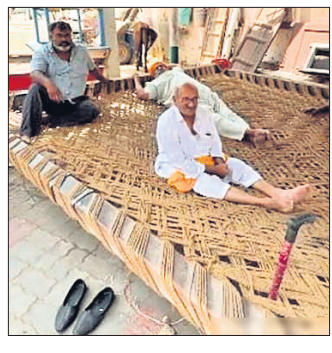
ଏକସଙ୍ଗେ ୧୦୦ରୁ ଅଧିକ ଲୋକ ଆରାମରେ ବିଶ୍ରାମ କରି ପାରିବେ । ୭୦ରୁ

ଅନୁସନ୍ଧ ପଞ୍ଚାବର ଅନୁସନ୍ଧରେ ଏକ ଖଟକୁ ନେଇ ଏବେ ଚର୍ଚ୍ଚା ଆରମ୍ଭ ହୋଇଛି । ଉକ୍ତ ଖଟରେ କେବଳ ୪ କିମ୍ବା ୫ ନୁହେଁ ବରଂ ୧୦୦ ଲୋକ ଆରାମରେ ବସିପାରିବେ । ଏହାର ଏକ ଭିଡିଓ ସୋସିଆଲ ମିଡିଆରେ ଭାଇରାଲ ହୋଇଛି । ଉକ୍ତ ଭିଡିଓରେ ବହୁ ସଂଖ୍ୟାରେ ଲୋକ ଖଟ ଉପରେ ବସିଥିବାର ଦେଖିବାକୁ ମିଳିଛି । ଭିଡିଓରେ ଜଣେ ବ୍ୟକ୍ତି କହିଛନ୍ତି, ଏହା ହେଉଛି ବିଶ୍ୱର ସବୁଠାରୁ ବଡ଼ ଖଟ । ଏହି ଖଟରେ