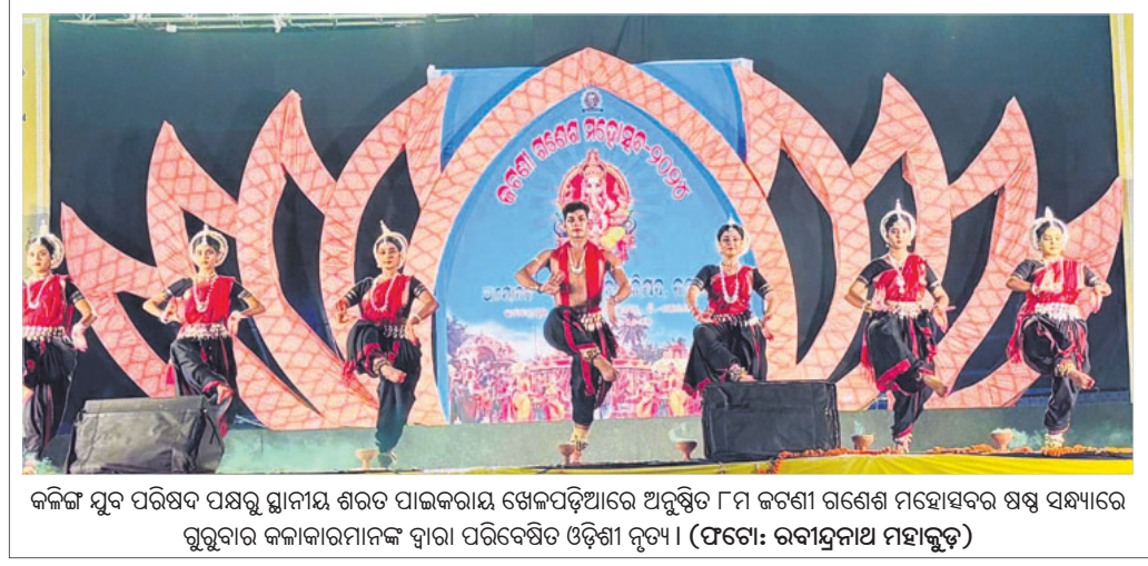
କଳିଙ୍ଗ ଯୁବ ପରିଷଦ ପକ୍ଷରୁ ସ୍ଥାନୀୟ ଶରତ ପାଇକରାୟ ଖେଳପଡ଼ିଆରେ ଅନୁଷ୍ଠିତ ୮ମ ଜଣେ ଗଣେଶ ମହୋତ୍ସବର ଷଷ୍ଠ ସନ୍ଧ୍ୟାରେ ଗୁରୁବାର କଳାକାରମାନଙ୍କ ଦ୍ୱାରା ପରିବେଷିତ ଓଡ଼ିଶୀ ନୃତ୍ୟ।

ଆଲୋଚନା କରିଥିଲେ। ଅତିରିକ୍ତ ଜିଲା ପ୍ରାଣୀ ଚିକିତ୍ସା ଅଧିକାରୀ ଡ. ସଞ୍ଜୀବନୀ ପଟେଲ ଜିଲା ପ୍ରାଣୀ ମଙ୍ଗଳ ସମିତି ଆନୁକୂଲ୍ୟରେ ଗାଳିଥିବା ବିଭିନ୍ନ ସରକାରୀ ଯୋଜନା ବିଷୟରେ ବିବରଣୀ ପ୍ରଦାନ କରିଥିଲେ। ଜିଲାର ପ୍ରତ୍ୟେକ ପଞ୍ଚାୟତରେ କୁଳା ଚୋରୁ ଏବଂ ବୁର୍ଗାଗାରେ ସମ୍ପୂର୍ଣ୍ଣ ହୋଇଥିବା ଚୋରୁଙ୍କ ଆଶ୍ରୟ ପାଇଁ ଗୋଶାଳା ପ୍ରତିଷ୍ଠା ହେବା ଦିଗରେ ଆଲୋଚନା ହୋଇଥିଲା। ଭୁବନେଶ୍ୱର ମହାନଗର ନିଗମ ଅନ୍ତର୍ଭୁକ୍ତ 'କୁଳା କୁଳୁର ବନ୍ଧ୍ୟାକରଣ' କାର୍ଯ୍ୟକ୍ରମ ସ୍ମରଣ ରହିଥିବା ଯୋଗୁ କୁଳା କୁଳୁରଙ୍କ ସଂଖ୍ୟା ବଢ଼ିଯିବା ନେଇ ସଦସ୍ୟମାନେ ଚିନ୍ତାପ୍ରକଟ