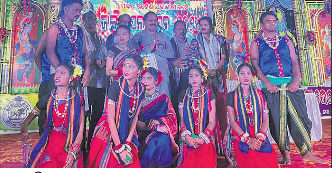
ନିରାକାରପୁର, ୧୨।୯ (ମାନସ ଚନ୍ଦ୍ର ପଟ୍ଟନାୟକ)

ଗଣେଶପୂଜା ଉପଲକ୍ଷେ ଜଳିଆ ଓଁଶ୍ରୀ ଗ୍ରୁପ୍ କମିଟି ପକ୍ଷରୁ ବାଲିଗାଡ଼ିଆସ୍ଥିତ ବାସନ୍ତୀ ପଡ଼ିଆଠାରେ ଗାଳିଥିବା ଜଳିଆ ପକ୍ଷୀ ଉତ୍ସବର ଗୁରୁବାର ଥିଲା ୬ଷ୍ଠ ସନ୍ଧ୍ୟା। ବଲାଙ୍ଗୀର କଳାକାରମାନଙ୍କ ତାଳଖାଲ