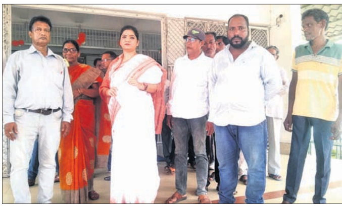
ଜିଲାପାଳଙ୍କୁ ଦାବିପତ୍ର ଦେବାକୁ ଆସିଥିବା ଗ୍ରାମବାସୀ।

■ ଜିଲାପାଳଙ୍କ ନିକଟରେ ଅଭିଯୋଗ କଲେ ଗ୍ରାମବାସୀ ■ କାର୍ଯ୍ୟାନୁଷ୍ଠାନ ନ ହେଲେ ରାସ୍ତା ଅବରୋଧ ଚେତାବନା