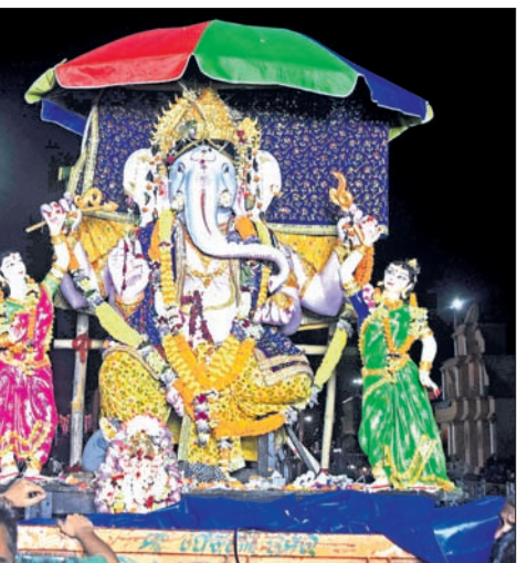
ପୁରୀ ସହରରେ ଶୁକ୍ରବାର ଆୟୋଜିତ ଗଣେଶ ଭବାଣି ଉତ୍ସବରେ ସାମିଲ ହୋଇଥିବା ମେଡ଼ ।