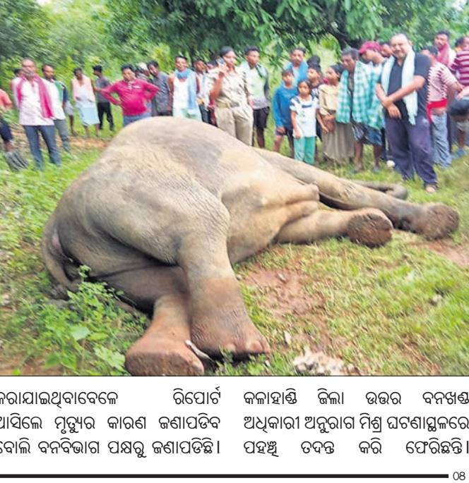
କରାଯାଇଥିବାବେଳେ ରିପୋର୍ଟ କରିବା ପରେ ବିଭାଗ କର୍ମଚାରୀ ଓ ଡାକ୍ତରୀ ଦଳ ପହଞ୍ଚି ତଦନ୍ତ କରିଛନ୍ତି। ମୃତ ମାଈ ହାତୀର ବୟସ ୮୦୦ ବର୍ଷ ମଧ୍ୟରେ ହେବ ବୋଲି ଅନୁମାନ କରାଯାଇଛି। ସେହିପରି ମୃତ ହାତୀର ପାଟି, ନାକ ଓ କାନରେ ଦାଗ ଥିବା ଦେଖିବାକୁ ମିଳିଥିଲା। କେଉଁ କାରଣରୁ ହାତୀର ମୃତ୍ୟୁ ହୋଇଛି ତାହା ଅସ୍ପଷ୍ଟ ରହିଛି। ଡାକ୍ତରୀ ଦଳ ପକ୍ଷରୁ ମୃତ ହାତୀର ବ୍ୟବହୃତ