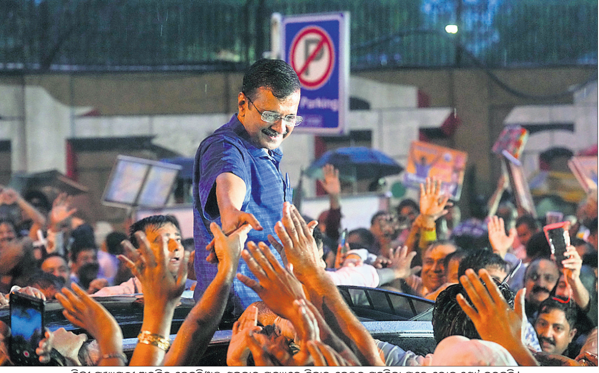
ଦିଲ୍ଲୀ ମୁଖ୍ୟମନ୍ତ୍ରୀ ଅରବିନ୍ଦ କେନ୍ଦ୍ରିତ୍ୱାଳ ଶୁକ୍ରବାର ସନ୍ଧ୍ୟାରେ ତିହାର କେଲରୁ ପୁକୁଲିବା ପରେ ରୋଡ୍ ଶୋ' କରୁଛନ୍ତି।

ପାଇଥିବାବେଳେ ଶୁକ୍ରବାର କେନ୍ଦ୍ରୀୟ ତଦନ୍ତ ବ୍ୟୁରୋ (ସିବିଆଇ) ମାମଲାରେ ସର୍ବୋଚ୍ଚ ଅଦାଲତ ତାଙ୍କୁ ଜାମିନ ଦେଇଛନ୍ତି। ଏଥିପ୍ରତି ସେ ତିହାର କେଲରୁ ମୁକ୍ତ ହୋଇଛନ୍ତି। ପୁକୁଲିବା ପରେ ନିଜ ପ୍ରଥମ ପ୍ରତିଦ୍ୱିତ୍ୟରେ କେନ୍ଦ୍ରିତ୍ୱାଳ ନିଜକୁ ନିର୍ଦ୍ଦୋଷ ଦର୍ଶାଇ କହିଛନ୍ତି, ଭାରତକୁ ଦୁର୍ବଳ କରିବାକୁ ଉଦ୍ୟମ ଚଳାଇଥିବା ଦେଶବିରୋଧୀ ଚରୁକ ବିରୋଧରେ ତାଙ୍କ ଲଢ଼େଇ କାରି ରହିବ। ଅକାରଣେ ଉଦ୍‌ଘୋଷଣା କରାଯାଇ ଏତେ ଦିନ କେଲରେ ରଖାଯିବା ଦ୍ୱାରା ତାଙ୍କର ସଂକଳ୍ପ ଆହୁରି ସ୍ପଷ୍ଟ ହୋଇଛି। ସୁପ୍ରିମକୋର୍ଟଙ୍କ ଜାମିନ ପରେ ଭାଜପାର ମିଛ ଧରାପଡ଼ିଯାଇଛି। ସିବିଆଇ-ଭିତ୍ତି ଭାଜପାର ଶୁଆ ଓ ଶାରୀ ବୋଲି ଆସ୍ ସମାଲୋଚନା କରିଛି। ୨୦୨୩ ଅକ୍ଟୋବରରେ ଅବକାରୀ ଦୁର୍ଗତି ମାମଲାରେ ଇତି ପକ୍ଷରୁ କେନ୍ଦ୍ରିତ୍ୱାଳଙ୍କୁ ପ୍ରଥମ ସମନ କରାଯାଇଥିଲା। ୬ ଥର ସମନ ସତ୍ତ୍ୱେ ସେ ଏହାକୁ କେନ୍ଦ୍ର ଷଡ଼ଯନ୍ତ୍ର ଦର୍ଶାଇ ପ୍ରବର୍ତ୍ତନ ନିର୍ଦ୍ଦେଶାଳୟରେ ହାଜର ହୋଇ ନ ଥିଲେ। ୨୦୨୪ ମାର୍ଚ୍ଚ ୧୬ରେ ଦିଲ୍ଲୀର ଏକ ସେସନ୍ସ କୋର୍ଟ ତାଙ୍କୁ ଜାମିନ ଦେଇଥିଲେ। ମାର୍ଚ୍ଚ ୨୧ରେ କେନ୍ଦ୍ରିତ୍ୱାଳ ଇତି ସମନକୁ ହାଇକୋର୍ଟରେ ଚ୍ୟାଲେଞ୍ଜ କରିଥିଲେ। ହାଇକୋର୍ଟ ତାଙ୍କୁ ପୁରୁଣା ଦେବାକୁ ମନା କରିବାରୁ ସେ ସୁପ୍ରିମକୋର୍ଟଙ୍କ ଦ୍ୱାରକୁ ହୋଇଥିଲେ। ଲଗାତର ୯ ଥର ସମନ ନିସ୍ୱ କରିବା ପରେ ସେହି ଦିନ ଇତି ତାଙ୍କୁ ଗିରଫ କରିଥିଲା। ଫ୍ରେସ୍‌ସ୍‌-୪