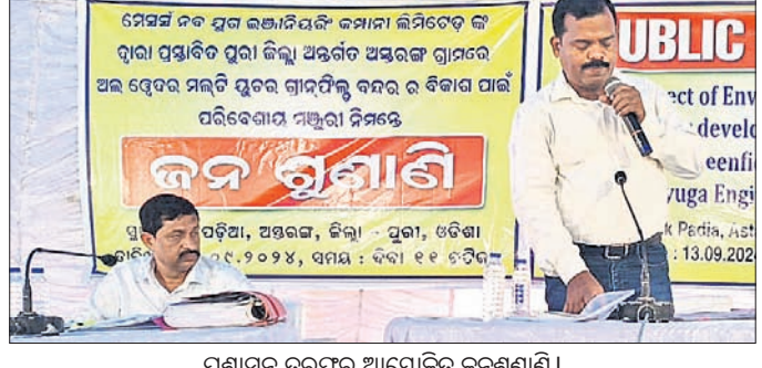
ପ୍ରଶାସନ ତରଫରୁ ଆୟୋଜିତ ଜନଶୁଣାଣି ।