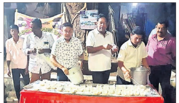
ଗଣେଶ ମେଳା ଅବସରରେ ସଭାଗଳି ଛକଠାରେ ଖୁରି ଭୋଗ ବିତରଣ କରାଯାଉଛି।