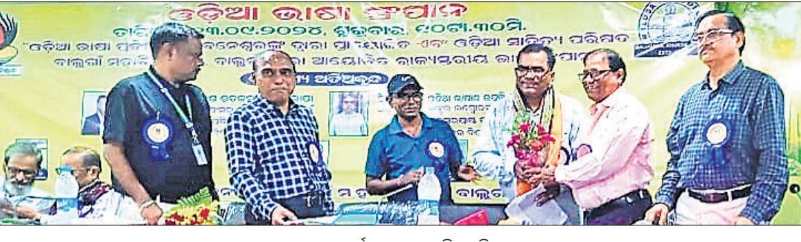
ରାଜ୍ୟସ୍ତରୀୟ ଭାଷା ସମ୍ମାନ କାର୍ଯ୍ୟକ୍ରମରେ ଉପସ୍ଥିତ ଅତିଥି ଏବଂ ଅନ୍ୟମାନେ।

ବାଲୁଗାଁ, ୧୩୯ (ସଂଗ୍ରାମ ପାଇକରାୟ) ଓଡ଼ିଆ ଭାଷା ପ୍ରତିଷ୍ଠାନ ଭୁବନେଶ୍ୱର ଏବଂ ବାଲୁଗାଁ ମହାବିଦ୍ୟାଳୟ ଓଡ଼ିଆ ସାହିତ୍ୟ ପରିଷଦର ନିର୍ଦ୍ଧାରିତ ଅନୁକ୍ରମରେ ଶୁକ୍ରବାର ମହାବିଦ୍ୟାଳୟ ପରିସରରେ ରାଜ୍ୟସ୍ତରୀୟ ଭାଷା ସମ୍ମାନ କାର୍ଯ୍ୟକ୍ରମ ଅନୁଷ୍ଠିତ ହୋଇଯାଇଛି।