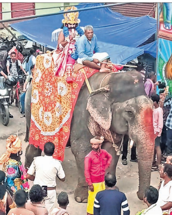
ଗଣେଶ ମେଳା ଅବସରରେ କଂସ ମହାରାଜା ସହର ପରିକ୍ରମା କରୁଛନ୍ତି।

କଳା ସଂସ୍କୃତିର ସହର ଦେବଗଡ଼ରେ ୧୯୪୯ରେ ବିକ୍ରମାକ ଶ୍ରୀଗଣେଶଙ୍କ ପୂଜା ଆରମ୍ଭ ହୋଇଥିଲା। ସେହି ସମୟରେ ପୂଜା ପାଇଁ ଗୁଣାୟ ବ୍ୟବସାୟୀମାନେ ଏକାଠି ହୋଇ ମାତ୍ର ଏକଶହ ଛବିଶ ଟଙ୍କା ସଂଗ୍ରହ କରି ପୂଜାକାର୍ଯ୍ୟ କରିଥିଲେ। ବର୍ତ୍ତମାନ ୫୦ ଲକ୍ଷରୁ ଊର୍ଦ୍ଧ୍ୱ ଟଙ୍କା ବ୍ୟୟ ଅଟକଳରେ ପୂଜା ହେଉଛି। ଆଜି ସେହି ଛୋଟଧରଣର ଗଣେଶ ପୂଜା ଭାଇଭାଉସ ପ୍ରତୀକ ତଥା ଜାତି, ଧର୍ମ, ବର୍ଣ୍ଣ ନିର୍ବିଶେଷରେ ସମଗ୍ର ଓଡ଼ିଶାରେ ଏହା ସାର୍ବଜନୀନ ରୂପ ପାଇ ଏକ ମେଳାରେ ପରିଣତ ହୋଇପାରିଛି।