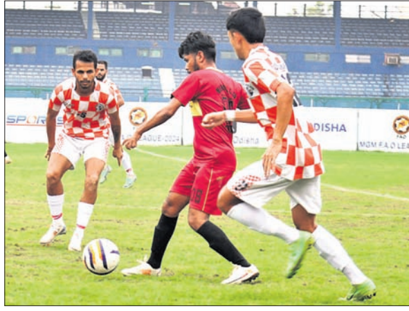
ରାଧାରମଣ ଓ ମନଜା କୁବ ମଧ୍ୟରେ ଅନୁଷ୍ଠିତ ମ୍ୟାଚ।