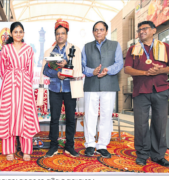
ଉଦ୍‌ଘାଟନୀ ଅବସରରେ ଅତିଥି ଓ ଅଧ୍ୟକ୍ଷମାନେ।