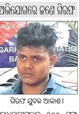
ଭୁବନେଶ୍ୱରରେ ଜଣେ ଗୁମାସ୍ତା