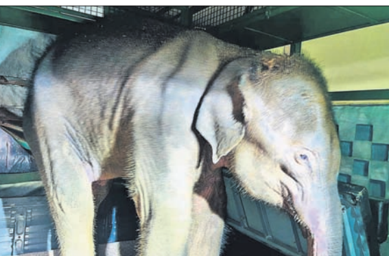
ଉଦ୍ଧାର ସମୟରେ ଛୁଆହାତୀ।

ଆଦେଶ ଦିଆଯାଇ ନ ଥିବା ସିଏସ୍ ଅତି ବେଳେ କାଣିବାକୁ ପାଇଛି। ହାତୀ ବନାବଳ ପ୍ରକାଶ ଅଧିକାରୀ ୧୯୭୨କୁ ଖୋଲାଖୋଲି ଭାବେ ଉଲ୍ଲେଖ କରାଯାଇଛି। କେବଳ ଆଠଗୋଟି କିମ୍ପା ତେଜାଣତ ନୁହେଁ, ଏହି କାରଣରୁ ୨୦୧୯ରୁ ୨୨ ମଧ୍ୟରେ ୩୭୯ଟି ବନଖଣ୍ଡରେ ୨୩୯ ହାତୀଙ୍କର ମୃତ୍ୟୁ ହୋଇଛି। ଜଙ୍ଗଲରେ ନିଆଁ ଲାଗୁଥିଲେ ମଧ୍ୟ ବନଖଣ୍ଡ ଅଧିକାରୀ କିମ୍ପା କର୍ମଚାରୀ ଘଟଣା ସ୍ଥଳକୁ ଯାଇ ନାହାନ୍ତି। ଯାହା ଫଳରେ ବନଖଣ୍ଡ ଭୂମିରେ ଅଗ୍ରାବଳ ଘଟଣା ବଢ଼ି ଯାଉଥିବା ସିଏସ୍ ରିପୋର୍ଟରେ ଉଲ୍ଲେଖ କରିଛନ୍ତି ସବୁଠାରୁ ଆଖ୍ୟାନ୍ତର କଥା ଯେ କାର୍ଯ୍ୟକ୍ରମ ନ ଥିବା ଉଚ୍ଚ ଶ୍ରେଣୀର ସମ୍ପଦ ଗଠନ ଏବଂ ଉଚ୍ଚ ଶ୍ରେଣୀର କିମ୍ପା ଯୋଗୁଁ ମଧ୍ୟ ବନାବଳ ହୋଇଛି। ଆଠଗୋଟି ଜଙ୍ଗଲରେ ବନ କର୍ମଚାରୀଙ୍କ ପାଇଁ କିଛି କାମ ଦେଇ ନ ଥିଲା। ଏବଂ ୪୯୯ ହାତୀଙ୍କର ମୃତ୍ୟୁ ହୋଇଛି। ଏବଂ ୪୯୯ ହାତୀଙ୍କର ମୃତ୍ୟୁ ହୋଇଛି। ଏବଂ ୪୯୯ ହାତୀଙ୍କର ମୃତ୍ୟୁ ହୋଇଛି।