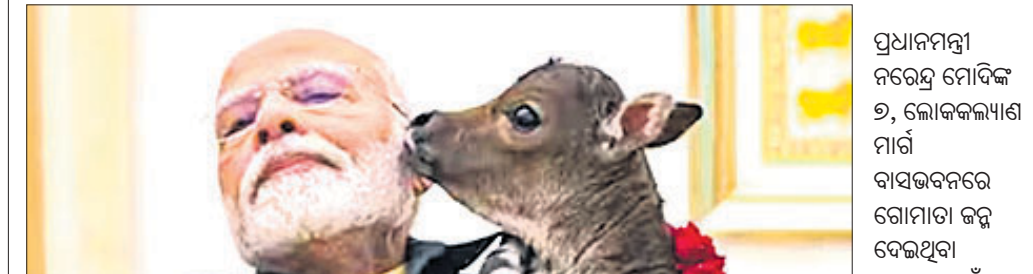
ପ୍ରଧାନମନ୍ତ୍ରୀ ନରେନ୍ଦ୍ର ମୋଦିଙ୍କ ୬, ଲୋକକଲ୍ୟାଣ ମାର୍ଚ୍ଚ ବାସଭବନରେ ରୋମାଞ୍ଚା ଜନ୍ମ ଦେଇଥିବା ବାଲୁରାୟ ନାଁ ଦାଦିଜ୍ୟୋତି ରଖାଯାଇଛି। ମୋଦି ଉଚ୍ଚ ବାଲୁରାୟ ସହ ସମୟ ବିତାଉଥିବାର ଛିଡ଼ି ଶନିବାର ଏକ୍ସ୍‌ରେ ଶେୟାର କରିଛନ୍ତି।

କେନ୍ଦ୍ରୀୟ କୋଲକାତାର ଗ୍ରେଡମାନ୍ ଷ୍ଟ୍ରିଟ୍ ଏବଂ ଏସ୍‌ଏନ୍ ବାନାର୍ଜୀ ରୋଡ୍‌ରେ ଶନିବାର ଅପରାହ୍ନରେ ବିସ୍ଫୋରଣ ଘଟି ଜଣେ ୫୮ ବର୍ଷୀୟ ଜରି ରୋଗାଳି ଆହତ ହୋଇଛନ୍ତି। ପୋଲିସ୍ ଉଚ୍ଚ ଅଞ୍ଚଳକୁ ଚାରିପଟୁ ଘେରାବନ୍ଦୀ କରି ତଦନ୍ତ ଚଳାଇଛି। ବୋମା ଚିହ୍ନ ଓ ନିଷ୍ଠିୟକାରୀ ସ୍ଫାଡ୍ ଘଟଣାସ୍ଥଳରେ ପହଞ୍ଚି ଅନୁଧ୍ୟାନ ଚଳାଇଥିଲେ। ସେଠାରେ ଅଧିକ ବୋମା ନ ଥିବା ଜଣାପଡ଼ିବା ପରେ ଗାଡ଼ି ଚଳାଚଳ ସ୍ଵାଭାବିକ ହୋଇଛି। ପୋଲିସ୍‌ମାନଙ୍କୁ ବିସ୍ଫୋରଣର କାରଣ ଓ କି ପ୍ରକାର ବିସ୍ଫୋରଣ ଥିଲା, ତାହାର ଅନୁଧ୍ୟାନ କରୁଛି। ଜାତୀୟ ତଦନ୍ତକାରୀ ଟିମ୍ (ଏନ୍‌ଆଇଏ) ଘଟଣାରେ ତଦନ୍ତ କରିବାକୁ ଭାଙ୍ଗିବା ନେତା ତଥା କେନ୍ଦ୍ରମନ୍ତ୍ରୀ ସୁଜାତା ମଲ୍ଲିକଙ୍କ ଦାବି କରିଛନ୍ତି।