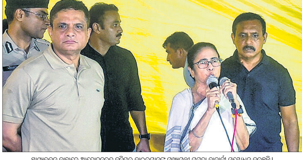
ସ୍ୱାସ୍ଥ୍ୟଭବନ ବାହାରେ ଆନ୍ଦୋଳନରତ କୁନିୟର ତାନ୍ତ୍ରମାନଙ୍କୁ ପୁଖ୍ୟମନ୍ତ୍ରୀ ମମତା ବାନାର୍ଜୀ ସମ୍ବୋଧନ କରୁଛନ୍ତି।

କୋଲକାତା, ୧୫। (ପି.ଟି.) ଚନ୍ଦ୍ର ମହାଲା ଡାକ୍ତରଙ୍କୁ ବଳାଙ୍ଗୀର ଓ ହତ୍ୟା ପ୍ରତିବାଦରେ ପଶ୍ଚିମବଙ୍ଗର କୁନିୟର ତାନ୍ତ୍ରମାନେ ମାସେଇ ଉର୍ଦ୍ଧ୍ୱ ହେଲା କାର୍ଯ୍ୟକ୍ରମ ଆନ୍ଦୋଳନ ଚଳାଇଥିବାବେଳେ ଆତଙ୍କବାଦୀ ଅଟଳଙ୍କୁ ପୁରୀ ପାଇଁ ପୁଖ୍ୟମନ୍ତ୍ରୀ ମମତା ବାନାର୍ଜୀ ଶନିବାର ଅପରାହ୍ନରେ ଅନାମକ ଆନ୍ଦୋଳନ ସ୍ଥଳରେ ପହଞ୍ଚିଥିଲେ। ଶେଷ ଉଦ୍ୟମ ସ୍ୱରୂପ ପୁଖ୍ୟମନ୍ତ୍ରୀ ସେମାନଙ୍କ ନିକଟରେ ପହଞ୍ଚିବାବେଳେ ପୁରୀ ପାଇଁ ପ୍ରତିଷ୍ଠିତ ଦେବା ସହ ଦୋଷୀଙ୍କ ବିରୋଧରେ ଆନ୍ଦୋଳନ ଆରମ୍ଭ କରିଥିଲେ।