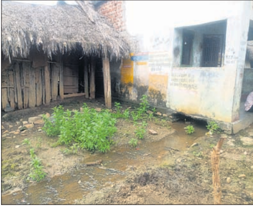
ସାମ୍ବ୍ୟ କାନ୍ଥ ତଳେ ଗୋବର ଓ କାନ୍ଥୁଅ ପାଣି ଜମି ରହିଛି ।

ପରିବେଶ ସଫାସୁତରା ରହିଲେ ଲୋକମାନେ ନିରୋଗ ରହିବେ । ତେଣୁ ଗାଁଠାରୁ ଆରମ୍ଭ କରି ସହରକୁ ସ୍ୱଚ୍ଛ ରଖିବା ପାଇଁ ସରକାର ଗାଁ କଲ୍ୟାଣ ସମିତି ଗଠନ କରିଛନ୍ତି । ପଞ୍ଚାୟତ, ବ୍ଲକ ଅଞ୍ଚଳକୁ ସ୍ୱଚ୍ଛତା କାର୍ଯ୍ୟକ୍ରମରେ ସାମିଲ କରିବା ପାଇଁ ସରକାର ଅନେକ କୋଟି ଟଙ୍କା ବ୍ୟୟ କରୁଛନ୍ତି । ଗାଁ କଲ୍ୟାଣ ସମିତି ଯୋଜନାରେ ଗାଁ ସଫାସୁତରା , ସାମ୍ବ୍ୟ ସଚେତନା ଆଦି କରାଯିବ । ପାଇଁ ପ୍ରତି ଚା'ର ପ୍ରଭାବ ଦେଖିବାକୁ ମିଳୁନାହିଁ ।