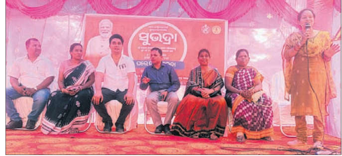
ସଚେତନତା କାର୍ଯ୍ୟକ୍ରମରେ ମଞ୍ଚାସୀନ ଅତିଥି।