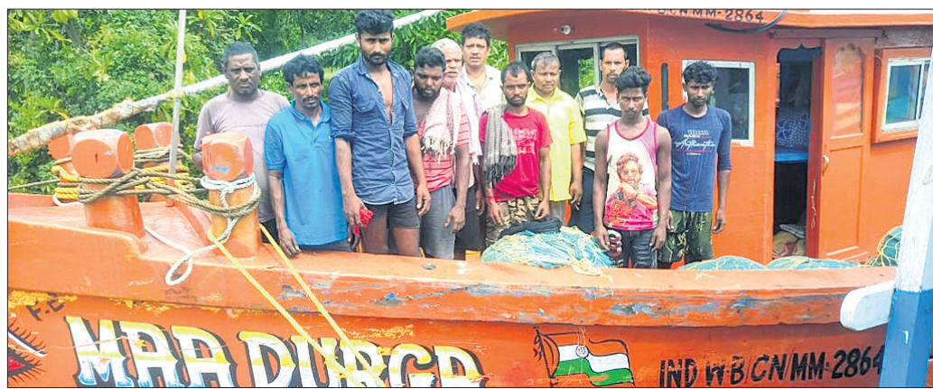
ଗହୀରମଥା ସାମୁଦ୍ରିକ ଅଭୟାରଣ୍ୟ ଅଞ୍ଚଳକୁ ଜବତ ଗ୍ରାମର ସହ ମହାଜୀବୀ।

ମହାକାଳପଡ଼ା/ବାକନଗର, ୧୫୯ (ପ୍ରତାପ ଚନ୍ଦ୍ର ସାହୁ/ଭାବନ ରାଉତରାୟ) କେନ୍ଦ୍ରାପଡ଼ା ଜିଲ୍ଲା ମହାକାଳପଡ଼ା ବ୍ଲକ୍ ଗହୀରମଥା ସାମୁଦ୍ରିକ ଅଭୟାରଣ୍ୟ ଅଞ୍ଚଳରେ ଗ୍ରାମର ମାଲିକମାନଙ୍କ ଉପଦ୍ରବ ବୁଦ୍ଧି ପାଇବାରେ ଲାଗିଛି।