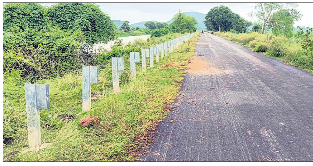
ଚଞ୍ଚିଖୋଲ, ୧୫୯ (ପ୍ରସାଦ ପ୍ରସାଦ ପୃଷ୍ଠି)

ଗରବାଟିଆ ପୂର୍ବ ବିଭାଗ ଡିଭିଜନ ଅଧୀନ ବଡ଼ଚଣା ଉପଖଣ୍ଡରେ ରହିଛି ଦେବା-ଚଞ୍ଚିଖୋଲ ରାସ୍ତା। ଏହି ରାସ୍ତାର ଦେବାଠାରୁ ଖଜୁରା ପର୍ଯ୍ୟନ୍ତ ରାସ୍ତା ପାର୍ଶ୍ୱରେ ମେଟାଲ ଜୁଣ ବାରିଅର ଲାଗୁଛି। ଗତ କିଛି ଦିନ ହେବ ଏହି କାର୍ଯ୍ୟ ଆରମ୍ଭ ହୋଇଥିବାବେଳେ ଶନିବାର ରାତିରେ ଦୁର୍ଘଟ ଏହାକୁ କାଟି ନେଇଥିଲେ।