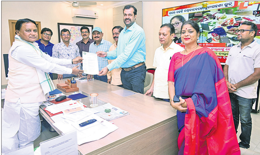
ପୁଖ୍ୟମନ୍ତ୍ରୀଙ୍କୁ ଭେଟି ଦାବିପତ୍ର ପ୍ରଦାନ କରୁଛନ୍ତି ଓସ୍ତା କର୍ମକର୍ମା।