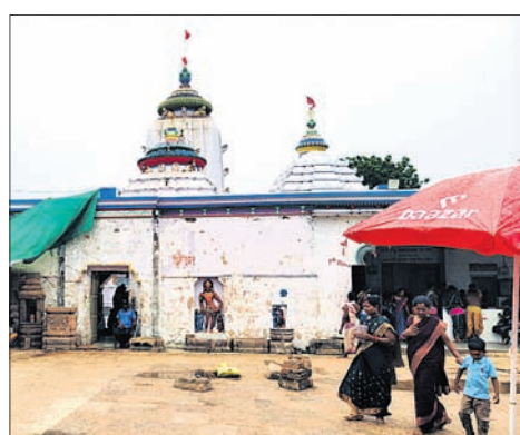
ବିରଜା ମନ୍ଦିର ।

ଦେଶରେ ଥିବା ଦୁର୍ଗା ବିଗ୍ରହମାନଙ୍କ ମଧ୍ୟରେ ଯାଜପୁରର ମା' ବିରଜାଙ୍କ ମୂର୍ତ୍ତି ଅନ୍ୟତମ ପ୍ରାଚୀନ ବୋଲି ବିଶ୍ୱାସ ରହିଛି । ଅଥଚ ବିରଜାଙ୍କ ମନ୍ଦିରର ବାହ୍ୟ ଓ ଭିତର ପାର୍ଶ୍ୱ ପରିସର ଏବେ ଜରାଜୀର୍ଣ୍ଣ ଅବସ୍ଥାରେ ପଡ଼ିରହିଛି । ଗତ ୫ ବର୍ଷ ହେବ ମନ୍ଦିରର ଉନ୍ନତୀକରଣ ଓ ସୌନ୍ଦର୍ଯ୍ୟକରଣ କାର୍ଯ୍ୟ ଆରମ୍ଭ ହୋଇଥିଲେ ବି ଏଯାବତ୍ ବୃତ୍ତାନ୍ତ ରୂପରେଖ ପାଇପାରୁ ନାହିଁ । ଛୋଟବଡ଼ ପ୍ରାୟ ୧୫ଟି ପ୍ରକଳ୍ପ ଆଧାପତ୍ତରିଆ ଅବସ୍ଥାରେ ରହିଥିବାରୁ ଭକ୍ତଙ୍କ ମହଲରେ ପୁରାଣ ପ୍ରସିଦ୍ଧ ଏହି କ୍ଷେତ୍ରର ଗରିମା ଶ୍ରୀହୀନ ଭଳି ମନେହୋଇଛି । ଆଖିନିକରେ ଦୁର୍ଗାପୂଜା ଅବସରରେ ମା' ବିରଜାଙ୍କ ମୂଖ୍ୟ ପର୍ବ ପାଳିତ ହୋଇଥାଏ । ଚଳିତ ବର୍ଷ ଦୁର୍ଗାପୂଜା ପାଖେଇ ଆସୁଥିବାବେଳେ ମନ୍ଦିର ପରିସରରେ ଆଧାପତ୍ତରିଆ ପ୍ରକଳ୍ପକୁ ଦେଖିଲେ ଯାଜପୁରର ଇତିହାସ ଓ ସଂସ୍କୃତି ଅଣଦେଖା କରାଯାଉଥିବା ମତପ୍ରକାଶ ପାଇଛି । ମନ୍ଦିରର ତୃତୀୟ ପର୍ଯ୍ୟାୟ ପ୍ରକଳ୍ପକୁ ପାଇଁ ପ୍ରାୟ ୫୦