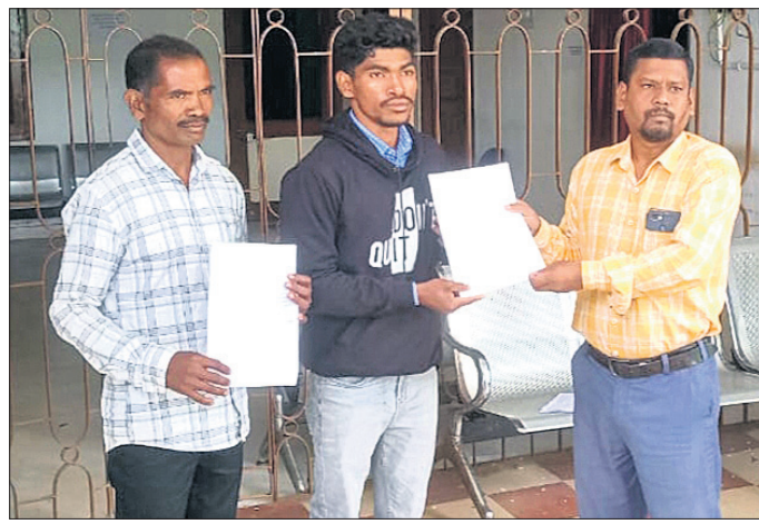
ତହସିଲଦାର ଦରଖାସ୍ତ ଗ୍ରହଣ କରୁଛନ୍ତି।