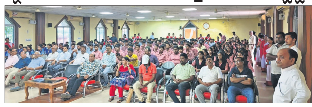
କାର୍ଯ୍ୟକ୍ରମରେ ଯୋଗଦେଇଥିବା ଅତିଥି ଓ ଛାତ୍ରାଛାତ୍ରୀ ।