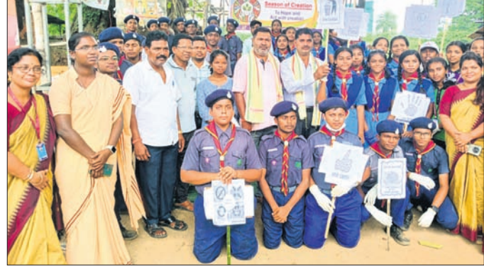
ଅତିଥିକ ସହ ଛାତ୍ରଛାତ୍ରୀମାନେ।