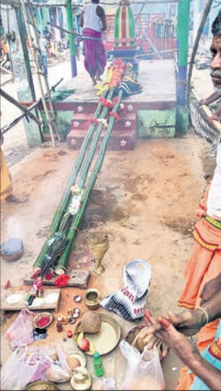
ଦେବାଙ୍କୁ ଆବାହନ କରାଯାଇଥିଲା।

ପ୍ରତିବର୍ଷ ଭଲ ଚଳିତ ବର୍ଷ ମଧ୍ୟ ବେଳଗୁଣା କୁଳ ଗାଙ୍ଗପୁର ଗ୍ରାମରେ କୃଷିଭିତ୍ତିକ ପର୍ବ ନଳଯାତ୍ରା ପାଳିତ ହୋଇଯାଇଛି।