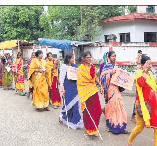
ପଦଯାତ୍ରା ସହର ପରିକ୍ରମା କରୁଛି।