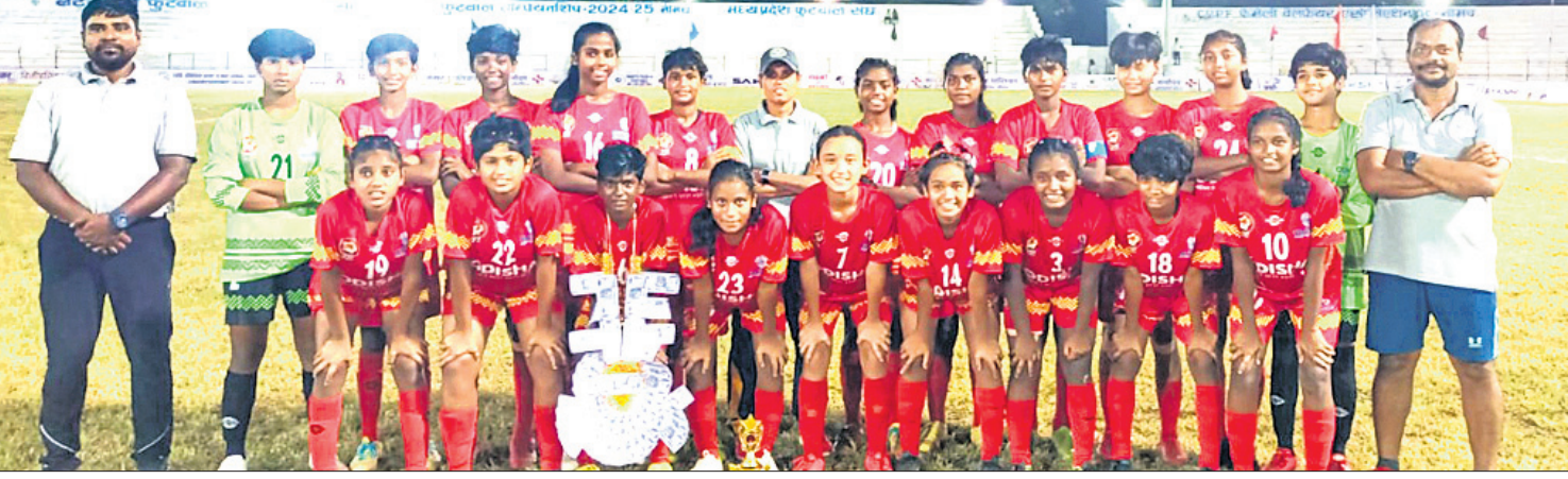
ସେମିଫାଇନାଲରେ ବିଜୟୀ ଓଡ଼ିଶା ବାଲିକା ଦଳ।

ଉପସ୍ଥାପନ କରିଥିଲେ। ୨୯ ତମ ମିନିଟରେ କେରଳର ଏ. ତାଥା ଏକ ଆମ୍ବୁଡା ଗୋଲ ଦେଇଥିଲେ। ପ୍ରଥମାର୍ଦ୍ଧ ଶେଷ ହେବା ସୁଦ୍ଧା ଓଡ଼ିଶା ୩-୦ରେ ଆଗୁଆ