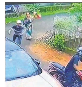
ସୁନାଚେନ ଖିମ୍ବେନବାର ସିପିଡିଏ ଫୁଟେକ୍ ଫେରୁଥିବାବେଳେ କଳା ରଙ୍ଗର ପଲସରରେ ୨ ଜଣ ଦୁର୍ଭିକ୍ଷ ଛକି ରହିଥିଲେ।

ମହିଳାଙ୍କ ବେକରୁ ସୁନା ଚେନ୍ଦ୍ର ଛିଣ୍ଡାଲ ନେଇ ଦୁର୍ଭିକ୍ଷ ଫେରାର ହୋଇଯାଇଛନ୍ତି। ତମାଣ୍ଡୋ ଥାନା ଅନ୍ତର୍ଗତ କଳିଙ୍ଗ ବିହାର କେ-୪ ଅଞ୍ଚଳରେ ଜଣେ ବୟସ୍କ ମହିଳା ଚାଲି ଚାଲି ଯାଉଥିବା ବେଳେ ବୁଲୁଣେ ଲୁଚେରା କଳା ପଲସରରେ ଆସି ଏହି କାଣ୍ଡ ଘଟାଇଛନ୍ତି।