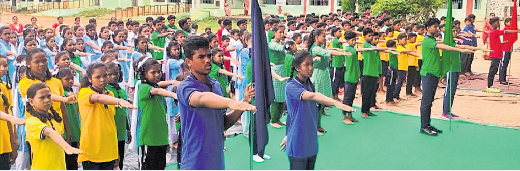
ସାରଳାଖେମୁଣ୍ଡି, ୧୫୯ (ବିଧିଧାରୀ ପରିଚା)