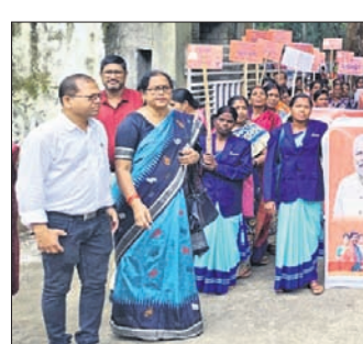
ପୁଲବାଣୀରେ ବାହାରିଥିବା ଶୋଭାଯାତ୍ରା।

ସୁଭଦ୍ରା ଯୋଜନା ସମ୍ପର୍କରେ ସଚେତନତା ସୃଷ୍ଟି କରିବା ଉଦ୍ଦେଶ୍ୟରେ ରବିବାର କିଳା ଓ କୁଳସ୍ତରରେ ସୁଭଦ୍ରା ସାଗର ପଦଯାତ୍ରା କରାଯାଇଛି।