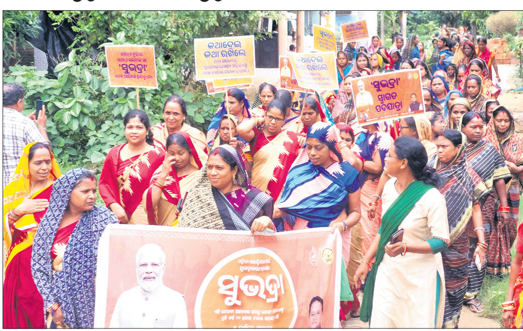
ସୁଭଦ୍ରା ପଦଯାତ୍ରାରେ ସାମିଲ ହୋଇଥିବା ମହିଳାମାନେ।

ରଘୁଲପୁର, ୧୫୯ (ରଞ୍ଜିତ ରାଉତ) ରଘୁଲପୁର ବ୍ଲକ ଅଧୀନ ୨୮ ପଞ୍ଚାୟତରେ ସୁଭଦ୍ରା ପଦଯାତ୍ରା ସଚେତନତା ସଚେତନତା ଆବେଦନକାରୀ ଗାଁଗାଁ ବୁଲି ଯୋଜନାର ସଫଳତା ବଖାଣିଛନ୍ତି। ସ୍ୱୟଂସହାୟିକା ଗୋଷ୍ଠୀର ମହିଳାମାନେ ଯୋଜନା ଉପରେ ଆଧାରିତ ସଂଗୀତ ଗାନ କରିବା ସହ ବିଭିନ୍ନ ସ୍ଲୋଗାନ ଦେଇଛନ୍ତି। ଯୋଜନାକୁ ସଫଳ ଭାବରେ କୁପାୟନ କରିବା ପାଇଁ ମହିଳାମାନଙ୍କୁ ନିୟୋଜିତ କରାଯାଇଛି। ଆବେଦନକାରୀଙ୍କ ଜମାଖାତାକୁ ଶନିବାର ରାତିରେ ୧୧ଟି ଲେଖାଏ ଆସିଛି। ସେପ୍ଟେମ୍ବର ୧୭ରେ ପ୍ରଧାନମନ୍ତ୍ରୀ ଓଡ଼ିଶା ଗସ୍ତରେ ଆସୁଛନ୍ତି। ସେହି ଦିନ ସଫଳ ଭାବରେ ପଞ୍ଚାୟତରାଜ କମିଟିର ସଭାକୁ ମହିଳାଙ୍କ ଜମାଖାତାକୁ ପ୍ରଥମକ୍ରମେ ୫୫ଟି ଟଙ୍କା ପ୍ରଦାନ କରାଯିବ ବୋଲି ସୂଚନା ଦିଆଯାଇଛି। ରବିବାର ପଞ୍ଚାୟତରାଜ ବ୍ଲକ ଶୋଭାଯାତ୍ରା ଅନୁଷ୍ଠିତ ହୋଇଯାଇଛି। ଆବେଦନକାରୀ ଗାଁଗାଁ ବୁଲି ଯୋଜନାର ସଫଳତା ବଖାଣିଛନ୍ତି। ସ୍ୱୟଂସହାୟିକା ଗୋଷ୍ଠୀର ମହିଳାମାନେ ଯୋଜନା ଉପରେ ଆଧାରିତ ସଂଗୀତ ଗାନ କରିବା ସହ ବିଭିନ୍ନ ସ୍ଲୋଗାନ ଦେଇଛନ୍ତି। ଯୋଜନାକୁ ସଫଳ ଭାବରେ କୁପାୟନ କରିବା ପାଇଁ ମହିଳାମାନଙ୍କୁ ନିୟୋଜିତ କରାଯାଇଛି। ଆବେଦନକାରୀଙ୍କ ଜମାଖାତାକୁ ଶନିବାର ରାତିରେ ୧୧ଟି ଲେଖାଏ ଆସିଛି। ସେପ୍ଟେମ୍ବର ୧୭ରେ ପ୍ରଧାନମନ୍ତ୍ରୀ ଓଡ଼ିଶା ଗସ୍ତରେ ଆସୁଛନ୍ତି। ସେହି ଦିନ ସଫଳ ଭାବରେ