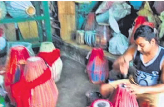
ଗୋପରେ ବାଦ୍ୟ ଯନ୍ତ୍ର ନିର୍ମାଣ ଚାଲିଛି ।