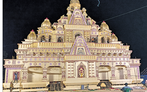
ପାରାଦୀପରେ ବିଶ୍ୱକର୍ମା ପୂଜା ଲାଗି ନିର୍ମାଣାଧୀନ ଚୋରଣ ।

ପାରାଦୀପ, ୧୫।୯ (ଶରତ ରାଉତ) ପାରାଦୀପର ଅନ୍ୟତମ ଗଣପତି ବିଶ୍ୱକର୍ମା ପୂଜା ମହୋତ୍ସବ ଘୋମବାରଠାରୁ ଆରମ୍ଭ ହେଉଛି । ପାରାଦୀପ ବଡ଼ପଡ଼ିଆ ଥାନା ଛକଠାରୁ ବ୍ୟାଙ୍କ ଛକ ଓ ନୂଆବଜାର ହୋଟେଲ ଛକ ପର୍ଯ୍ୟନ୍ତ ସୁଜଳ ଏବଂ ଆକର୍ଷଣୀୟ ୧୪ ମେଡ଼ ହୋଇଛି । ଚଳିତବର୍ଷ ସବୁ ଆୟୋଜକ ମଣ୍ଡପ କରିଛନ୍ତି । ଗତ ୪ବର୍ଷ ହେଲା ପୂଜା ଆୟୋଜକ ଅଧା ହେଉଥିଲା । ୨୦୨୦ରୁ ୨୦୨୨ ପର୍ଯ୍ୟନ୍ତ ୩ବର୍ଷ କରୋନା କଟକଣା ଯୋଗୁଁ ବନ୍ଦ ଥିଲା । ଗତବର୍ଷ ଅର୍ଦ୍ଧଧିକ