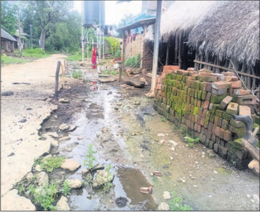
ଡ୍ରେନର ପକ୍ କାନ୍ଥୁଅ ଭିତରେ ନଳକୂଅ ।