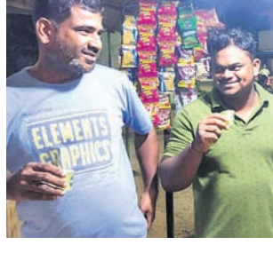
ଭୁବନେଶ୍ୱର, ୧୫୯୯ (ବନ୍ଦନା ସେଠା)

କଟକଣା ପରେ ବି ନିର୍ଦ୍ଦେଶ ମାନୁନାହାନ୍ତି ଦୋକାନୀ