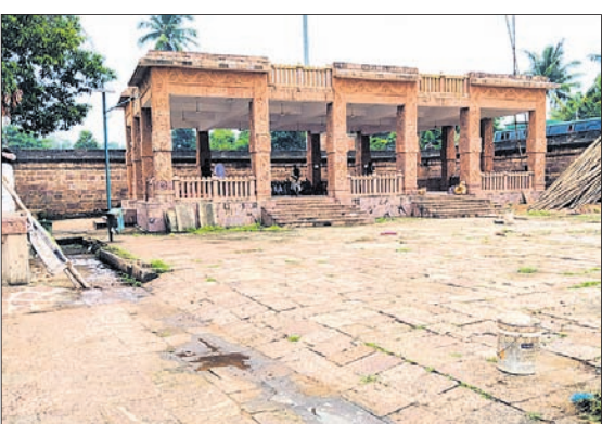
ସୌନ୍ଦର୍ଯ୍ୟକରଣ କାର୍ଯ୍ୟ ଆଧାରେ ଅଟକି ରହିଛି ।

କୋଟି ଟଙ୍କା ଖର୍ଚ୍ଚ ନ ହୋଇ ପଡ଼ିରହିଛି ବୋଲି ପୂଜକମାନଙ୍କ ମୁହଁରୁ ପୂରଣା ମିଳିଛି । ଏଥିରେ ହସ୍ତମାନଙ୍କ ବିଗ୍ରହ ଓ ବାମ୍ପ ସ୍ଥାନାନ୍ତର, ଚଳ ଫ୍ଲୋରିଂ, ଦୀପ ସ୍ଥାପନ, ରୋଷ ଘର, ପଞ୍ଚାକରଣ କେନ୍ଦ୍ର ଘର ଇତ୍ୟାଦି ପ୍ରକଳ୍ପ ଆରମ୍ଭ ହୋଇପାରିନାହିଁ । ଏଥିପାଇଁ ବୁଦ୍ଧଧର ଚେଣ୍ଡର ହୋଇଥିଲେ ହେଁ ତାହା ରାଜନୈତିକ ହସ୍ତକ୍ଷେପ ଯୋଗୁଁ ସଫଳ ହୋଇପାରିନାହିଁ ବୋଲି ମନ୍ଦିର ସେବକଙ୍କଠାରୁ ଜଣାପଡ଼ିଛି । ସେହିପରି ବାହାର ପାର୍ଶ୍ୱରେ ୨ଟି ଶୈବାଳୟ, ୬୦ଟି