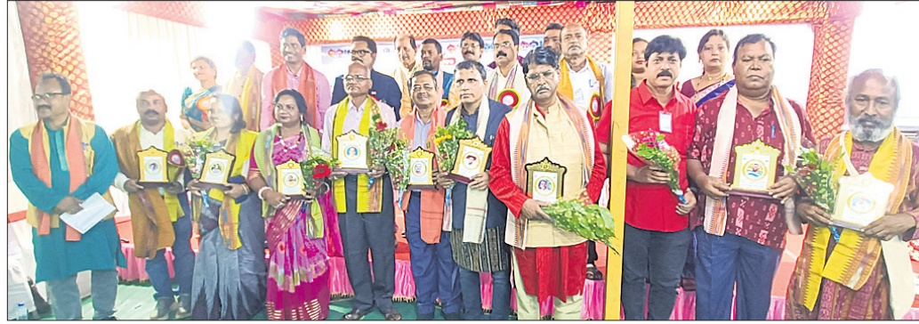
ଅତିଥିକ ଗହଣରେ ଉପସ୍ଥିତ ଥିବା ସମ୍ପର୍କିତ ପ୍ରତିଭା।

କନ୍ୟାମାଳିକା ଦାରିଙ୍ଗବାଡ଼ିର ଏକ କଲ୍ୟାଣ ମଣ୍ଡଳରେ ରବିବାର 'ମେଘ ଉତ୍ସବ-୨୦୨୪' ଅନୁଷ୍ଠିତ ହୋଇଛି।