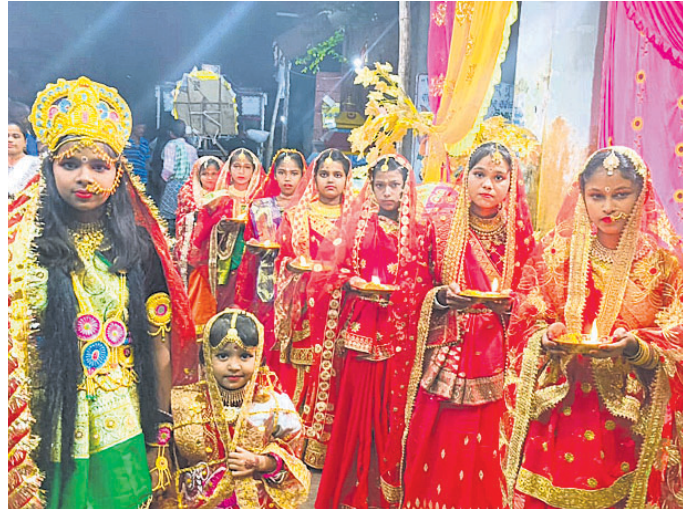
ଶୋଭାଯାତ୍ରାରେ ସାମିଲ ହୋଇଥିବା ଯୁବତୀ ।