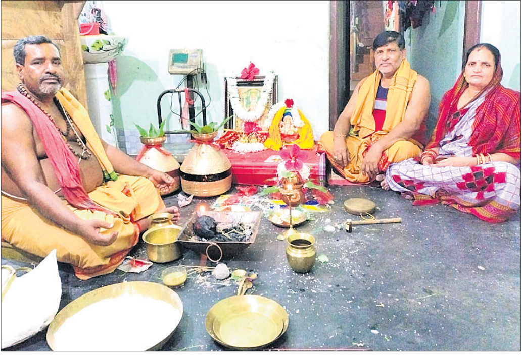
କଣ୍ଠିଲୋର ଏକ ପରିବାରରେ ସୁନିଆ ପୂଜା କରାଯାଉଛି।