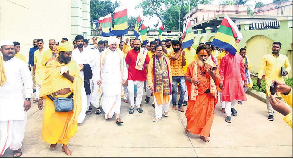
ଶ୍ରୀକ୍ଷେତ୍ରରେ ବିଶ୍ୱ ସାଧୁସଭା ମହାସମ୍ମିଳନୀ: ରବିବାର ସାଧୁସଭାମାନେ ସମ୍ମିଳନୀ ସ୍ଥଳକୁ ଯାଉଛନ୍ତି ।