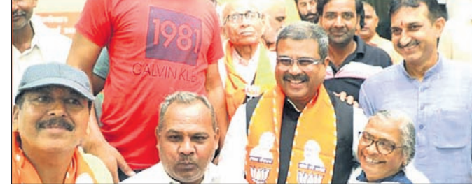
ହରିୟାଣାରେ କର୍ମାଣ୍ଡଳୀରେ ଭାଜପା ନିର୍ବାଚନ ପ୍ରଭାବୀ ତଥା କେନ୍ଦ୍ରମନ୍ତ୍ରୀ ଧର୍ମେନ୍ଦ୍ର ପ୍ରଧାନ ଓ ଅନ୍ୟମାନେ।

ମୂଲ୍ୟ (ଏମ୍ଏସ୍‌ସି)ର ଗ୍ୟାରେଣ୍ଟି ଦେବାରେ ହରିୟାଣା ହେଉଛି ପ୍ରଥମ ରାଜ୍ୟ। ଭାଜପା ସରକାରରେ ଏହି ରାଜ୍ୟରେ ଯୁବବର୍ଗଙ୍କ ସ୍ୱାର୍ଥକୁ ପ୍ରାଧିକ୍ୟ ଦିଆଯାଇ ସେମାନଙ୍କୁ ସରକାରୀ ଚାକିରି ପ୍ରଦାନ କରାଯାଇଛି। ଗୋଟିଏପଡେ ସୈନୀ ସରକାର ଚାଷୀଙ୍କ ସ୍ୱାର୍ଥ ପାଇଁ ଚିନ୍ତା କରୁଥିବାବେଳେ ଅନ୍ୟପକ୍ଷରେ କଂଗ୍ରେସର ବାପପୁଅଙ୍କ ଶାସନରେ ଚାଷୀଙ୍କ ଚାଷଜମି ଦଖଲ ଯୋଜନା ହୋଇଛି। ଯେଉଁମାନେ ଏମ୍ଏସ୍‌ସି ନିର୍ଦ୍ଦେଶ ଚାଷୀଙ୍କୁ ଠକିଆଁତି ସେମାନେ କେବେ ବି ନିଜ ସରକାରରେ ଗ୍ୟାରେଣ୍ଟି ପୁରଣ କରି ନାହିଁ। କଂଗ୍ରେସଠାରୁ ଜନତା କେବଳ ମିଛର ଗ୍ୟାରେଣ୍ଟି ପାଇଥାନ୍ତି। ହରିୟାଣାର ସଚେତନ ଓ ସ୍ୱାଭିମାନୀ ନେଇ ଆଲୋଚନା କରିଥିଲେ। ଏହି ଅବସରରେ ଧର୍ମେନ୍ଦ୍ର କହିଥିଲେ, ହରିୟାଣାରେ ଭାଜପା ବିଜୟର ହାତ୍ରିକ କରିବାକୁ ଯାଉଛି। ଦିଗତ ୧୦ ବର୍ଷରେ ରାଜ୍ୟରେ ଅନେକ ବିକାଶମୂଳକ କାର୍ଯ୍ୟ ହୋଇଛି। ଭାଜପା ନିରନ୍ତର ହରିୟାଣାର ନାୟବ ସିଂହ ସୈନୀ ପ୍ରତ୍ୟେକ ବର୍ଷ କଲ୍ୟାଣ ପାଇଁ ଦୂରଦୃଷ୍ଟିସମ୍ପନ୍ନ ନିଷ୍ପତ୍ତି ନେଉଛନ୍ତି। କୃଷକମାନଙ୍କୁ ସମସ୍ତ କୃଷି ସାମଗ୍ରୀ ଉପରେ ସର୍ବନିମ୍ନ ସହାୟକ