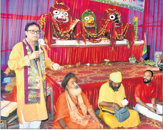
କାର୍ଯ୍ୟକ୍ରମରେ ମଞ୍ଚାଧୀନ ଅତିଥି ।