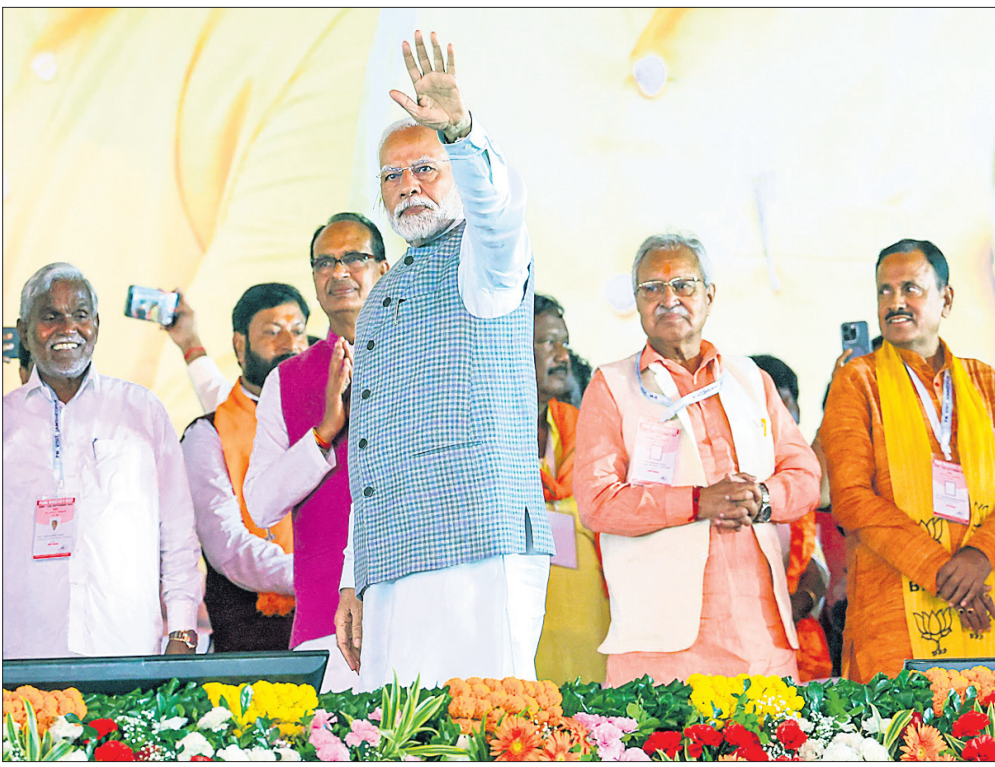
ଝାଡ଼ଖଣ୍ଡର କାମସେବପୁର ଅନ୍ତର୍ଗତ ଗୋପାଳ ମଜଦାନରେ ଭାଜପା ପରିବର୍ତ୍ତନ ମହାରାଜିରେ ପ୍ରଧାନମନ୍ତ୍ରୀ ନରେନ୍ଦ୍ର ମୋଦିଙ୍କ ସହ ଭାଜପା ନେତା ତଥା ପୂର୍ବତନ ମୁଖ୍ୟମନ୍ତ୍ରୀ ଚମ୍ପା ଘୋରେନ୍, କେନ୍ଦ୍ରମନ୍ତ୍ରୀ ଶିବରାଜ ସିଂହ ତୋହାନ ଓ ଅନ୍ୟ ନେତାମାନେ। ସ୍ତ୍ରୋତକୁ ଆଶିବାକୁ ବଞ୍ଚିତ କରିଛି। ଜେଏମ୍ଏମ୍ ଆଦିବାସୀଙ୍କ ଭୋଟ ବଳରେ କ୍ଷମତାକୁ ଆସିବା ପରେ ସେମାନଙ୍କ ଜମି ଓ ଜଙ୍ଗଲ ହତ୍ୟା କରୁଥିବା ଶକ୍ତି ଦ୍ୱାରା ସେମାନଙ୍କଠାରୁ ଦୂରେଇ ଯାଇଛି। ଦଳିତ, ପଞ୍ଚୁଆବର୍ଗ ଓ ଆଦିବାସୀଙ୍କ ପରିବର୍ତ୍ତେ ଜେଏମ୍ଏମ୍ ଭୋଟବ୍ୟାଙ୍କ ରାଜନୀତି ଚଳାଇଥିବା ପ୍ରଧାନମନ୍ତ୍ରୀ କହିଛନ୍ତି।

କରୁଛନ୍ତି। ଝାଡ଼ଖଣ୍ଡର ପ୍ରତ୍ୟେକ ବାସିନ୍ଦା ନିଜକୁ ଅସୁରକ୍ଷିତ ମଣୁଥିବା ପ୍ରଧାନମନ୍ତ୍ରୀ କହିଛନ୍ତି। ଭୋଟ ପାଇଁ ଅନୁପ୍ରବେଶକାରୀଙ୍କୁ ଜେଏମ୍ଏମ୍ ସମର୍ଥନ କରୁଛି। ଏହି ବେଆଇନ ପ୍ରବାସୀମାନେ ରାଜ୍ୟର ଶାସକ ଦଳ ଉପରେ ପ୍ରଭାବ ବିସ୍ତାର କରିଛନ୍ତି। କ୍ଷମତାଲିପୁ ଜେଏମ୍ଏମ୍, ଆରକେଡି ଏବଂ କଂଗ୍ରେସ ଝାଡ଼ଖଣ୍ଡର ବଡ଼ ଶତ୍ରୁ ବୋଲି ମୋଦି କହିଛନ୍ତି। ଆରକେଡି ଝାଡ଼ଖଣ୍ଡ ରାଜ୍ୟ ଗଠନର ପ୍ରତିଶୋଧ ନେଉଥିବାବେଳେ କଂଗ୍ରେସ ଉଚ୍ଚ ରାଜ୍ୟକୁ ଦୁର୍ଗା କରିବା ସହ ଆଦିବାସୀମାନଙ୍କୁ ମୁଖ୍ୟ