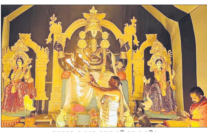
ଗଣେଶଙ୍କ ପାଖରେ ମହାଆଳତି କରାଯାଉଛି। ୧୦୮ ମହାଆଳତି ଆକର୍ଷଣୀୟ ଥିଲା। ଏଥି ସହିତ ଗ୍ଳାନୀୟ ଥାନା ଛକଠାରେ ଏକ ରଙ୍ଗାରଙ୍ଗ କାର୍ଯ୍ୟକ୍ରମରେ ସମାଜର

କଟଣା, ୧୫୯ (ରବୀନ୍ଦ୍ରନାଥ ମହାକୁଡ଼) ପ୍ରସିଦ୍ଧ ଜଟଣୀ ଗଣେଶ ପୂଜାର ରବିବାର ନବମ ଦିବସରେ ବିଭିନ୍ନ ପୂଜା ମଣ୍ଡପରେ ୧୦୮ ମହାଆଳତି ଅନୁଷ୍ଠିତ ହୋଇଯାଇଛି। ସମସ୍ତ ପୂଜା ମଣ୍ଡପ ଗୁଡ଼ିକରେ ଆଧ୍ୟାତ୍ମିକ ପରିବେଶ ସୃଷ୍ଟି ହୋଇଥିଲା। ଘଣ୍ଟା ଘଣ୍ଟା, ଆଳତି ଗାମର, ହୁଳହୁଳି ଶଙ୍ଖନାଦରେ ସମଗ୍ର ଅଞ୍ଚଳ ପ୍ରକଳ୍ପିତ ହୋଇଥିଲା। ବିଶେଷ କରି ସିଧେଶ୍ୱର ପୂଜା କର୍ମ, ମଧୁସୂଦନ ନଗର, ପ୍ରେମ୍ଭୂଷ କୁବ, ରେତଙ୍ଗ କଲୋନା ପୂଜା କର୍ମିତ ପକ୍ଷରୁ ଅନୁଷ୍ଠିତ