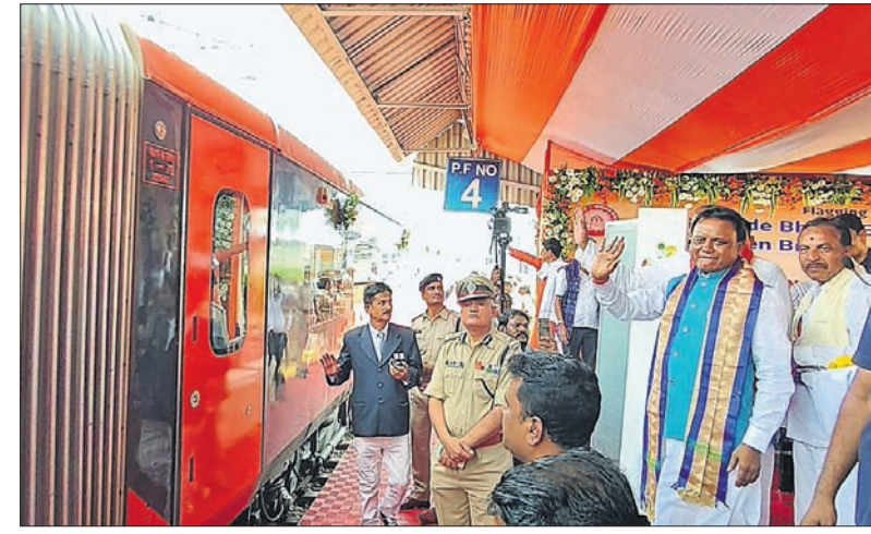
ବନ୍ଦେ ଭାରତ ଏକ୍ସପ୍ରେସ୍ ଚଳାଚଳର ଶୁଭାରମ୍ଭ ଅବସରରେ ବ୍ରହ୍ମପୁର ରେଳ ଷ୍ଟେସନରେ ମୁଖ୍ୟମନ୍ତ୍ରୀ ମୋହନ ଚରଣ ମାଝୀ ଯାତ୍ରୀମାନଙ୍କୁ ହାତ ଦେଖାଇ ଶୁଭେଚ୍ଛା ଜଣାଉଛନ୍ତି (ବାମ)। ରାଉରକେଲାଠାରେ ଆୟୋଜିତ କାର୍ଯ୍ୟକ୍ରମରେ ରାଜ୍ୟପାଳ ରଘୁବର ଦାସ, କେନ୍ଦ୍ର ମନ୍ତ୍ରୀ କୁଲଦି ଓରାମ ଓ ଅନ୍ୟମାନେ।

ପ୍ରଧାନମନ୍ତ୍ରୀ ନରେନ୍ଦ୍ର ମୋଦି ଭୃତ୍ୟାଲ ମୋଡ଼ରେ ବନ୍ଦେ ଭାରତ ଏକ୍ସପ୍ରେସ୍ ଶୁଭାରମ୍ଭ କରି ଓଡ଼ିଶାକୁ ଆଉ ୨ଟି ଟ୍ରେନ୍ ଦେଇଛନ୍ତି। ବ୍ରହ୍ମପୁରରୁ ଗାଟା ନଗର ଏବଂ ରାଉରକେଲାକୁ ହାଡ଼ିଗୁଡ଼ା ଏହି ଟ୍ରେନ୍ ଚଳାଚଳ କରିବ। ଏହି ନୂତନ ଏକ୍ସପ୍ରେସ୍ ଟ୍ରେନ୍‌ରୁ ଦକ୍ଷିଣ ଓଡ଼ିଶା ଓ ପଶ୍ଚିମ ଓଡ଼ିଶାବାସୀଙ୍କ ପାଇଁ ଲାଇଫ୍‌ଲାଇନ୍ ସାଜିବ ବୋଲି ଉଦ୍ଧାର ମୁଖ୍ୟମନ୍ତ୍ରୀ ମୋହନ ଚରଣ ମାଝୀ କହିଛନ୍ତି।