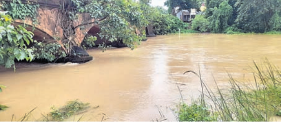
ବାଲେଶ୍ୱର, ୧୫:୯(ବାସ୍ତାନିଧି ଦେ)

ଲଘୁତାପ ପ୍ରଭାବରେ ରାଜ୍ୟର ବିଭିନ୍ନ ଜିଲ୍ଲାରେ ଲଗାଣ ବର୍ଷା ଜାରି ରହିଛି। ବୁଢ଼ିନ ଧରି ବାଲେଶ୍ୱର ଜିଲ୍ଲାରେ ପ୍ରବଳ ବର୍ଷା ଯୋଗୁଁ ଜନଜୀବନ ଅପ୍ରାପ୍ୟ ହୋଇପଡ଼ିଛି। ଗତ ୨୪ ଘଣ୍ଟା ମଧ୍ୟରେ ଜିଲ୍ଲାରେ ୬୮.୫ମି.ମି. ବର୍ଷା ହୋଇଥିବା ବେଳେ ବାଲିଆପାଳ ବ୍ଲକ୍ରେ ସର୍ବାଧିକ ଓ ସିନ୍ଦୂଳିଆରେ ସର୍ବନିମ୍ନ ରେକର୍ଡ ହୋଇଛି। ସେହିପରି ଜିଲ୍ଲାରେ ପ୍ରସାରିତ ଜଳକା ନଦୀରେ ବନ୍ୟା ଆଶଙ୍କା ଦେଖାଦେଇଥିବା ବେଳେ ସୁବର୍ଣ୍ଣଚରଣା ଓ ବ୍ରହ୍ମାବଳୀ ନଦୀରେ ଜଳସ୍ତର ବୃଦ୍ଧି ପାଇବାରେ ଲାଗିଛି। ବାଲେଶ୍ୱର ଜିଲ୍ଲା ବସ୍ତ୍ର ବୁକ୍ ଦେଇ ପ୍ରସାରିତ ଜଳକା ନଦୀର ଜଳସ୍ତର ବୃଦ୍ଧି ପାଇବାରେ ଲାଗିଛି। ଜଳକା ନଦୀ ଅବବାହିକା ସମେତ ନଦୀର ଉପତଟକ ପଡ଼ୋଶୀ ମୟୂରଭଞ୍ଜ ଜିଲ୍ଲା ରାସଗୋବିନ୍ଦପୁରରେ