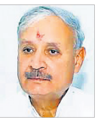
ରାଓ ଇନ୍ଦ୍ରଜିତ୍ ସିଂ

ଲାଲି ଘୋଷଣା କରିଯାଉଥିବାବେଳେ ଭିକ୍ଟ ଦାବି ଦଳ ପାଇଁ ଅନୁଆ ସ୍ଥିତି ସୃଷ୍ଟି କରିଛି। ଅନ୍ୟ ରାଜ୍ୟଗୁଡ଼ିକରେ ମୁଖ୍ୟମନ୍ତ୍ରୀ ପଦକୁ ନେଇ ଚଣାଓଟରା ମଧ୍ୟ ରହିଛି। ତେବେ ଭିକ୍ଟ ଦାବିଦାର ଭାଜପା ଶୀର୍ଷ ନେତୃତ୍ୱ ଆଗରେ ଚ୍ୟାଲେଞ୍ଜିଓରୁ କମ୍ ରୁହେଁ ବୋଲି କୁହାଯାଇଛି। ୬ ଥର ବିଧାୟକ ହୋଇଯାଉଥିବା ଭିକ୍ଟ ନିଜ ପୋଷ୍ଟରେ ଆସୁଛି କହିଛନ୍ତି, ତାଙ୍କୁ ସୁଯୋଗ ମିଳିଲେ ସେ ହରିୟାଣାରେ ବଡ଼ ଧରଣର ଉନ୍ନତ ଘଟାଇବେ। ଭିକ୍ଟ ପୂର୍ବରୁ ୨ ଥର ମୁଖ୍ୟମନ୍ତ୍ରୀ ହେଇ ହେଇ ଏହି ପଦ ତାଙ୍କ ହାତରୁ ଖସିଯାଇଥିଲା। ୨ରେ ମନୋହର ଲାଲ ଖଟ୍ଟାର ଓ ଆଉ ୨ରେ ସାଜନିକ ମୁଖ୍ୟମନ୍ତ୍ରୀ କରାଯାଇଥିଲା। ୨୦୧୪ରେ ଭିକ୍ଟ ମୁଖ୍ୟମନ୍ତ୍ରୀ ପଦ ପାଇଁ ଦାବି ଆଗରେ ରହିଥିଲେ। କିନ୍ତୁ କେନ୍ଦ୍ରୀୟ