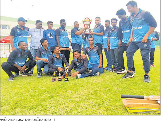
ଅତିଥିଙ୍କ ସହ ଖେଳାଳିମାନେ ।

ପୁରୀ, ୧୫୫୯ (ଅଜିତ କୁମାର ମହାନ୍ତି) ପୁରୀ ଜିଲ୍ଲା ପ୍ରଶାସନ ପକ୍ଷରୁ ପ୍ରିମିୟମ ଲିଗ୍ କ୍ରିକେଟ୍-୨୦୨୪ ରବିବାର ପେଣ୍ଡକଣ୍ଠାରେ ଶ୍ରୀକରନାଥ କ୍ରିକେଟ୍ ଷ୍ଟାଡ଼ିୟମରେ ଅନୁଷ୍ଠିତ ହୋଇଯାଇଛି। ଲିଗ୍‌ର ଦ୍ୱିତୀୟ ସିରିଜରେ ଉପଜିଲ୍ଲାପାଳ ଓ ବିଭିନ୍ନ ତହସିଲର ତହସିଲଦାରମାନଙ୍କୁ ନେଇ ମୋଟ ୧୨ଟି ଦଳ ଅଂଶଗ୍ରହଣ କରିଥିଲେ। ଲିଗ୍‌ର ଫାଇନାଲ ମ୍ୟାଚ୍ ସତ୍ୟବାଦୀ ଏବଂ କୃଷ୍ଣପ୍ରସାଦ ଟିମ୍ ମଧ୍ୟରେ ଅନୁଷ୍ଠିତ ହୋଇଥିଲା। ଉପଜିଲ୍ଲାପାଳ ଗୋପାଳନାଥ କୁଅଁର ପ୍ରତିଯୋଗିତାକୁ ଉଦ୍‌ଘାଟନ କରିଥିଲେ।