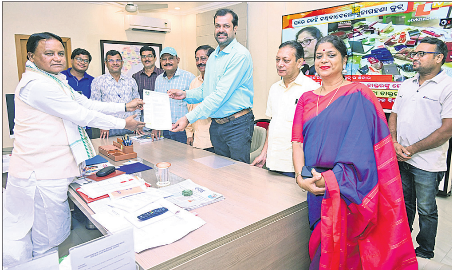
ପୁଖ୍ୟମନ୍ତ୍ରୀଙ୍କୁ ଭେଟି ଦାବିପତ୍ର ପ୍ରଦାନ କରୁଛନ୍ତି ଓପ୍ଟା କର୍ମକର୍ତ୍ତା।