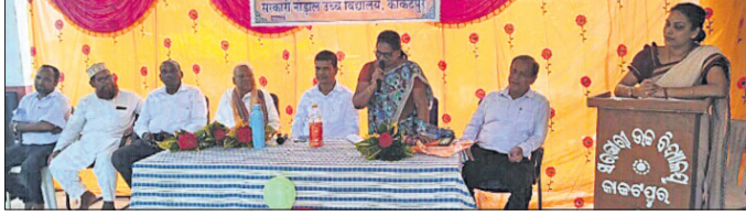
ଅଗ୍ରରଞ୍ଜ, ୧୫୫୯