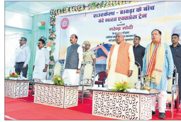
ବନ୍ଦେ ଭାରତ ଏକ୍ସପ୍ରେସ୍ ଚଳାଚଳର ଶୁଭାରମ୍ଭ ଅବସରରେ ବ୍ରହ୍ମପୁର ରେଳ ଷ୍ଟେସନରେ ମୁଖ୍ୟମନ୍ତ୍ରୀ ମୋହନ ଚରଣ ମାଝୀ ଯାତ୍ରୀମାନଙ୍କୁ ହାତ ଦେଖାଇ ଶୁଭେଚ୍ଛା ଜଣାଉଛନ୍ତି (ବାମ)। ରାଉରକେଲାଠାରେ ଆୟୋଜିତ କାର୍ଯ୍ୟକ୍ରମରେ ରାଜ୍ୟପାଳ ରଘୁବର ଦାସ, କେନ୍ଦ୍ର ମନ୍ତ୍ରୀ କୁଲଦି ଓରାମ ଓ ଅନ୍ୟମାନେ।