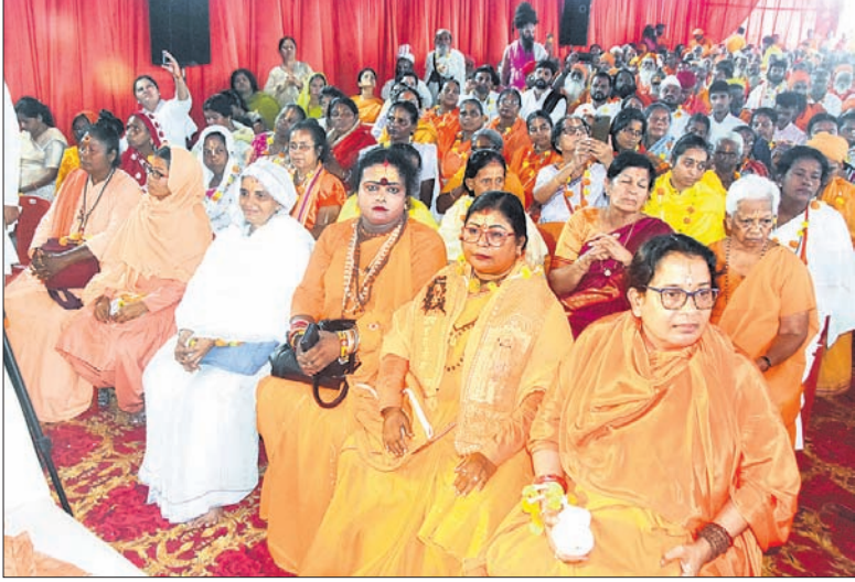
ଉପସ୍ଥିତ ମହିଳା ସାଧୁସଭା ।