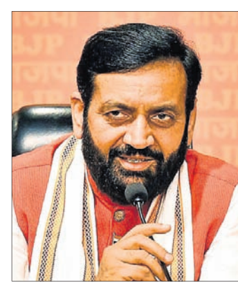
ନାଏବ ସିଂ ସାଜନିକ