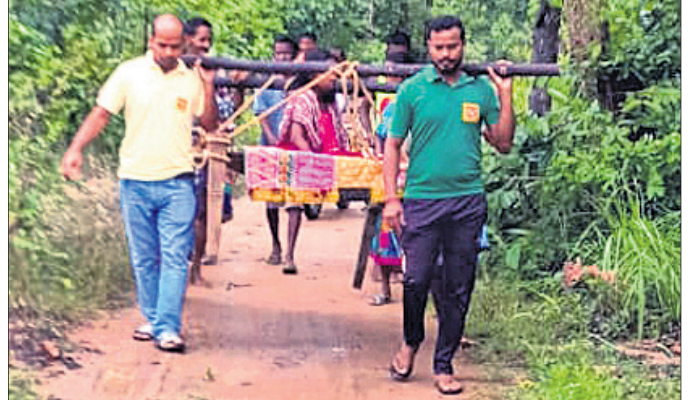
ଗର୍ଭବତୀଙ୍କୁ ଖଟିଆରେ ବୋହିକରି ନିଆଯାଇଛି।

ନାକଟାଦେଉଳ, ୧୬୮୯ (ବୈକୁଣ୍ଠନାଥ ସାହୁ) ରାସ୍ତା ନ ଥିବାରୁ ଗର୍ଭବତୀ ମହିଳାଙ୍କୁ ଗାଳିନି ଖଟିଆରେ ବୋହିଲେ ୧୦୮ ଆତ୍ମଲୀଳା କର୍ମଚାରୀ।