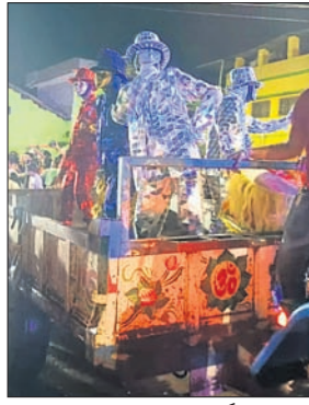
ବିସର୍ଜନ ଶୋଭାଯାତ୍ରାରେ ଦୃଶ୍ୟ ।