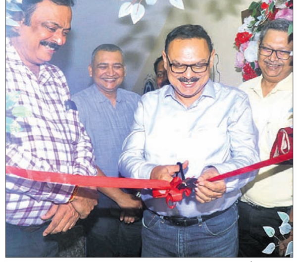
ବରଜପାଲି ଶିବା କମ୍ପ୍ଲେକ୍ସରେ ସୋମବାର ଆଦିତ୍ୟ ବିର୍ଲା ସ୍କିଲ ସେଣ୍ଟରର ଉଦ୍ଘାଟନା କରୁଛନ୍ତି।