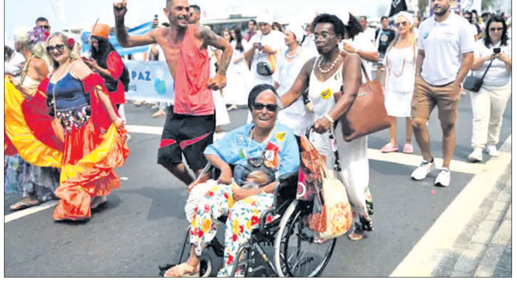
ବିଭିନ୍ନ ଧର୍ମର ପୁରୁଷା ଦାବିରେ ଗିଠ ତି ଜେନିରୋ ସହରେ ଶୋଭାଯାତ୍ରା।

ବିଭିନ୍ନ ଧର୍ମର ପୁରୁଷା ଦାବିରେ ଗିଠ ତି ଜେନିରୋ ସହରେ ଶୋଭାଯାତ୍ରା। ଏଥିରେ ସାମିଲ ହୋଇଥିଲେ। ପୁରୁଷ, ମହିଳାଙ୍କ ସମେତ ପିଲାମାନେ ଧର୍ମୀୟ ସ୍ୱାଧୀନତାର ପୁରୁଷା ପାଇଁ ଆସିଥିଲେ।