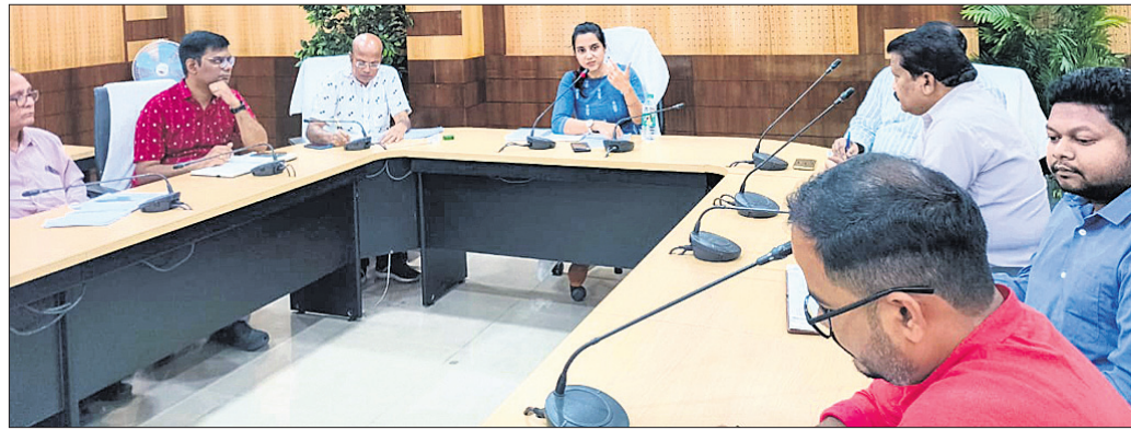
ବୈଠକରେ ଜିଲ୍ଲାପାଳ ଏବଂ ଅନ୍ୟ ଅଧିକାରୀମାନେ ଆଲୋଚନା କରୁଛନ୍ତି।

ଝାରସୁଗୁଡ଼ା ଜିଲ୍ଲା ଝରକାଜନଗର, ୧୬/୯ (ବିଜୟ ବରାହ) ଝରକାଜନଗର ନିର୍ବାଚନ ଶେଷରେ ରହିଛି ଭାରତ ସରକାରଙ୍କ ବୃହତ୍ ରାଷ୍ଟ୍ରୀୟ ଉଦ୍ୟୋଗ ମହାନଦୀ କୋଇଲା ଖଣି କମ୍ପାନୀ ଅଧୀନରେ ରାଜ୍ୟ ଓ ବାହାରୁ ଚେଷ୍ଟିତ ପ୍ରକ୍ରିୟାରେ କାମ ପାଇଁ ବିଭିନ୍ନ ଠିକା କମ୍ପାନୀ ଆସିପାରି ନିୟମ ଅନୁଯାୟୀ ଠିକା କମ୍ପାନୀ ୪୦ ଭାଗ କର୍ମଚାରୀ ସାଥୀରେ ଆଣିଆଣି ଏବଂ ୬୦ ଭାଗ କର୍ମଚାରୀ ସ୍ଥାନୀୟ ଅଞ୍ଚଳକୁ ନିୟୁକ୍ତି ପାଇବା କଥା କିନ୍ତୁ କମ୍ପାନୀଗୁଡ଼ିକ ନିଜର ସୁବିଧା ପାଇଁ ସ୍ଥାନୀୟ ନିୟୁକ୍ତିକୁ କିଛି ସ୍ଥାନୀୟ ଅଞ୍ଚଳର ଅଧିକାଂଶ ଚରମାଳିକ ଛାଡ଼ିବାକୁ ଚାହୁଁଛନ୍ତି।