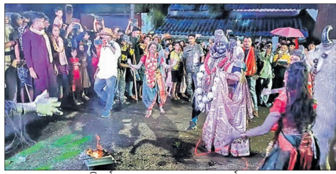
ବିସର୍ଜନ ଶୋଭାଯାତ୍ରାରେ ନୃତ୍ୟ ପ୍ରଦର୍ଶନ ।

ଦେବଗଡ଼, ୧୬/୯ (ଶଶାଙ୍କ ଶେଖର ଝାଙ୍କର) ଉତ୍ସାହ ଓ ଉତ୍ସାହପୂର୍ଣ୍ଣ ମଧ୍ୟରେ ଗତ ୧୦ ଦିନ ଧରି ଚାଲିଥିବା ଗଣେଶ ମେଳା ଉଦ୍‌ଯାପିତ ହୋଇଯାଇଛି।