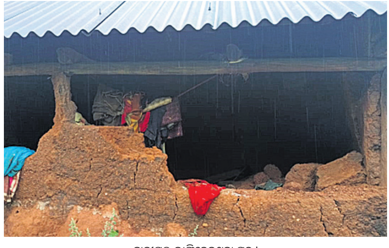
ହାତୀପଲ ଭାଙ୍ଗିଦେଇଥିବା ଘର।

କେନ୍ଦୁଝର, ୧୬/୯ (ନବେଶ ଚନ୍ଦ୍ର ପଟ୍ଟନାୟକ/ଦୀପକ ମିଶ୍ର) କେନ୍ଦୁଝର ବନଖଣ୍ଡ ତେଲକୋଇ ବନାଞ୍ଚଳରେ ହାତୀ ଉପଦ୍ରବ ବଢ଼ିବାରେ ଲାଗିଛି। ଖାଦ୍ୟ ଅନ୍ୟତମରେ ହାତୀପଲ ଜଙ୍ଗଲକୁ ଜନବସତି ମୁହାଁ ହେଉଛନ୍ତି। ଜମିରେ ଧାନ ଫସଲ ହୋଇ ନ ଥିବାରୁ ଗାଁ ଗଣ୍ଡାରେ ପଶି ଘର ଭାଙ୍ଗିବା ସହ ଘରେ ଥିବା ଧାନ, ଚାଉଳ ଖାଇଯାଉଛନ୍ତି। ତେଲକୋଇ ଫରେଷ୍ଟ ବିଏ ଅଧୀନ ବେଶା ଗାଁ ମୁଣ୍ଡାସାହିରେ ସୋମବାର ଏକ ୧୩ ଟିକିଆ ହାତୀପଲ ଉପାତ କରିଛନ୍ତି। ଗ୍ରାମରେ ୨ ଘର ଭାଙ୍ଗିବା ସହିତ ଧାନ ଚାଉଳ ଖାଇଦେଇଛନ୍ତି। ଏହା ସହିତ ଧାନ ବସ୍ତ୍ରରେ ରଖାଯାଇଥିବା ୧୦ ହଜାର ଟଙ୍କା ଖାଇଦେଇଥିବା ଘଟଣା ଏବେ ଚର୍ଚ୍ଚାର ବିଷୟ ହୋଇଛି।