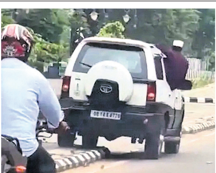
ଦୁର୍ଘଟଣା ସମୟରେ ମୁକ୍ତ ଗାଡ଼ି ଚଳାଉଛନ୍ତି।