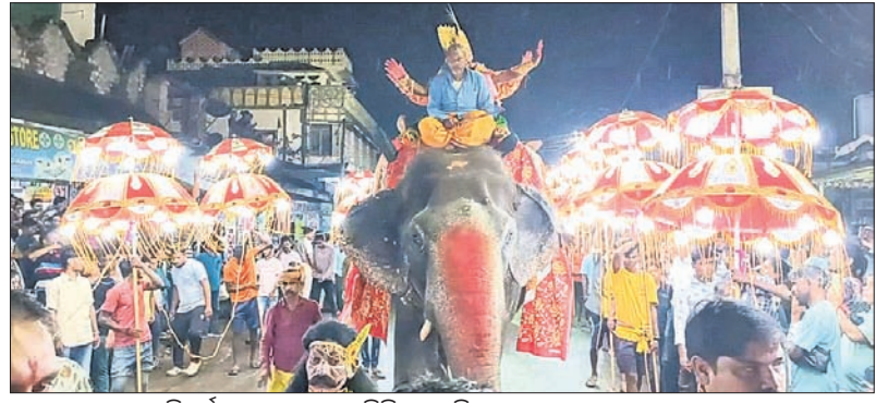
ବିସର୍ଜନ ବେଳେ ହାତୀ ପିଠିରେ ବସି କଂସ ମହାରାଜାଙ୍କ ଭ୍ରମଣ ।