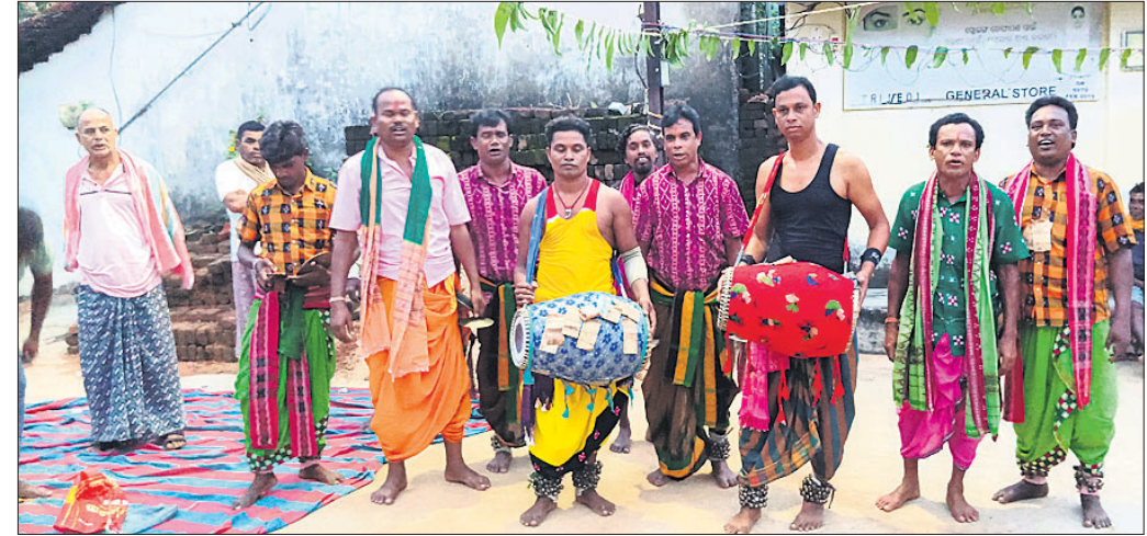
କରମସାନୀ ପୂଜାରେ ନୃତ୍ୟ ପରିବେଷଣ।

ଗାଜବିଲେଟ, ୧୬.୯ (ପ୍ରବାସ ବାଣୀ): ବରଗଡ଼ ଜିଲ୍ଲା ଗାଜବିଲେଟ ବସ୍ତି ସାହୁପଡ଼ା ଛକରେ ୨୭ତମ କରମସାନୀ ପୂଜା ସମାରୋହରେ ଅନୁଷ୍ଠିତ ହୋଇଯାଇଛି।