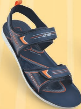
Model No. 8842