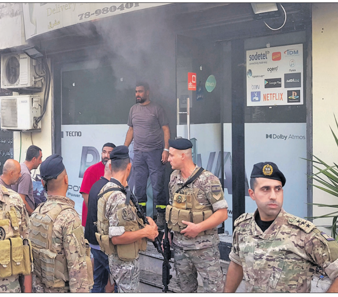
ଲେବାନର୍ ବନ୍ଦ ସହର ସିଡୋନୁସ୍ତ୍ରୀ ଏକ ମୋବାଇଲ୍ ଟୋକାନରେ ଡ୍ରାକିଚକି ବିସ୍ଫୋରଣ ଘଟିବା ପରେ ବାହାରେ ସୈନ୍ୟମାନେ ମୁହଁ ଧୋଇ ହୋଇଛନ୍ତି।

କଟିମଧ୍ୟରେ ପେଟର ବିସ୍ଫୋରଣରେ ନିହତ ୩ ଜଣ ହେକ୍ଟରୋଲ୍ଡା ସଦସ୍ୟଙ୍କ ମୃତଦେହ ସ୍ଥଳର ବେଳେ ବୁଥ୍‌ବାର ଏକାଧିକ ବିସ୍ଫୋରଣ ଘଟିଛି। ଅନ୍ୟ କେତେକ ସ୍ଥାନରେ ଘଟିଥିବା ବିସ୍ଫୋରଣରେ ଆହୁରି ୬ ଜଣଙ୍କ ମୃତ୍ୟୁ ହୋଇଛି।