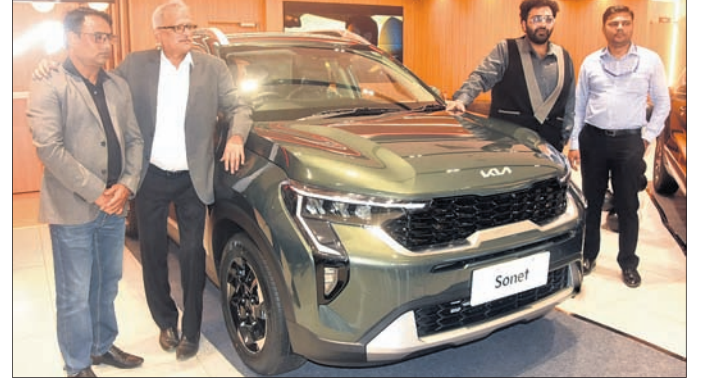
ଭୁବନେଶ୍ୱରର ରୁଗ୍ମନୀ କିଆରେ ଗ୍ରାଭିଟି ଏଡିଶନର ନୂତନ ମଡେଲ ଅନାବରଣ ହୋଇଯାଇଛି।

କିଆ ଇଣ୍ଡିଆର ବହୁ ପ୍ରତୀକ୍ଷିତ ତଥା ଅତ୍ୟାଧୁନିକ ଜ୍ଞାନକୌଶଳରେ ନିର୍ମିତ କିଆର ଗ୍ରାଭିଟି ଏଡିଶନ ରେଞ୍ଜିର ଅନାବରଣ ନିକଟରେ ହୋଇଯାଇଛି। ଏପରିକି ଟ୍ରାଣ୍ସ୍ ଏବଂ ଆକର୍ଷଣୀୟ ଭାରିଆଣ୍ଡ ଓ ଅଭିନବ ଡିଜାଇନ୍ ମଡେଲକୁ ମଧ୍ୟ କମ୍ପାନୀ ବଜାର ପ୍ରବେଶ କରାଯାଇଛି।