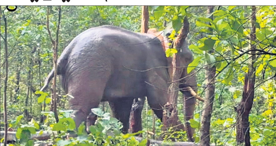
ଚେନସା, ୧୮୮୯ (ସମ୍ପାଦକ କୁମାର ସାହୁ)