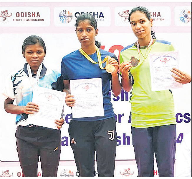
ପଦକ ସହ ୨୩ ବର୍ଷରୁ କମ୍ ବାଳିକା ୫୦୦୦ ମିଟରର କୃତୀ ପ୍ରତିଯୋଗୀମାନେ।

ରାଜ୍ୟ ସିନିୟର ଆଥଲେଟିକ୍ସ ଚାମ୍ପିୟନଶିପ୍ ଆଥଲେଟ୍ ଏଥିରେ ଅଂଶଗ୍ରହଣ କରିଛନ୍ତି। ୩ ଦିନ ବିଶିଷ୍ଟ ଏହି ପ୍ରତିଯୋଗିତାରେ ୨୬୮ ମହିଳା ପ୍ରତିଯୋଗୀ ଭାଗ ନେଇଛନ୍ତି। ଏମାନଙ୍କ ମଧ୍ୟରେ ଅଧିକାଂଶ ଓଡ଼ିଶା-ରିଲାଏନ୍ସ ଫାଉଣ୍ଡେସନ ଆଥଲେଟିକ୍ସ ହାଲ-ପରଫର୍ମାନ୍ସ ସେଣ୍ଟର ଏବଂ କ୍ରୀଡ଼ା ଛାତ୍ରାବାସରେ ଟ୍ରେନିଂ ନେଇଛନ୍ତି। ଓଡ଼ିଶା ପୋଲିସ୍, ପୋଷ୍ଟାଲ, ବିଏସଏନ୍ଏଲ୍ ଓ କିଏ ବିଶ୍ୱବିଦ୍ୟାଳୟରୁ ଆଥଲେଟ୍ମାନେ ମଧ୍ୟ ଏଥିରେ ଅଂଶଗ୍ରହଣ