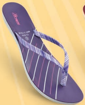
Model No. 7076