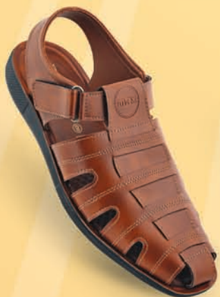
Model No. 9636