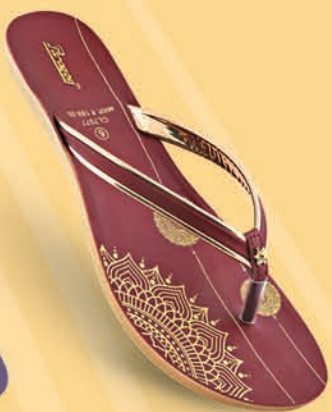
Model No. 7077