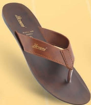
Model No. 6909