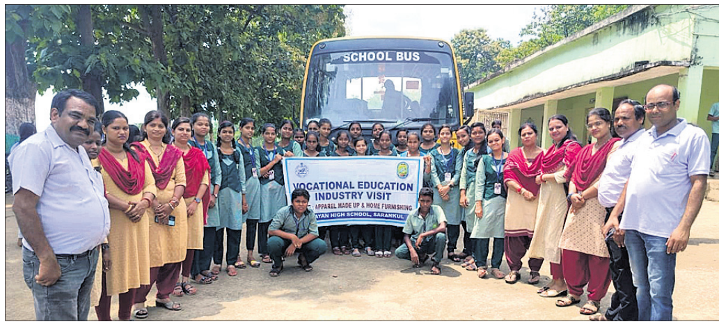
ଶିକ୍ଷାନୁଷ୍ଠାନ ପରିଚ୍ଛେଦରେ ଆସିଥିବା ଛାତ୍ରାଛାତ୍ରୀ ।

ଶରଣକୂଳ ନିକଟରେ ଥିବା ଧର୍ମାତ୍ମକ ଛାତ୍ରାଛାତ୍ରୀଙ୍କ ଶିକ୍ଷାନୁଷ୍ଠାନ ପରିଚ୍ଛେଦ କରାଯାଇଛି।