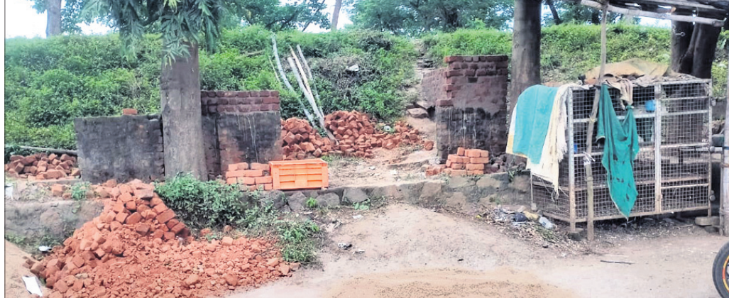
ମାଳବନ୍ଧରେ ନିର୍ମାଣଧାରୀ ଗୃହ ।

ବିଭିନ୍ନ ସରକାରୀ ଏବଂ ବେବେଭର କାମକୁ ଜରବେଶଳ କରି ବ୍ୟବସାୟ ପ୍ରତିଷ୍ଠାନ ନିର୍ମାଣ କରାଯାଇଛି । ହେଲେ ବିଭାଗୀୟ ଅଧିକାରୀମାନେ ସବୁ କାମ ବି ନାବର ରହିଥିବାରୁ ସାଧାରଣରେ ଅସୁବିଧା ପ୍ରକାଶ ପାଇଛି ।