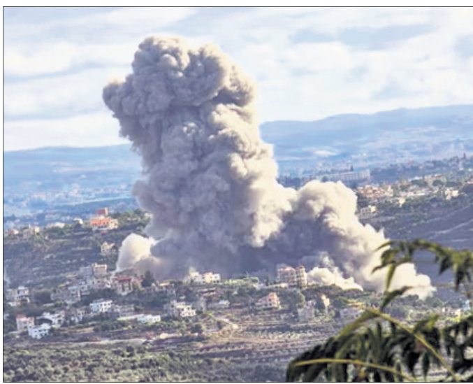
ଦକ୍ଷିଣ ଲେବାନନ୍ତର ଗାୟାରେ ଉଡ଼ୁଥିବା ଏୟାରଷ୍ଟ୍ରାଇକ୍ ପରେ ଧୂଆଁ ଉଠୁଛି।

୨୦୨୪ ଅକ୍ଟୋବର ୭ରେ ଇଣ୍ଡୋ-ଏଲ-ହମାସ୍ ଯୁଦ୍ଧକୁ ବର୍ଷେ ପୂରିବାକୁ ଯାଉଥିବାବେଳେ ଲେବାନନ୍ତରେ ମୋସାଦ୍ ପେଜର ଓ ଓଡ଼ିଶା ବିଦ୍ୟୋଗ ମଧ୍ୟପ୍ରାଚ୍ୟ ଯୁଦ୍ଧକୁ ଆହୁରି ସଜୀବ କରିଦେଇଛି। ଇଣ୍ଡୋ-ଏଲ-ହମାସ୍ ଯୁଦ୍ଧରେ ଲେବାନନ୍ତ ସୀମା ଅଭିଯୁକ୍ତ ଅଗ୍ରସର ହେଉଛି। ଏଭଳି ସମୟରେ ଯୁଦ୍ଧ ଏକ ନୂଆ ପର୍ଯ୍ୟାୟ ଆଡ଼କୁ ଘୁଞ୍ଚି ଚାଲି ଇଣ୍ଡୋ-ଏଲ-ହମାସ୍ ଦେବା ସହ ଦକ୍ଷିଣ ଲେବାନନ୍ତ ଅନେକ ସ୍ଥାନରେ ଏୟାରଷ୍ଟ୍ରାଇକ୍ କରିଛି। ସାତ୍ତ୍ୱେ ୧୧ ମାସ ଭିତରେ ୪୫୦ ଫାଇଟର୍ସ୍କୁ ହରାଇଥିବା ହେଉଥିବା ଇଣ୍ଡୋ-ଏଲ-ହମାସ୍ ଯୁଦ୍ଧର ଖୋଲା ଧମକ ଦେଇଛି।