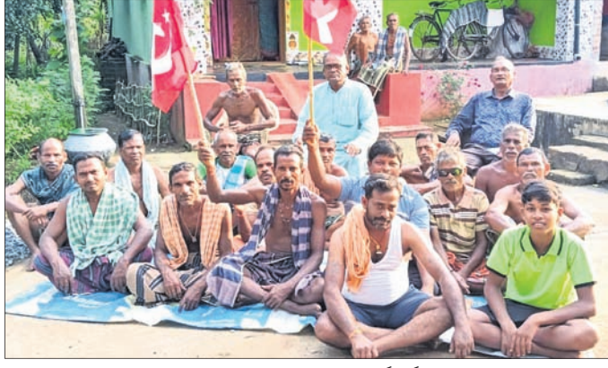
ଶାଖା ସମ୍ମିଳନୀରେ ଯୋଗଦେଇଥିବା ସିପିଆଇଏମ୍‌ର କର୍ମଚାରୀ ।