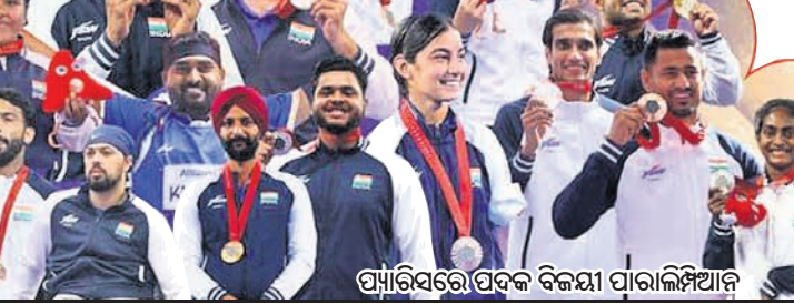
ପ୍ୟାରିସ୍ରେ ପଦକ ବିଜୟୀ ପାରାଲିମ୍ପିଆନ୍