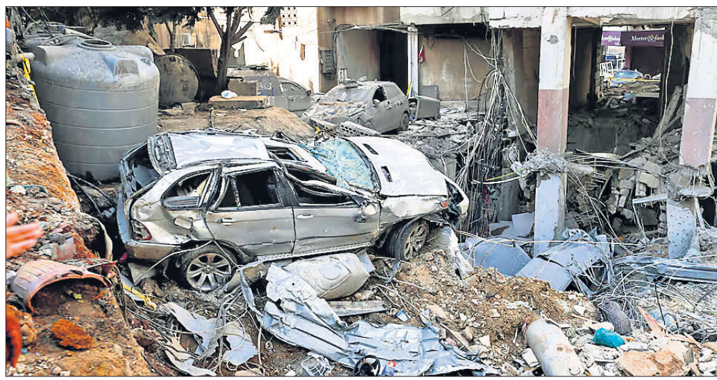
ଇସ୍ରାଏଲର ଏୟାରସ୍ତ୍ରୀକରଣରେ ବେରୁତର ଏକ ବହୁତଳ ବିଲ୍ଡିଂ ଧ୍ୱଂସ ହୋଇଯାଇଛି।

୪୨ ଦିନ ପରେ କାର୍ଯ୍ୟରେ ଯୋଗଦେଲେ ଜୁନିୟର ଡାକ୍ତର