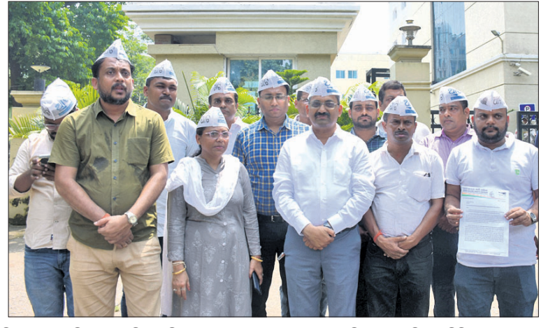
ପୋଲିସ୍ କମିଶନରଙ୍କୁ ସ୍ମାରକପତ୍ର ଦେବାକୁ ଆସିଥିବା ଏଏପିର ପ୍ରତିନିଧି ଦଳ ।