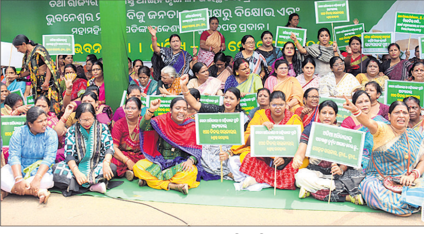
ରାଜଭବନ ସମ୍ମୁଖରେ ଧାରଣା ଦେଇଥିବା ବିଜୁ ମହିଳା ଦଳର ନେତ୍ରୀ ଓ ସଦସ୍ୟା ।