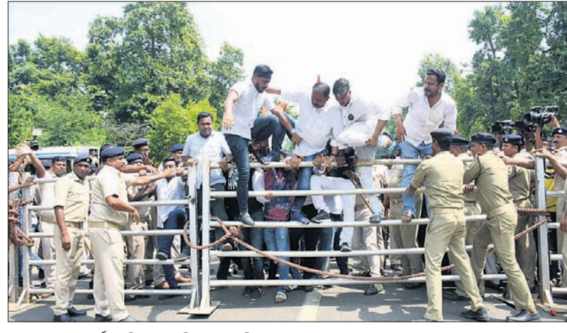
ଯୁବ କଂଗ୍ରେସ କର୍ମୀ ଶନିବାର ବାରିକେଡ୍ ଭାଙ୍ଗି ମୁଖ୍ୟମନ୍ତ୍ରୀଙ୍କ ବାସଭବନକୁ ଅଗ୍ରସର ହେଉଥିବା ବେଳେ ପୋଲିସ୍ ଅଟକାଇଛି ।