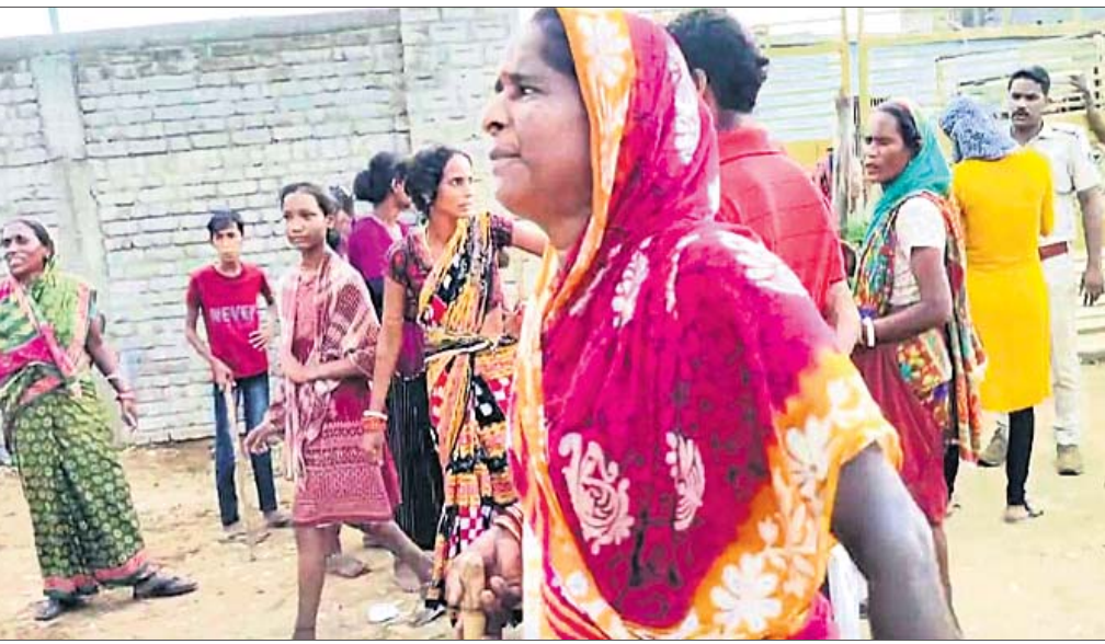
ମଦବାର ଭଙ୍ଗାଠୁଟା କରିବାକୁ ଆସିଥିବା ମହିଳାମାନେ ।