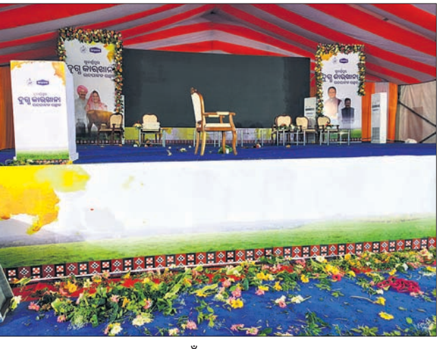
ସୋନପୁର ଡେପୁଟି ମୁଖ୍ୟମନ୍ତ୍ରୀ ଉଦ୍‌ଘାଟନ ପାଇଁ ପ୍ରସ୍ତୁତ ହୋଇଥିବା ମଞ୍ଚ ।