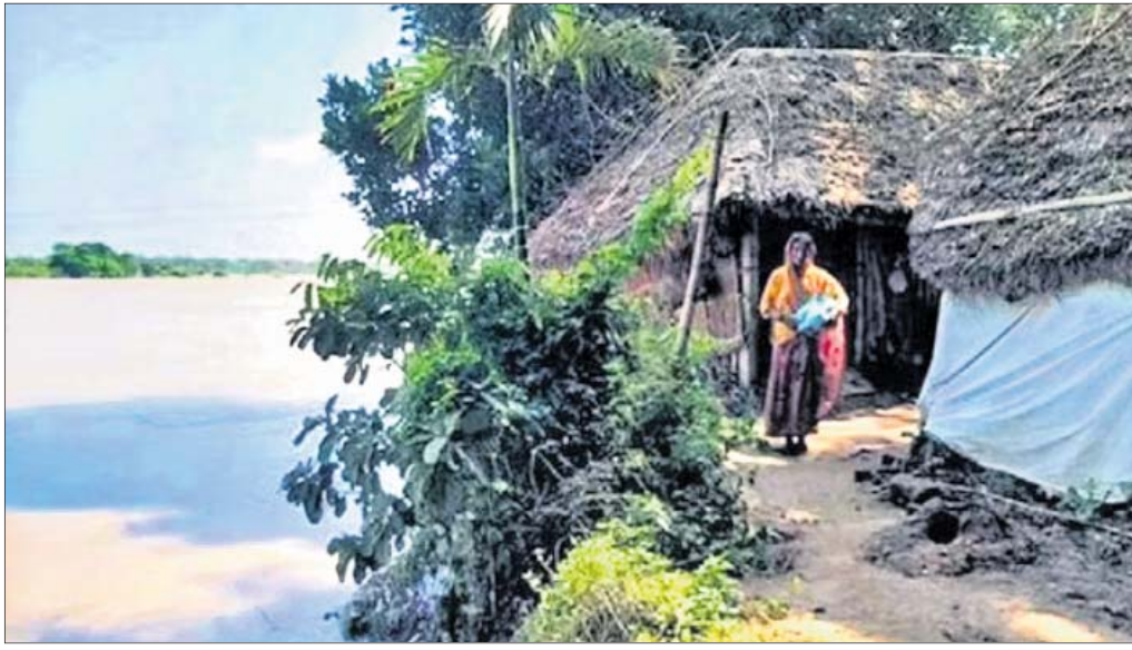
କେନ୍ଦ୍ରାପଡ଼ା ଲୁଣା ନଦୀ ନିକଟରେ ଥିବା ଘର ।

■ ଅଧିକାଂଶ ଗଣ ଜମି ନଦୀ ଗର୍ଭରେ ■ ପଥରବନ୍ଧ ନିର୍ମାଣ ବାଦି କେନ୍ଦ୍ରାପଡ଼ା, ୨୧।୯ (ଜଗନ୍ନାଥ ଧଳ):