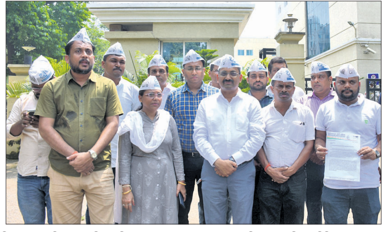
ପୋଲିସ୍ କମିଶନରଙ୍କୁ ସ୍ମାରକପତ୍ର ଦେବାକୁ ଆସିଥିବା ଏଏପିର ପ୍ରତିନିଧି ଦଳ ।