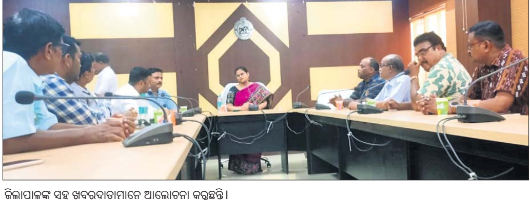
ଜିଲ୍ଲାପାଳଙ୍କ ସହ ଖବରଦାତାମାନେ ଆଲୋଚନା କରୁଛନ୍ତି।

ଯଜ୍ଞପୁର ଗଞ୍ଜନ, ୨୧୯ (ପ୍ରସନ୍ନା ପ୍ରିୟଦର୍ଶିନୀ ମହାନ୍ତି): ସମ୍ପର୍କିତ କାର୍ଯ୍ୟ ନିମନ୍ତେ କରିଥିଲେ। ସେଠାରେ ଏକ ସୌହାର୍ଦ୍ଦପୂର୍ଣ୍ଣ ବାତାବରଣ ମଧ୍ୟରେ ଜିଲ୍ଲାପାଳ ଓ ଖବରଦାତାଙ୍କ ମଧ୍ୟରେ ବିଭିନ୍ନ ଜିଲ୍ଲାର ବିକାଶ ପାଇଁ ଗଣମାଧ୍ୟମର ପରାମର୍ଶ ଏବଂ ତ୍ରୁଟି ପାଇଁ ଗଠନ ମୂଳକ ସମାଲୋଚନାକୁ ପ୍ରଶଂସା କରି ଯାବତେ ଗ୍ରହଣ କରିବ ବୋଲି ଜିଲ୍ଲାପାଳ କହିଥିଲେ। ଅନ୍ୟପକ୍ଷରେ ଜିଲ୍ଲା ପରିଷଦ ବୈଠକରେ ହୋଇଥିବା ବୁଝାମଣା ଭବିଷ୍ୟତରେ ଆଉ ଯେପରି ନ ହୁଏ ସେଥି ପ୍ରତି ଜିଲ୍ଲା ପ୍ରଶାସନ ନିଶ୍ଚିତ ଧ୍ୟାନ ଦେବବୋଲି ଜିଲ୍ଲାପାଳ ପ୍ରକାଶ କରିଛନ୍ତି। ଏହି ବୈଠକ ପରେ ଜିଲ୍ଲା ପ୍ରଶାସନ ଏବଂ