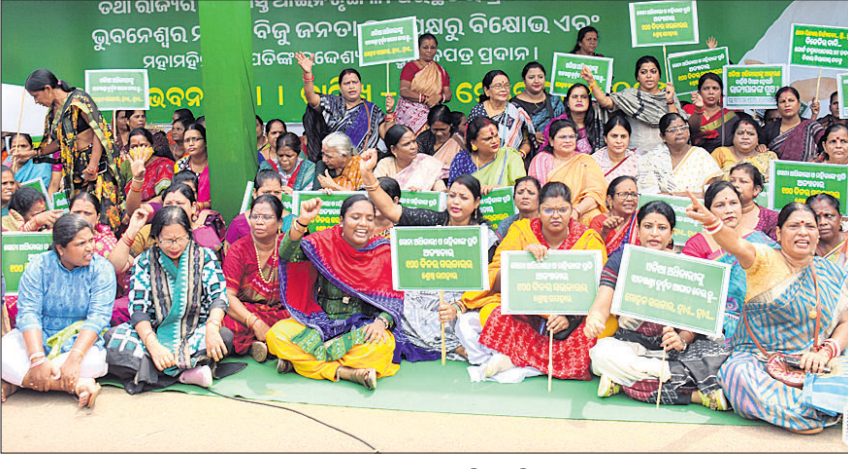
ରାଜଭବନ ସମ୍ମୁଖରେ ଧାରଣା ଦେଇଥିବା ବିଜୁ ମହିଳା ଦଳର ନେତ୍ରୀ ଓ ସଦସ୍ୟା ।