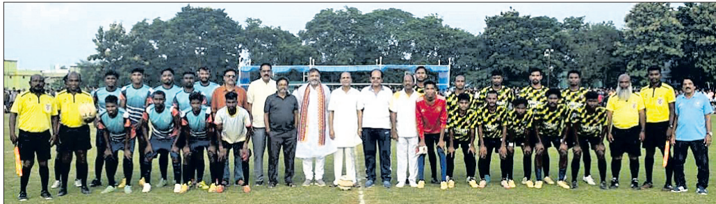
ପ୍ରଥମ ସେମି ଫାଇନାଲ ଖେଳରେ ଉତ୍ତମ ଦଳର ଖେଳାଳିଙ୍କ ସହ ଅତିଥି ଓ ଆୟୋଜକ।

ବଲାଙ୍ଗୀର, ୨୨୧୮ (ବୀରବ୍ରହ୍ମା କୁମାର ଝାଙ୍କର)