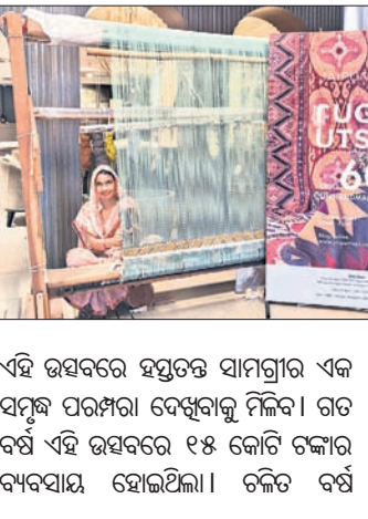
ଏହି ଉତ୍ସବରେ ସର୍ବୋଚ୍ଚ ଉତ୍ସବ ଉଦ୍‌ଘାଟନ କରୁଥିବା ଏବଂ ସମସ୍ତ ବୟସ ସାଧାରଣଙ୍କୁ ଆକର୍ଷଣ କରିବା ପାଇଁ ଉଦ୍ଦିଷ୍ଟ ହୋଇଛି ।

ରତ୍ନ ଉତ୍ସବ ଉଦ୍‌ଘାଟିତ ଭୁବନେଶ୍ୱର, ୨୨।୯ (ଅଭୟ ଦାଶ) ପ୍ରତି ବର୍ଷ ଭଳି ଚଳିତ ବର୍ଷ ମଧ୍ୟ ଜୟପୁରର ବହୁ ପ୍ରତୀକ୍ଷିତ କାର୍ଯ୍ୟକ୍ରମ 'ରତ୍ନ ଉତ୍ସବ' ନିକଟରେ ଆରମ୍ଭ ହୋଇଯାଇଛି । ଏପରିକି ଭାରତର ସର୍ବୋଚ୍ଚ ଉତ୍ସବ ଉଦ୍‌ଘାଟନ କରୁଥିବା ଏବଂ ସମସ୍ତ ବୟସ ସାଧାରଣଙ୍କୁ ଆକର୍ଷଣ କରିବା ପାଇଁ ଉଦ୍ଦିଷ୍ଟ ହୋଇଛି । ଏହାଛଡା ପାଠ୍ୟକ୍ରମକୁ ବିକ୍ଷେପିତ ଭାବରେ ଲାଗୁ କରାଯାଇଛି । ଏହାଛଡା ପାଠ୍ୟକ୍ରମକୁ ବିକ୍ଷେପିତ ଭାବରେ ଲାଗୁ କରାଯାଇଛି । ଏହାଛଡା ପାଠ୍ୟକ୍ରମକୁ ବିକ୍ଷେପିତ ଭାବରେ ଲାଗୁ କରାଯାଇଛି ।