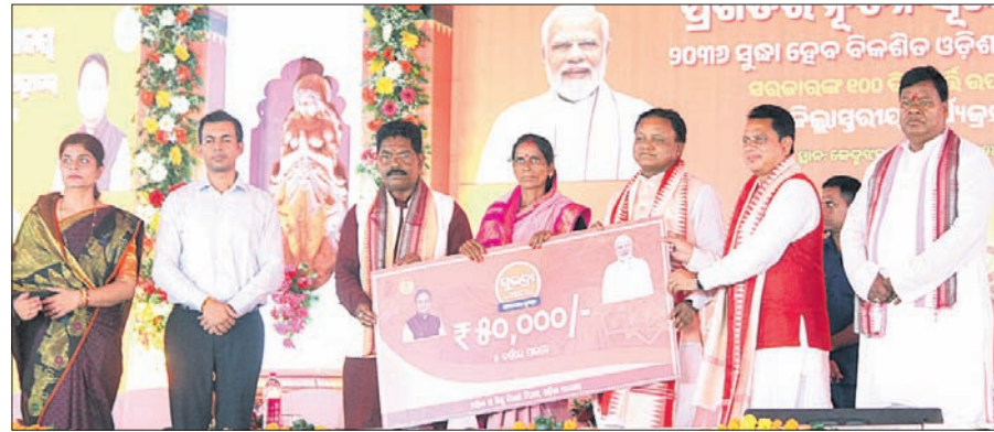
କେନ୍ଦୁଝରସ୍ଥିତ ଧରଣୀଧର ବିଶ୍ୱବିଦ୍ୟାଳୟ ପଢ଼ିଆରେ ଅନୁଷ୍ଠିତ ସଭାରେ ଜଣେ ମହିଳା ହିତାଧିକାରୀଙ୍କୁ ମୁଖ୍ୟମନ୍ତ୍ରୀ ମୋହନ ଚରଣ ମାଝୀ ସୁଭାଗ୍ୟା ଟଙ୍କା ପ୍ରଦାନ କରୁଛନ୍ତି।

କେନ୍ଦୁଝର ଜିଲ୍ଲା ଗସ୍ତରେ ଥିବା ମୁଖ୍ୟମନ୍ତ୍ରୀ ମୋହନ ଚରଣ ମାଝୀ ଗସ୍ତର ଶେଷ ଦିନ ଅର୍ଥାତ୍ ତୃତୀୟ ଦିନରେ ରବିବାର ନିଜ ସରକାରର ୧୦୦ ଦିନ ସଫଳତାର ହିସାବ ପ୍ରଦାନ କରିଛନ୍ତି। ଏ ନେଇ ଧରଣୀଧର ବିଶ୍ୱବିଦ୍ୟାଳୟ ପଢ଼ିଆରେ ସରକାରଙ୍କ ୧୦୦ ଦିନ ପୂର୍ଣ୍ଣ ଅବସରେ ଆୟୋଜିତ ଲିଲ୍ଲାସ୍ତରୀୟ କାର୍ଯ୍ୟକ୍ରମରେ ମୁଖ୍ୟମନ୍ତ୍ରୀ ମୁଖ୍ୟ ଅତିଥିଭାବେ ଯୋଗଦେଇଥିଲେ। ଏହି ଅବସରରେ ଜିଲାର ଉନ୍ନତି ପାଇଁ ୯୮୭ କୋଟି ଟଙ୍କାରୁ ଅଧିକ ବ୍ୟୟରେ ବିଭିନ୍ନ ଜନହତକାରୀ ପ୍ରକଳ୍ପର ଲୋକାର୍ପଣ, ଘୋଷଣା ଓ ଭିଡିପ୍ରସ୍ତର ସ୍ଥାପନ କରିଛନ୍ତି। ମୋହନ ସରକାର ଅନଳରେ କେନ୍ଦୁଝରର ବିକାଶ ସହ ଜିଲ୍ଲାବାସୀଙ୍କ ଅଭିବୃଦ୍ଧି ଘଟିବ ବୋଲି କହିଥିଲେ। ଅଭିଭାଷଣରେ ମୁଖ୍ୟମନ୍ତ୍ରୀ କହିଥିଲେ, ମହାପ୍ରଭୁ ଶ୍ରୀଜଗନ୍ନାଥଙ୍କ ଆଶୀର୍ବାଦରେ ଆମ ସରକାରଙ୍କୁ ସେବା କରିବାର ଏକ ସୁଯୋଗ ମିଳିଛି। ଆମେ ଦେଇଥିବା ପ୍ରତିଶ୍ରୁତିକୁ ପୂରଣ କରିବା ପାଇଁ ଯେଉଁ ସଂକଳ୍ପ ନେଇଥିଲୁ ତାହା ପୂରଣ ହେଉଛି। ସଂକଳ୍ପ ପତ୍ର ଆମର ଧର୍ମ ଗ୍ରନ୍ଥ, ସଂକଳ୍ପ ପୂରଣକୁ ପ୍ରାଥମିକତା ଦିଆଯାଉଛି। ସରକାର ଗଠନର ପ୍ରଥମ ଦିନରେ ହିଁ ଶ୍ରୀମନ୍ଦିର ଧାରା ଖୋଲିଲା। ଏଥିସହ ରତ୍ନଭଞ୍ଜର ଖୋଲିଲା, ଶ୍ରୀମନ୍ଦିର ପାଇଁ ୫୦୦ କୋଟି, ଓଡ଼ିଆ ଅସ୍ତରା ପାଇଁ ୨୦୦