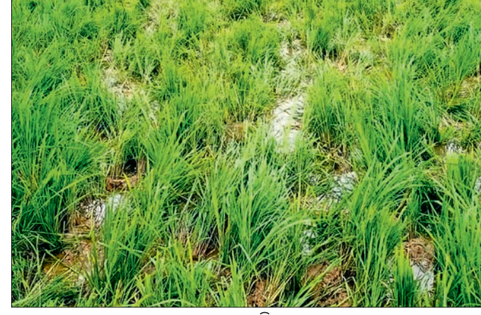
ହାତୀ ପଲ ଦ୍ୱାରା ଧାନ ଚାଷ ନଷ୍ଟ ହୋଇଯାଇଛି ।