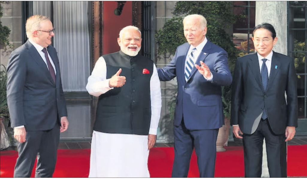
କ୍ୱାଡ୍ର ସମ୍ମିଳନୀ ଅବସରରେ ବାମରୁ ଅଷ୍ଟ୍ରେଲିଆ ପ୍ରଧାନମନ୍ତ୍ରୀ ଆଲେକ୍ସାନ୍ଦର ଟର୍ଣ୍ଟୋସ, ଭାରତୀୟ ପ୍ରତିପକ୍ଷ ନେତୃତ୍ୱ ଗୋପାଲ୍ ରାଷ୍ଟ୍ରପତି କୋ ବାଲତେନ୍ ଏବଂ ଜାପାନ ପ୍ରଧାନମନ୍ତ୍ରୀ ଫୁ଼ଜି଼ କିଶିଦା।