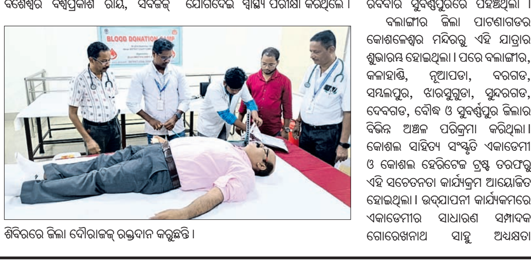
ଶିଶୁରେ ଜିଲ୍ଲା ଦୌରାକଙ୍କୁ ରକ୍ତଦାନ କରୁଛନ୍ତି ।