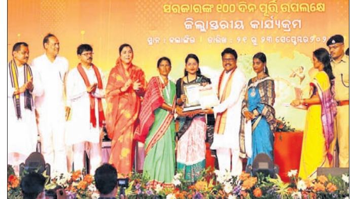
ବିକାଶ ମେଳାରେ ଅଗଲାପାଲି ଉପ ସ୍ୱାସ୍ଥ୍ୟକେନ୍ଦ୍ର ଚିମ୍ ସମର୍ଥନ କରୁଛନ୍ତି।