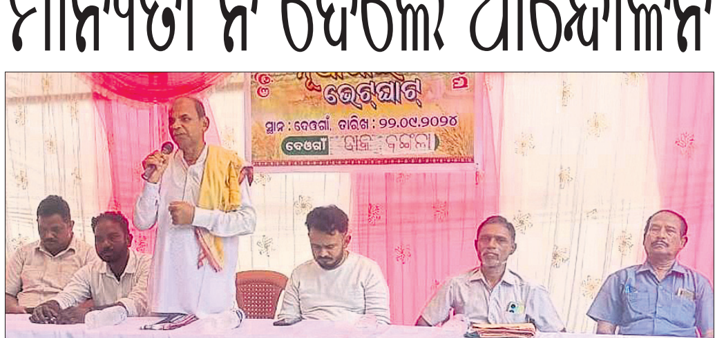
ବେଠାରେ କେନ୍ଦ୍ରପତ୍ର ଚୋଳାଳି ନୂଆଁଖାଇ ଭେଟସାଙ୍ଗ ।

ବେଠାରେ କେନ୍ଦ୍ରପତ୍ର ଚୋଳାଳି ନୂଆଁଖାଇ ଭେଟସାଙ୍ଗ । ପାଇଁ ଯୋଷଣା କରିଥିବା ବେଳେ ତାହା ଅଦ୍ୟାବଧି କାର୍ଯ୍ୟକାରୀ ହୋଇପାରିନାହିଁ। ଫଳରେ କର୍ମଚାରୀଙ୍କ ମଧ୍ୟରେ ତୀବ୍ର ଅସନ୍ତୋଷ ଦେଖାଦେବାକୁ ମିଳିଛି । ଆସନ୍ତା ପତ୍ରତୋଳା ସମୟ ଭିତରେ ସରକାର ଦାବିକୁ ପ୍ରତିଫଳିତ କରିବାକୁ ନିଷ୍ପତ୍ତି ନ ନେଲେ ସାରା ପଶ୍ଚିମ ଓଡ଼ିଶାରେ କାର୍ଯ୍ୟବନ୍ଦ ଆନ୍ଦୋଳନ କରିବା ପାଇଁ କର୍ମଚାରୀମାନେ ନିଷ୍ପତ୍ତି ନେଇଥିଲେ। ଆଗାମୀ ଦିନରେ ଦାବିକୁ ଚିତ୍ରାଜ ସିଂଦେଓ ପ୍ରତିଫଳିତ ଅଣାଯିବ ହେଲେ