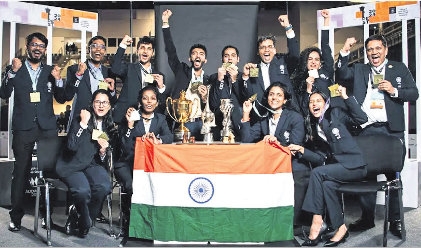
ପଦକ ଓ ପୁରସ୍କାର ସହ ଉତ୍ତମ ପ୍ରଦର୍ଶନୀମାନଙ୍କୁ ସମ୍ମାନିତ କରିବା ପାଇଁ ପଦକ ବିଜୟୀ ଭାରତୀୟ ମହିଳା ଓ ପୁରୁଷ ଦଳ ।