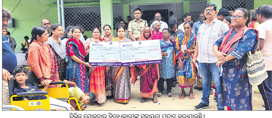
ବିଭିନ୍ନ ଯୋଜନାରେ ହିତାଧିକାରୀଙ୍କୁ ସହାୟତା ପ୍ରଦାନ କରାଯାଉଛି ।

ଅମରପାଲି, ୨୩।୯ (ପାଗାମର ସାହୁ) ସୁବର୍ଣ୍ଣପୁର ଜିଲ୍ଲା ବୀରମହାରାଜପୁର ବ୍ଲକ ପ୍ରଧାନ ଅଭିଯୋଗ ଶୁଣାଣି ଓ ଉପଶମ ଶିବିର ବ୍ଲକ ସମ୍ମିଳନୀ କକ୍ଷରେ ଯୋଜନା କରାଯାଇଥିଲା ।