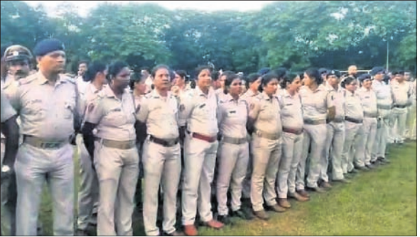
ଭୁବନେଶ୍ୱର, ୨୩।୯ (ସତ୍ୟଜିତ ରାଉତ)

ଭରତପୁର ଥାନା ନିର୍ଯ୍ୟାତନା ଘଟଣାରେ ଏକପାଖିଆ ନିଷ୍ପତ୍ତି ନିଆଯାଇ କାର୍ଯ୍ୟାନୁଷ୍ଠାନ ନିଆଯାଇଥିବା ଅଭିଯୋଗ ହୋଇ ଏହା ପ୍ରତିବାଦରେ ଗତ ୨୧ ତାରିଖ ଅପରାହ୍ନରେ ଭୁବନେଶ୍ୱର ବିଜେ ପୋଲିସ୍ ପଡ଼ିଆରେ ଶତାଧିକ ପୋଲିସ୍ ମେଲି