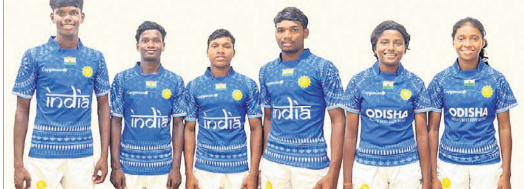
ଏସିଆ ଚାମ୍ପିୟନସିପରେ ଭାରତୀୟ ଦଳରେ ସ୍ଥାନ ପାଇଥିବା କିସ୍‌ର ଓ ଖେଳାଳି ।

ଭୁବନେଶ୍ୱର, ୨୩/୯ (ପି.ଟି.) ଖେଳାଳି ଡକ୍ଟରସି ଚେରୁଲରେ ପ୍ରଥମ ସ୍ଥାନରେ ରହିଥିବା ଭାରତ ଏହାର ସୁନା ଖିଲିକୁ ଅଧିକ ସୁଦୃଢ଼ କରି ନେଇଛି। ଡକ୍ଟରସି ଚେରୁଲରେ ପ୍ରଥମ ସ୍ଥାନରେ ରହିଥିବା ଭାରତ ଏହାର ସୁନା ଖିଲିକୁ ଅଧିକ ସୁଦୃଢ଼ କରି ନେଇଛି।