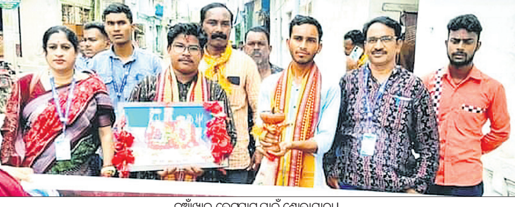
ନୂଆଁଖାଇ ଭେଟ୍‌ସାର୍ ପାଇଁ ଶୋଭାଯାତ୍ରା ।

ତରଢା, ୨୩।୯ (ମାନଭଞ୍ଜନ ମିଶ୍ର) ସୁବର୍ଣ୍ଣପୁର ଜିଲ୍ଲା ତରଢା କୋଶଳ ସାହିତ୍ୟ ଏକାଡେମୀ ଓ ବଳାଙ୍ଗୀର ତରଢା କୁଳପ ମିଳିତ ସହଯୋଗରେ ନୂଆଁଖାଇ ଭେଟ୍‌ସାର୍ କାର୍ଯ୍ୟକ୍ରମ ଆରମ୍ଭ ହୋଇଛି ।