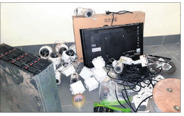
ଥାନା ଶିଡ଼ିଘରେ ରହିଥିବା ସିସିଟିଭି ସରଞ୍ଜାମ।

ଭୁବନେଶ୍ୱର, ୨୩।୯ (ସତ୍ୟଜିତ ରାଉତ) ଆର୍ମି କ୍ୟାମ୍ପରେ ଓ ବାନ୍ଧବୀଙ୍କୁ ଭରତପୁର ଥାନାରେ ନିର୍ଯ୍ୟାତନା ଘଟଣାରେ କମିଶନରେଟ୍ ପୋଲିସ୍ ବିବାଦ ଘେରକୁ ଆସିଛି।