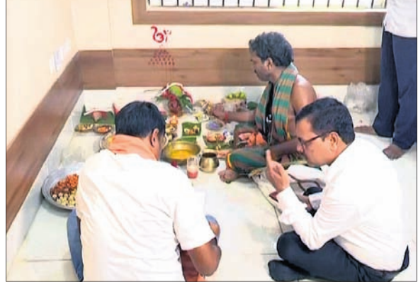
ଭୁବନେଶ୍ୱର, ୨୩।୯ (ସତ୍ୟଜିତ ରାଉତ)

ଆର୍ମି କ୍ୟାମ୍ପରେ ଓ ତାଙ୍କ ବାନ୍ଧବୀଙ୍କୁ ନିର୍ଯ୍ୟାତନା ଘଟଣାରେ ବିବାଦ ଘେରକୁ ଆସିଥିବା ଭରତପୁର ଥାନାକୁ ନେଇ ଦେଶବ୍ୟାପୀ ଚର୍ଚ୍ଚା ଲାଗିରହିଛି।