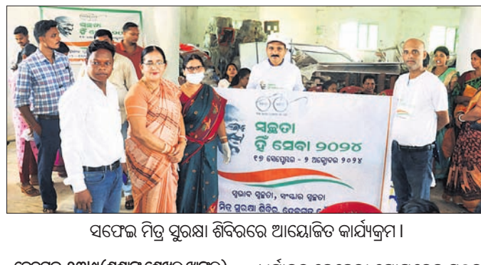
ସଫେଇ ମିତ୍ର ସୁରକ୍ଷା ଶିବିରରେ ଆୟୋଜିତ କାର୍ଯ୍ୟକ୍ରମ।