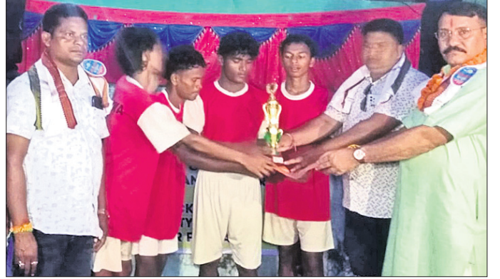
ଚାମ୍ପିୟନ ଦଳକୁ ଅତିଥିମାନେ ତ୍ରୁଟି ପ୍ରଦାନ କରୁଛନ୍ତି ।

ସୁବଳୟାରେ ଏକ ଦିବସୀୟ ପୁଲଟରା ଚାମ୍ପିୟନସ୍ ହେବାର ସମ୍ଭାବନା ରହିଛି ।