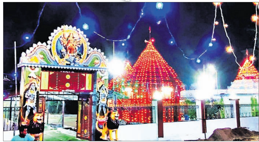
ଆଲୋକମାଳାରେ ଝଲସୁଛି ମା'ଙ୍କ ମନ୍ଦିର।