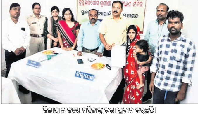
ଜିଲ୍ଲାପାଳ ଜଣେ ମହିଳାଙ୍କୁ ଭରା ପ୍ରଦାନ କରୁଛନ୍ତି ।

ମନମୁଖା, ୨୩।୯ (ବେଣୁଧର ପଧାନ) ବୌଦ୍ଧ ଜିଲ୍ଲା କର୍ମାଣ୍ଡଳ ବ୍ଲକ ଖଲିଆପାଲି ପଞ୍ଚାୟତ କାର୍ଯ୍ୟାଳୟ ପରିସରରେ ଯୋଜନା କରାଯାଇଛି ।