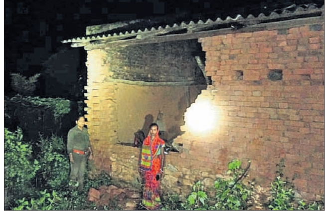
ଦେବଗଡ଼, ୨୩।୯ (ଶିଶୁ ଶିକ୍ଷକ ଶାଳା)

ଦେବଗଡ଼ ଜିଲ୍ଲା ଉତ୍ତମବିଧାନ ସଭାକୁଳାରେ ହାତୀ ଆକ୍ରମଣରେ ୩ ଛେଳି ମୃତ ହୋଇଛି ଏବଂ ଘର ଏବଂ ଫସଲ ମଧ୍ୟ ନଷ୍ଟ ହୋଇଛି।