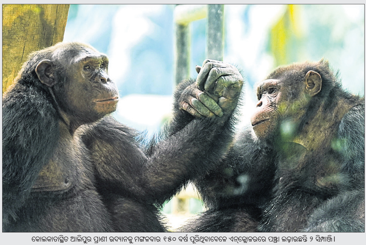
କୋଲକାତାରୁ ଆଲିପୁର ପ୍ରାଣୀ ଉଦ୍ୟାନକୁ ନିଜାକାର ୧୫୦ ବର୍ଷ ପୂରିଥିବାବେଳେ ଏନକ୍ଲୋଚରରେ ପକ୍ଷୀ ଲଢ଼ାଉଛନ୍ତି ୨ ସିମ୍ପାଜି।