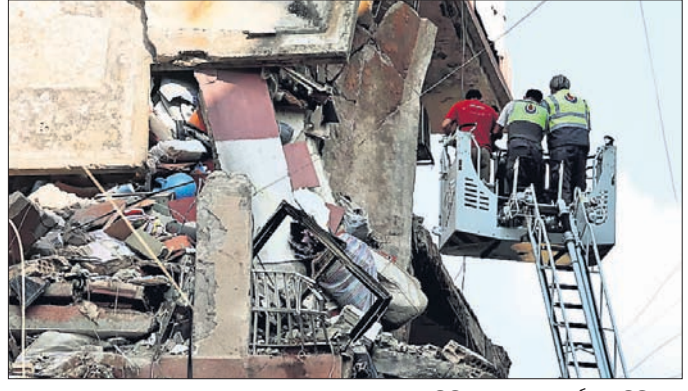
ଇସ୍ରାଏଲ୍ ବୋମାମାଡ଼ରେ ବେରୁତ୍ରେ ଧ୍ୱଂସପ୍ରାପ୍ତ ଏକ ବିଲ୍ଡିଂ ଉଦ୍ଧାର କାର୍ଯ୍ୟ ଚାଲିଛି।

ବେରୁତ୍, ୨୪।୯ ଲେବାନନ୍‌ରେ ଇସ୍ରାଏଲ୍ ସେନାର ଏୟାରସ୍ତ୍ରୀକରେ ମୃତ୍ୟୁସଂଖ୍ୟା ୫୫୮ରେ ପହଞ୍ଚିଥିବାବେଳେ ୧୬୪୫ ଜଣ ଆହତ ହୋଇଛନ୍ତି। ମୃତକଙ୍କ ମଧ୍ୟରେ ୫୦ ଜଣ ପିଲା ଓ ୯୪ ମହିଳା ରହିଛନ୍ତି। ୨୦୦୬ ମୁକ୍ତ ପରେ ଲେବାନନ୍‌ରେ ଏହା ଇସ୍ରାଏଲ୍‌ର ସବୁଠୁ ବଡ଼ ଘାତକ ଆକ୍ରମଣ। ଏହାର ଜବାବରେ ହେଉଥିବା ରକେଟ ଆକ୍ରମଣ ଗଣନା କରାଯାଇଛି।