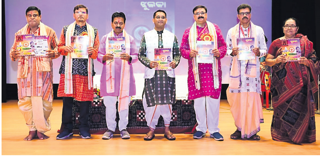
ପରିଷଦର ଇ ସ୍ମରଣିକା ଉନ୍ମୋଚିତ କରାଯାଇଛି।