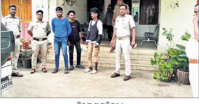
ଡକାୟତି ଯୋଜନା ପଞ୍ଜୀକୃତ, ୩ କୋର୍ଟ ଚାଲାଣ