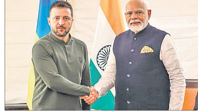
ୟୁକ୍ରେନ୍ ରାଷ୍ଟ୍ରପତି ଭୋଲୋଡିମିର ଜେଲେନସ୍କିଙ୍କ ସହ ପ୍ରଧାନମନ୍ତ୍ରୀ ନରେନ୍ଦ୍ର ମୋଦି।

ପ୍ରଧାନମନ୍ତ୍ରୀ ନରେନ୍ଦ୍ର ମୋଦି ସୋମବାର ଆମେରିକା ଗସ୍ତର ଶେଷ ଦିନରେ ୟୁକ୍ରେନ୍ ରାଷ୍ଟ୍ରପତି ଭୋଲୋଡିମିର ଜେଲେନସ୍କିଙ୍କ ସହ ବିପାକ୍ଷିକ ଆଲୋଚନା କରିଛନ୍ତି। ନ୍ୟୁୟର୍କରେ ଜାତିସଂଘ ଦ୍ୱାରା ଆୟୋଜିତ 'ଲାଇଫଲାଇନ୍' ସମିତି ଅର୍ଥ ଦି ପୁସ୍ତକ' ଅବସରରେ ଏହି ଆଲୋଚନା ହୋଇଥିଲା। ବିପାକ୍ଷିକ ସହଯୋଗ ବୃଦ୍ଧି ତଥା ରୁଷିଆ-ୟୁକ୍ରେନ୍ ଯୁଦ୍ଧର ସମାଧାନ ଓ ୟୁକ୍ରେନ୍‌ରେ ଶାନ୍ତି, ସ୍ଥିରତା ଫେରାଇ ଆଣିବାରେ ଭାରତ ସମଗ୍ର ପ୍ରକାର ସହଯୋଗ କରିବା ପାଇଁ ପ୍ରତିଶ୍ରୁତି ଦେଇ ବୋଲି ମୋଦି କହିଛନ୍ତି। ବିଭିନ୍ନ କ୍ଷେତ୍ରରେ ବିପାକ୍ଷିକ ସହଯୋଗ ବୃଦ୍ଧି ଲକ୍ଷ୍ୟରେ ଏହି ଆଲୋଚନା ହୋଇଥିବା ନେଇ ଜେଲେନସ୍କି ଏକ୍ସ'ରେ କହିଛନ୍ତି। ମୋଦି ଏବଂ ଜେଲେନସ୍କିଙ୍କ ମଧ୍ୟରେ ମାସକରେ ଏହା ବିତୀୟ ଆଲୋଚନା। ଅଗଷ୍ଟ ୨୩ରେ ପ୍ରଧାନମନ୍ତ୍ରୀ ୟୁକ୍ରେନ୍ ଗସ୍ତରେ ଯାଇ ଜେଲେନସ୍କିଙ୍କୁ ଭେଟିଥିଲେ।