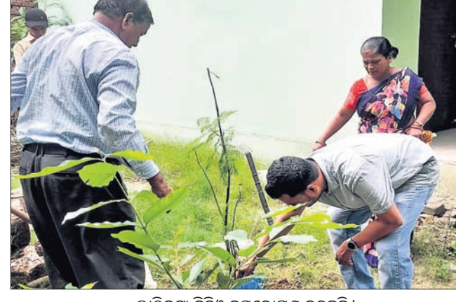
ଲାଠିକଟା ବିତିଓ ବୃକ୍ଷରୋପଣ କରୁଛନ୍ତି।