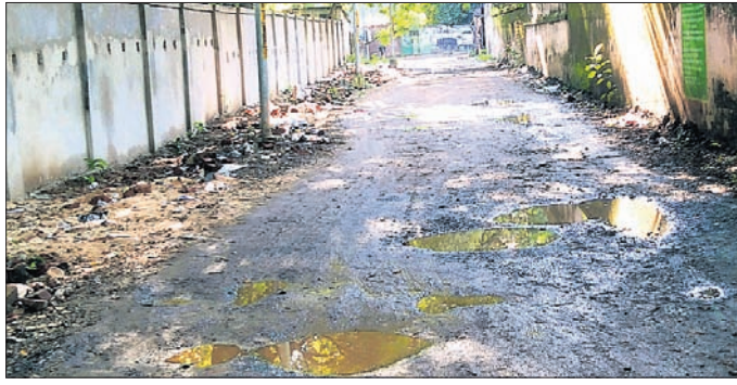
ରାସ୍ତାରେ ଗର୍ଭ ସୃଷ୍ଟି ହୋଇ ପାଣି ଜମିଛି।

ରାଜରକେଲା ମହାନଗର ନିଗମ (ଆରୁବଦି) ଅନ୍ତର୍ଗତ ସରକାରୀ ପରୀକ୍ଷଣ ଲାବ୍ରେ ସଂଯୋଗ କରୁଥିବା ରାସ୍ତା ସାମାନ୍ୟ ବର୍ଷାରେ ଧୋଇଯାଇଛି। ଏହି ଲାବ୍ରେ ସହରର ପ୍ରମୁଖ ଲାବ୍ରେ ହୋଇଥିବା ବେଳେ ଏହି ରାସ୍ତା ଦେଇ ପ୍ରତ୍ୟେକ ଦିନ ଶହଶହ ଲୋକ ଯାତାୟତ କରିଥାନ୍ତି। ବହୁ ଦିନ ଧରି ଏହି ଲାବ୍ରେ ସଂଯୋଗ କରୁଥିବା ରାସ୍ତା ମରାମତି ହୋଇ ନ ଥିବାରୁ ଏହାକୁ ପୁନରୁଦ୍ଧାର କରିବା ପାଇଁ ଆରୁବଦିର ଶ୍ରେଣୀଆଳ ପ୍ରୋବଲେମ୍ ଫଣ୍ଡରୁ ୨୦୨୩-୨୪ରେ ନିର୍ମାଣ ହେବାକୁ ନିଷ୍ପତ୍ତି ହୋଇଥିଲା। ଏଥିପାଇଁ ବେଶେ ପ୍ରକ୍ରିୟା ଆରମ୍ଭ ହେଲା। ରାସ୍ତାର ପୁନରୁଦ୍ଧାର ପାଇଁ ୧୭ ଲକ୍ଷ ୨ ହଜାର ୩୭୪ ଟଙ୍କା ମଞ୍ଜୁର ହୋଇ ଲକ୍ଷେ ଘାଣ୍ଟି ଯୋଗାଇ ଠିକାଦାରକୁ କାମ ଦିଆଗଲା। ଠିକାଦାର ଜଣକ ରାସ୍ତାରେ ପିଚୁ ନ ପକାଇ ଖାଲି