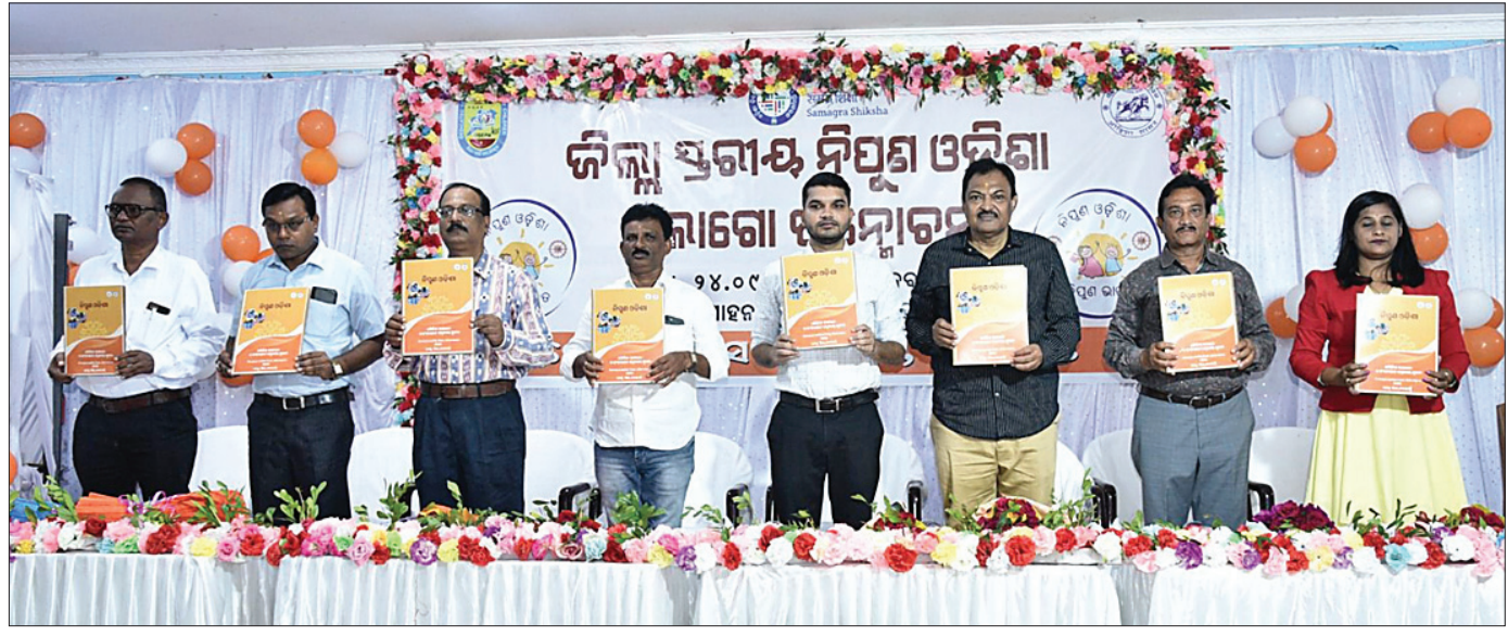
ଲୋଗୋ ଉନ୍ମୋଚନ ଅବସରରେ ଅତିଥିମାନେ।