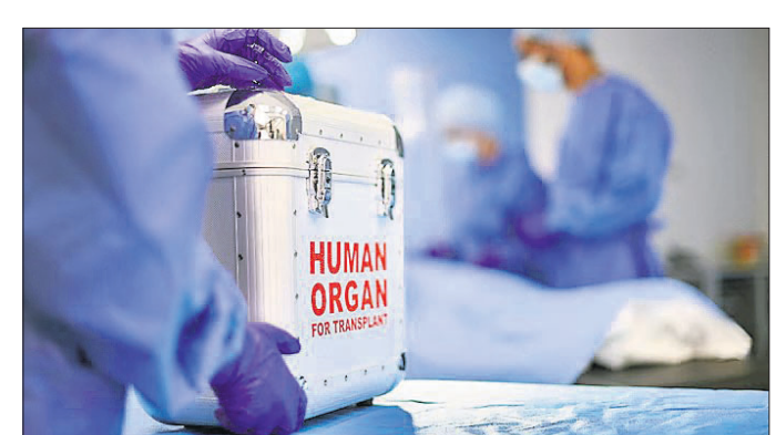
କରିଥିବା ବେଳେ ପୁରୁଷଙ୍କଠାରେ ଏହି ସଂଖ୍ୟା ୫,୬୫୧ ରହିଛି। ସେହିପରି ଗତବର୍ଷ ଜଣେ ଗ୍ରାହକଙ୍କର ବ୍ୟକ୍ତି ମଧ୍ୟ ଅଙ୍ଗଦାନ କରିଛନ୍ତି। ୨୦୨୩ରେ ସମୁଦାୟ ୧୫,୪୩୭ ଜଣ ଜାବତ ରିପୋର୍ଟ କହିଛି। ଏହି ରିପୋର୍ଟ ଅନୁଯାୟୀ, ଗତ ବର୍ଷ ୯,୭୮୪ ମହିଳା ଅଙ୍ଗଦାନ

ଭାରତରେ ଗତବର୍ଷ ସମୁଦାୟ ୧୮,୩୭୮ ଅଙ୍ଗ ପ୍ରତିରୋପଣ କରାଯାଇଥିବା ନେଇ କେନ୍ଦ୍ର ସ୍ୱାସ୍ଥ୍ୟ ଏବଂ ପରିବାର କଲ୍ୟାଣ ମନ୍ତ୍ରାଳୟ ପକ୍ଷରୁ ମଙ୍ଗଳବାର ଜାରି ବିଶ୍ୱାସ କରିବେ ନାହିଁ। ସୁପ୍ରିମକୋର୍ଟର ପ୍ରକାଶ ପାଇଛି। ସେହିପରି ଜାବତ ଅଙ୍ଗଦାନଙ୍କ କ୍ଷେତ୍ରରେ ପୁରୁଷଙ୍କ ସଂଖ୍ୟାରେ ଅଧିକ ସଂଖ୍ୟାରେ ମହିଳା ଥିବା ଏହି ରିପୋର୍ଟ କହିଛି। ଯେତେବେଳେ ଜଣେ ଜାବତ ବ୍ୟକ୍ତି ଅନ୍ୟ ଜଣେ ବ୍ୟକ୍ତିଙ୍କୁ ନିକର ଅଙ୍ଗ କିମ୍ବା ଅଙ୍ଗର ଏକ ଅଂଶ ଦାନ କରିଥାନ୍ତି, ତାଙ୍କୁ ଜାବତ ଅଙ୍ଗଦାନ କୁହାଯାଇଥାଏ। ଗତ ବର୍ଷ ଜାବତ ଅଙ୍ଗଦାନ ଦ୍ୱାରା ବୃଦ୍ଧି ଏବଂ ଯକୃତର କିଛି ଅଂଶକୁ ସର୍ବାଧିକ ପ୍ରତିରୋପଣ କରାଯାଇଥିବା ନେଇ ରିପୋର୍ଟ କହିଛି। ଏହି ରିପୋର୍ଟ ଅନୁଯାୟୀ, ଗତ ବର୍ଷ ୯,୭୮୪ ମହିଳା ଅଙ୍ଗଦାନ