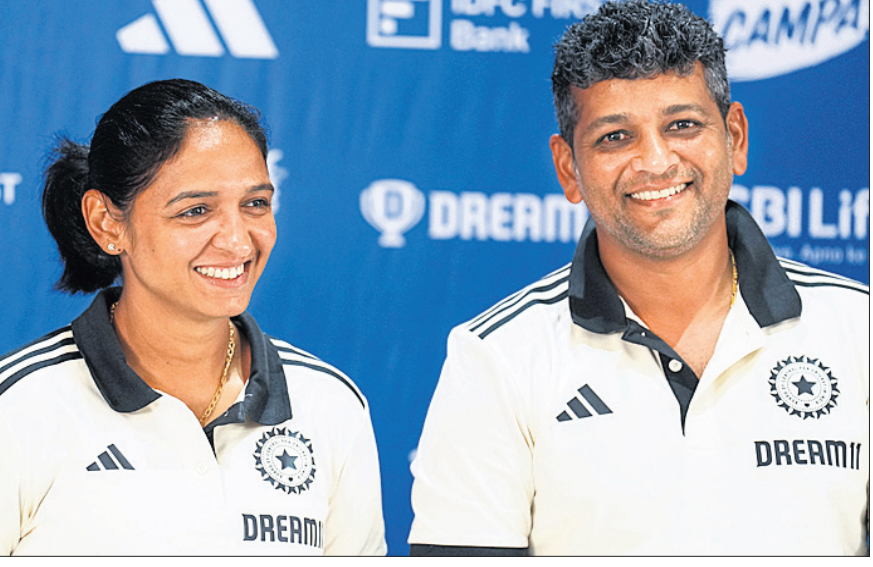
ଖବରଦାତା ସମ୍ମିଳନୀରେ ହରମନପ୍ରୀତ୍ କୌର ଓ ଅମୋଲ ମଜୁମଦାର ।