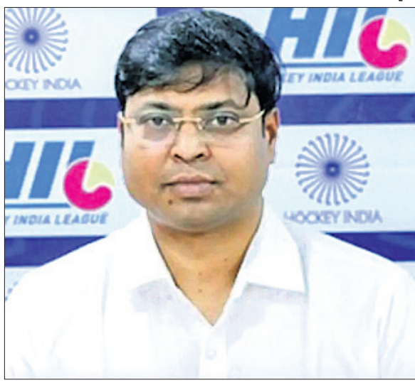
ହକି ଇଣ୍ଡିଆ ସଭାପତି ଦିଲୀପ ତିର୍କୀ ।

ପୂର୍ବକନିଷ୍ଠ ପ୍ରତିଯୋଗୀଭାବେ ଗୁଜେଶ୍ ଆସନ୍ତା ନଭେମ୍ବରରେ ଚାଲିବାର ଡିଜି ଲିଗରେ ବିଶ୍ୱ ଚେଷ୍ଟ ଚାମ୍ପିୟନଶିପ୍ରେ ଚ୍ୟାଲେଞ୍ଜି ବେଳେ। ଉଭୟ ଦଳ ସର୍ବ ପଦକ ହାସଲ କରିଥିବାରୁ ଏହା ଆମ ପାଇଁ ଖେଳିବାରୁ ଏହା ଆମ ପାଇଁ ବେଶ୍ ସ୍ୱତନ୍ତ୍ର ବୋଲି ସେ କହିଛନ୍ତି।