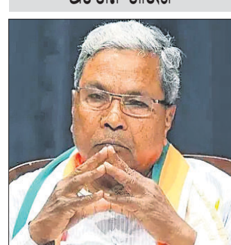
ଅଧ୍ୟକ୍ଷ ଡାକ୍ତରୀୟାଙ୍କୁ ପାଇଁ ପଥ ପରିଷ୍କାର ହୋଇଯାଇଛି।

ମହାଶ୍ୱର ଅର୍ଦ୍ଧନ ଡେଭେଲପମେଣ୍ଟ ଅଥରିଟି (ଏମ୍.ଏଚ୍.ଏସ୍) ଜମି ଦୁର୍ଗାତି ମାମଲାରେ କର୍ମଚାରୀ ପୁଷ୍ପାମନ୍ତୀ ସିଦ୍ଧାରାମାୟାଙ୍କ ବିରୋଧରେ ଡବଡ଼ ପାଇଁ ରାଜ୍ୟପାଳ ଆଫ୍ଟରହେ ରେହଲର୍ ନିର୍ଦ୍ଦେଶ ଦେଇଥିଲେ। ରାଜ୍ୟପାଳଙ୍କ ଅନୁମୋଦନକୁ ସିଦ୍ଧାରାମାୟା କର୍ମଚାରୀ ହାଇକୋର୍ଟରେ ଚ୍ୟାଲେଞ୍ଜି କରିଥିଲେ। ହାଇକୋର୍ଟ ମଙ୍ଗଳବାର ଉଚ୍ଚ ପିଟିଶନକୁ ଖାରଜ କରିଦେଇଥିବାକୁ ସିଦ୍ଧାରାମାୟାଙ୍କୁ ଶୁଭ ଝଟକା ଲାଗିଛି।