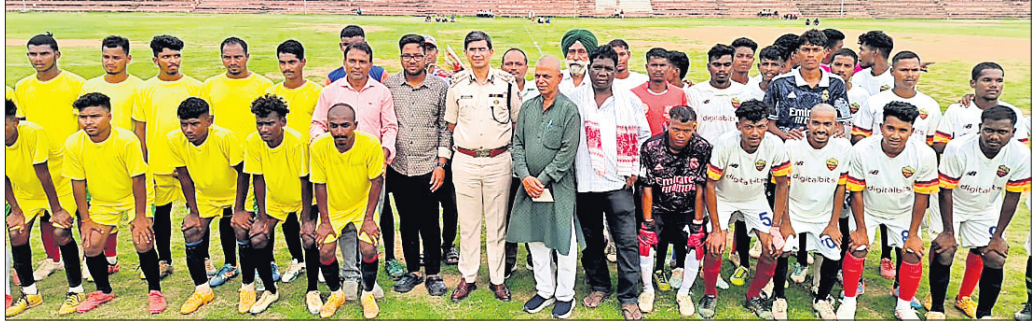
ଅତିଥିଙ୍କ ଗହଣରେ ପ୍ରତିଯୋଗିତାରେ ଭାଗ ନେଇଥିବା ଖେଳାଳି।

ଏହାର ନିର୍ଦ୍ଦେଶାଳିତା ଉପଲକ୍ଷରେ ଓ ହର୍ଷ ପାଠ୍ୟରେ ଉନ୍ନତ ଆଣିଛି। ଯାହା ୪୧୯ ଅନୁକୂଳ ଲୋକୋମୋଟିଭ ସମସ୍ତଙ୍କୁ ସାମଗ୍ରିକ ସୁରକ୍ଷା ସୁନିଶ୍ଚିତ କରିବା ପାଇଁ ପରାମର୍ଶ ଦେଇଥିଲେ। ଆରବସିପି ନିକଟରେ ପାଇଁ ଆହ୍ୱାନ ଦେଇଥିଲେ। ଏଥିସହ ଲୋକୋମୋଟିଭ ନବାକରଣ