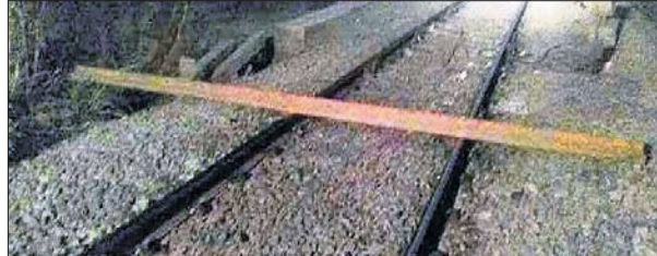
ନ ଥିବାବେଳେ ଟ୍ରେନ୍ ଚୁପ୍‌ଚାପି ପକାଇଥାଇ ପାରନ୍ତି ବୋଲି ଘଟଣାରେ ପାଇଁ ଷଡ଼ଯନ୍ତ୍ର କରି କିଛି ପୋଲିସ୍ କହିଛି। ଘଟଣାସ୍ଥଳରେ ଦୁର୍ଭବ ଲୁହାଖଣ୍ଡକୁ ରେଳ ଟ୍ରାକ୍ରେ ପୋଲିସ୍‌ର ତଦନ୍ତ ଜାରି ରହିଛି।

ଏହାଦ୍ୱାରା ସାରା ଦେଶରେ ପ୍ରାୟ ୨ ନିୟୁତ ନିୟୁତ ଚିନ୍ତାଧର୍ମ ସୃଷ୍ଟି ହେବ। କେବଳ ଜବାହରଲାଲ ନେହେରୁ ପୋର୍ଟ ଅଧିକରି (କେଏସପିଏ)ରେ ବର୍ତ୍ତମାନର ପରିଚାଳନା କ୍ଷମତା ୬.୬ ନିୟୁତ ଚିନ୍ତାଧର୍ମ ୧୦ ନିୟୁତକୁ ବୃଦ୍ଧି ଯାଏ। ଦାନଦୟାଲ ପୋର୍ଟ ଅଟକିତ ଏବଂ ଭି.ଓ. ଚିନ୍ତାଧର୍ମର ପୋର୍ଟକୁ ହାଲଡ୍ରୋକେନ୍ ଉତ୍ପାଦନ ହ୍ରାସ ପ୍ରତିଷ୍ଠା ପାଇଁ ୩,୯୦୦ ଏକର ଜମି ଆବଶ୍ୟକ କରାଯାଇଛି। ଏହାଦ୍ୱାରା ଆଗକୁ ୫ ଲକ୍ଷ କୋଟି ଟଙ୍କାର ନିବେଶ ଆସିବ ବୋଲି ସେ କହିଛନ୍ତି। ସୋନୋଫ୍ରିଲ ଆହୁରି କହିଛନ୍ତି, ଗ୍ରେଟ୍ ନିବେଶର ଆଇଲାଣ୍ଡରେ ଇଣ୍ଟରନାଶନାଲ କର୍ଷେନର ଟ୍ରାପିଂପେଣ୍ଟ ପୋର୍ଟ ପ୍ରତିଷ୍ଠା କରାଯିବ।