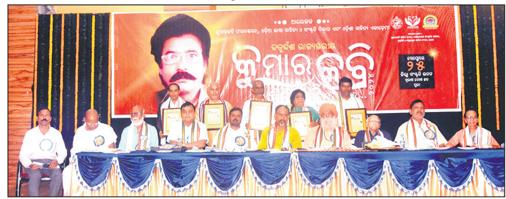
ସମାରୋହରେ ମହାସାଧନ ଅତିଥି।