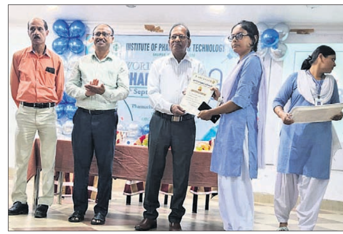
କୃତୀ ଛାତ୍ରୀଙ୍କୁ ଅତିଥି ପୁରସ୍କୃତ କରୁଛନ୍ତି।

ସାଲେପୁର ପାର୍ମାଣ୍ଟିଷ୍ଟ କଲେଜରେ ବିଶ୍ଵ ପାର୍ମାଣ୍ଟିଷ୍ଟ ଦିବସ ପ୍ରସ୍ତୁତ ହେଉଛି।