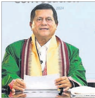
ଭୁବନେଶ୍ୱର, ୨୫ (ଶର୍ମିଷ୍ଠା ପାଣିଗ୍ରାହୀ)

ଅଭ୍ୟୁତ ସାମଗ୍ରୀକୁ ୬୦ଟମ ସମ୍ମାନସୂଚକ ଡକ୍ଟରେଟ