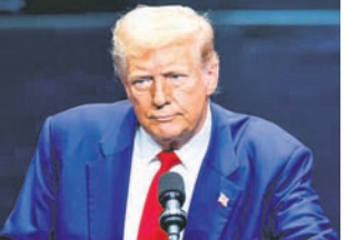
ଜଣାଇଛନ୍ତି। ତାଙ୍କୁ ହତ୍ୟା ପାଇଁ ଉଦ୍ୟମ କରାଯାଇପାରେ, ତେଣୁ ସତର୍କ ରହିବାକୁ ଟ୍ରାଫିକ୍ ଏନେଇ ଆମେରିକୀୟ ସାହା