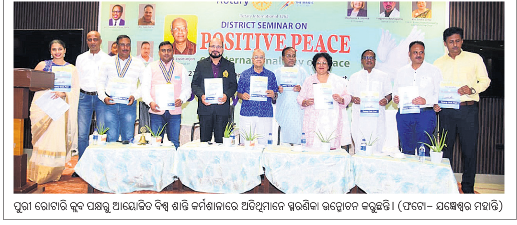
ପୁରୀ ରୋଗୀ କୂଳ ପକ୍ଷରୁ ଆୟୋଜିତ ବିଶ୍ୱ ଶାନ୍ତି କର୍ମଶାଳାରେ ଅତିଥିମାନେ ସ୍ୱରାଶିକା ଉନ୍ମୋଚନ କରୁଛନ୍ତି।