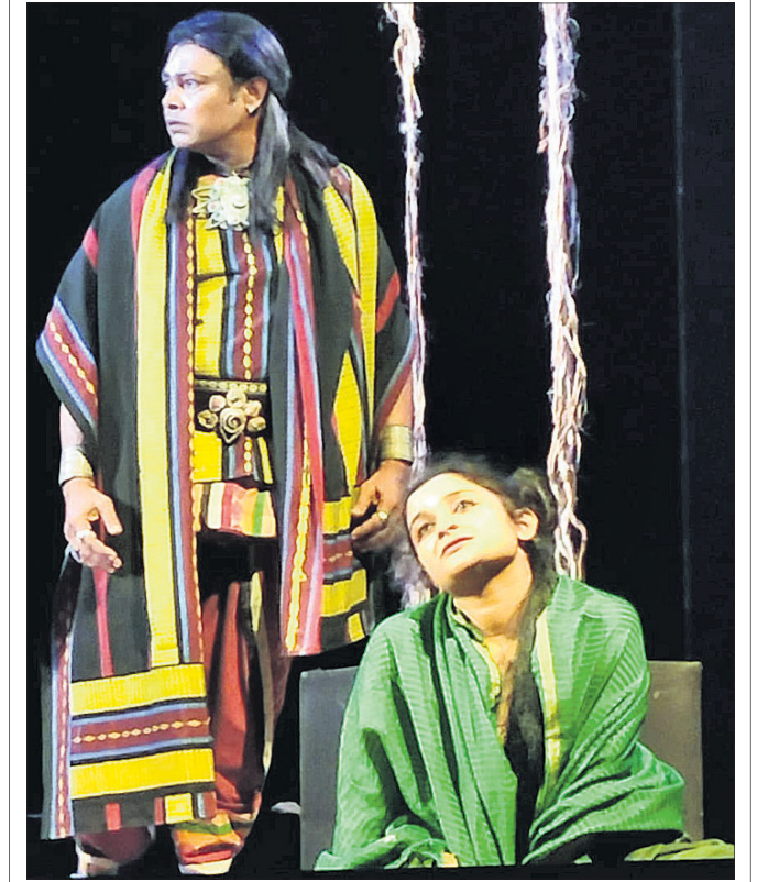
ଜାତୀୟ ନାଟ୍ୟ ମହୋତ୍ସବର ଚତୁର୍ଥ ସନ୍ଧ୍ୟାରେ ମଞ୍ଚସ୍ଥ ନାଟକ 'ଆତ୍ମବତ୍'ର ଏକ ଦୃଶ୍ୟ।

ଆୟୁଷ ଛାତ୍ର ସଂଘ ପକ୍ଷରୁ ଗୁରୁବାର ୨୪ତମିଆ କଳା ଦିବସ ପାଳନ କରାଯିବ। ରାଜ୍ୟର ପୁରୀ, ବ୍ରହ୍ମପୁର, ବଲାଙ୍ଗୀର, ରାଉରକେଲା, ସମଲପୁର, ଭୁବନେଶ୍ୱରରେ ଥିବା ସମସ୍ତ ସାତୋଟି ସରକାରୀ ଆୟୁର୍ବେଦ ଓ ହୋମିଓପାଥିକ ଭେଷଜ ମହାବିଦ୍ୟାଳୟର ଛାତ୍ରାଛାତ୍ରୀ ସମୂହ ସାମିଲ ହେବେ।