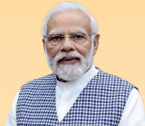
ଶ୍ରୀ ନରେନ୍ଦ୍ର ମୋଦୀ ମାନ୍ୟବର ପ୍ରଧାନମନ୍ତ୍ରୀ

₹ ୨୦,୯୦୦ କୋଟି ମୂଲ୍ୟର ବିଭିନ୍ନ ବିକାଶ ପ୍ରକଳ୍ପଗୁଡ଼ିକର ଉଦ୍ଘାଟନ, ରାଷ୍ଟ୍ର ଉଦ୍ଦେଶ୍ୟରେ ଉତ୍ସର୍ଗୀକରଣ, ଶୁଭାରମ୍ଭ ଏବଂ ଶିଳାନ୍ୟାସ ଉତ୍ସବ