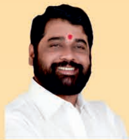
ଶ୍ରୀ ଏକନାଥ ସିନ୍ଧେ ମାନ୍ୟବର ମୁଖ୍ୟମନ୍ତ୍ରୀ, ମହାରାଷ୍ଟ୍ର