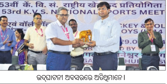
ଉଦ୍‌ଘାଟନା ଅବସରରେ ଅତିଥିମାନେ।