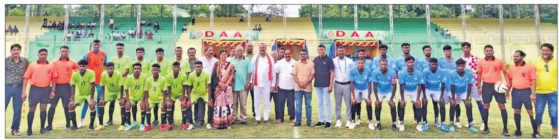
ଉଦ୍‌ଘାଟନା ମଧ୍ୟରେ ପୂର୍ବରୁ ରୁଲ ବଳର ଖେଳାଳି ଓ ଅଧିକାରୀଙ୍କ ସହ ଅତିଥିମାନେ।