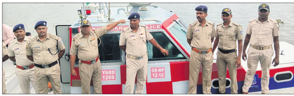
ଉପକୂଳ ସୁରକ୍ଷା ବ୍ୟବସ୍ଥାକୁ ତଦାରଖ କରିବା ପାଇଁ ସମରାଭ୍ୟାସ।

ସୁରକ୍ଷା ବହିନୀ ଦୁଇ ଭାଗରେ ବିଭକ୍ତ। ଚୁ ଓ ରେଡ୍ ଫୋର୍ସ ୨ଟି ଚୁ ହୋଇ ଏହି ସମରାଭ୍ୟାସ ଚାଲିଛି। ରେଡ୍ ଫୋର୍ସ ତଥା ଗୁରୁଶ୍ରୀ ଭୂମିକା ଓ ଚୁ ଫୋର୍ସ ପୋଲିସ ତଥା ପୁରୀ ବହିନୀର ଭୂମିକା ରୁକ୍ମାକରିଛି। ଉପକୂଳ ଚୁ ବହିନୀ