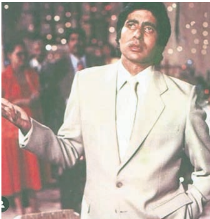
'ସରାବା' ଚଳଚ୍ଚିତ୍ରରେ ଅମିତାଭ ବଚ୍ଚନ

'ଗୋଟିଏ ହାତ ପକେଟରେ ରଖିବା' ସେତେବେଳେ ଯୁବପିଢ଼ିଙ୍କ ପାଇଁ ଏକ ଷ୍ଟାଇଲ୍ ହୋଇଯାଇଥିଲା । ଏହା ବ୍ୟତୀତ ବାପି ଲାହିରାଙ୍କ ସ୍ୱର ଏସୋଜନାରେ ଏହାର 'ଦେ ଦେ ପ୍ୟାର୍ ଦେ' ଗୀତ ଏବେ ବି ଶ୍ରେଣୀତାଳ ମନରେ ସତେଜ ରହିଛି । ସର୍ବୋତ୍ତମ ପାଇଁ ପ୍ରସାରିତ ଏହି ଫିଲ୍ମରେ ଅମିତାଭଙ୍କ ବ୍ୟତୀତ ଜୟାପ୍ରଦା ଏବଂ ପ୍ରାନ୍ ମୁଖ୍ୟ ଭୂମିକାରେ ଅଭିନୟ କରିଥିଲେ । ମାତ୍ର ୪କୋଟି ବଜେଟରେ ପ୍ରସ୍ତୁତ ଫିଲ୍ମଟି ବକ୍ସ ଅଫିସରେ ପ୍ରାୟ ୭୦କୋଟି ଇନ୍କମ୍ କରିଥିଲା ।