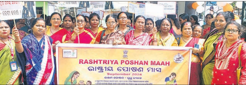
ଜିଲ୍ଲାପ୍ରଧାନ କାତ୍ୟାୟିଣୀ ପାଠ୍ୟ ପାଳନ ଅବସରରେ ଜିଲ୍ଲାପାଳଙ୍କ କାର୍ଯ୍ୟାଳୟ ନିକଟରେ ବାହାରିଥିବା ଶୋଭାଯାତ୍ରା।