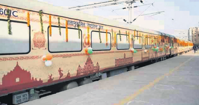
ଭୁବନେଶ୍ୱର, ୨୫ (ଅନୁରାଧା ମହାରଣା)

ଭାରତୀୟ ରେଳପଥ ଅଧିକାରୀଙ୍କ ଦ୍ୱାରା ଗୁଜରାଟ ରେଳ କମ୍ପାନୀର ଗାର୍ଡି ଗୁଜରାଟ ଏବଂ ଆକମେର ରେଳ ଷ୍ଟେସନରେ ପ୍ରଥମ ଥର ପାଇଁ ଗାର୍ଡି ଗୁଜରାଟ (ଆଇଆରସିପି) ଅଭ୍ୟୁତର ୧୧୧ ସାବରମତୀ ଆଗ୍ରା, ସୋମନାଥ, ନାଗେଶ୍ୱର କୋର୍ଡିଲିଙ୍ଗ, ଦ୍ୱାରକାଧାରୀ ଏବଂ ରୁନିଷ୍ଟ ଟ୍ରେନ୍ ଲକ୍ଷ କରିବାକୁ ଯାଉଛି।