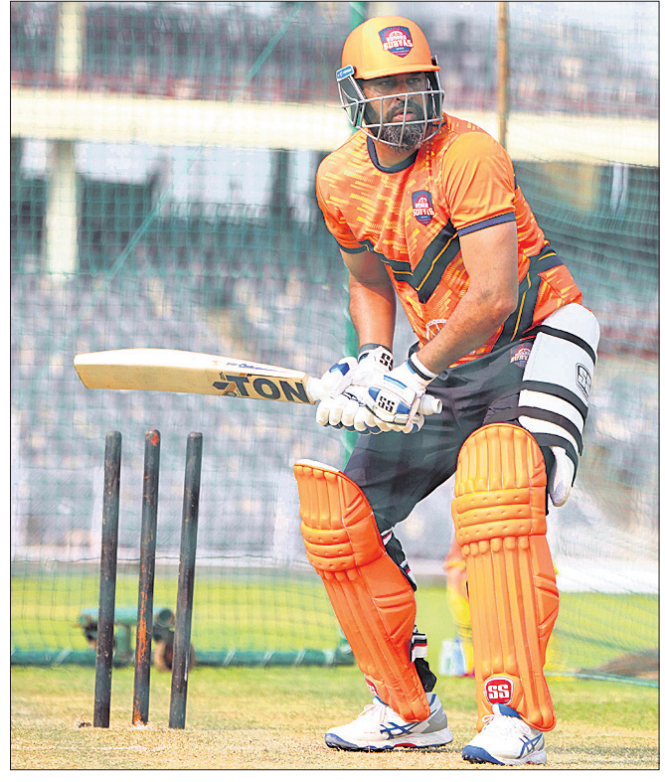
ପୁରୀରେ ଅଭ୍ୟାସ ଅବସରରେ ଯୁସୁଫ୍ ପଠାନ।

“ଲିଜେଣ୍ଡ ଲିଗ୍ କ୍ରିକେଟ ପ୍ରୋତ୍ସାହିତ କରି ଆସୁଛି। କ୍ରିକେଟକୁ ଅନୁସରଣ କରୁଥିବା ଏବଂ ଏଥିରେ କ୍ୟାରିୟର କରିବାକୁ ଇଚ୍ଛୁକ ଯୁବକଙ୍କୁ ଆମେ ବ୍ୟକ୍ତିଗତଭାବେ ମଧ୍ୟ ସର୍ବଦା ଉତ୍ସାହିତ କରିବାକୁ ଚେଷ୍ଟା କରିଥାଉ। ଏଲ୍‌ଏଲ୍‌ସିର ଅଂଶ ଥିବା ଅଧିକାରୀଙ୍କ ଅବସରପ୍ରାପ୍ତ ଖେଳାଳି ଅନ୍ତର୍ଜାତୀୟ ସ୍ତରରେ ନିଜ ଦେଶକୁ ପ୍ରତିନିଧିତ୍ୱ କରିଛନ୍ତି। ଚେଷ୍ଟା ଅଭ୍ୟାସ ପାଇଁ ଦଳରେ ସୋଗଦେଇଥିବା ଯୁବ ଖେଳାଳିମାନେ ସେମାନଙ୍କଠାରୁ ଅନେକ କିଛି ଶିଖିବାକୁ ପାଉଛନ୍ତି” ବୋଲି ପ୍ରକାଶ କରିଛନ୍ତି ଭାରତୀୟ କ୍ରିକେଟ ଦଳର ପୂର୍ବତନ ଅଲ୍ରାଉଣ୍ଡର ଯୁସୁଫ୍ ପଠାନ। ଅନ୍ତର୍ଜାତୀୟ କ୍ରିକେଟକୁ ଅବସର ନେବାପରେ ସେ ବିଭିନ୍ନ ପ୍ରାଥମିକତାଗତ ଲିଗ୍‌ରେ ଖେଳୁଛନ୍ତି। ଚଳିତବର୍ଷ ଲିଜେଣ୍ଡ ଲିଗ୍ କ୍ରିକେଟ (ଏଲ୍‌ଏଲ୍‌ସି)ରେ ସେ କୋଣାର୍କ ସୂର୍ଯ୍ୟସ ଓଡ଼ିଶା ପକ୍ଷରୁ ପ୍ରତିନିଧି କରୁଛନ୍ତି। ଏହା ଓଡ଼ିଶାର ପ୍ରଥମ ଲିଗ୍‌ଭିତ୍ତିକ କ୍ରିକେଟ ଦଳ ହୋଇଥିବାରୁ ରାଜ୍ୟବାସୀଙ୍କ ଲାଗି ନିଶ୍ଚିତ ଖୁସିର ବସନ୍ଦ। କଣେ କ୍ରିକେଟର ଭାବେ ଆମେ ଏକ ରାଜ୍ୟ ତଥା ଆମ ଦେଶର ପ୍ରତିନିଧିତ୍ୱ କରିବାରେ ସର୍ବଦା ଗର୍ବିତ ଅନୁଭବ କରୁ। ପରବର୍ତ୍ତୀ ପିଠି କ୍ରିକେଟରକୁ ଉତ୍ସାହିତ କରୁ ଥିବାରୁ ଆମେ ଖୁବ୍ ଆନନ୍ଦିତ ବୋଲି ଯୁସୁଫ୍ କହିଛନ୍ତି। ୨୦୦୭ ଟି୨୦ ବିଶ୍ୱକପ୍ ସମ୍ପର୍କରେ ଯୁସୁଫ୍ କହିଛନ୍ତି ଯେ, ଇତିମଧ୍ୟରେ ୧୧ ବର୍ଷ ବିତିଗଲାଣି। ସେବେଠାରୁ କ୍ରିକେଟରେ ଅନେକ କିଛି ପରିବର୍ତ୍ତନ ଆସିଛି। ଆମେ ଯେତେବେଳେ ବିଶ୍ୱକପ୍ ଚିତ୍ତୁ କାହାକୁ ଏହି ଫର୍ମାଟ୍‌ରେ କେଉଁ ଭଳି ଖେଳାଯାଏ ଜଣା ନ ଥିଲା। ଆମେ