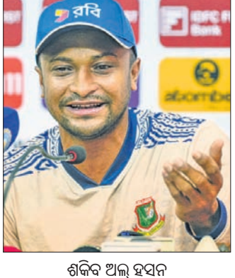
ଶକିବ ଅଲ୍ ହସନ

ବାଲାଦେଶ ଅଲରାଉଣ୍ଡର ଶକିବ ଅଲ୍ ହସନ ଗୁରୁବାର ଅନ୍ତର୍ଜାତୀୟ ଟି୨୦ କ୍ରିକେଟରୁ ଡାକ୍ତର ଅବସର ଘୋଷଣା କରିଛନ୍ତି। ଦେଶର କ୍ରିକେଟ ବୋର୍ଡ ସହ ଏହା ଆଫିକା ବିପକ୍ଷରେ ତାଙ୍କୁ ଫେୟାରଫୋଲ୍ ମ୍ୟାଚ ଭାବେ ଖେଳିବା ଲାଗି ସୁଯୋଗ ନ ଦିଏ ତେବେ କାନପୁରଠାରେ ଶୁକ୍ରବାର ଭାରତ ବିପକ୍ଷରେ ଖେଳାଯିବାକୁଥିବା ଦ୍ୱିତୀୟ ଟେଷ୍ଟ ଡାକ୍ତର ଅତିଥି ଟେଷ୍ଟ ମ୍ୟାଚ ହେବ। ପାକିସ୍ତାନ ଓ ଯୁଏଇରେ ଖେଳାଯିବାକୁଥିବା ଚାମ୍ପିୟନ୍ ଟ୍ରଫିରେ ସେ ବାଲାଦେଶ ପାଇଁ ଡାକ୍ତର ଶେଷ ଅନ୍ତର୍ଜାତୀୟ ଗେମ୍ ଖେଳିବେ। ଏହି ୩୭ବର୍ଷୀୟ ମହାନ୍ ଖେଳାଳି ବାଲାଦେଶ ପାଇଁ ୧୨୯ ଅନ୍ତର୍ଜାତୀୟ ଟି୨୦ ଖେଳିଛନ୍ତି। ସେ କିନ୍ତୁ ପ୍ରାଥମିକ ଟାକ୍ ନିଷ୍ପତ୍ତି ସମ୍ପର୍କରେ ଆଲୋଚନା କରିସାରିଛନ୍ତି। ୨୦୨୬ ବିଶ୍ୱକପକୁ ଦୃଷ୍ଟିରେ ରଖି ନୂଆ ଖେଳାଳିଙ୍କୁ ସୁଯୋଗ ଦେବା ଅଭିପ୍ରାୟ ରଖି ସେ ଏହି ନିଷ୍ପତ୍ତି ଉପାଦେଇ କହିଥିଲେ। ଶକିବ ଉତ୍ତମଧ୍ୟରେ ୭୦ ଟେଷ୍ଟ ମ୍ୟାଚ ଖେଳି ୪୬୦୦ ରନ ସଂଗ୍ରହ କରିବା ସହ ୨୪୨ ଉଲ୍‌କେଟ ପ୍ରଦାନ କରିଛନ୍ତି। ସୁତରାୟୋଗ୍ୟ,