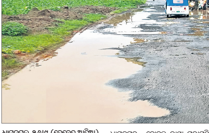
ଭଞ୍ଜାରିପୋଖରୀ ଶିବିରରେ ଅଧିକାରୀ ଓ ଅନ୍ୟମାନେ।

ଭଞ୍ଜାରିପୋଖରୀ, ୨୬.୯ (ରାଜେନ୍ଦ୍ର ଶତପଥୀ) ୧୬ନଂ. ଜାତୀୟ ରାଜପଥର ତାହାଲା ମହଲପୋଲ ନିକଟରେ ଏକ ଫଳ ବୋହେଇ ଟ୍ରକ୍ ଦୁର୍ଘଟଣା ସମୟରେ ଫଳ ଲୁଚ୍ ଅଭିଯୋଗରେ ଭଞ୍ଜାରିପୋଖରୀ ଥାନାରେ ଏକ ମାମଲା ରୁଜୁ ହୋଇଛି।