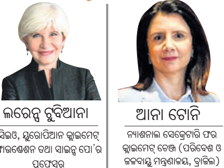
ଲରେନ୍ସ ବୁଦିଆନା ସିଦ୍ଧା, ସୁରୋପିଆନ କ୍ଲବ୍ ମେମ୍ବର ପାଠକୃତ୍ୟ ଓ ପାଠକୃତ୍ୟ ପ୍ରଦାନକାରୀ

ପ୍ରାୟ ଦଶନ୍ଧି ପୂର୍ବେ ପ୍ୟାରିସରେ ଦେଶମାନେ ଏକାଠି ହୋଇ ଜଳବାୟୁ ବିପର୍ଯ୍ୟୟ ହ୍ରାସ ପାଇଁ ପଦକ୍ଷେପ ନେବାକୁ ଏକମତ ହୋଇଥିଲେ । କିନ୍ତୁ ଶକ୍ତି, ପରିବହନ ଏବଂ କୃଷି ପରି କ୍ଷେତ୍ରକୁ ସବୁଜ କ୍ଷେତ୍ରରେ ରୂପାନ୍ତର କରିବା ପାଇଁ ଆବଶ୍ୟକ ଗଠନମୂଳକ ଅର୍ଥନୈତିକ ସଂସ୍କାର ଉପରେ ଏକ ସ୍ପଷ୍ଟ ସହମତ ରହିଥିଲେ ମଧ୍ୟ ଆବଶ୍ୟକୀୟ ପୁଞ୍ଜି ବିନିଯୋଗ ଶୀଘ୍ର କରାଯାଇନାହିଁ । ଏହା ପରିବର୍ତ୍ତେ, ଆମର ଶାସନ ବ୍ୟବସ୍ଥାଗୁଡ଼ିକ ଅଧିକ ସ୍ପଷ୍ଟ ତଥା ଗମ୍ୟର ଜଳବାୟୁ ଏବଂ ପରିବେଶ ସଙ୍କଟ ଉପରେ ପର୍ଯ୍ୟାପ୍ତ ପ୍ରତିକ୍ରିୟା ପାଇବା ପାଇଁ ସଂସର୍ପିତ କରୁଛନ୍ତି । ଅନେକ ସରକାର ଚଳୁ ଜଳବାୟୁ ପଦକ୍ଷେପ ପାଇଁ ପ୍ରସ୍ତାବ ଦେଇଛନ୍ତି । କିନ୍ତୁ ଏହା ପ୍ରାୟତଃ ଏକ ସାମାଜିକ ପ୍ରତିକ୍ରିୟା ସୃଷ୍ଟି କରିଥାଏ, କାରଣ ସେଗୁଡ଼ିକୁ ଅନାୟତ୍ତ ଏବଂ ଅସମାନ ଭାବରେ ବିବେଚନା କରାଯାଏ । ନୂଆନୀତିଗୁଡ଼ିକ ବିରୋଧରେ ଚଳୁଛି । ନୀତି, ଜାତୀୟ ନୀତି ବିରୋଧରେ ସହରାଞ୍ଚଳ ନୀତି କିମ୍ବା ଗରିବ ଦେଶଗୁଡ଼ିକର ନୀତି ବିରୋଧରେ ଧନୀ ଦେଶଗୁଡ଼ିକ ନୀତି ରଖିବାକୁ ଲାଗିଛନ୍ତି । ସୋସିଆଲ ମିଡିଆରେ ଏହିପରି ବିବାଦଗୁଡ଼ିକ ପ୍ରସ୍ତୁତ କରାଯାଉଛି, ଯେଉଁଠାରେ ସେଗୁଡ଼ିକ ଭୁଲ୍ ତଥ୍ୟ, ଉଦ୍ଦେଶ୍ୟମୂଳକ ମତବ୍ୟ ଏବଂ ଧୁବାକରଣର କେନ୍ଦ୍ର ପାଲଟିଯାଉଛି ।