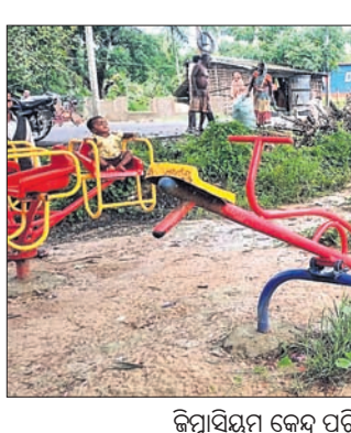
ଜିମ୍‌ସାଇଡ଼ କେନ୍ଦ୍ର ପରିସରରେ କାମ ଚାଲିଯାଇଛି।

ବାସୁଦେବପୁର ପୌରପାଳିକା ଅଧୀନ ୨୨ ନଂ. ଖାର୍ତ୍ତିର ଭୈରବପୁର ଗ୍ରାମ ଛକଠାରେ ନିର୍ମାଣାଧୀନ ଓପନ ଜିମ୍‌ସାଇଡ଼ କେନ୍ଦ୍ର ଅଧିପତ୍ତିଆ ଅବସ୍ଥାରେ ରହିଛି।