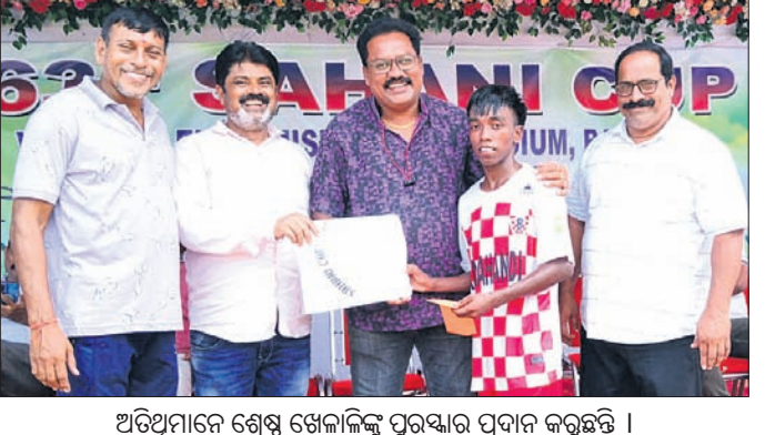
ଅତିଥିମାନେ ଶ୍ରେଷ୍ଠ ଖେଳାଳିଙ୍କୁ ପୁରସ୍କାର ପ୍ରଦାନ କରୁଛନ୍ତି।