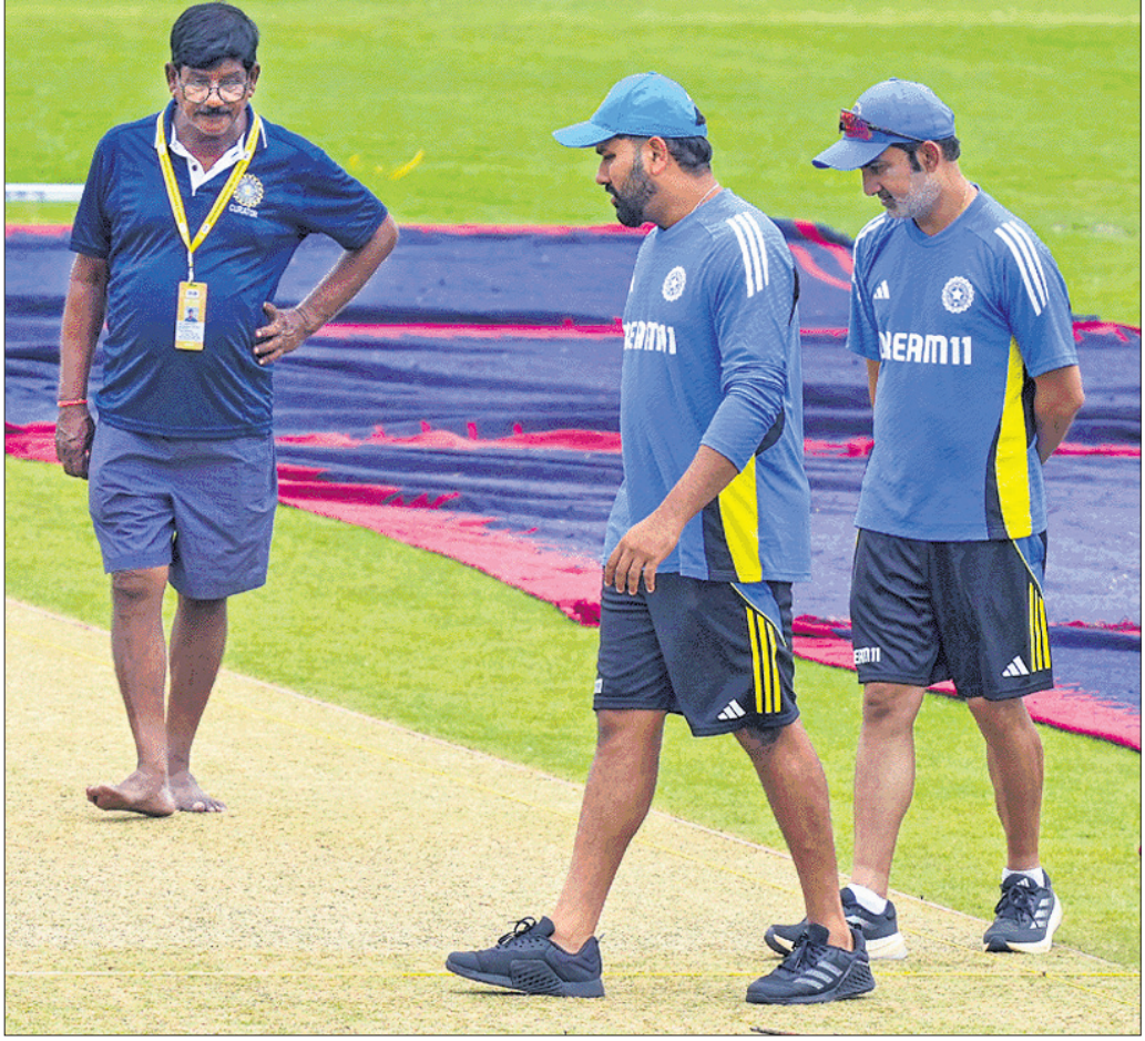
ଅଧିନାୟକ ରୋହିତ ଶର୍ମା ଓ କୋର୍ଟ ଗୋଟିଏ ଗମ୍ଭୀର ପିଠି ନାରିକ୍ଷଣ କରୁଛନ୍ତି।

ବିଜୟ ହାସଲ କରିପାରିଥିଲା। ବିଶେଷ କରି ଘରୋଇ ଗ୍ରାଉଣ୍ଡରେ ପ୍ରତ୍ୟାବର୍ତ୍ତନ କରି ଭାରତ ଯେପରି ଟେଷ୍ଟ କ୍ରିକେଟରେ ଏହାର ଆଧିପତ୍ୟ ଜାହିର କଲା ଏଥିରୁ ମନେହେଉଛି ଦଳ ନିଜ ଦେଶରେ କ୍ରମାଗତ ୧୮ ସିରିଜ ବିଜୟ ସହ ଏହାର ରେକର୍ଡ ସଂଖ୍ୟାକୁ ବୃଦ୍ଧି କରିବା ପଥରେ ଅଗ୍ରସର ହେଉଛି। ସ୍କାଚଟେକ୍ କ୍ରିକେଟକୁ ପ୍ରତ୍ୟାବର୍ତ୍ତନରେ ସଫଳ ହୋଇଥିବା ପଛ ପୁଣି ପ୍ରମାଣ କରି ଦେଖାଇବାକୁ ହେବ ଯେ, ଟେଷ୍ଟ କ୍ରିକେଟରେ ସେ କେ ଧୂରନ୍ଧର। ସିରିଜ ଓପନରରେ ବାଲାଦେଶ ଯେଉଁ ବୋଲର ହସନ ମେହସୁଦ୍ ଓ ତସଦିନ ଅହମଦଙ୍କ ଲାଇନ୍ ଲେନ୍ଥ ବୋଲି ଆଗରେ ଉଭୟ ରୋହିତ ଓ ବିରାଟଙ୍କ ବ୍ୟାଟ ନାଭିତ ରହିଥିଲା। ଆଗକୁ ଏକ ଲକ୍ଷ୍ୟ ଟେଷ୍ଟ ସିକ୍ସନ ରହିଥିବା ବେଳେ ଦଳର ଏହି ଦୁଇ ପ୍ରମୁଖ ବ୍ୟାଟରୁ