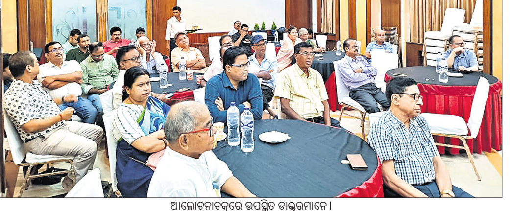
ଆଲୋଚନାଚକ୍ରରେ ଉପସ୍ଥିତ ଡାକ୍ତରମାନେ।

ଭଦ୍ରକ, ୨୬.୯ (ସମାଚାର ଉତ୍ତର/ରବିନାରାୟଣ ଖୁଲାର) ଭାରତୀୟ ଚିକିତ୍ସକ ସଂଘର ଭଦ୍ରକ ଶାଖା ପକ୍ଷରୁ ଏକ ହୋଟେଲ ସମ୍ମିଳନୀ କକ୍ଷରେ ଆଲୋଚନାଚକ୍ର ଅନୁଷ୍ଠିତ ହୋଇଯାଇଛି।