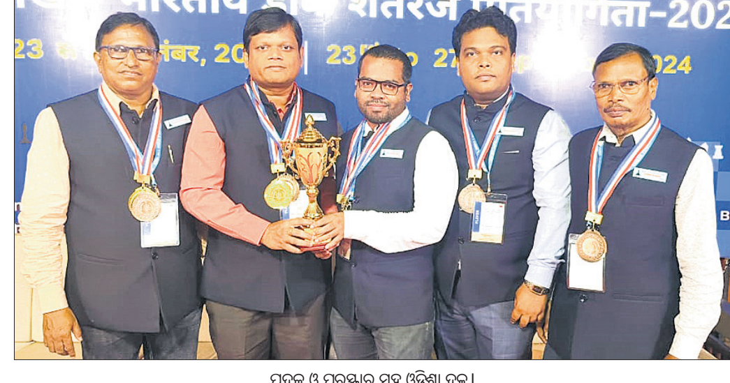
ପଦକ ଓ ପୁରସ୍କାର ସହ ଓଡ଼ିଶା ଦଳ।