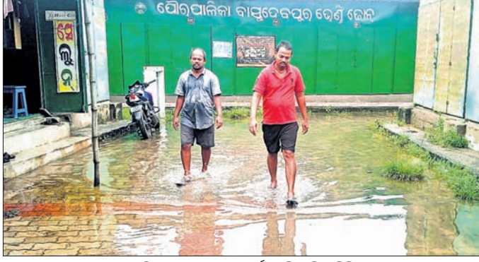
ଭେଣ୍ଟିଲେଟିଭ ଆଗରେ ବର୍ଷାପାଣି ଜମି ରହିଛି। ବ୍ୟବସାୟୀମାନେ ଦୋକାନ ଖୋଲିପାରୁ ନାହାନ୍ତି। ବର୍ଷାକଳ ଜମି ରହୁଥିବାରୁ କୌଣସି ଗ୍ରାହକ ପାଣିରେ ପଶି ଦୋକାନକୁ ସାମଗ୍ରୀ କରିବାକୁ ଆସୁନାହାନ୍ତି।

ବାସୁଦେବପୁର, ୨୬.୯ (ନାରାୟଣ ପ୍ରସାଦ ବାରିକ) ବାସୁଦେବପୁର ପୌରପାଳିକା ପକ୍ଷରୁ ହାଲୁକା ଛକ ନିକଟରେ ନିର୍ମିତ ଭେଣ୍ଟିଲେଟିଭ ଆଗରେ ଏବେ ବର୍ଷାକଳ ଜମି ରହିଛି।