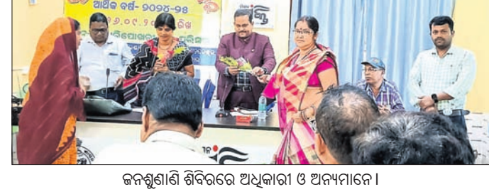
ଜନଶୁଣାଣି ଶିବିରରେ ଅଧିକାରୀ ଓ ଅନ୍ୟମାନେ।

ଭଞ୍ଜାରିପୋଖରୀ, ୨୬.୯ (ରାଜେନ୍ଦ୍ର ଶତପଥୀ) ୨୦୨୪-୨୫ ଆର୍ଥିକ ବର୍ଷ ପାଇଁ ଏମ୍‌ଜିଏନ୍‌ଆର୍କିଏସ୍ (ମହାମୁଁ ଗାନ୍ଧୀ ହେଉଛନ୍ତି) ପ୍ରକାଶନା ଲି. ଯୋଡ଼ାଗଣ ନାଳ ବିଦେଶୀ ମଦ ଦୋକାନ ନିକଟରେ ବର୍ଷକୁ ୪ଥର ରାସ୍ତା ମରାମତି ହେଉଛି।