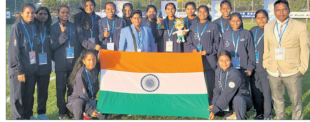
ଫେୟାର ପ୍ଲେ ପୁରସ୍କାର ବିଜୟୀ କିଟ୍ ବିଶ୍ୱବିଦ୍ୟାଳୟ ଦଳ।