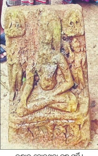
ଉଦ୍ଧାର ହୋଇଥିବା ବୁଦ୍ଧ ମୂର୍ତ୍ତି।

ଭଞ୍ଜାରିପୋଖରୀ ବ୍ଲକ୍ରେ ଷୋଳମପୁର ପଞ୍ଚାୟତ ମୁଦ୍ରାପଦା ଗ୍ରାମ ନିକଟ ବୈତରଣୀ ନଦୀ ଶଯ୍ୟାରୁ ଏକ ବିରଳ ଭୂମିଧର୍ମ ବୁଦ୍ଧ ମୂର୍ତ୍ତି ଗୁରୁବାର ଉଦ୍ଧାର କରାଯାଇଛି।