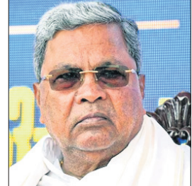
ସିଦ୍ଧାରାମାୟା ବେଙ୍ଗାଳୁରୁ, ୨୬/୯

ସିବିଆଇକୁ କବାଟ କିଲିଦେଲା କର୍ମାଚକ ମୁଖ୍ୟମନ୍ତ୍ରୀ ପଦରୁ ଇସ୍ତଫା ଦେବିନାହିଁ: ସିଦ୍ଧାରାମାୟା