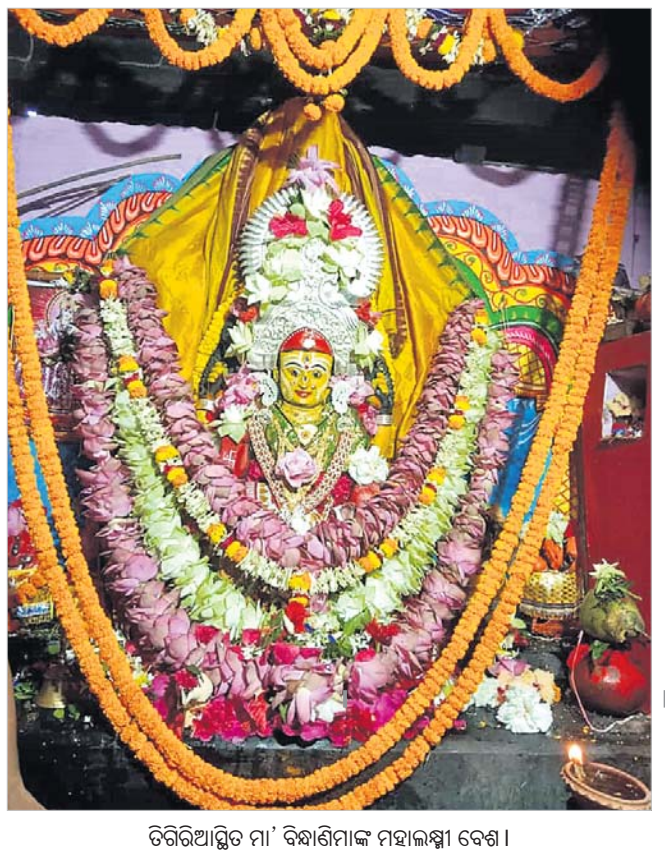
ଚିତ୍ରିତଆସିତ ମା' ବିଦ୍ୟାଧିପାଳ ମହାଲକ୍ଷ୍ମୀ ବେଶ ।