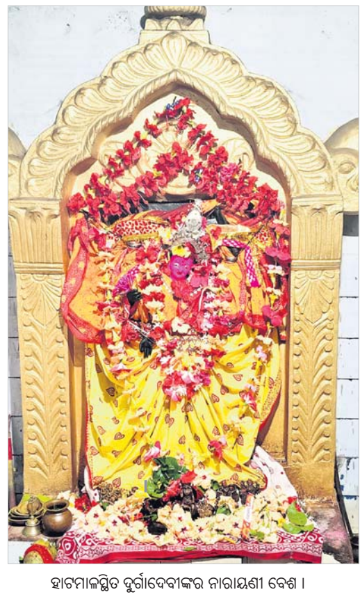
ହାଟମାଳସ୍ଥିତ ଦୁର୍ଗାଦେବୀଙ୍କର ନାରାୟଣୀ ବେଶ ।