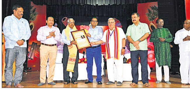
ଓଡ଼ିଶା ସଙ୍ଗୀତ ନାଟକ ଏକାଡେମୀ ପକ୍ଷରୁ ପାଲା ଗାୟକ ସମ୍ପର୍କିତ ପ୍ରଦର୍ଶନୀ ପାଇଁ ସମ୍ମାନ ପ୍ରଦାନ କରାଯାଇଛି।

ଓଡ଼ିଆ ଭାଷା, ସାହିତ୍ୟ ଓ ସଂସ୍କୃତି ପ୍ରତି ସମାଜର ଧ୍ୟାନ ଦେବା ପାଇଁ ଏକାଡେମୀ ପକ୍ଷରୁ ପାଲା ଗାୟକ ସମ୍ପର୍କିତ ପ୍ରଦର୍ଶନୀ ପାଇଁ ସମ୍ମାନ ପ୍ରଦାନ କରାଯାଇଛି।