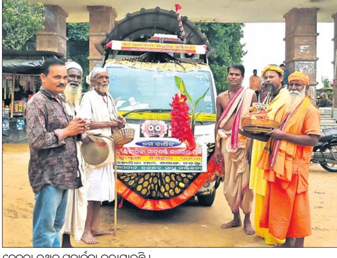
ଚେତନା ରଥକୁ ପୂଜାର୍ଚ୍ଚନା କରାଯାଉଛି ।

ନର୍ସି ଅଫିସରଙ୍କ କାର୍ଯ୍ୟରେ ନିୟୋଜିତ କରାଯିବା ନେଇ ବ୍ୟବସ୍ଥା କରାଯାଇଛି। ଏନେଇ ଜିଲା ମୁଖ୍ୟ ଚିକିତ୍ସାଧିକାରୀ ଡା. ମକରମ ବେହେରା କହିଛନ୍ତି, ସ୍ୱାସ୍ଥ୍ୟବିଭାଗର ନିର୍ଦ୍ଦେଶକ୍ରମେ ମେଡିକାଲଗୁଡ଼ିକରେ ବ୍ୟାପକ ବ୍ୟବସ୍ଥା କରାଯାଇଛି।