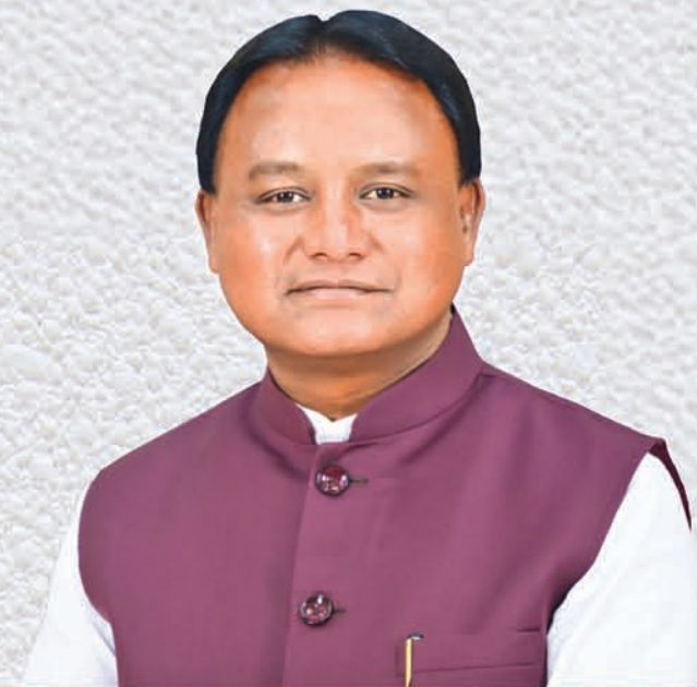
ଶ୍ରୀ ମୋହନ ଚରଣ ମାଝୀ ମୁଖ୍ୟମନ୍ତ୍ରୀ, ଓଡ଼ିଶା

ପ୍ରଗତିର ନୂତନ ସୂର୍ଯ୍ୟୋଦୟ ୨୦୩୭ ସୁଦ୍ଧା ହେବ ବିକଶିତ ଓଡ଼ିଶାର ଅଭ୍ୟୁଦୟ