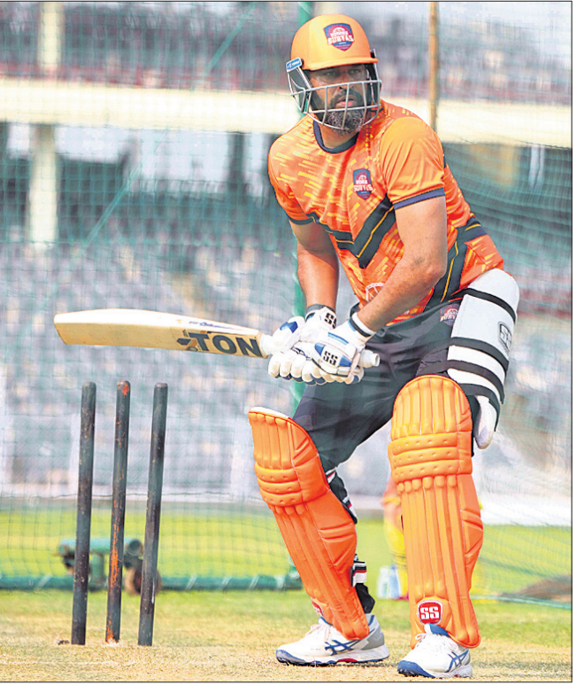
ପୁରୁଣାରେ ଅଭ୍ୟାସ ଅବସରରେ ଯୁସୁଫ ପଠାନ।

“ଲିଜେଣ୍ଡ ଲିଗ୍ କ୍ରିକେଟ ପ୍ରୋତ୍ସାହିତ କରି ଆସୁଛି। କ୍ରିକେଟକୁ ଅନୁସରଣ କରୁଥିବା ଏବଂ ଏଥିରେ କ୍ୟାରିୟର କରିବାକୁ ଇଚ୍ଛୁକ ଯୁବକଙ୍କୁ ଆମେ ବ୍ୟକ୍ତିଗତଭାବେ ମଧ୍ୟ ସର୍ବଦା ଉତ୍ସାହିତ କରିବାକୁ ଚେଷ୍ଟା କରିଥାଉ। ଏଲ୍‌ଏଲ୍‌ସିରେ ଅଂଶ ଥିବା ଅଧିକାରୀଙ୍କ ଅବସରପ୍ରାପ୍ତ ଖେଳାଳି ଅନ୍ତର୍ଜାତୀୟ ସ୍ତରରେ ନିଜ ଦେଶକୁ ପ୍ରତିନିଧିତ୍ୱ କରିଛନ୍ତି। ତେଣୁ ଅଭ୍ୟାସ ପାଇଁ ଦଳରେ ଯୋଗଦେଇଥିବା ଯୁବ ଖେଳାଳିମାନେ ସେମାନଙ୍କଠାରୁ ଅନେକ କିଛି ଶିଖିବାକୁ ପାଉଛନ୍ତି” ବୋଲି ପ୍ରକାଶ କରିଛନ୍ତି ଭାରତୀୟ କ୍ରିକେଟ ଦଳର ପୂର୍ବତନ ଅଲ୍ରାଉଣ୍ଡର ଯୁସୁଫ ପଠାନ। ଅନ୍ତର୍ଜାତୀୟ କ୍ରିକେଟକୁ ଅବସର ନେବାପରେ ସେ ବିଭିନ୍ନ ପ୍ରାଥମିକତାଗତ ଲିଗରେ ଖେଳୁଛନ୍ତି। ଚଳିତବର୍ଷ ଲିଜେଣ୍ଡ ଲିଗ୍ କ୍ରିକେଟ (ଏଲ୍‌ଏଲ୍‌ସି)ରେ ସେ କୋଣାର୍କ ସୂର୍ଯ୍ୟସ ଟାଇଗରସ୍ ପ୍ରତିନିଧିତ୍ୱ କରୁଛନ୍ତି। ଏହା ଟାଇଗରସ୍ ପ୍ରଥମ ଲିଗ୍‌ଭିତ୍ତିକ କ୍ରିକେଟ ଦଳ ହୋଇଥିବାରୁ ରାଜ୍ୟବାସୀଙ୍କ ଲାଗି ନିଶ୍ଚିତ ଖୁସିର ବସ୍ତୁ। କଣେ କ୍ରିକେଟର ଭାବେ ଆମେ ଏକ ରାଜ୍ୟ ତଥା ଆମ ଦେଶର ପ୍ରତିନିଧିତ୍ୱ କରିବାରେ ସର୍ବଦା ଗର୍ବିତ ଅନୁଭବ କରୁ। ପରବର୍ତ୍ତୀ ପିଠି କ୍ରିକେଟରକୁ ଉତ୍ସାହିତ କରୁ ଥିବାରୁ ଆମେ ଖୁବ୍ ଆନନ୍ଦିତ ବୋଲି ଯୁସୁଫ କହିଛନ୍ତି। ୨୦୦୭ ଟି୨୦ ବିଶ୍ୱକପ୍ ସମ୍ପର୍କରେ ଯୁସୁଫ କହିଛନ୍ତି ଯେ, ଇତିମଧ୍ୟରେ ୧୬ ବର୍ଷ ବିତିଗଲାଣି। ସେବେଠାରୁ କ୍ରିକେଟରେ ଅନେକ କିଛି ପରିବର୍ତ୍ତନ ଆସିଛି। ଆମେ ଯେତେବେଳେ ବିଶ୍ୱକପ୍ ଚିତ୍ତୁକୁ କାହାକୁ ଏହି ଫର୍ମାଟରେ କେଉଁ ଭଳି ଖେଳାଯାଏ ଜଣା ନ ଥିଲା। ଆମେ