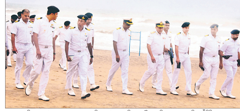
ଭାଇସ୍ ଆଡମିରାଲ୍ ସମୀକ୍ଷା ପରେ ସେନା ଗୋଲଡେନ ବେଲୁଡ଼ି ଲ ବୁ ପୁରୀ ବିଦ୍ରୁଳ ଦେଖିଛନ୍ତି।

ତିସମସ ୪ ତାରିଖରେ ପୁରୀରେ ନୌସେନା ଦିବସ ଆୟୋଜିତ ହେବ। ତେବେ କାର୍ଯ୍ୟକ୍ରମ ପୂର୍ବରୁ ଭାଇସ୍ ଆଡମିରାଲ୍ ପୁରୀ ଗସ୍ତରେ ଆସି ଛିଡର ସମୀକ୍ଷା କରିଛନ୍ତି।