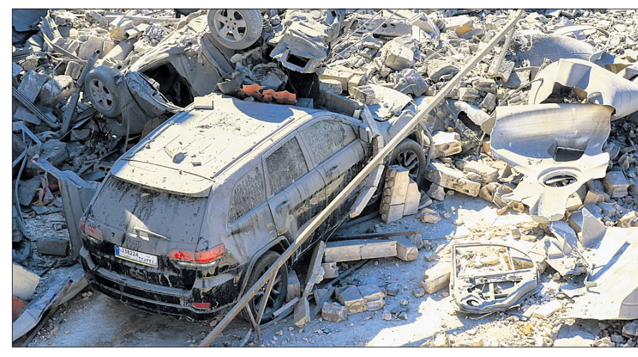
ଭୁଆଦିଲ୍ଲା ସେନାର ଏୟାରସ୍ତରକ୍ଷକରେ ଧୂସ୍ରବିଧ୍ୟୁ ଲେବାନନ୍ଦର ସମ୍ମୁଖରେ ।

ଦର ଦକ୍ଷତା ଅନୁସାରେ ଅଣକୃଷକମାନଙ୍କୁ ମଜୁରି ବୃଦ୍ଧି କରିବାକୁ କେନ୍ଦ୍ର ସରକାର ଆହ୍ୱାନ କରୁଛନ୍ତି । ଗୁଜରାଟ ସରକାରଙ୍କୁ ସୁପ୍ରିମକୋର୍ଟ ଝଟ୍କା ଦେଇଛି । ଗୁଜରାଟ ସରକାରଙ୍କୁ ସୁପ୍ରିମକୋର୍ଟ ଝଟ୍କା ଦେଇଛି ।