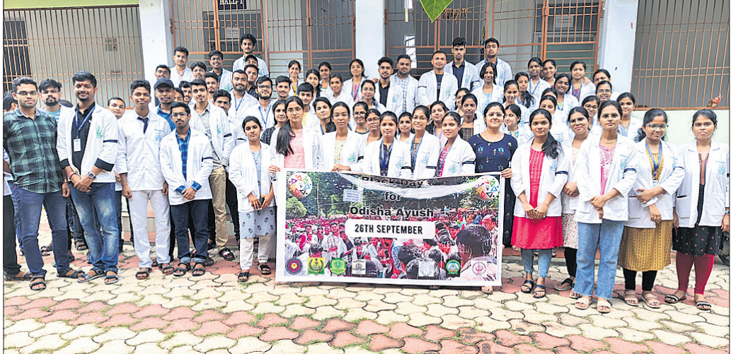
ନିଖିଳ ଓଡ଼ିଶା ଆୟୁଷ ଛାତ୍ର ସଂଘ ତରଫରୁ ରାଜ୍ୟର ସମସ୍ତ ସରକାରୀ ଆୟୁଷ ମହାବିଦ୍ୟାଳୟରେ କଳାଦିବସ ପାଳନ କରାଯାଇଛି।

କଣାସ ବ୍ଲକ୍ ଅଧୀନ ବସନ୍ତପୁର ଗ୍ରାମରେ ୮ମ ଶ୍ରେଣୀର ପଢ଼ାଉଥିବା ଛାତ୍ରୀଙ୍କ ମୃତ୍ୟୁ ଘଟିଛି। ସେ କଣାସ ବ୍ଲକ୍ରେ ପ୍ରତିଷ୍ଠିତ ଆଦର୍ଶ ବିଦ୍ୟାଳୟ ୮ମ ଶ୍ରେଣୀରେ ପାଠ ପଢୁଥିଲେ।