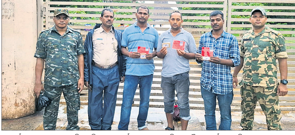
କୋଣାର୍କଠାରେ ସମରାଜ୍ୟାସରେ ବ୍ରତୀୟ ଦିନରେ ରୁ ପୋର୍ସ ଆତଙ୍କବାଦୀଙ୍କୁ ଧରିବାର କୌଶଳ ପ୍ରଦର୍ଶନ କରୁଛନ୍ତି।

ପ୍ରଦର୍ଶନ କରିବ। କାର୍ଯ୍ୟକ୍ରମରେ ରାଷ୍ଟ୍ରପତି ତ୍ରୈପଦା ପୂର୍ଣ୍ଣ ଯୋଗଦେବାର ସମ୍ଭାବନା ରହିଛି।