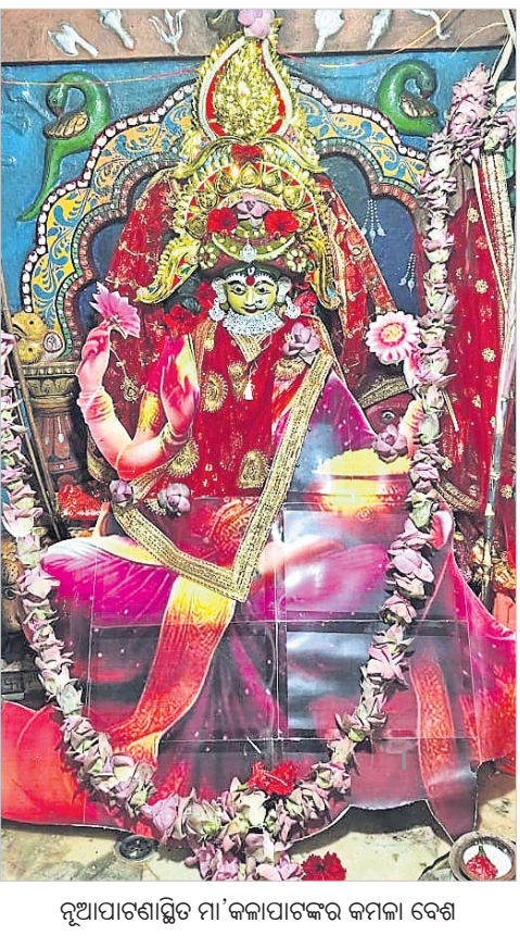
ନୂଆପାଟଣାସ୍ଥିତ ମା' କଳାପାଟଙ୍କ କମଳା ବେଶ ।