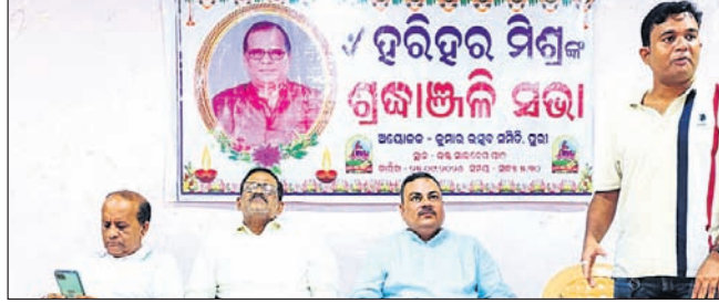
ପୁରୀ, ୨୬।୯ (ଅଜିତ୍ କୁମାର ମହାନ୍ତି)

ପୁରୀ ୨୬।୯ (ଅଜିତ୍ କୁମାର ମହାନ୍ତି) ରାଷ୍ଟ୍ରୀୟ ସେବା ଦିବସ ପାଳିତ ହୋଇଛି। ଏହି କାର୍ଯ୍ୟକ୍ରମରେ ହାତ୍ରାହାତ୍ରାମାନଙ୍କୁ ସେବା ଯୋଜନା ଦିବସ ପାଇଁ ହେଉଛି।