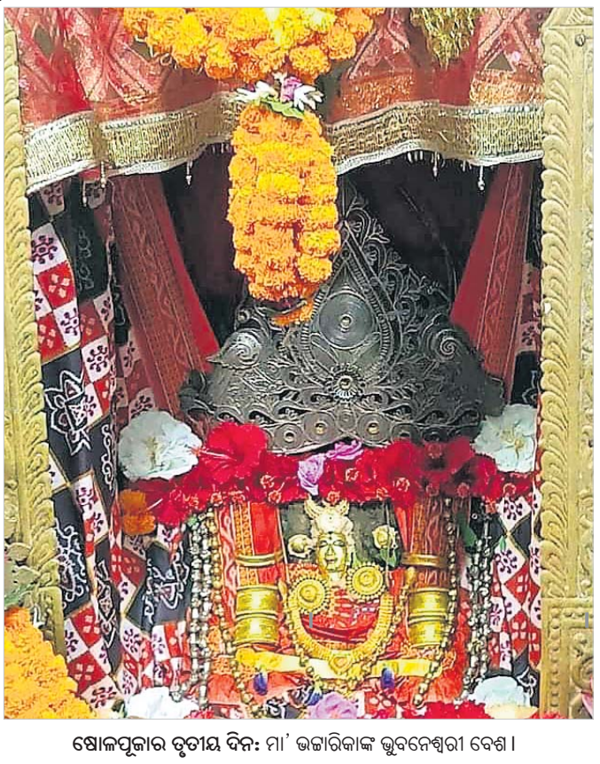
ଷୋଳପୂଜାର ତୃତୀୟ ଦିନ: ମା' ଭଜାରିକାଙ୍କ ଭୁବନେଶ୍ୱରୀ ବେଶ ।