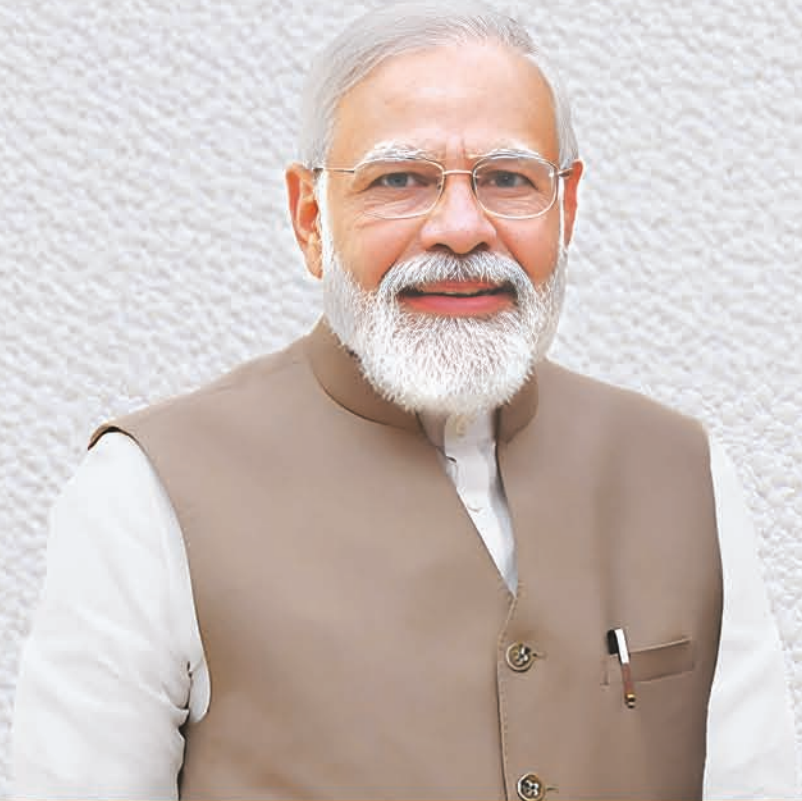
ଶ୍ରୀ ନରେନ୍ଦ୍ର ମୋଦୀ ପ୍ରଧାନମନ୍ତ୍ରୀ