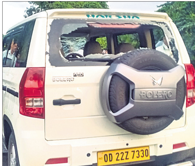
ଉତ୍ତମକୁ ଲୋକଙ୍କ ଦ୍ୱାରା ଭଦ୍ରକ ତହସିଲଦାରଙ୍କ ଗାଡ଼ି ଭଙ୍ଗାଯାଇଛି।