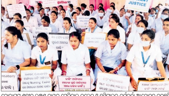
କୋରାପୁଟ ଶହାଦ ଲକ୍ଷ୍ମଣ ନାୟକ ମେଡିକାଲ କଲେଜ ଓ ହସ୍ପିଟାଲର କର୍ମଚାରୀ ଆନ୍ଦୋଳନ କରୁଛନ୍ତି।