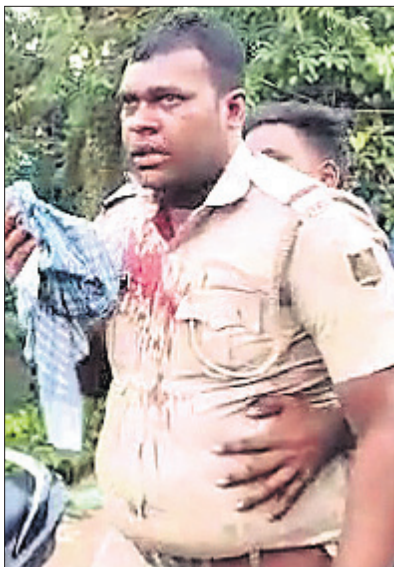
ପଥର ମାଡ଼ରେ ଆହତ ଗଞ୍ଜଗୋକନା ଧାମନଗର ରୋଡ୍‌ରେ ପୁରୁ।