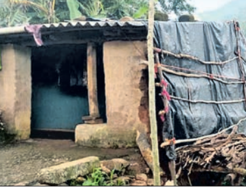
କାନିଆମାରିକ ଭାଙ୍ଗିଯାଇଥିବା ଘର।

କୋରାପୁଟ ଜିଲାରେ ବର୍ଷାରେ ସେମିଲିଗୁଡ଼ା କୁଳ ସାହାଯ୍ୟ ପଞ୍ଚାୟତର ସାହାଯ୍ୟ ଗ୍ରାମର ୩ ପରିବାର ବେଘର ହୋଇଛନ୍ତି।