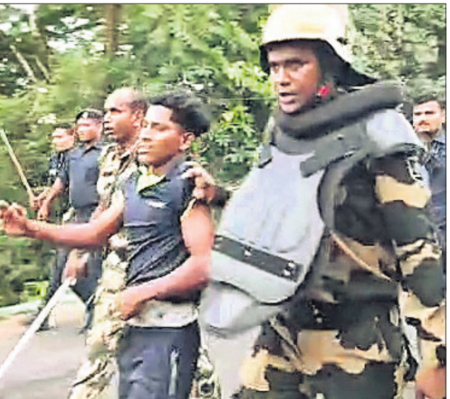
ଜଣେ ଗଞ୍ଜଗୋକନାକୁ ପୋଲିସ୍ ଉଠାଇ ନେଉଛି।

ଭଦ୍ରକ, ୨୭।୯ (ସମ୍ବାଦନ ରାଉତ) ସୋସିଆଲ ମିଡିଆରେ ଏକ ପୋଷ୍ଟକୁ ନେଇ ଶୁକ୍ରବାର ଅପରାହ୍ଣରେ ଭଦ୍ରକ ସହରର ସକ୍ରିୟତାରେ ତୁମ୍ଭଙ୍କ କାଣ୍ଡ ଘଟିଛି। ଉତ୍ତମକୁ ଲୋକେ ପୋଲିସ୍ ଉପରମାଡ଼ ପଥରମାଡ଼ କରିଛନ୍ତି। ଏଥିରେ ୨ ପୋଲିସ୍ ଅଧିକାରୀ ଆହତ ହୋଇଥିବା ବେଳେ ଘଟଣାସ୍ଥଳକୁ ଯାଇଥିବା ତହସିଲଦାରଙ୍କ ଗାଡ଼ିକୁ ଭଙ୍ଗି ଦେଇଛନ୍ତି ଉତ୍ତମକୁ ଲୋକେ। ଛୁଟି ଅଣାୟତ୍ତ ହେବାରୁ ପୋଲିସ୍ ଲାଠିଚାଳି କରିଛି। ଉତ୍ତମକୁ ପରେ ସନ୍ଧ୍ୟାରେ ଆଇନଶୁଖିଳା ପରିସ୍ଥିତିକୁ ଲକ୍ଷ୍ୟ କରି ଜିଲ୍ଲା ପ୍ରଶାସନ ପକ୍ଷରୁ ବିଏନ୍‌ଏସ୍‌ଏସ୍ ୧୬୩ ଧାରା ଅନିର୍ଦ୍ଦିଷ୍ଟ କାଳ ପାଇଁ ଜାରି କରାଯିବା ସହ ଘଟଣାସ୍ଥଳରେ ୭ ପ୍ଲାଟୁନ ଯୋଗେ ପୁରୁଷନିକ୍ଷେପ କରାଯାଇଛି। ଏହି ଘଟଣାରେ ପୋଲିସ୍ ଜଣଙ୍କୁ ଅଟକ ରଖିଛି।