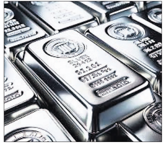
୨୪ କ୍ୟାରେଟ ସୁନା ୧୦ ଗ୍ରାମ ପିଛା ୨୭,୧୮୩ ଟଙ୍କାରେ ପହଞ୍ଚିଛି।