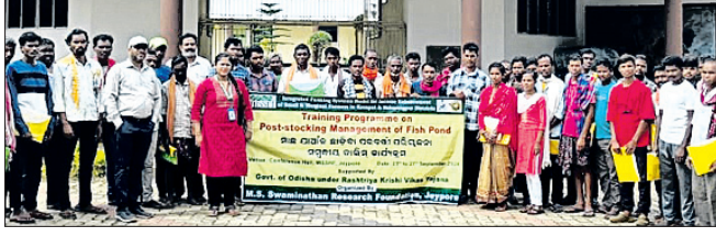
କାର୍ଯ୍ୟକ୍ରମରେ ଉପସ୍ଥିତ ମାଛଗଣ୍ୟ ଓ ତାଲିମଦାତା।

କନ୍ୟାପୁର, ୨୭।୯ (ପବନ ପାଣିଗ୍ରାହୀ) କନ୍ୟାପୁର ଗବେଷଣା ପ୍ରତିଷ୍ଠାନ ପକ୍ଷରୁ ମାଛ ଯାଆଁଳ ଛାଡ଼ିବା ଓ ପରବର୍ତ୍ତୀ ପରିଚାଳନା କାର୍ଯ୍ୟକ୍ରମ ଆରମ୍ଭ ହୋଇଛି।