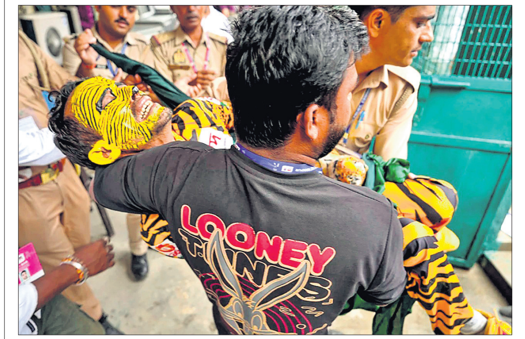
ଅପସ୍ତ ବାଂଲାଦେଶୀ ସମର୍ଥକଙ୍କୁ ହସିତାଳ ନିଆଯାଇଛି।

କାନପୁର, ୨୭ତା (ପି.ଟି.) କାନପୁରରେ ଅନୁଷ୍ଠିତ ଭାରତ ବିପକ୍ଷ ଦ୍ୱିତୀୟ ଚେଷ୍ଟା ମ୍ୟାଚ୍ରେ ପ୍ରଥମ ଦିନରେ ବାଂଲାଦେଶ ୩ ରକ୍ତକେଟ ହରାଇ ୧୦୭ ରନ୍ ସଂଗ୍ରହ କରିଛି। ବର୍ଷା ବାଧାପ୍ରାପ୍ତ ଦିନରେ ମାତ୍ର ୩୫ ଓଭରରେ ଖେଳ ସମ୍ପନ୍ନ ହୋଇଥିଲା। ମେଲୁଆ ପାଟ ରହିବା ନେଇ ପୂର୍ବାହ୍ନୀୟ ଚେଷ୍ଟା ବେଳେ ଭାରତ ୩ ଯେବ୍