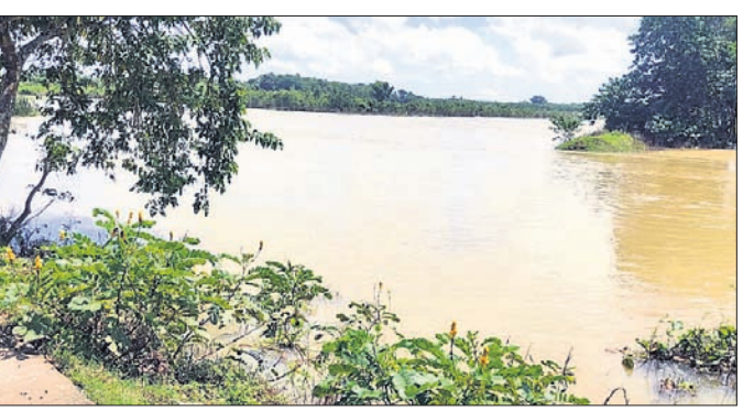
କୁମ୍ଭୀରୀଠାରେ ମୁକୁଳା ନଦୀବନ୍ଧ ଦେଇ ତଳିଆ ଅଞ୍ଚଳକୁ ବନ୍ୟାଜଳ ପ୍ରବାହିତ ହେଉଛି ।

ବାଲେଶ୍ୱର ଜିଲ୍ଲା ବାଲିଆପାଳ ବ୍ଲକ୍‌ରେ ସୁବର୍ଣ୍ଣରେଖା ନଦୀ ଅବବାହିକାର ବିଭିନ୍ନ ସ୍ଥାନରେ ନଦୀ ବନ୍ଧ ମୁକୁଳା ପଡ଼ିଥିବାରୁ ଅନାୟତ୍ତରେ ବନ୍ୟାଜଳ ବାଷ୍ପଜନିତେ ମାଡ଼ିଯାଇଛି । ଫଳରେ ଚାଷୀଙ୍କୁ ବାରମ୍ବାର କ୍ଷତି ସହିବାକୁ ପଡ଼ୁଛି । ବାଲିଆପାଳ ପଞ୍ଚାୟତ କୁମ୍ଭୀରୀ ଗ୍ରାମ ଦେଇ ପ୍ରବାହିତ ସୁବର୍ଣ୍ଣରେଖା ନଦୀର ଶାଖାନଦୀ ଅବବାହିକା, ଯିଏକି ସୁବର୍ଣ୍ଣରେଖା ନଦୀକୁ କୁମ୍ଭୀରୀଠାରୁ ବାହାରି ବିଷୁପୁର ପଞ୍ଚାୟତ ଅଭିମୁଖେ ପ୍ରବାହିତ ହେଉଛି । ଏହି ଶାଖା ନଦୀର ବନ୍ଧ କୁମ୍ଭୀରୀଠାରେ ପୋଲଠାରେ ପ୍ରାୟ ୧୫୫ ମିଟରରୁ ଅଧିକ ଲମ୍ବର ନଦୀବନ୍ଧ ସ୍ଥାପନା ପଡ଼ିରହିଛି । ଫଳରେ ନଦୀରେ ପ୍ରାୟ ୧୫୫ ମିଟରର ବନ୍ୟାଜଳ ଆସିଲେ ବାଲିଆପାଳ, କୁମ୍ଭୀରୀ, ସୁଜୁପୁର, ନନ୍ଦାବାଲି, ବିଷୁପୁର, ଲକ୍ଷ୍ମୀପାଳ, କୁଜୁଡ଼, ଚାକପଦା, ଜାମକୁଣ୍ଡା,