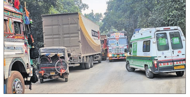
ଜାମରେ ଫସି ରହିଥିବା ଗାଡ଼ି।

ମୟୂରଭଞ୍ଜ ଜିଲ୍ଲା ବାଲିଗିପୋଷି ରୁକ ଅଧୀନ ୪୯୯ ନଂ. ଜାତୀୟ ରାଜପଥର ଦ୍ୱାରଶୁଣୀ ଘାଟି ରାସ୍ତା ଜାମ୍ ରହିଥିବା ଯୋଗୁ ଗାଡ଼ି ଚାଳକ ଓ ଯାତ୍ରୀମାନେ ନାହିଁ ନ ଥିବା ଅନୁଭବର ସମ୍ମୁଖୀନ ହେଉଛନ୍ତି। ଗୋଟିଏ ଗାଡ଼ି ପାର ହେବା ପାଇଁ ୪ ଘଣ୍ଟା ଅଧିକ ସମୟ ଲାଗୁଛି। ୪ ଦିନ ହେଲା ଏପରି ଜଟିଳ ସ୍ଥିତି ଲାଗିରହିଛି। ଏପରିକି ଆୟୁଲ୍ୟାନ୍ସ ମଧ୍ୟ ଦୀର୍ଘ ସମୟ ଧରି ଜାମରେ ଫସି ରହିଥିବା ଦେଖିବାକୁ ମିଳିଛି।