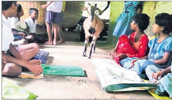
ପାଠପଢ଼ା ବେଳେ ପିଲାଙ୍କ ମଝିରେ ବୁଲୁଥିବା ଛେଳି।

ଘର। ଯେଉଁଠି ପିଲା ସେଇଠି ଚେରୁଲ ସାଜି ବିଦ୍ୟାଳୟ ଚେରୁଲ, ଛେଳି। ଛେଳି ବନ୍ଧା ଯାଉଥିବା ଯାହାକୁ ଶିକ୍ଷକମାନେ ବ୍ୟବହାର