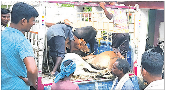
ଅବେତ ଷଣ୍ଢମାନଙ୍କୁ ସୁରୁ କରାଯାଇଛି ।

ବାଲେଶ୍ୱର ଜିଲ୍ଲା ଖଇରା ବ୍ଲକ୍‌ର ବୁଲୁ ଷଣ୍ଢକୁ ଏକ ପିକଅପ ଭ୍ୟାନରେ ଜବତ କରି ଶାରୀକୁଆ ଘାଟି ରାସ୍ତା ଦେଇ ପଶ୍ଚିମବଙ୍ଗ ଚାଲାଣ କରିବାକୁ ନେଉଥିବା ଭ୍ୟାନକୁ ଗ୍ରାମବାସୀ ଜବତ କରି ପୋଲିସ୍ ଜମା ଦେଇଛନ୍ତି । ଖଇରା ପୋଲିସ୍ ଷଣ୍ଢକୁ ଉଦ୍ଧାର କରିବା ସହ ଏଥିରେ ସମ୍ପୂର୍ଣ୍ଣ ୧୦ଜଣ ବ୍ୟକ୍ତିଙ୍କୁ ଆନାରେ ଅଟକ ରଖି ପଚରାଉତୁରା ରହି କିଛି ଭାବେ ଆଇନଶୁଖିଳା ପରିସ୍ଥିତି ବଜାଇ ରଖିବା ସହିତ ଶାନ୍ତିଶୁଖିଳାର ସହ ଦୁର୍ଗାପୂଜା ପାଳନ କରିବାକୁ ଜନସାଧାରଣଙ୍କୁ ନିବେଦନ କରିଛନ୍ତି । ଏଥିରେ ମାନ୍ୟଗଣ୍ୟ ବ୍ୟକ୍ତି ସୋରର ଅଗ୍ରାଣୀ ଅନୁଷ୍ଠାନ, ନାଗରିକ ମଞ୍ଚର ସଦସ୍ୟ ଓ ଦୁର୍ଗାପୂଜା କମିଟି ସଦସ୍ୟ ପ୍ରମୁଖ ଉପସ୍ଥିତ ରହି କିଛି ଶାନ୍ତି ଶୁଖିଳାରେ ସହ ପାଳନ କରିହେବ ବେନେଇ ଆଲୋଚନା କରାଯାଇଥିଲା । ବିଶେଷ କରି ଭିକେ ଏବଂ ଭେକର ଲାଜତ ନିଷେଧ କରିବା ସହିତ ସ୍ତମ୍ଭ ସାଉଣ୍ଡରେ ଦୁର୍ଗା ପୂଜା ପାଳିବାକୁ ଉପସ୍ଥିତ ଅଧିକାରୀମାନେ ପରାମର୍ଶ ଦେଇଥିଲେ ।