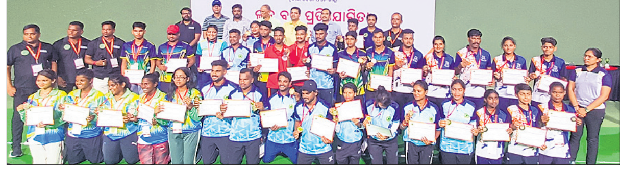
କୃତୀ ପ୍ରତିଯୋଗୀମାନେ ପୁରସ୍କାର ସହ ଅତିଥିଙ୍କ ଗହଣରେ।

ଭୁବନେଶ୍ୱର, ୩୦।୯ (ବି.ବି.): ପ୍ରାୟ ୧୫୦ରୁ ଅଧିକ ଖେଳାଳିଙ୍କୁ ପୁରସ୍କାର ପ୍ରଦାନ କରାଯାଇଛି।