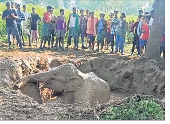
ଗାଡ଼ ଭିତରେ ପବିରହଥିବା ହାତୀ।

ଭବାନୀପାଟଣା/କେସିଙ୍ଗା, ୩୦।୯ (ଉତ୍ତମ କୁମାର ଦାଶ/ସୁମେଶ୍ୱର ସାହୁ) କଳାହାଣ୍ଡି ଜିଲ୍ଲା କେସିଙ୍ଗା ବନ ବିଭାଗ ରେଞ୍ଜ ଅଧିକ ଅଧୀନସ୍ଥ ସୌରାପଦର ଗ୍ରାମ ନିକଟ କାଳୁ ବନିବା ପରିସରରେ ଥିବା ୫୫୫ ଗଜାର ଏକ ଗାଡ଼ରେ ସେମାନଙ୍କର ସକାଳୁ ଏକ ବସ୍ତୁଆ ହାତୀ ପବିରହଥିବା ଦେଖିବାକୁ ମିଳିଥିଲା। ହାତୀଟି ବାହାରକୁ ଆସିବା ପାଇଁ କସରତ କରୁଥିଲେ ମଧ୍ୟ ଆସିପାରି ନ ଥିଲା। ଏ ବିଷୟରେ ଜାଣିବା ପରେ ସ୍ଥାନୀୟ ଗ୍ରାମବାସୀ ବନ ବିଭାଗକୁ ଜଣାଇଥିଲେ। ଖବର ପାଇ ବନ ବିଭାଗର ରେଞ୍ଜର ପ୍ରଭାବତୀ ସେଠାକୁ ସମେତ ବନ କର୍ମଚାରୀ ଘଟଣାସ୍ଥଳରେ ପହଞ୍ଚି ହାତୀକୁ ଉଦ୍ଧାର କରିବା ପାଇଁ ପ୍ରୟାସ ଆରମ୍ଭ କରିଥିଲେ। ଦୀର୍ଘ ୬ ଘଣ୍ଟା ଅକ୍ଳାନ୍ତ ପରିଶ୍ରମ ପରେ ହାତୀକୁ କେସିଙ୍ଗା ଦ୍ୱାରା ଗାଡ଼ରୁ ଉଦ୍ଧାର କରିଥିଲେ। ହାତୀଟି ଗାଡ଼ରୁ ବାହାରି ନିକଟସ୍ଥ ବଜ୍ରବଡ଼ ଜଳାଳ ଅଭିଯୁକ୍ତ ପକାଇଛି। ଗତ କିଛିଦିନ ହେବ ଏହି ଅଞ୍ଚଳରେ ଏକ ୩୦ ଡିକିଆ ହାତୀପଲ ବୁଲି ଉପହସ କରୁଥିଲେ। ଏମାନେ ପରଲକ୍ଷିଣା, ପୋଡ଼ଖମ, ଶିରୋଳ, ଭୁବନେଶ୍ୱରୀ ଆଦି ଗ୍ରାମର ଚାଷୀଙ୍କ ଧାନ, କଦା ଫସଲ ଖାଇ ନଷ୍ଟ କରିଛନ୍ତି। କ୍ଷତିପୂରଣ ପାଇଁ ଚାଷୀମାନେ ବନ ବିଭାଗକୁ ଲିଖିତ ଅଭିଯୋଗ କରିଛନ୍ତି। ବନ ବିଭାଗ ହାତୀମାନଙ୍କୁ ଘରଠାଳବାରେ ଅଧିକ ସହାୟକ ହୋଇଛି। ଏହାକୁ ନେଇ ସ୍ଥାନୀୟ ଲୋକଙ୍କ ମଧ୍ୟରେ ଅସନ୍ତୋଷ ଦେଖାଦେଇଛି। ଅନ୍ୟପକ୍ଷେ ହାତୀପଲ ଅଞ୍ଚଳରେ ରହୁଥିବାକୁ ରାତିରେ ବାଲିସି, ରେଙ୍ଗାଳି, ମଶାବିବନ୍ଧ, ପରଲକ୍ଷିଣା,