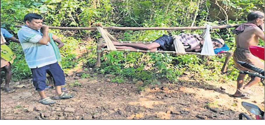
ରୋଗୀଙ୍କୁ ଖଟିଆରେ ବୋହି ନିଆଯାଉଛି।

ନିଆଯାଉଥିବା ଦେଖିବାକୁ ମିଳିଛି। ଖବରରୁ ଜଣାପଡ଼ିଛି, କାଣିବାଲୁ ଓ ସିଦ୍ଧିବାଲି ଗ୍ରାମରେ ଗତ ୩ ଦିନ ତଳେ ଏକ ଭୌତିକ ହୋଇଥିଲା। ଏହି ଭୌତିକ ଖାଲିବା ପରେ ଅନେକ ଗ୍ରାମବାସୀ କୁର, ଖାତାବାନ୍ଧି, ଓ ପେଟବ୍ୟଥାରେ ଆକ୍ରାନ୍ତ ହୋଇଥିଲେ। ଏହା ଜାଣିବା ପରେ କୋଟଗଡ଼ ଏକ ତାଲୁକା ଚିମ୍ବ ଗ୍ରାମକୁ ଆସି ଆକ୍ରାନ୍ତଙ୍କ ଚିକିତ୍ସା କରାଯାଇଛି। ଏକାଧିକ ଗୁରୁତରଙ୍କୁ ବାଲିଗୁଡ଼ା ଉପଖଣ୍ଡ ଚିକିତ୍ସାଳୟକୁ ସ୍ଥାନାନ୍ତର କରାଯାଇଥିବା ଜଣାପଡ଼ିଛି। ଏହି ୨ ଗ୍ରାମରେ ପ୍ରାୟ ୨୦୦ଜଣଙ୍କ ଚିକିତ୍ସା କରାଯାଇଛି। ଖବର ଲେଖା ହେବା ବେଳକୁ କୋଟଗଡ଼ ଡାକ୍ତରଖାନାରେ ୮ ଜଣ ଚିକିତ୍ସିତ ହେଉଥିବା ବେଳେ ଅନ୍ୟମାନଙ୍କ ଚିକିତ୍ସା ଗ୍ରାମରେ ଚାଲିଛି। ଅନ୍ୟପକ୍ଷରେ ଗ୍ରାମକୁ ରାସ୍ତା