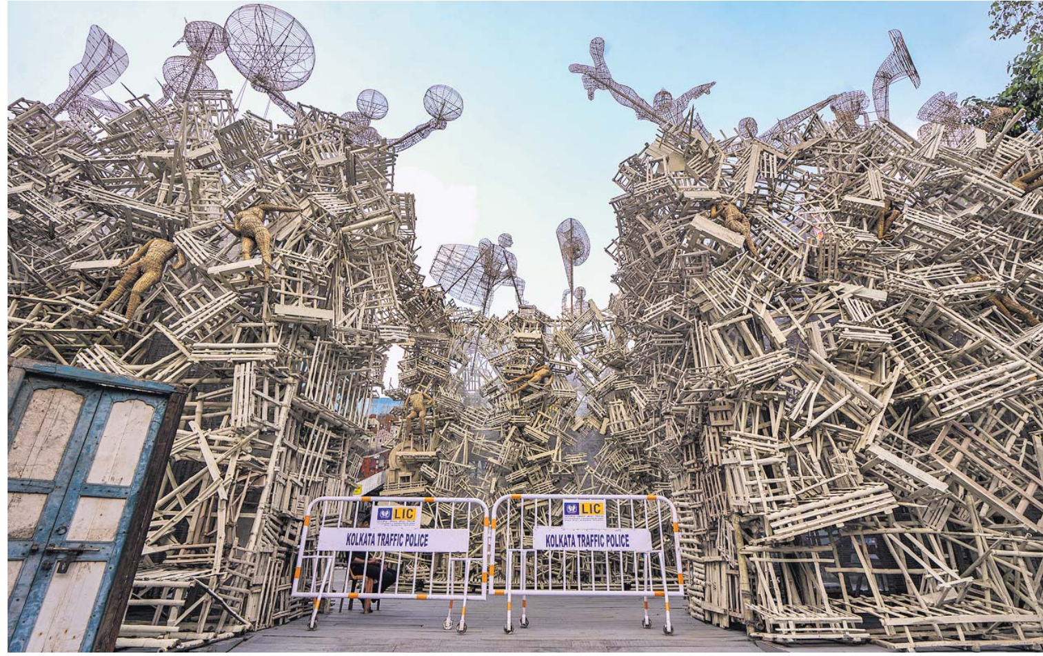
କୋଲକାତାରେ ଏକ ଦୁର୍ଗାପୂଜା କମିଟି ପକ୍ଷରୁ ପ୍ରସ୍ତୁତ କରାଯାଇଥିବା ଏକ ଅଭିନବ ଚୋରଣ।