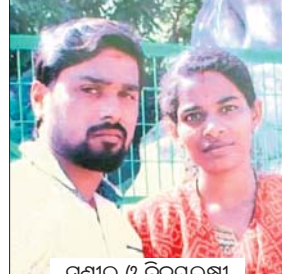
ସୁଶୀଳ ଓ ବିକଳକାନ୍ତ

ଅନ୍ୟ ଜାତିର ଝିଅକୁ ଭଲ ପାଇବିନା। ପରିବାର ଲୋକଙ୍କ ବିରୋଧ ସତ୍ତ୍ୱେ ପ୍ରେମିକାଙ୍କୁ ବାହାହେଲେ। ଫଳରେ ସମ୍ମାନହୀନକରିତ ଗ୍ରାମରେ ଜଗିତ ପରିବାରବର୍ଗ ପୁଅକୁ ଘରୁ ବାହାର କରିଦେଲେ। ହେଲେ ବାହାଘରର ପ୍ରାୟ ୫ ବର୍ଷ ପରେ ମଧ୍ୟ ପୁଅ ପ୍ରତି ସେମାନଙ୍କ ଚାହୁଣା କମି ନ ଥିଲା। ଶେଷରେ ଦେଇଥିବା ଟଙ୍କା ବାପାଙ୍କୁ ଫେରସ୍ତ ମାଗିବାରୁ ପୁଅକୁ ପରିବାର ଲୋକେ ହତ୍ୟା କରିଦେଇଥିବା ଯାକପୁର ଜିଲ୍ଲା ସୁକନ୍ୟା ଥାନାରେ ଅଭିଯୋଗ ହୋଇଛି। ମୃତ ମୁକ୍ତକଙ୍କ ସ୍ତ୍ରୀ ଗତ ୧୯ ତାରିଖରେ ଏଭଳି ଅନରକଳିଂ ଅଭିଯୋଗ ଆଣିଛନ୍ତି। ଘଟଣାକୁ ତାପସ୍ୟାପୂର୍ଣ୍ଣ ଉଦ୍ଧାରଣ ହୋଇଥିବାବେଳେ ଏବେ ଏକ ସମ୍ପର୍କ ଗଣାପଡ଼ିଛି।