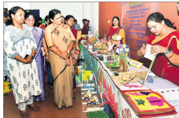
ପୋଷଣ ମାସର ଶୁଭାରମ୍ଭ ଅବସରରେ ଉପମୁଖ୍ୟମନ୍ତ୍ରୀଙ୍କ ସହ ଅନ୍ୟମାନେ ଅଜନିତ୍ୱକର୍ତ୍ତାଙ୍କ ପ୍ରଦର୍ଶନୀକୁ ବୁଲି ଦେଖୁଛନ୍ତି।

ଓଡ଼ିଶାକୁ କୃଷିପୋଷଣମୁକ୍ତ କରିବା ପାଇଁ ତୃଣମୂଳସ୍ତରର କାର୍ଯ୍ୟକର୍ତ୍ତାମାନଙ୍କୁ ଗାଁ ଗାଁରେ ଜନସଚେତନତା ସୃଷ୍ଟି କରିବାକୁ ପଡ଼ିବ। ଏଥିସହ ପୋଷଣ ଅଭିଯାନରେ ସେମାନଙ୍କୁ ଆତ୍ମାୟତ୍ତା ସହ କାର୍ଯ୍ୟ କରିବାକୁ ପଡ଼ିବ ବୋଲି ଉପମୁଖ୍ୟମନ୍ତ୍ରୀ ପ୍ରଭାତୀ ପରିଡ଼ା କହିଛନ୍ତି। ସୋମବାର ମହିଳା ଓ ଶିଶୁ ବିକାଶ ବିଭାଗ ପକ୍ଷରୁ ରାଜ୍ୟ ମହିଳା ଓ ଶିଶୁ ପ୍ରତିଷ୍ଠାନଠାରେ ରାଜ୍ୟସ୍ତରୀୟ ପୋଷଣ ମାସ-୨୦୨୪ ଉତ୍ସବ ଆୟୋଜିତ ହୋଇଯାଇଛି। ମୁଖ୍ୟ ଅତିଥି ଭାବେ ଯୋଗଦେଇ ଉପମୁଖ୍ୟମନ୍ତ୍ରୀ ପରିଡ଼ା ଏହାକୁ ଉଦ୍‌ଘାଟନ କରି କହିଲେ, ତୃଣମୂଳସ୍ତରର କାର୍ଯ୍ୟକର୍ତ୍ତା ହେଉଛନ୍ତି ପୋଷଣ ଅଭିଯାନର ଯୋଜନା। ସେମାନେ ଜିଲାସ୍ତରୀୟ ଅପମୁଖ୍ୟ ସମସ୍ୟାର କାରଣ ଓ ନିରାକରଣ ଉପରେ ବିଶେଷ ଦୃଷ୍ଟି ଦେବା ଆବଶ୍ୟକ। ସେହିପରି ମଧ୍ୟମ ପୁଷ୍ଟିକାରକ ଓଡ଼ିଶାକୁ