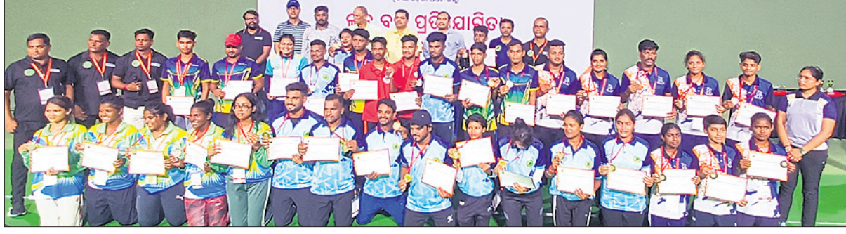
କୃତୀ ପ୍ରତିଯୋଗୀମାନେ ପୁରସ୍କାର ସହ ଅତିଥିଙ୍କ ଗହଣରେ।

ଭୁବନେଶ୍ୱର, ୩୦୯ (ତପନ ସାହୁ) କଳିଙ୍ଗ ଷ୍ଟୁଡିୟମ୍ ଡେଇଁ ସେଠାରେ ଚାଲିଥିବା ଓଡ଼ିଶା ରାଜ୍ୟ ଲନ୍ଦନ୍ ପ୍ରତିଯୋଗିତାରେ ବଲାଙ୍ଗୀର ପ୍ରାଥମ୍ୟ ଜାରି ରହିଛି। ଯୋଗ୍ୟତା ଦ୍ୱିତୀୟ ଦିବସରେ ଶେଷ ହୋଇଥିବା ୫ଟି ଲଭେଷ୍ଟରୁ ୫ଟି ଯାକ ସର୍ବସୁଧୁର ବଲାଙ୍ଗୀର ଜିଲାର ଖେଳାଳିମାନେ ପାଇଁ ନେଇଛନ୍ତି। ଡେକାନାଲ ୨ ରୌପ୍ୟ ଜିତି ଦ୍ୱିତୀୟ ସ୍ଥାନରେ ଏବଂ ସମ୍ବଲପୁର ୩ଟି ବ୍ରୋଞ୍ଜ ପଦକ ଜିତି ତୃତୀୟ ଶ୍ରେଣୀ ଦଳ ହୋଇଛି। ମଙ୍ଗଳବାର ଆଉ ୫ଟି ଲଭେଷ୍ଟର ଫାଇନାଲ୍ ସହ ପ୍ରତିଯୋଗିତା ଉଦ୍‌ଘାଟିତ ହେବା ଦ୍ୱିତୀୟ ଦିବସରେ ଅନୁଷ୍ଠିତ ମହିଳା ସିଙ୍ଗଲରେ ବଲାଙ୍ଗୀରର