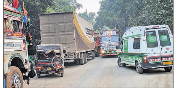
ଜାମ୍ରେ ଫସି ରହିଥିବା ଗାଡ଼ି।

ମୟୂରଭଞ୍ଜ ଜିଲା ବାଲିଗିପୋଷି ରୁକ ଅଧୀନ ୪୯ନଂ ଜାତୀୟ ରାଜପଥର ଦ୍ୱାରଶୁଣୀ ଘାଟି ରାସ୍ତା ଜାମ୍ ରହିଥିବା ଯୋଗୁ ଗାଡ଼ି ଚାଳକ ଓ ଯାତ୍ରୀମାନେ ନାହିଁ ନ ଥିବା ଅନୁଭବର ସମ୍ମୁଖୀନ ହେଉଛନ୍ତି। ଗୋଟିଏ ଗାଡ଼ି ପାର ହେବା ପାଇଁ ୪ ଘଣ୍ଟା ଅଧିକ ସମୟ ଲାଗୁଛି। ୪ ଦିନ ହେଲା ଏପରି ଜଟିଳ ସ୍ଥିତି ଲାଗିରହିଛି। ଏପରିକି ଆତ୍ମଲୀଳା ମଧ୍ୟ ଦୀର୍ଘ ସମୟ ଧରି ଜାମ୍ରେ ଫସି ରହିଥିବା ଦେଖିବାକୁ ମିଳିଛି।