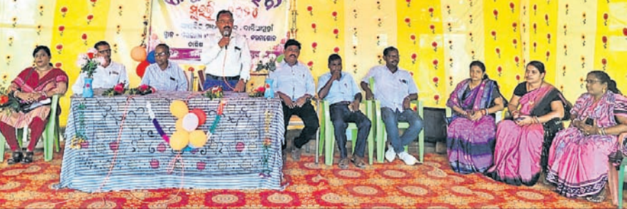
କରମଣୋଳ ପ୍ରାଥମିକ ବିଦ୍ୟାଳୟରେ ଆୟୋଜିତ ସୁରଭି କାର୍ଯ୍ୟକ୍ରମରେ ମଞ୍ଚାଧୀନ ଅତିଥିମାନେ।

ମଧ୍ୟରେ ପସି ଯାଉଛନ୍ତି। ଗାଡ଼ି ଚଳାଚଳ ସ୍ୱାଭାବିକ କରିବା ପାଇଁ ବିଭାଗୀୟ କର୍ମଚାରୀ ଅନୁପସ୍ଥିତ ରହୁଥିବାରୁ ଅନେକ ସମୟରେ ଘାଟଣା ଘଟଣା ଧରି ଘାଟି ରାସ୍ତାରେ ଚଳପ୍ରଚଳ ସମସ୍ତ ହୋଇପାରୁ ନାହିଁ।