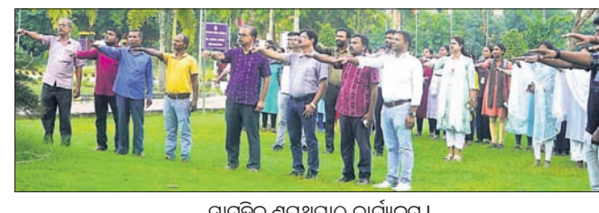
ସାମୂହିକ ଶପଥପାଠ କାର୍ଯ୍ୟକ୍ରମ।

ବାଲେଶ୍ୱର, ୧୧୧୦(ବାଞ୍ଛାନିଧି ଦେ) ବାଲେଶ୍ୱର ନ୍ୟୁଆପାଟ୍ଟାଲିଟି ଫାଉଣ୍ଡେସନ୍ ଦିବସବିଦ୍ୟାଳୟରେ ‘ଅନ୍ତର୍ଜାତୀୟ ବୟସ୍କ ବ୍ୟକ୍ତିଙ୍କ ଦିବସ-୨୦୨୪’ ମଙ୍ଗଳବାର ପାଳିତ ହୋଇଯାଇଛି।