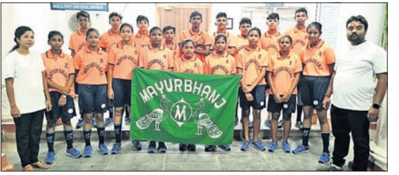
ରାଜ୍ୟସ୍ତରୀୟ ପ୍ରତିଯୋଗିତାରେ ସାମିଲ କ୍ରୀଡ଼ାବିତ୍ରମାନେ।

ବୀରପଦା, ୧୧.୧୦ (ନାଳନ୍ଦ୍ର ବିହାରୀ ବନ୍ଧୁପାଟ) ରାଜ୍ୟସ୍ତରୀୟ ୧୪ ଓ ୧୭ ବର୍ଷରୁ କମ୍ ବାଳକ ଓ ବାଳିକା ବର୍ଗର ବ୍ୟାଡ୍ମିଣ୍ଟନ ପ୍ରତିଯୋଗିତା ଚଳିତ ଅକ୍ଟୋବର ୨୭ ଓ ୩୦ ତାରିଖ ପର୍ଯ୍ୟନ୍ତ ଯାଜପୁର ଜିଲ୍ଲା ହାଇସ୍କୁଲରେ ଅନୁଷ୍ଠିତ ହେବ।