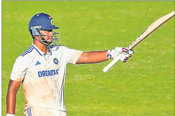
ଶତକ ହାସଲ ପରେ ବୈଜକ ସୂର୍ଯ୍ୟବଂଶୀ ।

ଶତକ ହାସଲ କରିବାରେ ପ୍ରଥମ ଭାରତୀୟ ଓଭର ଅଲ୍‌ ଦ୍ୱିତୀୟ ଖେଳାଳି ହେବାର ଗୌରବ ଅର୍ଜନ କରିଛନ୍ତି । ୨୦୦୫ରେ ଇଂଲଣ୍ଡର ମୋଇନ ଅଲି ମାତ୍ର ୫୬ ବଲ୍‌ରେ ଏକ ଶତକ ହାସଲ କରି ଏହି ରେକର୍ଡର ଅଧିକାରୀ ହୋଇଛନ୍ତି । ସୂରନାୟୋଗ୍ୟ, ସୂର୍ଯ୍ୟବଂଶୀ