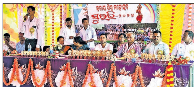
ସୁରଭି ମହୋତ୍ସବରେ ଉପସ୍ଥିତ ଅଭିଭାବକ