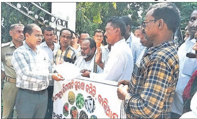
ତହସିଲଦାରଙ୍କ ଦ୍ୱାରା ପ୍ରସ୍ତାବିତ ପ୍ରକଳ୍ପର ବାବଦରେ ଜନଶୁଣାଣି ହେଉଛି।

ବାଲେଶ୍ୱର ଜିଲ୍ଲା ବାଲିଆପାଳ ତହସିଲ ଅଧୀନ ପ୍ରସ୍ତାବିତ ପ୍ରକଳ୍ପରେ ବନ୍ଦର କାର୍ଯ୍ୟ ଆରମ୍ଭ ପାଇଁ ପ୍ରକଳ୍ପର ବୋର୍ଡ ପକ୍ଷରୁ ଆସନ୍ତା ୭ତାରିଖ ଦେଖାଇ ପଞ୍ଚାୟତର ବସ୍ତୁବେଦପୁର ପଢ଼ିଆରେ ଜନଶୁଣାଣିର ଦିନ ଓ ସ୍ଥାନ ନିରୂପଣ କରି ବିଜ୍ଞପ୍ତି ପ୍ରକାଶ ପାଇଛି।