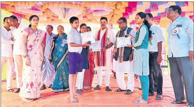
ଏମ୍ପି ଓ ବିଧାୟକ ପିଲାମାନଙ୍କୁ ପୁରସ୍କୃତ କରୁଛନ୍ତି।

ଖଜରା, ୧୧୧୦(ଉତ୍କଳବନ୍ଧୁ ପଣ୍ଡା) ବାଲେଶ୍ୱର ଜିଲ୍ଲା ଖଜରା ବ୍ଲକ୍ ବର୍ତ୍ତମାନ କୁଣ୍ଡର ରତିଶା ପ୍ରାଥମିକ ପ୍ରାଥମିକ ସରକାରୀ ହାଇସ୍କୁଲରେ ଯୋଜନାରେ କୁଣ୍ଡରସ୍ତରୀୟ ସୁରଭି କାର୍ଯ୍ୟକ୍ରମ ଅନୁଷ୍ଠିତ ହୋଇଯାଇଛି।