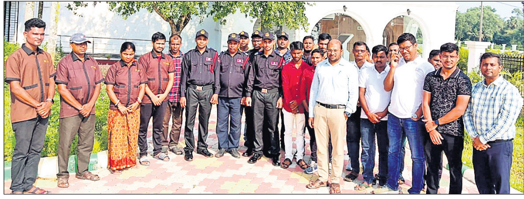
ମନୁଥ-ମନୋଜ ସ୍ମାରକୀ ଖୋଲାଯିବା ଅବସରରେ ଉପସ୍ଥିତ ଅତିଥି ଓ ଅନ୍ୟମାନେ।

ବାଲେଶ୍ୱର, ୧୧୧୦(ବାଞ୍ଛାନିଧି ଦେ) ବାଲେଶ୍ୱର ଜିଲ୍ଲାର ଭୋଗରାଇ ବ୍ଲକ୍ ଅଧୀନ ଶଙ୍କରାଗିରି ମନୁଥ-ମନୋଜ ସ୍ମାରକୀକୁ ମଙ୍ଗଳବାରଠାରୁ ଜନସାଧାରଣଙ୍କ ନିମନ୍ତେ ଆରମ୍ଭ କରିବାକୁ ଉଦ୍ଦେଶ୍ୟରେ ମନୁଥ-ମନୋଜ ସ୍ମାରକୀ ପରିସର ପ୍ରତିଦିନ ସକାଳ ୬ଟାରୁ ସନ୍ଧ୍ୟା ୬ଟା ପର୍ଯ୍ୟନ୍ତ ସର୍ବସାଧାରଣଙ୍କ ପାଇଁ ଉପଲବ୍ଧ ହେବ।