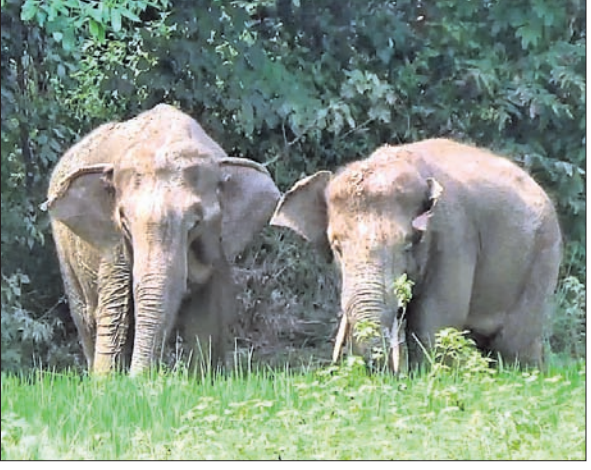
ମୟୂରଭଞ୍ଜ ଜିଲ୍ଲା ଉଦକା ବନାଞ୍ଚଳ ଅଧୀନ କାଠୁଆବେଡ଼ା ଗାଁରେ ଉତ୍ପାତ କରୁଥିବା ୨ ହାତୀ।