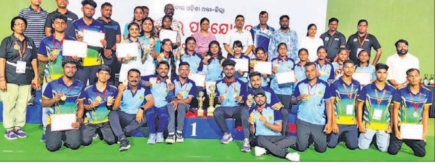
ଚାମ୍ପିୟନ ଓ ରନରାଜ୍‌ସ୍ୱରୂପ ବଲାଙ୍ଗୀରର ଦୁଇ ଦଳ ଖେଳାଳି ଅଭିଯୁକ୍ତ ଗହଣରେ ।