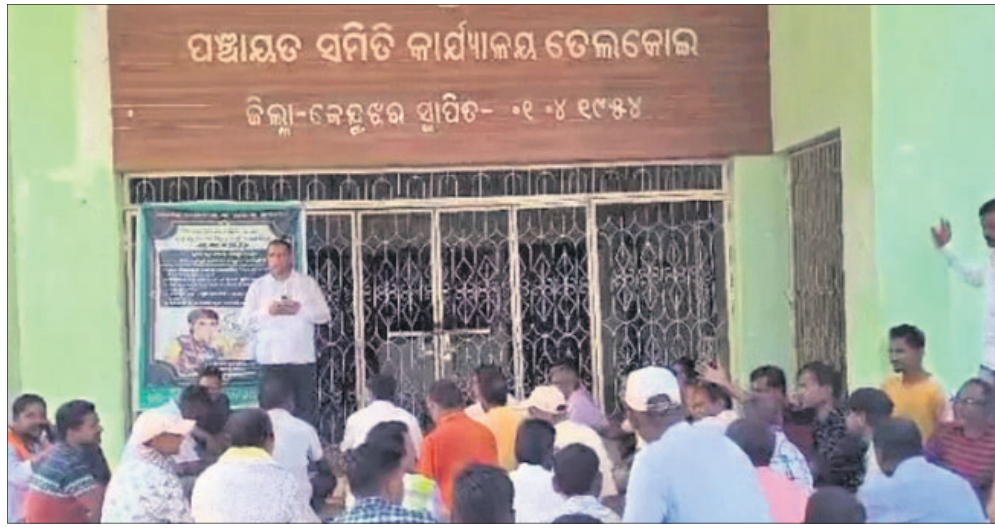
ଭାଜପା କର୍ମୀମାନେ ରୁକ୍ କାର୍ଯ୍ୟାଳୟ ଫାଟକରେ ତାଲି ପକାଇ ଧାରଣାରେ ବସିଛନ୍ତି।