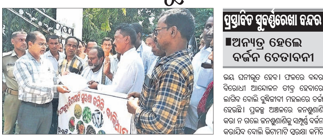
ଡ଼ାକ୍ତରୀ କଲିକାରେ ବାଲିଆପାଳ ପ୍ରଦାନ କରାଯାଇଛି।

ବାଲେଶ୍ୱର ଜିଲ୍ଲା ବାଲିଆପାଳ ଡ଼ାକ୍ତରୀ ଅଧୀନ ପ୍ରସ୍ତାବିତ ସୁରକ୍ଷାରେ ବନ୍ଦର କାର୍ଯ୍ୟ ଆରମ୍ଭ ପାଇଁ ପ୍ରକଳ୍ପର ପ୍ରସ୍ତୁତି ଆସନ୍ତା ୨୦ ତାରିଖ ବେଞ୍ଚେଲ ଜନଶୁଣାଣିର ଦିନ ଓ ପ୍ରାୟ ନିରୂପଣ କରି ବିଶ୍ୱସ୍ତି ପ୍ରକଳ୍ପ ପାଇଛି।