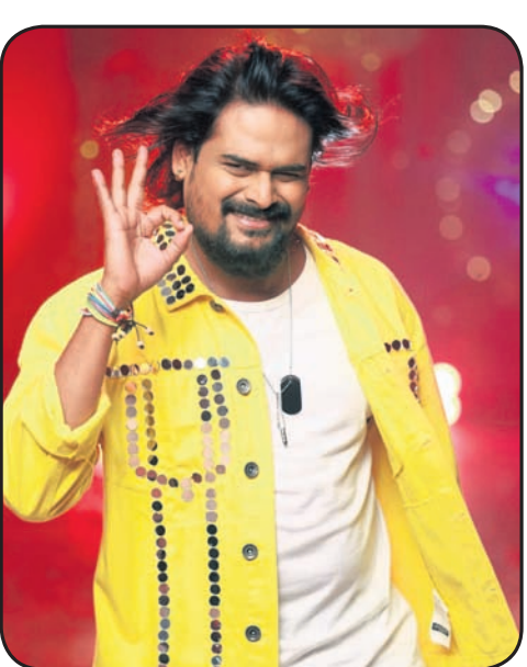
‘ଭିଲେନ୍’ ଫିଲ୍ମରେ ଅର୍ଦ୍ଧେନ୍ଦୁ