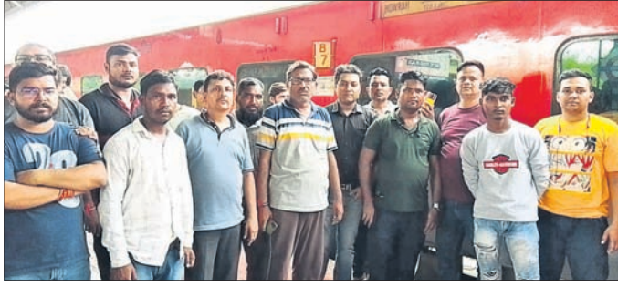
ରେଳଷ୍ଟେଶନରେ ଯାତ୍ରୀମାନେ ହୋହଲ୍ଲା କରୁଛନ୍ତି।