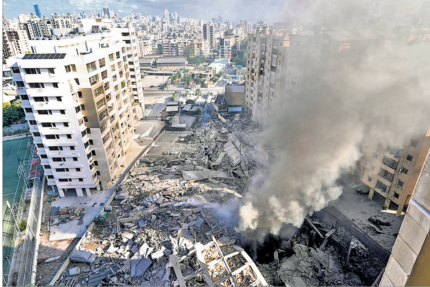
ଇସ୍ରାଏଲୀ ଏୟାରଫୋର୍ସରେ ବିଧିଗ୍ରହଣ ବେଳେ ଘଟଣାସ୍ଥଳରେ ଧୂଆଁ ବାହାରିବାକୁ ଦେଖିବାକୁ ମିଳୁଥିବା ଦୃଶ୍ୟ।

ପୁରୀ, ୨୧୦ ମହାରାଷ୍ଟ୍ରର ପୁରୀ ଜିଲ୍ଲା ବାଲୁଧନପୁର ପାହାଡ଼ିଆ ଅଞ୍ଚଳରେ ରୁଧିରୀ ଏକ ହେଲିକପ୍ଟର ଗ୍ରାଣ ହେବାକୁ ଏଥିରେ ଥିବା ୨ ପାଇଲଟ ଓ ଜଣେ ଇଞ୍ଜିନିୟରଙ୍କ ମୃତ୍ୟୁ ଘଟିଛି।