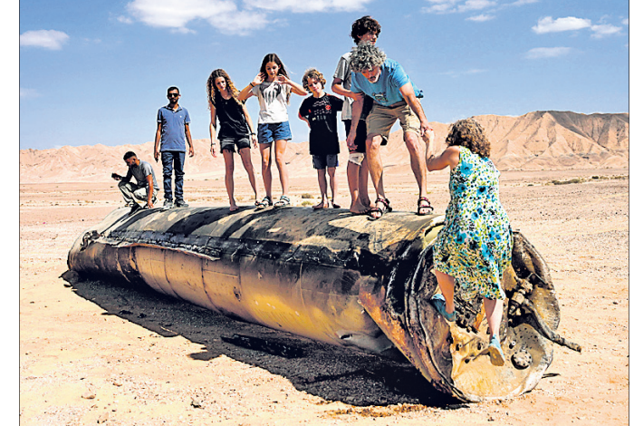
ଆଇରନ୍ ଡୋମ୍ ବ୍ଲବ୍ ଲାନ୍ଚର ଉପରେ ଉପସ୍ଥାପନ କରାଯାଇଥିବା ଇସ୍ରାଏଲର ଏକ ସ୍ଥାନରେ ଖସିପଡ଼ିଥିବା ଇରାନୀୟ ମିଶାଲ ଉପରେ ଚଢ଼ି ପିଲାମାନେ ଖେଳୁଛନ୍ତି।

ଦିଲ୍ଲୀ ଉପରେ ଗୁରୁତ୍ୱରୋପ କରିଛନ୍ତି। ଇତିମଧ୍ୟରେ ମଙ୍ଗଳବାର ରାତିରେ ଇସ୍ରାଏଲ ଉପରେ ଇରାନର ମିଶାଲ ଆକ୍ରମଣ ମଧ୍ୟପ୍ରାନ୍ତ ସ୍ଥିତିକୁ ଆହୁରି ସଜ୍ଜିନ କରିଦେଇଛି।