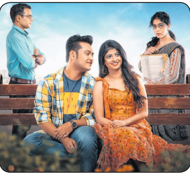
‘ଖୋକା ଭାଇ ତୁମ ପାଇଁ’ ଫିଲ୍ମର ଏକ ଦୃଶ୍ୟ