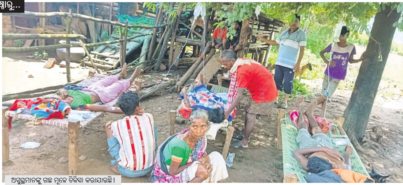
ଅସୁସ୍ଥମାନଙ୍କୁ ଗହ ମୁକେ ଚିକିତ୍ସା କରାଯାଉଛି।

ଏହି ଯୋଗଣା ପରେ ଜାତିସଂଘ ଓ ଇସ୍ରାଏଲ ମଧ୍ୟରେ ବଢ଼ିଗଲିଥିବା ଫାଟ ଆହୁରି ଗଭୀର ହେବା ସହ ଚିତ୍କୋଟା ବୁଦ୍ଧି ପାଇବ ବୋଲି କୁହାଯାଉଛି। ପ୍ରକାଶ ଯେ, ମଙ୍ଗଳବାର ରାତିରେ ଇସ୍ରାଏଲ ଉପରେ ଇରାନ ୧୮୦ରୁ ଉର୍ଦ୍ଧ୍ୱ ବାଲିଷ୍ଟିକ ମିଶାଇଲ ମାଡ଼ କରିଥିଲା। ସେଥିରୁ ଅଧିକାଂଶ କ୍ଷେପଣାସ୍ତ୍ରକୁ ଇସ୍ରାଏଲର ଆକରଣ ତୋମ୍ ନିଷ୍ପତ୍ତ କରିଦେଇଥିଲା। ଏନେଇ ଗୁଡ଼େରେ ସ୍ୱଳ୍ପ ଶକ୍ତିରେ ଉଲ୍ଲେଖ କରିଥିଲେ, ମଧ୍ୟପ୍ରାନ୍ତରେ ସଂଘର୍ଷ ବଢ଼ିବାରେ ଲାରିଥିବାବେଳେ ଉତ୍ତରଜନା ପରେ ଉତ୍ତରଜନା ପ୍ରକାଶ ପାଇବାରେ ଲାଗିଛି। ଏହା ବନ୍ଦ ହେବା ଜରୁରୀ। ଆମକୁ ସମ୍ପୂର୍ଣ୍ଣ ଅସୁବିଧିତ ଆବଶ୍ୟକ। ଅନ୍ୟପକ୍ଷେ ଦକ୍ଷିଣ ଲେବାନନକୁ ଛାଡ଼ିଦେବାରେ ଇସ୍ରାଏଲ ସାମିତ ଆକ୍ରମଣ କରିବା ପରେ ଜାତିସଂଘ ମହାସଚିବ କହିଥିଲେ, ଲେବାନନରେ ସଂଘର୍ଷକୁ ନେଇ ସେ ଅତ୍ୟନ୍ତ ଚିନ୍ତିତ। ଲେବାନନର ସାର୍ବଭୌମତ୍ୱ ଓ ଅଖଣ୍ଡତାକୁ ସମ୍ମାନ ଦିଆଯିବା ଜରୁରୀ। ଲେବାନନରେ ଯେକୌଣସି ପ୍ରକାରର ମୁକ୍ତକୁ ଏଡ଼ାଇଦେବା ଆବଶ୍ୟକ।