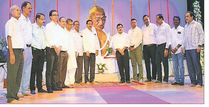
ଉପସରରେ ଅତରୁ ଭୈମିକ ଓ ଅନ୍ୟ ବିଶିଷ୍ଟ ଅଧିକାରୀ ସମ୍ମିଳିତ ଅଛନ୍ତି।