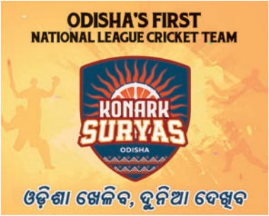
ଓଡ଼ିଶା ଖେଳିବ, ଦୁନିଆ ଦେଖୁବ