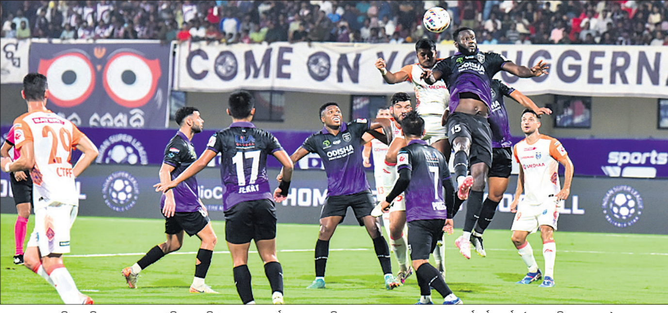
କଳିଙ୍ଗ ଖେଳାଳିମାନେ ଗୁଜରାଟ ଓଡ଼ିଶା ଏଫସି ଓ କେରଳ ଖେଳାଳିମାନଙ୍କ ସହ ଖେଳିବା ପାଇଁ ପ୍ରସ୍ତୁତ ହେବେ।