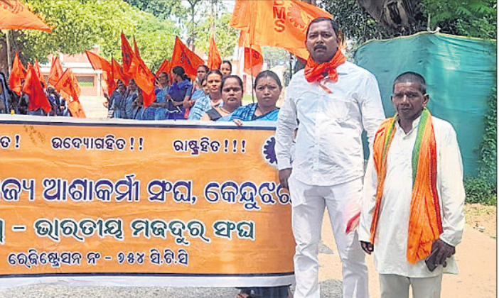
ଆଶାକର୍ମୀ ସଂଘର ସଦସ୍ୟମାନେ ଶୋଭାଯାତ୍ରାରେ ଯାଉଛନ୍ତି।

ଭାରତୀୟ ମଜଦୁର ସଂଘ ସହଯୋଗୀ ଓଡ଼ିଶା ରାଜ୍ୟ ଆଶାକର୍ମୀ ସଂଘ ତରଫରୁ କର୍ମଚାରୀଙ୍କ ସମସ୍ୟାକୁ ନେଇ ଏକ ଦାବିପତ୍ର ଜିଲ୍ଲା ପ୍ରଶାସନ ଜରିଆରେ ପ୍ରଧାନମନ୍ତ୍ରୀଙ୍କୁ ପ୍ରଦାନ କରାଯାଇଛି। ପୂର୍ବରୁ ବହୁବାର ଦାବିପତ୍ର ଦିଆଯାଇଥିଲେ ହେଁ କେବଳ ପ୍ରତିଶ୍ରୁତି ମିଳିଛି। କିନ୍ତୁ ଆଜି ପର୍ଯ୍ୟନ୍ତ ଦାବି ପୂରଣ ଦିଗରେ ସରକାର କୌଣସି ପଦକ୍ଷେପ ଗ୍ରହଣ କରିନାହାନ୍ତି ବୋଲି ଆନ୍ଦୋଳନକାରୀ ଅସନ୍ତୋଷ ବ୍ୟକ୍ତ କରିଛନ୍ତି। ଓଡ଼ିଶା ଆଶାକର୍ମୀ