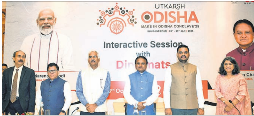
ଭୁବନେଶ୍ୱର, ୩।୧୦(ଅନିଲ ଦାସ)