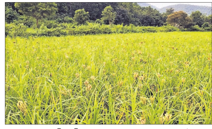
ଆଗ୍ରହ ପ୍ରକାଶ କରୁଛନ୍ତି। ମାଣିଆ ଚାଷରୁ ମଧ୍ୟ ବେଶ୍ ଦି'ପଇସା ମୁନଫା କରୁଥିବା ଅମଳ ପାଇଁ ପାଲ, ଶୁଖାଇବା ପାଇଁ ଷ୍ଟ୍ରେ-ନେଟିନ ଆଦି ଯୋଗାଇ ଦିଆଯାଉଛି। ଫଳରେ ଚାଷୀ ମାଣିଆ ଚାଷ ୨ପ୍ରକାର ପ୍ରଶାଳାରେ ହୋଇଥାଏ। ଏସ୍‌ଏମଆଇ (ସାଧାରଣ ରୁଆ) ପ୍ରଶାଳାର ଚାଷୀଙ୍କୁ ଏକର ପ୍ରତି ୬ କୁଇଣ୍ଟାଲ ବିହନ ଯୋଗାଇ ଦିଆଯାଉଛି। ଏକଟି(ଧାଡ଼ି ରୁଆ) ପ୍ରଶାଳାରେ ଚାଷ କରୁଥିବା ଚାଷୀଙ୍କୁ

ଫସଲ ଭାବେ ଧୀରେ ଧୀରେ ଚାଷୀଙ୍କ ମଧ୍ୟରେ ଆଦୃତ ହେବାରେ ଲାଗିଛି। ସୂଚନା ଅନୁଯାୟୀ, ଗତ ୨ ବର୍ଷ ଅପେକ୍ଷା ଚଳିତବର୍ଷ ବ୍ଲକ୍ରେ ଚାଷ ବୃଦ୍ଧି ପାଇଛି। ଚଳିତ ବର୍ଷ ୧୮ ପଞ୍ଚାୟତ ପାଇଁ ୧୧ଶହ ୧୦ହେକ୍ଟର ଜମିରେ ମାଣିଆ ଚାଷ ପାଇଁ ନିର୍ଦ୍ଦେଶ ଦେଇଥିବା ପ୍ରସ୍ତାବ ଆସିଥିଲା। ଏବେ ବୁଢ଼ା ପାଖାପାଖି ୧୪୦୦ରୁ ଊର୍ଦ୍ଧ୍ୱ ଚାଷୀ ପାଖାପାଖି ୬୬୮ହେକ୍ଟର ଜମିରେ ମାଣିଆ ଚାଷ କରିଥିବା ଶ୍ରୀଅଳ ଦେବଜନା (ମିଲେଟ୍ ମିଶନ) ବିଭାଗ ପକ୍ଷରୁ ସୂଚନା ମିଳିଛି। ବିଭାଗ ପକ୍ଷରୁ ଠିକ୍ ସମୟରେ ଚାଷୀଙ୍କୁ ବିଭିନ୍ନ ପ୍ରୋତ୍ସାହନ ମାଧ୍ୟମରେ ମଞ୍ଜି, ଘାସବାଛିବା ପାଇଁ ଯତ୍ନ, ଅମଳ ପାଇଁ ପାଲ, ଶୁଖାଇବା ପାଇଁ ଷ୍ଟ୍ରେ-ନେଟିନ ଆଦି ଯୋଗାଇ ଦିଆଯାଉଛି। ଫଳରେ ଚାଷୀ ମାଣିଆ ଚାଷ ପ୍ରତି