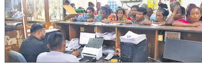
ବଉଳା, ୪।୧୦(ଦୁର୍ଗା ପ୍ରସାଦ ଆୟର)

କେନ୍ଦୁଝର ଜିଲା ହାଟେଡ଼ିଆ ବ୍ଲକ୍ରେ ବଉଳାସ୍ଥିତ ବ୍ୟାଙ୍କ ଅଫ୍ ଇଣ୍ଡିଆରେ ଶତାଧିକ ଲୋକ ଠିଆ ହେଉଥିବା ବେଳେ ଅବ୍ୟବସ୍ଥା ଯୋଗୁ ଗ୍ରାହକମାନେ ଅସୁବିଧାର ସମ୍ମୁଖୀନ ହେଉଛନ୍ତି।