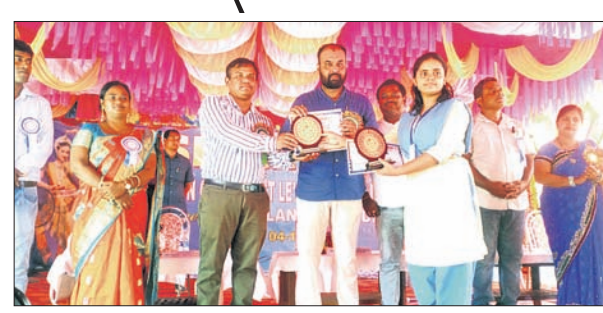
ପ୍ରତିଷ୍ଠା ଦିବସରେ ପୁଞ୍ଜୀବ ଅତିଥି କୃତା ପ୍ରତିଯୋଗୀଙ୍କୁ ପୁରସ୍କୃତ କରୁଛନ୍ତି।

ସ୍ଵଚ୍ଛତା ପକ୍ଷ କାର୍ଯ୍ୟକ୍ରମ ଉଦ୍ଘାଟିତ ବାସୁଦେବପୁର, ୪।୧୦ (ନାରାୟଣ ପ୍ରସାଦ ବାରିକ)