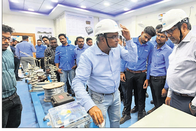
ଉଦଘାଟନା କାର୍ଯ୍ୟକ୍ରମରେ ଉପସ୍ଥିତ ଅତିଥିମାନେ।

କେନ୍ଦୁଝର ଜିଲା ଯୋଡ଼ା ସହରସ୍ଥିତ ବିଦ୍ୟୁତ୍ ଉପକଣ୍ଠର ହାରାକୁଦ କଲୋନୀଠାରେ ଚିପିଏନ୍‌ଓଡିଏଲ୍(ଗୋଟା ପାଖର ନର୍ଦଦ ଓଡ଼ିଶା ଡିଷ୍ଟ୍ରିକ୍ଟ୍‌ସ୍‌ଟେସନ୍ ଲିମିଟେଡ୍) ପକ୍ଷରୁ ଅତ୍ୟାଧୁନିକ କୌଶଳ ବିକାଶ କେନ୍ଦ୍ର ଉଦଘାଟିତ ହୋଇଯାଇଛି।