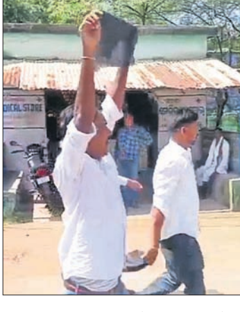
ଗୋଲାପୁଣ୍ଡା, ୪।୧୦