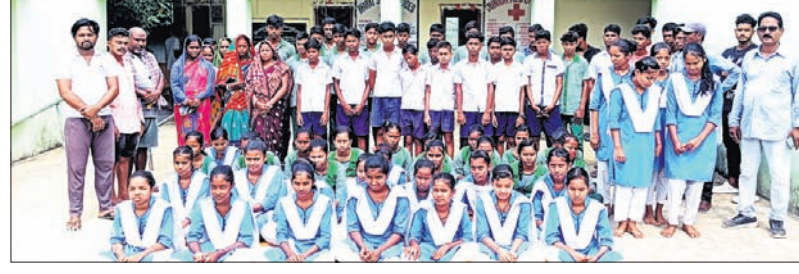
ହୋଇଥିଲା। ଏବେ ବିଦ୍ୟାଳୟରେ ୨ ଜଣ ଶିକ୍ଷକ ଥିଲେ ମଧ୍ୟ ନ ଥିବା ସମ୍ବନ୍ଧରେ ଅଭିଭାବକମାନେ ଅନୁପସ୍ଥିତ ରହୁଥିବା ଗ୍ରାମବାସୀ ପ୍ରକାଶ କରିଛନ୍ତି।

ବାଲେଶ୍ୱର ଜିଲା ରେମୁଣା ବ୍ଲକ୍ ଖଡ଼ାପଡ଼ା ଥାନା ଅଧୀନ ତାଳପଦା ଗ୍ରାମରେ ଥିବା ଉଚ୍ଚ ବିଦ୍ୟାଳୟର ପାଠପଢ଼ାକୁ ନେଇ ଛାତ୍ରୀଛାତ୍ରଙ୍କ ମଧ୍ୟରେ ଅସନ୍ତୋଷ ଦେଖାଦେଇଛି।