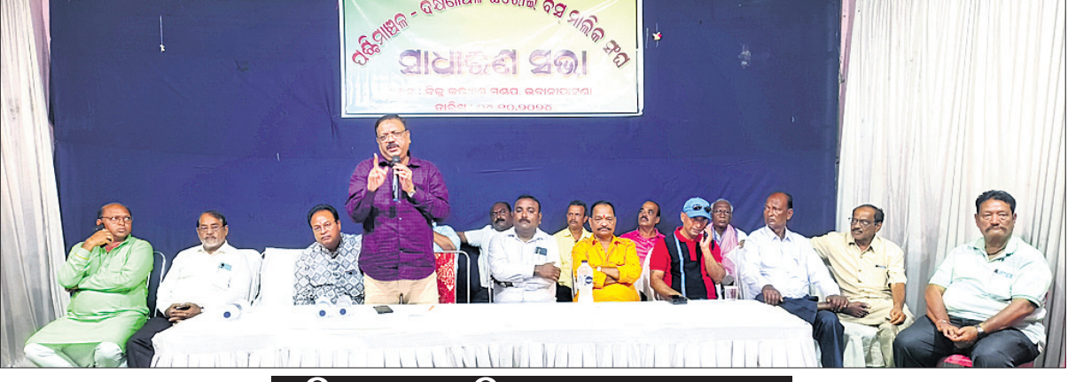
ଭବାନୀପାଟଣା, ୪।୧୦ (ଉତ୍ତମ କୁମାର ଦାଶ)