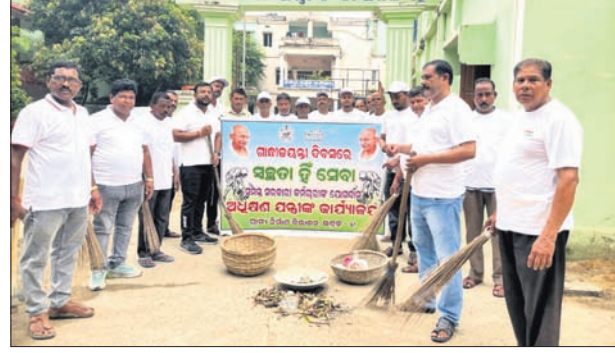
କର୍ମଚାରୀମାନେ ସଫେଇ କରୁଛନ୍ତି। ଭଦ୍ରକ, ୪।୧୦ (ରବିବାରାୟଣ ଖୁଲାଇ)