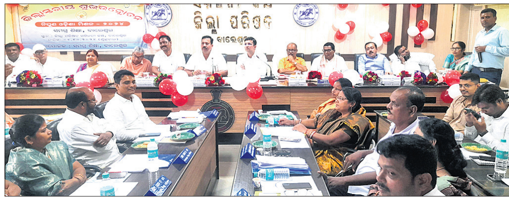
ଜିଲା ପରିଷଦ ବୈଠକରେ ଉପସ୍ଥିତ ବିଧାୟକ ଓ ଜନପ୍ରତିନିଧି।

ବୈଠକ ପରିଚାଳନା କରିଥିଲେ। ଜିଲା ଶିକ୍ଷାବିଭାଗ ପକ୍ଷରୁ ଯୋଜନା ଭିତ୍ତିକ କନିଷ୍ଠ ଶିକ୍ଷକ ପୁରଣ ନିମନ୍ତେ ମୋଟ ୬ ଶହ ଜଣ ଯୋଗ୍ୟ ପ୍ରାର୍ଥୀଙ୍କର ଦରଖାସ୍ତ୍ର ଯାଞ୍ଚ କରାଯାଇ ଚୂଡ଼ାଚ ଚାଳନାର ଅନୁମୋଦନ ଓ ନିମ୍ନଲିଖିତ ପ୍ରଦାନ ସମ୍ବନ୍ଧରେ ଆଲୋଚନା ହୋଇଥିଲା।