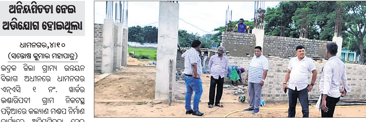
ବିଭାଗୀୟ ଅଧିକାରୀମାନେ ନିର୍ମାଣାଧୀନ କଲ୍ୟାଣ ମଣ୍ଡପର କାର୍ଯ୍ୟ ପରିଦର୍ଶନ କରୁଛନ୍ତି।

ବାସୁଦେବପୁର, ୪।୧୦ (ଗୋରାୟଣ ପ୍ରସାଦ ବାରିକ) ପୂର୍ବତନ ମୁଖ୍ୟମନ୍ତ୍ରୀ ସ୍ୱାଧୀନତା ସଂଗ୍ରାମୀ ସ୍ମରଣ ନୀଳମଣି ରାଉତରାୟଙ୍କ ଶ୍ରୀକ୍ଷୋଧର ବାସୁଦେବପୁରରେ ପାଳନ କରାଯାଇଛି। ଏହି ଅବସରରେ ଶୁକ୍ରବାର ସକାଳେ ଧାନ ପହାସ ପୋଖରୀରେ ଡିକଟର୍‌ସ କରାଯାଇଥିଲା।