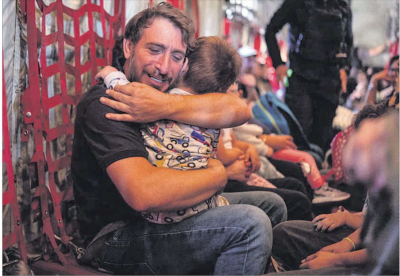
ଇସ୍ରାଏଲ ଆକ୍ରମଣ ଜାରି ରଖିଥିବାବେଳେ ଲେବାନନ୍‌ରୁ ବିଦେଶୀ ଶ୍ରମିକଙ୍କୁ ସେମାନଙ୍କ ଦେଶକୁ ପଠାଇ ଦିଆଯାଇଛି। ଦେଶରୁ ଥିବା ଗ୍ରାମ୍ୟ ଜଣେ ବ୍ୟକ୍ତି ଭୟରେ ନିଜ ପୁଅଙ୍କୁ କାନ୍ଦୁ ଧରିଛନ୍ତି।

ମହାରାଷ୍ଟ୍ରର ପୁଣେରେ ଜଣେ ୨୧ ବର୍ଷୀୟା ଯୁବତୀଙ୍କୁ ଗଣିତର ବିଶେଷତା ଗଣିତ ଗଣିତ କରାଯାଇଛି। ଯୁବତୀ ଜଣକ ଗଣିତର ବିଶେଷତା ସହ ବୋଧଦେୟ ଯାତ୍ରା ଅଞ୍ଚଳକୁ ଯାତ୍ରାପୁରାଣେକ ଅଭିଯୋଗୀଙ୍କୁ ସେମାନଙ୍କୁ ଜରୁରୀ କାର୍ଯ୍ୟରେ ନେଇଯାଇଥିଲେ। ପରେ ସେମାନେ ଯୁବତୀଙ୍କୁ ଗଣିତ ଗଣିତ କରିବା ସହ ତାଙ୍କୁ ବହୁଳ ମାତ୍ରା ମାରିଥିଲେ। ପୋଲିସ୍ କୋଷ୍ଠା ଅଞ୍ଚଳକୁ ଜଣେ ସମ୍ପତ୍ତି ଗିରଫ କରିଛି। ଅଭିଯୋଗୀଙ୍କୁ ଗଣିତର ଆଦି ନିଜକୁ ଜଣେ ଆକୃଷ୍ଟ ବୋଲି ପରିଚୟ ଦେଇଥିଲେ। ଉକ୍ତ ଅଞ୍ଚଳରେ ଯୋଡ଼ିବା ପାଇଁ ଅନୁମତି ନାହିଁ ବୋଲି କହିଥିଲେ। ଏହା ପରେ ଅଭିଯୋଗୀଙ୍କୁ ଧମକ ଦେଇ ଜରୁରୀ କାର୍ଯ୍ୟରେ ଉଠାଇଦେଇଥିଲେ।