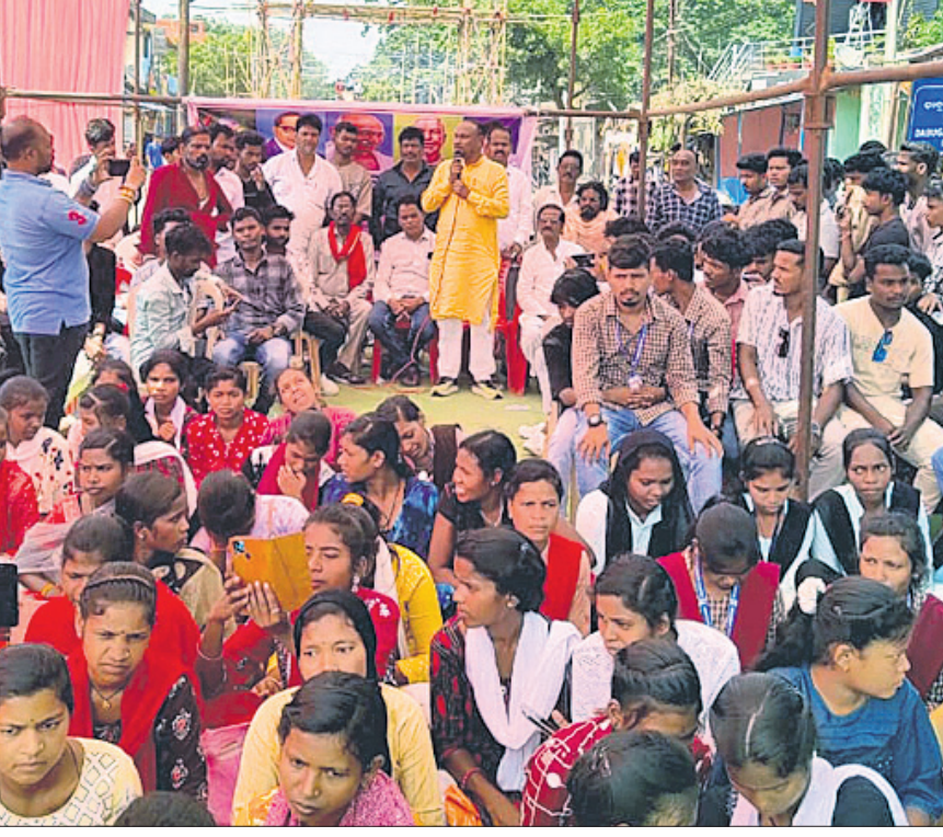
ଡାକୁଗାଁରେ ଲୋକପ୍ରତିନିଧି, ଅଞ୍ଚଳବାସୀଙ୍କୁ ବିଧାୟକ ମନୋହର ରଞ୍ଜନା ଉଦ୍‌ବୋଧନ ଦେଉଛନ୍ତି ।