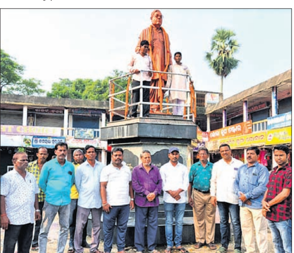
ପୂର୍ବତନ ମୁଖ୍ୟମନ୍ତ୍ରୀ ନୀଳମଣି ରାଉତରାୟଙ୍କ ପ୍ରତିମୂର୍ତ୍ତିରେ ମାଲ୍ୟାପର୍ଯ୍ୟଟନ କରାଯାଇଛି।