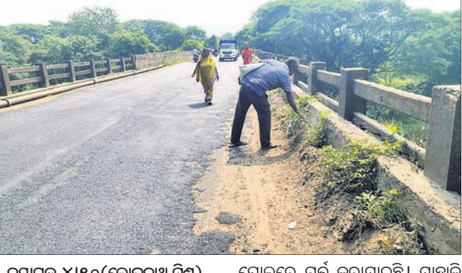
ନୟାଗଡ଼, ୪।୧୦ (ଲୋକନାଥ ମିଶ୍ର)

ପୋଲରେ ଗର୍ଭି କରାଯାଇଛି । ଯାହାକି ମାଟିରେ ପୋତି ହୋଇ ରହିଥିଲେ ମଧ୍ୟ ସଫେଇ କରାଯାଇନାହିଁ । ଏଣୁ ପୋଲରେ ପାଣି ଜମି ପୂଣି ପିଚୁକୁ ନଷ୍ଟ କରିବାର ସମ୍ଭାବନା ରହିଛି । ସେହିଭଳି ପୋଲର ଉଭୟପାର୍ଶ୍ୱ ସଂଯୋଗ ରାସ୍ତା ଖାଲଖାମ ହୋଇ ରହିଥିଲେ ମଧ୍ୟ ଏହାକୁ ମରାମତି କରାଯାଇ ନ ଥିବାରୁ ଅସନ୍ତୋଷ କରାଯାଇଛି । ପୂଣି ପାଣି ତଳକୁ ଖସିପାରିବ ।