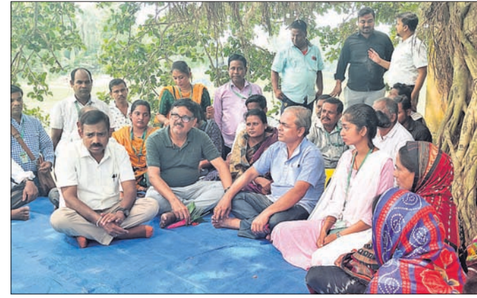
ଜିଲ୍ଲାପାଳ ପିଣ୍ଡିରେ ବସି ଲୋକଙ୍କ ସହ ଆଲୋଚନା କରୁଛନ୍ତି।