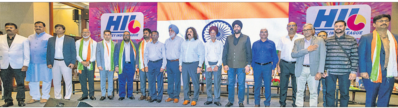
ନୂଆଦିଲ୍ଲୀରେ ଶୁକ୍ରବାର ହକି ଇଣ୍ଡିଆ ଲିଗ୍ ଯୋଗଣା ଅବସରରେ ଏସୋଇଏଲ୍ କର୍ମକର୍ତ୍ତା ଓ ଅନ୍ୟମାନେ।