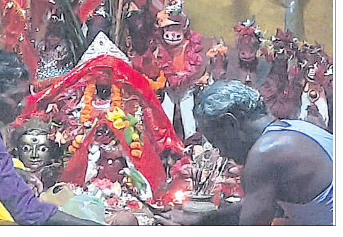
ଖଣ୍ଡପଡ଼ା, ୪।୧୦ (ଅକ୍ଷୟ କୁମାର ମହାରଣା)

ଖଣ୍ଡପଡ଼ା ବ୍ଲକ ଅଧୀନ କିଆଡ଼େ ଗ୍ରାମର ଆରାଧ୍ୟ ମା' କୁକୁଟାଶୁଣାଙ୍କ ଉଦ୍ଧାରପତ୍ରା ପର୍ବ ଗୁରୁବାର ରାତିରେ ଅନୁଷ୍ଠିତ ହୋଇଯାଇଛି । ଏହି ଅବସରରେ ମା'ଙ୍କର ସମସ୍ତ ନୀତିକାନ୍ତି ଶେଷ ପରେ ମନ୍ଦିରର ପୂଜାର୍ଚ୍ଚନା ଆରମ୍ଭ ହୋଇଥିଲା । ମା'ଙ୍କ ମନଲୋଭା ବେଶ ଦର୍ଶନ ସହ ଭୋଗ ଲାଗି ନିମନ୍ତେ ଆଖପାଖ ଅଞ୍ଚଳରୁ ଶ୍ରଦ୍ଧାଳୁଙ୍କ ସମାଗମ ହୋଇଥିଲା । ସନ୍ଧ୍ୟାରେ ସିଦ୍ଧି ବିନାୟକ