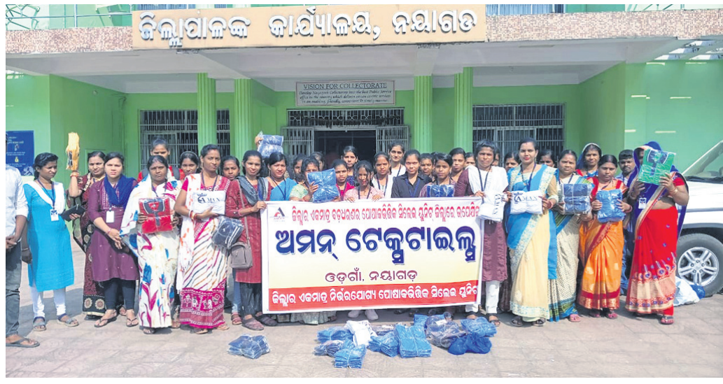
ଜିଲାପାଳଙ୍କ କାର୍ଯ୍ୟାଳୟ, ନୟାଗଡ଼ରେ ଟେଲରୀ ଯୁନିଟ୍ ସଦସ୍ୟମାନେ ସିରୋଇ ପ୍ରଦର୍ଶନ କରୁଛନ୍ତି।

ନକଲି ପାଇଁ ଅସଲି ଟେଲରୀ ଯୁନିଟ୍ ନୟାଗଡ଼ ଜିଲ୍ଲାରେ ବନ୍ଦ ହେବାକୁ ଯାଉଛି। ସ୍କୁଲ ଯୁନିଟ୍‌ର ଟିଆରି ପରେ ବିକ୍ରି ହୋଇ ପାରୁ ନ ଥିବାରୁ ଜିଲାର ପ୍ରମୁଖ କେତେଗୋଟି ଟେଲରୀ ଯୁନିଟ୍‌ରେ ତାଳା ପଡ଼ିବା ପରି ସ୍ଥିତି ଉପୁଜିଲାଣି। ପ୍ରଶାସନ ଏ ଦିଗରେ ପଦକ୍ଷେପ ନ ଥିବାରୁ ସାଧାରଣ ଯୁକ୍ତପିଠା ହୋଇଥିବା ମହିଳା ବୁଦ୍ଧି ହରାଇବାର ଭୟ ଦେଖା ଦେଇଛି। ଏଭଳିସ୍ଥିତିରେ ଉଡ଼ିଗାଁର ଅମନ୍ ଟେଲରୀ ଯୁନିଟ୍ ୫୨ ଜଣ ସିଲେଇ କର୍ମଚାରୀ ଜିଲାପାଳଙ୍କୁ ଭେଟି ଟେଲରୀ ଯୁନିଟ୍ ଓ ନିଜର ଅସୁବିଧା ନେଇ ଶୁଣିବାର ଫୋରାଫ ହୋଇଛନ୍ତି। ଯେଉଁ ସିଲେଇ ଯୁନିଟ୍ ପ୍ରକୃତରେ ସ୍କୁଲ ଡ୍ରେସ ଡିଆରି କରୁଥିବା ସେମାନଙ୍କଠାରୁ ଡ୍ରେସ କିଣାଯିବାର ବ୍ୟବସ୍ଥା କରାଯାଉ। ଅନ୍ୟ ଜିଲାରୁ ଡ୍ରେସ କିଣି ସିଲେଇ ଯୁନିଟ୍ ନିରେ ଚାଲିଥିବା ଡ୍ରେସ ବିକ୍ରି ବ୍ୟବସ୍ଥାକୁ ବନ୍ଦ କରାଯିବାକୁ ଦାବି କରିଛନ୍ତି। ୨୨୮ ଟେଲରୀ ଯୁନିଟ୍ କୁ ନେଇ ଉଠିଲା ପ୍ରଶ୍ନ ଜିଲ୍ଲାରେ ୨୨୮ଟି ଟେଲରୀ ଯୁନିଟ୍ କୁ ସରକାରୀ ସ୍କୁଲକୁ ଡ୍ରେସ ବିକ୍ରି କରୁଥିବା ସରକାରୀ ରେକର୍ଡ କରୁଛି। ତେବେ ଜିଲ୍ଲାରେ ଏତେ ସଂଖ୍ୟକ ଟେଲରୀ ଯୁନିଟ୍ ନ ଥିବା ଅଭିଯୋଗ ଉଠିଛି। ଶିକ୍ଷା ବିଭାଗ ସେଥିପ୍ରତି ପ୍ରକାଶିତ