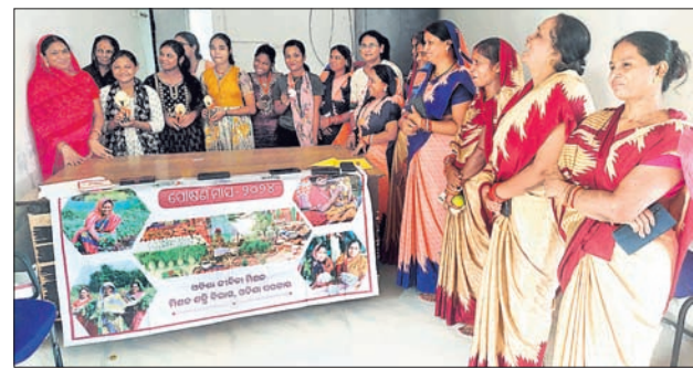
କାର୍ଯ୍ୟକ୍ରମରେ ଯୋଗଦେଇଥିବା ଅତିଥି ଏବଂ ଅନ୍ୟମାନେ।

ରଘୁଲକ୍ଷ୍ମୀ, ୪୧୦(ରଞ୍ଜିତ ରାଉତ) ରଘୁଲକ୍ଷ୍ମୀଙ୍କୁ ଲକ୍ଷ୍ମୀ ଅର୍ଚ୍ଚନା ଚୋରକା ପଞ୍ଚାୟତ ମିଶନ ଶକ୍ତି ଦ୍ୱାରା ପକ୍ଷରୁ