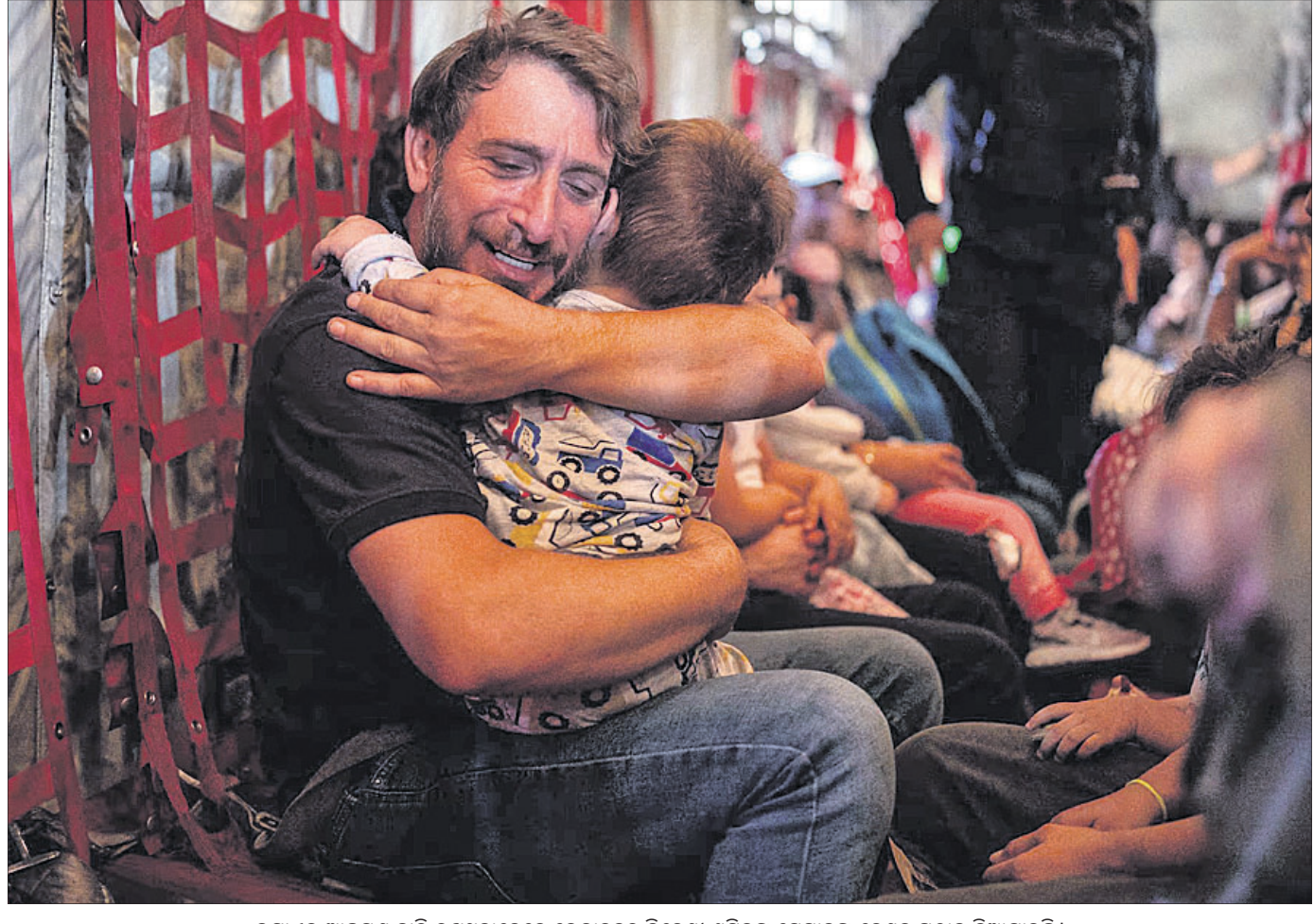
ଇସ୍ରାଏଲ୍ ଆକ୍ରମଣ ଜାରି ରଖୁଥିବାବେଳେ ଲେବାନନ୍ ରୁ ବିଦେଶୀ ଶ୍ରମିକଙ୍କୁ ସେମାନଙ୍କ ଦେଶକୁ ପଠାଇ ଦିଆଯାଇଛି । ବେରୁଟ୍ରେ ଥିବା ଗ୍ରୀସ୍ ଗଣେ ବ୍ୟକ୍ତି ଭୟରେ ନିଜ ପୁଅଙ୍କୁ ଡାକୁଡ଼ି ଧରିଛନ୍ତି ।

ଉତ୍ତରପ୍ରଦେଶର ମିର୍ଜାପୁରରେ ଗୁରୁବାର ବିଳମ୍ବିତ ରାତିରେ ଶ୍ରମିକମାନଙ୍କୁ ନେଇ ଯାଉଥିବା ଏକ ଟ୍ରାକ୍ଟରକୁ ଟ୍ରକ୍ ଧକ୍କା ଦେବାରୁ ୧୦ ଜଣଙ୍କ ମୃତ୍ୟୁ ଘଟିବା ସହ ଅନ୍ୟ ୩ ଜଣ ଆହତ ହୋଇଛନ୍ତି । ମିର୍ଜାପୁର-ବାରାଣସୀ ସାମା ଇ.ଟି. ରୋଡ଼ରେ ଏହି ଦୁର୍ଘଟଣା ଘଟିଛି । ନିର୍ମାଣ କାର୍ଯ୍ୟ ସାରି ୧୩ ଜଣ ଶ୍ରମିକ ଟ୍ରାକ୍ଟର ଟ୍ରାକ୍ଟର ଘରକୁ ଫେରୁଥିବାବେଳେ ଏକ ଟ୍ରକ୍ ପଛପଟୁ ଧକ୍କା ଦେଇଥିଲା । ହସ୍ପିଟାଲ ନେବା ବାଟରେ ସେମାନଙ୍କ ମଧ୍ୟରୁ ୧୦ ଜଣଙ୍କ ମୃତ୍ୟୁ ଘଟିଥିଲା । ଶ୍ରମିକମାନଙ୍କ ମୃତ୍ୟୁକୁ ନେଇ ପ୍ରଧାନମନ୍ତ୍ରୀ ନରେନ୍ଦ୍ର ମୋଦି ଶୋକାବ୍ୟକ୍ତ କରିବା ସହ ମୃତକଙ୍କ ପରିବାର ପିଛା ୨ ଲକ୍ଷ ଏବଂ ଆହତଙ୍କ ପାଇଁ ୫୦ ହଜାର ଟଙ୍କା ସହାୟତା ଘୋଷଣା କରିଛନ୍ତି ।