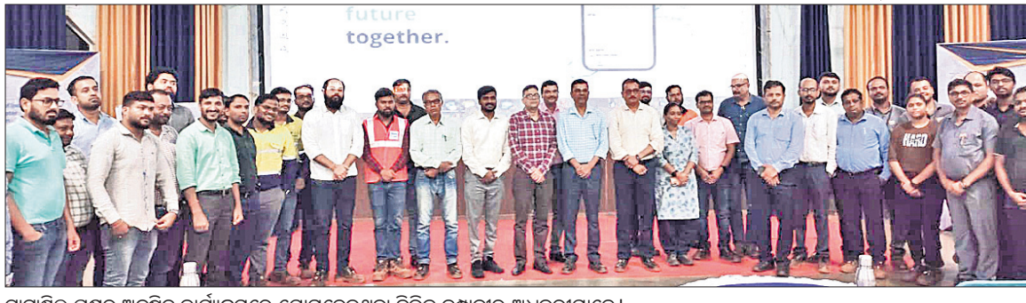
ଗାଟାଷ୍ଟିକ ପକ୍ଷରୁ ଅନୁଷ୍ଠିତ କାର୍ଯ୍ୟକ୍ରମରେ ଯୋଗଦେଇଥିବା ବିଭିନ୍ନ କର୍ମୀଙ୍କର ଅଧିକାରୀମାନେ।

କାଳିଆପାଣି, ୪୧୦ (ଅଧିକ ମହାନ୍ତି) ଗାଟାଷ୍ଟିକ ପକ୍ଷରୁ ମାଲିନ୍ ଇଞ୍ଜିନିୟରିଂ ଆସୋସିଏସନ ଅଫ୍ ଇଣ୍ଡିଆ (ଏମ୍.ଆଇ.ଏ.ଆଇ.) ଉଦ୍ଦେଶ୍ୟରେ ଯୋଡ଼ା ପାଇଁ ଫୁଲ୍ ଡିଭିଜନ୍ ଗ୍ରାମାଞ୍ଚଳ ଖଣି ପରିସରରେ ଖଣି ଜଳ ପରିଚାଳନାରେ ଉନ୍ନତ ମାଧ୍ୟମ ବ୍ୟବହାର ଶୀର୍ଷକ ଏକ ଅଧିକାରୀଙ୍କ ଅନୁଷ୍ଠିତ ହୋଇଥିଲା।