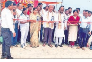
ରାଜନଗର, ୪୧୦ (ଭାସ୍କର ରାଉତରାୟ)

ରାଜନଗର ବ୍ଲକ୍ ପେଣ୍ଠା ବେଳାଭୂମିଠାରେ ଜିଲ୍ଲାସ୍ତରୀୟ ବିତ୍ତ ଭଲିବଲ ଟୁର୍ନାମେଣ୍ଟ ଅନୁଷ୍ଠିତ ହୋଇଯାଇଛି। ଜିଲ୍ଲା ଶିକ୍ଷା ବିଭାଗ ପକ୍ଷରୁ ଆୟୋଜିତ ଏହି ଟୁର୍ନାମେଣ୍ଟରେ ଜିଲ୍ଲାର ୯ଟି ବ୍ଲକ୍ ଖେଳାଳିମାନେ ଭାଗ ନେଇଥିଲେ।