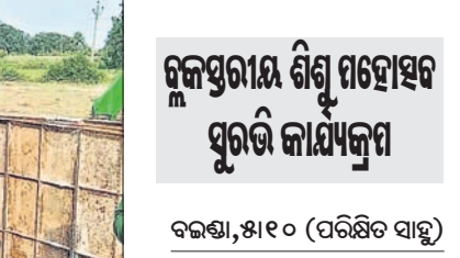
କଳାପ୍ରଦର୍ଶନ ଶିଶୁ ମହୋତ୍ସବ ପୁରୁତ୍ତି କାର୍ଯ୍ୟକ୍ରମ

କିଶୋରନଗର ବ୍ଲକ ବାପୁର ମୁବଜୋତି ଉଚ୍ଚ ବିଦ୍ୟାଳୟ ପରିସରରେ ଗୁରୁବାର କଳାପ୍ରଦର୍ଶନ ଶିଶୁ ମହୋତ୍ସବ ପୁରୁତ୍ତି କାର୍ଯ୍ୟକ୍ରମ ଅନୁଷ୍ଠିତ ହୋଇଯାଇଛି। ଏଥିରେ ବ୍ଲକର ୧୭ଟି କ୍ଲଷ୍ଟରରୁ ୨୯ ଗୋଟି ପ୍ରତିଯୋଗୀ ଭାଗ ନେଇଥିଲେ। ଏହି କାର୍ଯ୍ୟକ୍ରମକୁ କିଶୋରନଗର ଗୋଷ୍ଠୀ ଶିକ୍ଷା ଅଧିକାରୀ ଅରୁଣ କୁମାର ସେଠା ଉଦ୍‌ଘାଟନ କରିଥିଲେ। ଏହି ଅବସରରେ କୁଳ, ପୁଳକଣ୍ଠା ଲିଖନ, ବିଚାର, ଭୁଜା, ମଧ୍ୟାହ୍ନ ଭୋଜନ ଆଧାରରେ