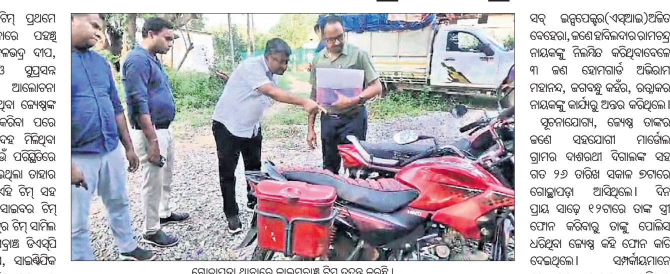
ଗୋଛାପଡ଼ା ଥାନାରେ କ୍ରାନ୍ତମୁଖୀ ଚନ୍ଦ୍ର ଚନ୍ଦ୍ର କରୁଛି।