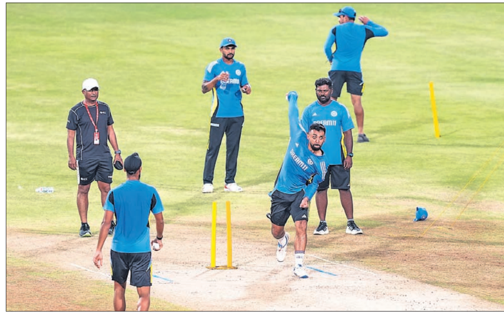
ଭାରତୀୟ ଦଳ ନେତୃତ୍ୱରେ ଅଭ୍ୟାସରେ ବହୁଳ ଚକ୍ରବର୍ତ୍ତୀଙ୍କ ବୋଲି ଅଭ୍ୟାସ ।

ଭୁବନେଶ୍ୱର, ୫୧୦ (ପି.ଟି.) ରବିବାର ବ୍ୟାଲାଦେଶ ବିପକ୍ଷରେ ୩ ମ୍ୟାଚ୍ ବିଶିଷ୍ଟ ଟି୨୦ ଫିଟନେସ୍ ପ୍ରତିଯୋଗିତାରେ ମୟଙ୍କ ଫିଟନେସ୍ ଉପରେ ନଜର ପଡ଼ିଲା । ଏହି ମ୍ୟାଚ୍‌ରେ ଯୋଗ୍ୟତା ହାସଲ କରିଥିବା ମୟଙ୍କ ଫିଟନେସ୍ ଉପରେ ନଜର ପଡ଼ିଲା । ଏହି ମ୍ୟାଚ୍‌ରେ ଯୋଗ୍ୟତା ହାସଲ କରିଥିବା ମୟଙ୍କ ଫିଟନେସ୍ ଉପରେ ନଜର ପଡ଼ିଲା । ଏହି ମ୍ୟାଚ୍‌ରେ ଯୋଗ୍ୟତା ହାସଲ କରିଥିବା ମୟଙ୍କ ଫିଟନେସ୍ ଉପରେ ନଜର ପଡ଼ିଲା । ଏହି ମ୍ୟାଚ୍‌ରେ ଯୋଗ୍ୟତା ହାସଲ କରିଥିବା ମୟଙ୍କ ଫିଟନେସ୍ ଉପରେ ନଜର ପଡ଼ିଲା ।