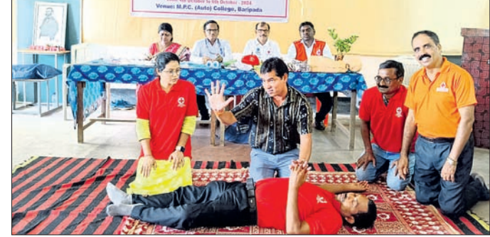
ରେଡକ୍ରସ୍ ପକ୍ଷରୁ ତାଲିମ ଦିଆଯାଇଛି।