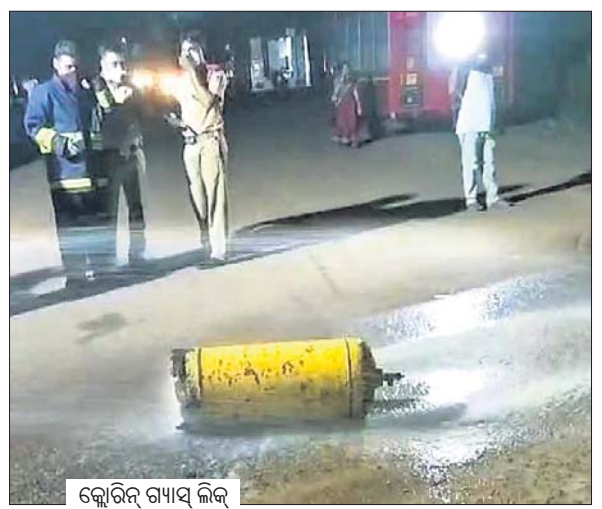
କ୍ଲୋରିନ୍ ଗ୍ୟାସ୍ ଲିକ୍

ଭୁବନେଶ୍ୱର ଇନ୍ଦ୍ରପାଦି ଥାନା ଅନ୍ତର୍ଗତ ଚନ୍ଦକା ଶିଳ୍ପାଞ୍ଚଳରେ ଥିବା ଏକ ଗ୍ୟାସ୍ କାରଖାନାରୁ ଶନିବାର କ୍ଲୋରିନ୍ ଗ୍ୟାସ୍ ଲିକ୍ ହୋଇଛି। କିଛି ସମୟରେ ମଧ୍ୟରେ ଏହି ଗ୍ୟାସ୍ ଗାସିଆରେ ବ୍ୟାପିଯିବାରୁ ପ୍ରବଳ ଚିନ୍ତା ହୋଇଥିଲା। ତେବେ ଏହି ଗ୍ୟାସ୍ ଲିକ୍ରେ କାହାର କିଛି କ୍ଷତି ହୋଇ ନ ଥିଲେ ମଧ୍ୟ ଏହା ପ୍ରଭାବରେ ଲୋକଙ୍କ ଆଖି ଓ ନାକ ପୋଡ଼ିବା ଆରମ୍ଭ କରିଥିଲା। ଲୋକେ ଆତଙ୍କିତ ହୋଇପଡ଼ିବା ସହ ଘଟଣା ସଂଗ୍ରାହରେ ଅଗ୍ନିଶମ ବିଭାଗ ଓ ପୋଲିସକୁ ଖବର ଦେଇଥିଲେ। ପୋଲିସ ଘଟଣାସ୍ଥଳରେ ପହଞ୍ଚି କାରଖାନା ସମ୍ପର୍କିତ କର୍ମୀଙ୍କୁ ବାଧ୍ୟପୂର୍ବକ ଗ୍ରାହ୍ୟ କରିଥିଲା। ଏପଟେ ଚନ୍ଦ୍ରଶେଖରପୁର ଅଗ୍ନିଶମ