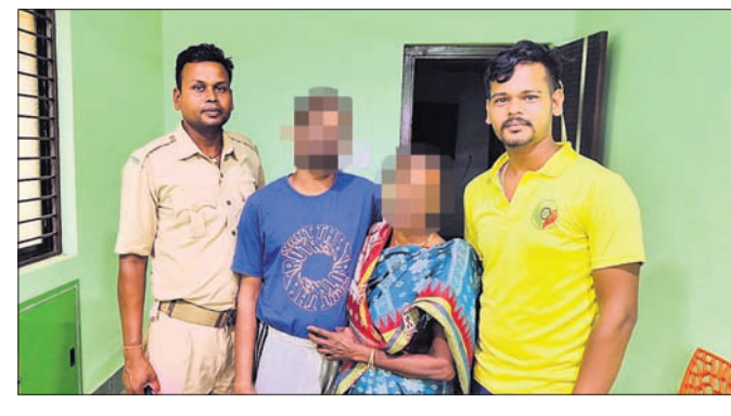
ଯୁବକଙ୍କ ସହ ତାଙ୍କ ମା' ଓ ଡିଏମ୍ଏସ୍ ଆଣ୍ଡ ଟିଏମ୍ଏସ୍ ସଦସ୍ୟ।

ବଡ଼ ମେଡିକାଲରେ ଭର୍ତ୍ତି ହୋଇଥିଲେ। ଚିକିତ୍ସାଧୀନ ଅବସ୍ଥାରେ ୨୦୧୬ରେ ସେ ମେଡିକାଲ ପରିସରକୁ ନିରୁଦ୍ଧିଷ୍ଟ ହୋଇଯାଇଥିଲେ। ପରିବାର ଲୋକେ ବହୁ ଖୋଜାଖୋଜି ପରେ ମଧ୍ୟ ତାଙ୍କୁ ପାଇ ନ ଥିଲେ। ନିକଟରେ ବାଂଶପାଳ ଅଞ୍ଚଳରୁ ଜଣେ ମାନସିକ ବିକାରଗ୍ରସ୍ତ ଯୁବକ ୨ ବର୍ଷ ଧରି ଗୁଣାୟ ଜଙ୍ଗଲରେ ରହି ଆସୁଥିବା ଖବର ପାଇ ଡିଏମ୍ଏସ୍ ଆଣ୍ଡ ଟିଏମ୍ଏସ୍ ଗତ କୁଳ ୮ରେ ସେଠାରେ ପହଞ୍ଚି ତାଙ୍କୁ ଉଦ୍ଧାର କରିଥିଲେ। ଗୁଣାୟ ଲୋକଙ୍କ କହିବା ଅନୁଯାୟୀ, ସେମାନେ ଯୁବକଙ୍କୁ 'ଗାଜନ' ବୋଲି ଡାକୁଥିଲେ। ଯିଏ ଯାହା ଦେଉଥିଲା ସେ ଖାଉଥିଲେ। ଉଦ୍ଧାର ପରେ ଡିଏମ୍ଏସ୍ ଆଣ୍ଡ ଟିଏମ୍ଏସ୍ ସହ ସମ୍ପୂର୍ଣ୍ଣ ପ୍ରାଣେ ନିଆଯାଇଥିଲା। ଚିକିତ୍ସା ପରେ