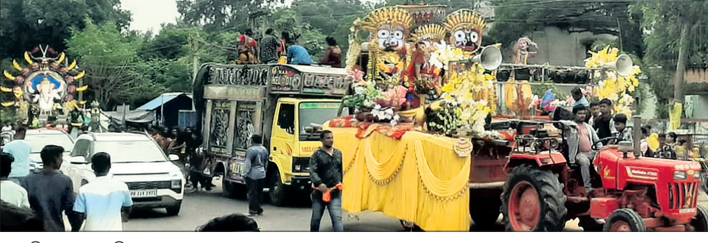
ଭାସାଣି ଉତ୍ସବରେ ସାମିଲ ହୋଇଥିବା ମେଡ଼ା।