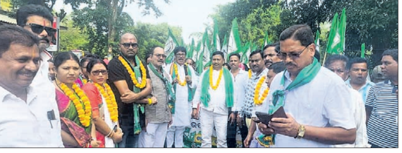
ଜନ ସମ୍ପର୍କ ପଦଯାତ୍ରାରେ ବିଜେଡି ନେତା ଓ କର୍ମକର୍ମୀ।