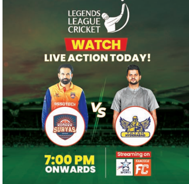
ପ୍ରଥମ ବିଜୟ ସମ୍ପାଦନରେ ରହିଛି ଭୁବନେଶ୍ୱର ପ୍ରଥମେ ବ୍ୟାଟି କରିଥିଲା। ଦଳ ପକ୍ଷରୁ ମହମ୍ମଦ କେମ୍ପ ସର୍ବାଧିକ ୩୪ ରନ କରିଥିଲେ। ଧ୍ୟାନ ଜର୍ଜସ

ଖେଳିବ। ଲିଗ୍‌ରେ ସୂର୍ଯ୍ୟସ ୬ ଦଳର ନେତୃତ୍ୱ ନେଉଛନ୍ତି। ପାଖ ସହ ଦ୍ୱିତୀୟ ସ୍ଥାନରେ ରାଜସ୍ଥାନର ଯୋଧପୁରରେ ଥିବାବେଳେ ହାଇଦ୍ରାବାଦ ଏହା ଓଡ଼ିଶାଭିତ୍ତିକ ଦଳ କୋଣାର୍କ