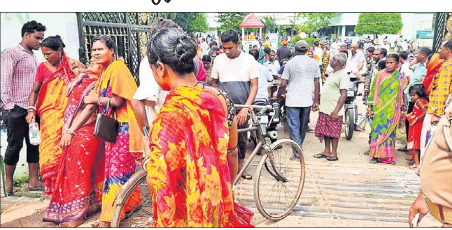
ରିଲିଫ୍ ବଣ୍ଟନ ବେଳେ ଠେଲାପେଲା

ବାଲିଆପାଳ (ଗୋପାଳ ଚନ୍ଦ୍ର ସାହୁ) / (ଅନୁଲ୍ୟ କୁମାର ଦାସ) / କାଳିପଦା (ରାଜଶ୍ରୀ ପାଣିଗ୍ରାହୀ), ୫୧୧୦