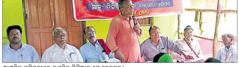
ଆଞ୍ଚଳିକ ସମ୍ମିଳନୀରେ ଉପସ୍ଥିତ ସିପିଆଇଏମ୍ ନେତୃବୃନ୍ଦ।

ଡିହଡ଼ି, ୫୧୧୦ (ସଞ୍ଜିତ ବଳ) ଡିହଡ଼ି ବ୍ଲକ୍ ବିଭିନ୍ନ ପଞ୍ଚାୟତରେ ବନ୍ୟାଜଳ ପାଇଁ ଧାନ ଚାଷ କ୍ଷତିଗ୍ରସ୍ତ ହେଉଛି। ଏହାର ପ୍ରତିକାର ତଥା ବନ୍ୟାଜଳ ରୋକିବା ଦାବିରେ ଚାଷୀ ମୁଲିଆ ଆନ୍ଦୋଳନ ବ୍ୟାପକ କରିବାକୁ ଶନିବାର ସିପିଏମ୍ ନେତୃବୃନ୍ଦ ଆଞ୍ଚଳିକ ସମ୍ମିଳନୀରେ ନେତାମାନେ ଆହ୍ୱାନ ଦେଇଛନ୍ତି। ପାର୍ଟି ନେତୃବୃନ୍ଦ ଡିହଡ଼ି ବ୍ଲକ୍ରେ ଗ୍ରାମିଣ ସମସ୍ୟା, ଡିହଡ଼ିରେ କୋର୍ଟ ପ୍ରତିଷ୍ଠା, ବସ୍ତ୍ରାଳୟ ଓ ତାଳକଳା ନିର୍ମାଣ, ସ୍ୱାସ୍ଥ୍ୟକେନ୍ଦ୍ରରେ ଡାକ୍ତର, ଅଧିକ ସାମାଜିକ ସେବା ପରିବର୍ତ୍ତନ ସହ ବୋଲି କହିଥିଲେ। ଦିଗତ ୩ ବର୍ଷରେ ଦଳୀୟ କାର୍ଯ୍ୟର ୩