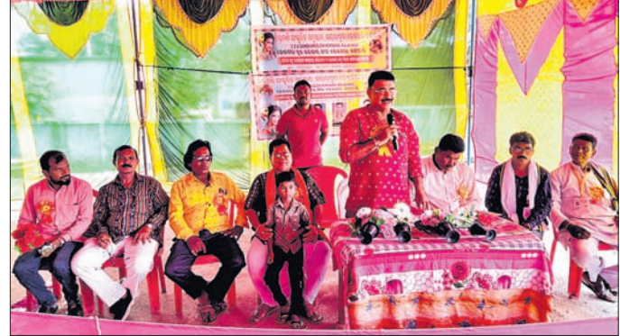
ଚିନ୍ତାମଣି ସାଂସ୍କୃତିକ ଅନୁଷ୍ଠାନ ପସରୁ କଳାକାରମାନଙ୍କ ବନ୍ଧୁ ମିଳନ କାର୍ଯ୍ୟକ୍ରମ।

କଳାହାଣ୍ଡି ଜିଲ୍ଲା ଭବାନୀପାଟଣାସ୍ଥିତ ଗଊନହଲଠାରେ ଶନିବାର ସନ୍ଧ୍ୟାରେ ୭୦ତମ ଜାତୀୟ ବନ୍ୟପ୍ରାଣୀ ସପ୍ତାହ ପାଳିତ ହୋଇ ଯାଇଛି।