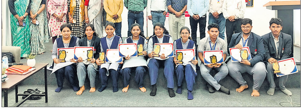
ସଫଳତା ଆଣିଥିବା ପ୍ରଗତି ହାୟର ସେକେଣ୍ଡାରୀ ସ୍କୁଲର ଛାତ୍ରାଛାତ୍ରୀ।

କଳାହାଣ୍ଡି ଜିଲ୍ଲା ମୁଖ୍ୟ ଚିକିତ୍ସାଳୟ ଓ ଜନସ୍ୱାସ୍ଥ୍ୟ ଅଧିକାରୀଙ୍କ କାର୍ଯ୍ୟକ୍ରମ ପସରୁ ବିଶ୍ୱ ମାନସିକ ଓ ସ୍ୱାସ୍ଥ୍ୟ ଦିବସ ପାଳନ ଅବସରରେ ଭବାନୀପାଟଣା ହାୟର ସେକେଣ୍ଡାରୀ ସ୍କୁଲସ୍ତରରେ ଏକ ପ୍ରତିଯୋଗିତା ଅନୁଷ୍ଠିତ ହୋଇଥିଲା।