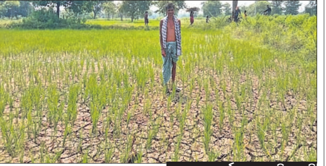
କୁମାରପୁର, ୬/୧୦ (ସୁନାଲ କୁମାର ବିହାରୀ)

କଳାହାଣ୍ଡି ଜିଲ୍ଲା କୁମାରପୁର ବ୍ଲକ୍ ବାଗଡ଼ୁଆରୀ ଓ ଭେଜିପଦର ଗ୍ରାମକୁ କେନାଲ ପାଣି ଠିକ୍ ଭାବରେ ପହଞ୍ଚି ପାରୁନାହିଁ। ଫଳରେ ସେଠାରେ ଚାଷ ହୋଇଥିବା ପ୍ରାୟ ୨ ଶହ ଏକର ଧାନ ଚାଷ ଉଜୁଡ଼ିବା ଆଶଙ୍କା ଦେଖାଦେଇଛି।