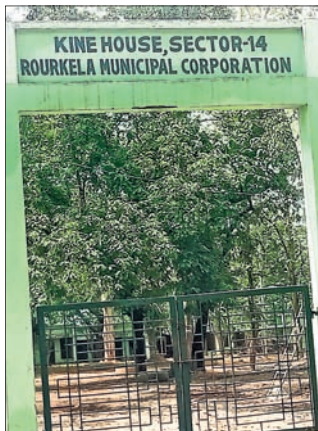
ସେକ୍ଟର-୧୪ ସ୍ଥିତ ଗୋ ନିରୋଧଶାଳା। ଗୋ ଉଦ୍ଧାର ହେଉନାହିଁ କି ଅଧିକାଂଶ ମଧ୍ୟ ହେଉନାହିଁ। ସେହିପରି ଆବଶ୍ୟକ ପ୍ରଦାନ ଗୋଶାଳା ନିର୍ମାଣ ମଧ୍ୟ ହେଉନାହିଁ।

କରି ଉଚ୍ଚ ଗୋ-ନିରୋଧଶାଳାରେ ରଖାଗଲା। ସେମାନଙ୍କ ଖାଇବା ପାଇଁ ପ୍ରତି ସପ୍ତାହରେ ଆର-ଏମ୍‌ସି ପକ୍ଷରୁ ୬୦/୬୦ କୁଇଣ୍ଟାଲ ଲେଖାଏଁ ଦାନ, ପାଳକୁଟି ଏବଂ ଗୋକଟ ଆଦି ପ୍ରଦାନ କରାଗଲା। ଏଥିସହ ବୁଲ୍ଲା ଗୋକୁ ପାଣି ପିଇବା ପାଇଁ ୬୦୦ ଉର୍ଦ୍ଧ୍ୱ ଜଳକୂଅ ମଧ୍ୟ ନିର୍ମାଣ ହେଲା।