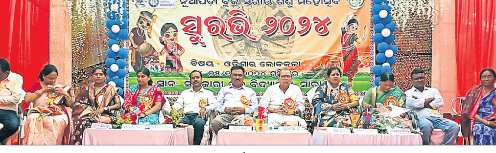
ଶିଶୁ ମହୋତ୍ସବ ସୁରଭି କାର୍ଯ୍ୟକ୍ରମରେ ମଞ୍ଚାସୀନ ଅତିଥି।

କୋକସରା, ୬/୧୦ (ବୁଦ୍ଧଜିତ କୁମାର ପାଟ୍ଟନାୟକ) ଶନିବାର ବିଳମ୍ବିତ ରାତିରେ ଏକ ଗାଡ଼ି ଧକ୍କାରେ ଜଣେ ଯୁବକଙ୍କ ମୃତ୍ୟୁ ଘଟିଛି। ଗାଡ଼ିର ପରିଚୟ ଅସ୍ପଷ୍ଟ ରହିଛି। କଳାହାଣ୍ଡି ଜିଲ୍ଲା କୋକସରା ବ୍ଲକ୍ ଆମପାଣି ଥାନା ବିଲୁ ଏକ୍ସପ୍ରେସ୍ ଷ୍ଟେ ଜୁଲେଇଗୁଡ଼ା ନିକଟରେ ଏହି ଘଟଣା ଘଟିଛି।