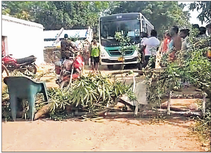
କେନାଲ ପାଣି ଯୋଗାଣ ଦାବିରେ ଚାଷୀମାନେ ରାସ୍ତା ଅବରୋଧ କରିଛନ୍ତି।