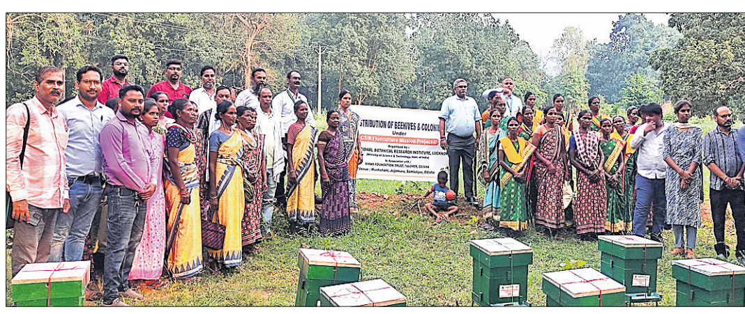
ମହିଳା ଚାଷୀଙ୍କୁ ମହୁ ଚାଷମାନୁ ପ୍ରଦାନ କରାଯାଇଛି ।

ସମ୍ବଲପୁର, ୬।୧୦ (ଭବାନୀ ଶଙ୍କର ଭୋଇ) ସିଏସ୍‌ଆଇଆର୍ (ବୈଜ୍ଞାନିକ ଏବଂ ଔଷଧୀୟ ଉତ୍ପାଦନ ପରିଷଦ) ପକ୍ଷରୁ ସମ୍ବଲପୁର ଜିଲ୍ଲା ମୁସୋପୁରା ବ୍ଲକ୍ ମୁଖାକାମରେ ହରି ମିଶନ ଅଧୀନରେ ଚାଷିମାନଙ୍କୁ ପ୍ରଶିକ୍ଷଣ ଏବଂ ବନ୍ଧନ କାର୍ଯ୍ୟକ୍ରମ କରାଯାଇଛି । ସିଏସ୍‌ଆଇଆର୍ ଆୟୋଜିତ ଏହି ପ୍ରଶିକ୍ଷଣ କାର୍ଯ୍ୟକ୍ରମକୁ ବିକାଶ ପାଇଥିବା ପ୍ରକଳ୍ପ ସହଯୋଗ କରିଛି । ବୈଜ୍ଞାନିକ ଜ୍ଞାନ ଆଧାରରେ ଗ୍ରାମୀଣ ଚାଷୀଙ୍କୁ ସମ୍ବଲପୁର ପକ୍ଷରୁ ସୁବିଧା ଦିଆଯାଇଛି । ଦେଶରେ ମଧୁ ଉତ୍ପାଦନକୁ ବୃଦ୍ଧି କରିବା ଏବଂ ଚାଷୀମାନଙ୍କ ଆୟକୁ ବୃଦ୍ଧି କରିବା ନେଇ ସିଏସ୍‌ଆଇଆର୍ ଏଭଲି କାର୍ଯ୍ୟକ୍ରମ ହାତକୁ ନେଇଛି । ଏହି ଅବସରରେ ସିଏସ୍‌ଆଇଆର୍