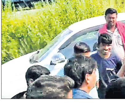
କୃତ୍ତିକା, ୭.୧୦ (ବିରଞ୍ଚି ଦଳ)

ସମ୍ବଳପୁର ଜିଲ୍ଲା ବାମରାରେ ରେଳ ପ୍ଲାଏଓଭର ବ୍ରିଜ୍ ସହ ସଂଲଗ୍ନ ରାସ୍ତା ନିର୍ମାଣ ପାଇଁ ଅଞ୍ଚଳବାସୀ ଦୀର୍ଘଦିନକୁ ଦାବି କରି ଆସୁଛନ୍ତି। ହେଲେ ପୂର୍ଣ୍ଣ ବିଭାଗର ଅହେତୁକ ବିକଳ ଯୋଗୁ ଅବଶେଷ ବର୍ତ୍ତମାନେ ଲାଗିଛି। ପ୍ଲାଏ ଓଭର ବ୍ରିଜ୍ ଓ ରାସ୍ତା ନିର୍ମାଣ ପାଇଁ ପୂର୍ଣ୍ଣ ବିଭାଗ ପକ୍ଷରୁ ବାରମ୍ବାର ସର୍ତ୍ତ ହୋଇ ଆସୁଥିଲେ ହେଁ ଏହାର ରୂପରେଖ ଓ କାର୍ଯ୍ୟକ୍ରମ ନେଇ ପ୍ରଶ୍ନବାଚୀ ସୃଷ୍ଟି ହୋଇଛି। ୪ ଦିନ ତଳେ ଅନୁଭୂତ ଭାବେ ସର୍ତ୍ତ ପାଇଁ ଆସିଥିବା କେତେକ ଅଧିକାରୀ ଅଞ୍ଚଳବାସୀଙ୍କ ଦ୍ୱାରା ହତହତ୍ୟାର ସମ୍ମୁଖୀନ ହୋଇଥିଲେ। ଶନିବାର ପୂର୍ଣ୍ଣ ଥରେ ଟ୍ରୋନ ସର୍ତ୍ତ ପାଇଁ ଆସିଥିବା ସମ୍ବଳପୁରର ଏକ କନସଲଟାନ୍ସି ସଂସ୍ଥା କନସଲଟାନ୍ସି ଆକ୍ସୋର ଶିକାର ହୋଇ ଫେରିଯାଇଛନ୍ତି। ସମ୍ପୂର୍ଣ୍ଣ