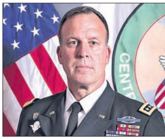
ଜେନେରାଲ ମାଜକେଲ ଇ. କୁରିଲା