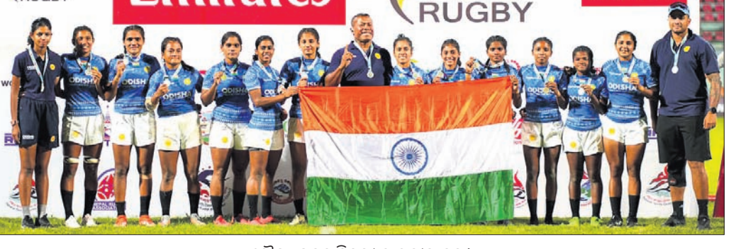
ରୌପ୍ୟ ପଦକ ବିଜୟୀ ଭାରତୀୟ ଦଳ।

ଭୁବନେଶ୍ୱର, ୨୧୦ (ତପନ ସ୍ୱାଇଁ) କାଠମାଣ୍ଡୁରୀର ଦଶରଥ ଷ୍ଟାଡ଼ିୟମରେ ଅନୁଷ୍ଠିତ ଏସିଆ ରଗ୍‌ବୀ ଏନିଭେଟ୍‌ସ୍ ସେଭେନ୍ସ ଟ୍ରଫି-୨୦୨୪ରେ ଭାରତୀୟ ମହିଳା ଦଳ ରୌପ୍ୟ ପଦକ ହାସଲ କରିଛି।