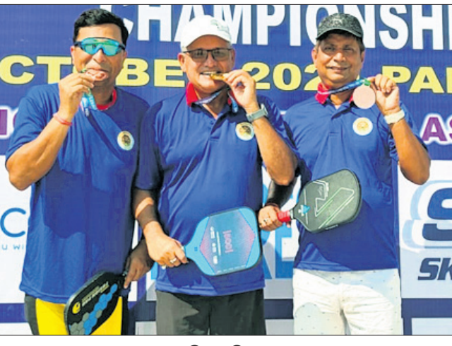
ପଦକ ସହ ଓଡ଼ିଶା ପ୍ରତିଯୋଗୀମାନେ।

ଭୁବନେଶ୍ୱର, ୨୧୦ (ତପନ ସ୍ୱାଇଁ) ହରିୟାଣାର ପାଟିପଡ଼ାରେ ଜାତୀୟ ପିକଲବଲ ଚାମ୍ପିୟନଶିପର ୮ମ ସଂସ୍କରଣର ଉଦ୍‌ଘାଟନ ହୋଇଛି।