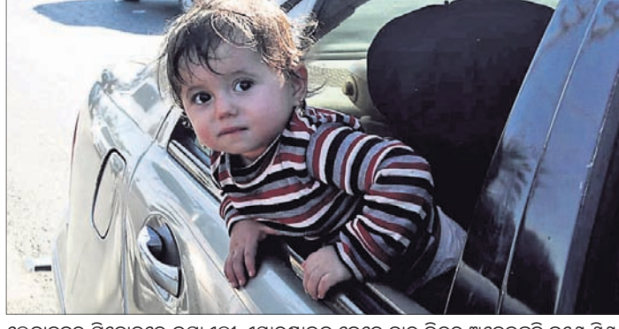
ଇରାନର ସିଡୋନ୍‌ରେ ଇସ୍ରାଏଲୀ ଏୟାରଷ୍ଟ୍ରାଇକ୍ ବେଳେ କାନ୍ଦୁ ଚିତ୍କରୁ ଅନେକଜଣି ଜଣେ ଶିଶୁ।