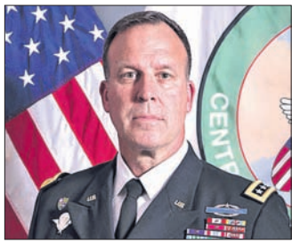
ଜେନେରାଲ ମାଜକେଲ ଇ. କୁରିଲା