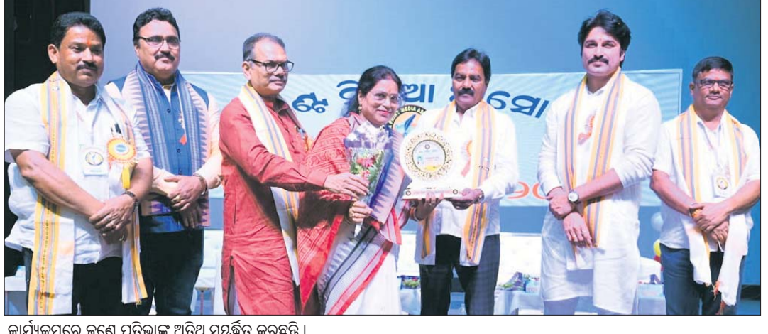
କାର୍ଯ୍ୟକ୍ରମରେ ଜଣେ ପ୍ରତିଭାକୁ ଅତିଥି ସମ୍ବର୍ଦ୍ଧିତ କରୁଛନ୍ତି।