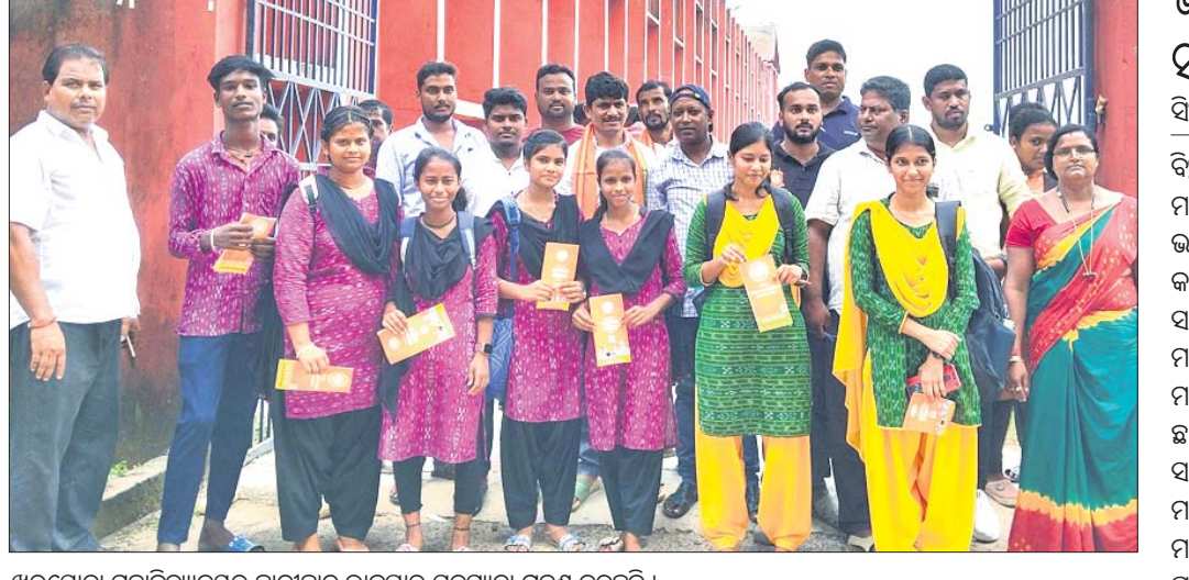
ଖରସ୍ରୋତା ମହାବିଦ୍ୟାଳୟର ଛାତ୍ରାଛାତ୍ର ଭାଜପାର ସଦସ୍ୟତା ଗ୍ରହଣ କରୁଛନ୍ତି।

ଅନୁଷ୍ଠିତ ହୋଇଥିବା କମିଟି ବରିଷ୍ଠ ସଦସ୍ୟଙ୍କ ପରଲୋକ ପାଇଥିଲେ। ଯାଜପୁର ଗଉଡ, ୬୧୦ (ପବିତ୍ର ରଞ୍ଜନ ମହାନ୍ତି):