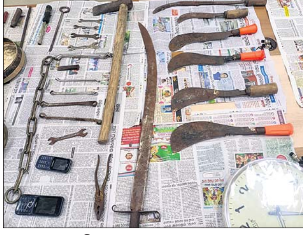
ଗିରଫ ୩ ଭାଇ ଓ କବଚ ମାରଣାସ୍ତ୍ର ।