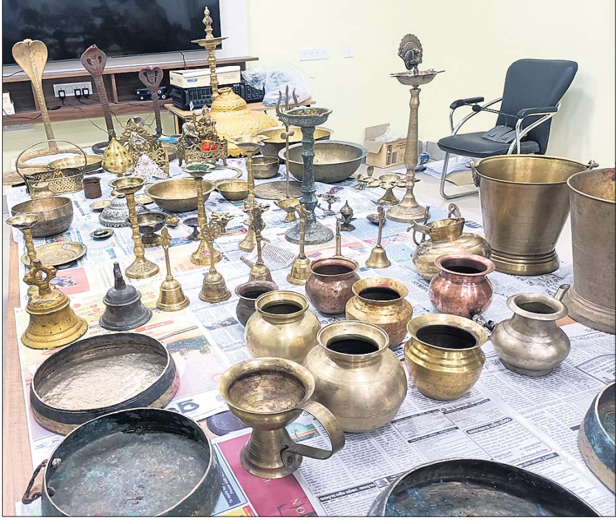
କବର ମୂର୍ତ୍ତି ଓ ଅନ୍ୟାନ୍ୟ ସାମଗ୍ରୀ ।

ପାଲି ଓ ଅନ୍ୟାନ୍ୟ ସାମଗ୍ରୀ । ପୋଲିସ ଏଥିପ୍ରତି ଅନୁଗତୀ ସହିତ ନିରାପତ୍ନ ଭାବରେ ସମ୍ପୂର୍ଣ୍ଣ ଉଦ୍ଧାରଣ କରାଯାଇଛି ।