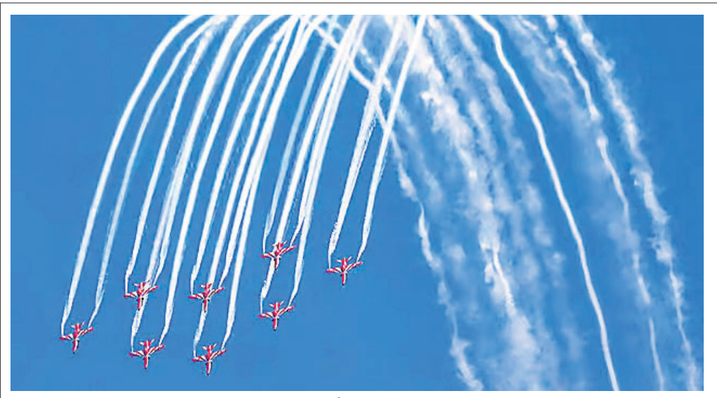
ଭାରତୀୟ ବାୟୁସେନାର ୯୨ତମ ବାର୍ଷିକୀ ଅବସରରେ ରବିବାର ଚେନ୍ନାଇର ମାରିନା ବେନାଜୁମିରେ ଆଇଏଏଫ୍ ଏରୋବେରିକ୍ସ ଟିମ୍‌ର 'ସୂର୍ଯ୍ୟ କିରଣ' ଏୟାର ଶୋ' ।

ମସ୍କ ଆମନ୍ତ୍ରଣ କରିବା ସହ ତାଙ୍କୁ ସେ ମଞ୍ଚ ଉପରେ 'ଅବିଶ୍ୱାସୀୟ ବ୍ୟକ୍ତି' ବୋଲି କହିଥିଲେ। ମସ୍କ ରାଲିରେ ଟ୍ରମ୍ପଙ୍କୁ ଉକ୍ତ ପ୍ରଶ୍ନା କରିବା ସହ ରାଷ୍ଟ୍ରପତି ଡା. ବାଜଡେନ୍‌ଙ୍କୁ ସମାଲୋଚନା କରିଥିଲେ। ଆମେରିକା ଗଣତନ୍ତ୍ରର ସୁରକ୍ଷା ପାଇଁ ଟ୍ରମ୍ପ ନିଶ୍ଚୟ ଲଢ଼ିବେ। ଏହା ଆମ ଜୀବନର ସବୁଠୁ ଗୁରୁତ୍ୱପୂର୍ଣ୍ଣ ନିର୍ବାଚନ ବୋଲି ମସ୍କ କହିଥିଲେ। ଟ୍ରମ୍ପଙ୍କୁ ଅଧିକ ଅଧିକ ଭୋଟ ଦେବା ପାଇଁ ରିପବ୍ଲିକାନ୍ ସମର୍ଥକମାନଙ୍କୁ ଉଦ୍‌ଘୋଷଣା ଦେଇଥିଲେ। ଯଦି ତାହା ନ ହୁଏ, ତେବେ ଏହା ଶେଷ ନିର୍ବାଚନ ଚାକ୍ରାନ୍ତ ହୋଇଥିଲା। ଟ୍ରମ୍ପଙ୍କୁ ପୂର୍ବଦ୍ୱାରା ଶନିବାର ଟ୍ରମ୍ପ ମଞ୍ଚକୁ ବଢ଼ିଆନେୟାର