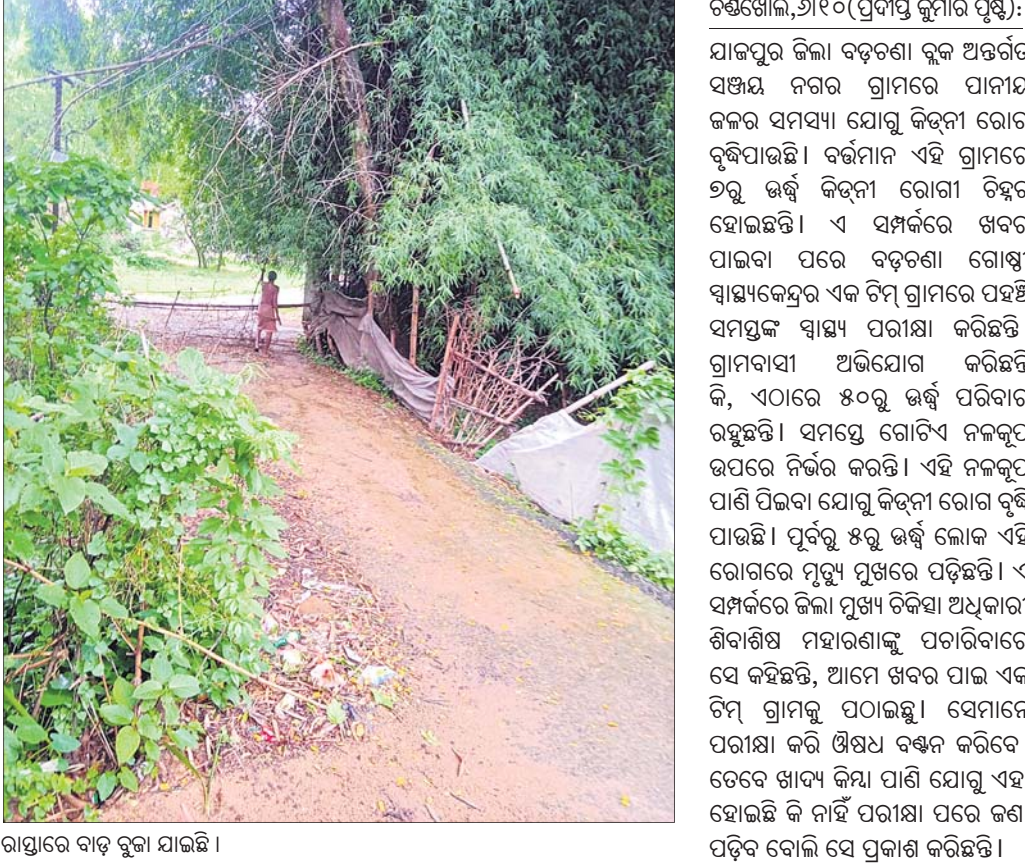
ରାସ୍ତାରେ ବାଡ଼ି ବୁଦ୍ଧି ଯାଇଛି।