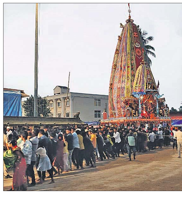
ମା' ବିରଜାଙ୍କ ରଥ ଶୁଭାରମ୍ଭ ଚାଲି ନେଇଛି।