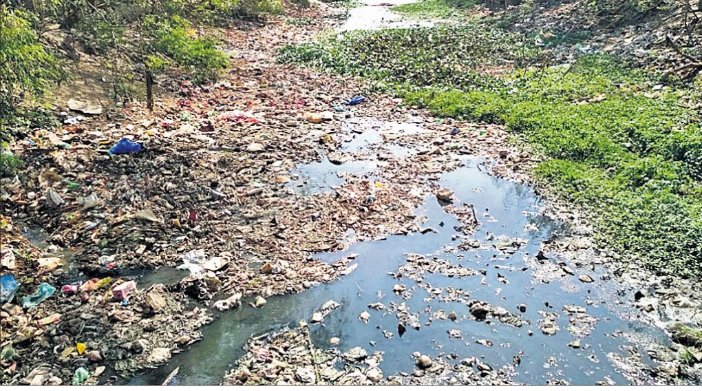
କେନ୍ଦ୍ରାପଡ଼ା ସହର ଗୋବରା କେନାଲରେ ପଲିଥିନ ଆବର୍ଜନା ପଡ଼ିରହିଛି।

ସିଙ୍କାଲ୍ ସ୍ତର ପ୍ଲାଷ୍ଟିକ୍ ଓ ପଲିଥିନ ବ୍ୟବହାର ସମ୍ପୂର୍ଣ୍ଣ ବର୍ଜନ ପାଇଁ ପ୍ରଧାନମନ୍ତ୍ରୀ ନରେନ୍ଦ୍ର ମୋଦି ୨୦୧୬ ସାକ୍ଷୀ ଜୟନ୍ତୀରେ ଆହ୍ୱାନ ଦେଇଥିଲେ। ଏହାକୁ ଉପଲକ୍ଷ୍ୟରେ ୮ ବର୍ଷ ବିତିଛି। ତେବେ କେନ୍ଦ୍ରାପଡ଼ା ଜିଲାରେ ଏହାର ତିତ୍ତ ବଦଳି ନାହିଁ। ବର୍ତ୍ତମାନ ପରିଚାଳନା ଆଇନକୁ ଗୁରୁତ୍ୱ ଦେବାକୁ ନ୍ୟାୟାଳୟ ଗ୍ରାମ ଡ୍ରବ୍ୱେନାଲ (ଏନଡିଏ) ନିର୍ଦ୍ଦେଶ ଦେବା ସହ ବ୍ୟତିକ୍ରମରେ କେନ୍ଦ୍ରାପଡ଼ା ପୌର ପ୍ରଶାସନକୁ ୨୪କୋଟି ଟଙ୍କା କରିମାନା ଦେବାକୁ ୨ ବର୍ଷ ପୂର୍ବେ ନୋଟିସ୍ ହୋଇଛି। ଏହାସହ ଏହାର ପରିଚାଳନାରେ ପୌର ପ୍ରଶାସନ ପକ୍ଷରେ ପଡ଼ିଛି। ଗୋବରା ନଦୀ ଓ କେନାଲ ଏବେ ବ୍ୟବହାର କରାଯାଉଅଛି। ଏବେ ହେଉଛି। ସେହିପରି ସହରର ଡ୍ରବ୍ୱେନାଲ ଏହି ସାମଗ୍ରୀ ପଡ଼ି ଜଳ ନିଷ୍କାସନରେ ବାଧା ସୃଷ୍ଟି କରୁଛି। ଏ ସମ୍ପର୍କରେ ଖଡ଼ିଆଙ୍ଗ ଥାନା ଆଇଆଇସି ପ୍ରଧାନ କହିଛନ୍ତି।