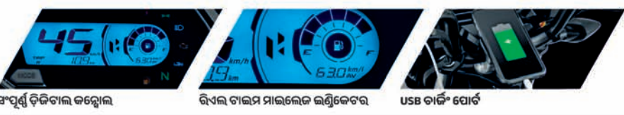
ସ୍ମାର୍ଟ୍ ଡିଜିଟାଲ କଲୋର