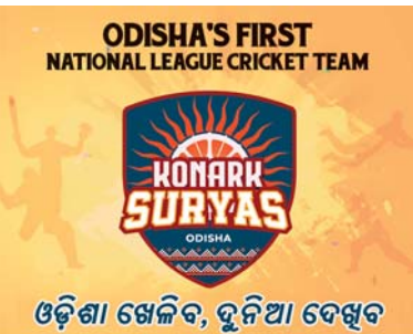
ଓଡ଼ିଶା ଷ୍ଟେଲିଟ୍, ଦୁନିଆ ଦେଖୁବ

ରାଜ୍ୟର ୯ ଜିଲ୍ଲାର ଗାଁ ଗାଁରେ ଗ୍ରାମକୁ ଛାଡ଼ିଦେଇ ଅନ୍ୟ ସବୁ ଅଞ୍ଚଳକୁ ପୁରୁଣା କର୍ମୀମାନେ ସିପିଆଇ ମାଓବାଦୀ ପ୍ରଭାବକୁ ମୁକ୍ତ କରିପାରିଛନ୍ତି। ମାଓବାଦୀଙ୍କ ପ୍ରତି ସମର୍ଥନକୁ ରୋକାଧିବା ସହ ମାଓବାଦୀ ସଂଗଠନ ପାଇଁ ଗ୍ରାମୀଣ ନିୟନ୍ତ୍ରିକ ମଧ୍ୟ ପ୍ରସ୍ତୁତ କରାଯାଇଛି। ଆମ ସରକାର ପ୍ରତ୍ୟେକ କ୍ଷେତ୍ରରେ ବିକାଶ ଉପରେ କୋର ଦେଇ ଅଧିକ ଅଞ୍ଚଳକୁ ସାମାଜିକ-ଅର୍ଥନୈତିକ-ରାଜନୈତିକ ମୁଖ୍ୟସ୍ତ୍ରୋତରେ ସାମିଲ କରିବା ଉପରେ କୋର ଦେଖିଛନ୍ତି। ଏବେ ବିଶେଷ ଭାବେ କନ୍ଧମାଳ, କନାହାଣ୍ଡି ଏବଂ ବୌଦ୍ଧ ଉପରେ ଫୋକସ ଦିଆଯାଇଛି। ଏହି ଅଞ୍ଚଳରେ ମାଓବାଦୀଙ୍କର କିଛି ପ୍ରଭାବ ରହିଛି। ସେହି ସବୁ ଅଞ୍ଚଳକୁ ମାଓବାଦୀଙ୍କୁ ମୂଳପୋଷ୍ଟ କରିବାକୁ ରାଜ୍ୟ ପୁରୁଣା ବାହିନୀ, କେନ୍ଦ୍ରୀୟ ପୁରୁଣା ବଳ, ଏପ୍ରିଲ ୭/୧୦