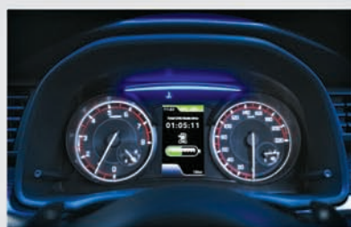
Multi-information Display (Dedicated CNG Fuel Gauge)