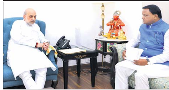
ନୂଆଦିଲ୍ଲୀରେ ସରକାରୀ ଅବସରରେ ସ୍ୱରାଷ୍ଟ୍ରମନ୍ତ୍ରୀ ଅମିତ୍ ଶାହାଙ୍କ ସହ ମୁଖ୍ୟମନ୍ତ୍ରୀ ନରେନ୍ଦ୍ର ମୋଦୀଙ୍କ ମିଳନ।

ହରିଶଚନ୍ଦ୍ରରେ ପୁରୁଣା କର୍ମୀଙ୍କ ଦ୍ୱାରା ବଡ଼ଧରଣର ମାଓବାଦୀ ଦମନ କାର୍ଯ୍ୟକଳାପ ଚାଲିଛି। ନିକଟରେ ୩୬ ମାଓବାଦୀ ପୋଲିସ୍ ଟୁଲିରେ ନିହତ ହୋଇଛନ୍ତି। ତେଣୁ ସେଠାରୁ ଓଡ଼ିଶାକୁ ମାଓବାଦୀଙ୍କ ଅନୁପ୍ରବେଶ ବଢ଼ିବା ଆଶଙ୍କା ରହିଛି। ଏହାସହ ରାଜ୍ୟରେ ୩ ଜିଲ୍ଲା କନ୍ଧମାଳ, ବୌଦ୍ଧ ଓ କନାହାଣ୍ଡିରେ ମାଓବାଦୀଙ୍କ ପ୍ରଭାବ ରହିଛି। ଏସବୁର ମୁଖ୍ୟମନ୍ତ୍ରୀ ପାଇଁ ରାଜ୍ୟ ସରକାର ଓଡ଼ିଶା ସ୍ୱେଚ୍ଛାଳ ଷ୍ଟାଲକିଂ ଫୋର୍ସ୍ (ଏସ୍‌ଏସ୍‌ଏସ୍‌ଏଫ୍)ର ଅତିରିକ୍ତ ୩ ବାଟାଲିୟନ ସୃଷ୍ଟି କରିଛନ୍ତି। ସେମାନଙ୍କୁ ମାଓବାଦୀ ପ୍ରଭାବିତ ଅଞ୍ଚଳରେ ମୁହଁମୁଦି କରାଯାଇଛି। ଏକଲି ସ୍ଥିତିରେ ଓଡ଼ିଶାକୁ କେନ୍ଦ୍ରୀୟ ପୁରୁଣା ବାହିନୀକୁ ପ୍ରତ୍ୟାହାର କରା ନ ଯାଇ ଅଧିକ ୧୨ କମ୍ପାନୀ ସେଣ୍ଟ୍ରାଲ ଆର୍ମିଡ୍ ପୋଲିସ୍ ଫୋର୍ସ୍ (ସିଏପିଏଫ୍) ଏବଂ ହେଲିକପ୍ଟର ଯୋଗାଇ ଦିଆଯାଇଛି। କେନ୍ଦ୍ର ସ୍ୱରାଷ୍ଟ୍ରମନ୍ତ୍ରୀ ଅମିତ୍ ଶାହାଙ୍କ ଅଧିକାରରେ ସୋମବାର ନୂଆଦିଲ୍ଲୀରେ ଅନୁଷ୍ଠିତ ଏକ ଉଚ୍ଚସ୍ତରୀୟ ମାଓବାଦୀ ମୁକାବିଲା ବୈଠକରେ ଯୋଗଦେଇ ମୁଖ୍ୟମନ୍ତ୍ରୀ ମୋଦୀଙ୍କୁ ତରଫ ମାଫୀ ଏକଲି ଦାରି କରିଛନ୍ତି।