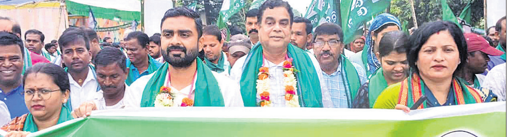
ବିଜେଡିର ଜନସମ୍ପର୍କ ପଦକ୍ଷେପରେ ଉଦ୍ଦେଶ୍ୟ

ବିଜେଡିର ଜନସମ୍ପର୍କ ପଦକ୍ଷେପ ଯୋଗୁଁ ଉପାଧ୍ୟକ୍ଷ ଶ୍ରୀ ପ୍ରଭାକରଙ୍କୁ ଆବଦ୍ଧିତା ଦେବା ପାଇଁ କହିବା ସହିତ ପୂଜା ପ୍ରତିଷ୍ଠାନକୁ ସ୍ୱଚ୍ଛତା ବଜାୟ ରଖିବା ପାଇଁ ଆହ୍ୱାନ ଦେଇଥିଲେ ।