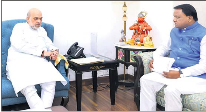
ନୂଆଦିଲ୍ଲୀରେ ସ୍ୱଚ୍ଛ ସାକ୍ଷାତ ଅବସରରେ ସୁରକ୍ଷାମନ୍ତ୍ରୀ ଅମିତ୍ ଶାହାଙ୍କ ସହ ମୁଖ୍ୟମନ୍ତ୍ରୀ ମୋହନ ଚରଣ ମାଝୀ।

ଛତିଶଗଡ଼ରେ ମୁରଖା କର୍ମୀଙ୍କ ଦ୍ୱାରା ବହୁଧରଣର ମାଓବାଦୀ ଦମନକାରୀକଳାପ ଚାଲିଛି ନିକଟରେ ୩୬ ମାଓବାଦୀ ଯୋଗେଇ ଗୁଳିରେ ନିହତ ହୋଇଛନ୍ତି। ତେଣୁ ସେଠାରୁ ଓଡ଼ିଶାକୁ ମାଓବାଦୀଙ୍କ ଅନୁପ୍ରବେଶ ବଢ଼ିବା ଆଶଙ୍କା ରହିଛି। ଏହାସହ ରାଜ୍ୟରେ ୩ ଜିଲ୍ଲା କନ୍ଧମାଳ, ବୌଦ୍ଧ ଓ କଳାହାଣ୍ଡିରେ ମାଓବାଦୀଙ୍କ ପ୍ରଭାବ ରହିଛି। ଏସବୁର ମୁକାବିଲା ପାଇଁ ରାଜ୍ୟ ସରକାର ଓଡ଼ିଶା ସ୍ନେହାଳ ସ୍ତ୍ରୀକର୍ମ ଫୋର୍ସ(ଏସଏସଏସଏଫ)ର ଅତିରିକ୍ତ ୩ ବାଟାଲିୟନ ସୃଷ୍ଟି କରିଛନ୍ତି। ସେମାନଙ୍କୁ ମାଓବାଦୀ ପ୍ରଭାବିତ ଅଞ୍ଚଳରେ ମୁତୟନ କରାଯାଇଛି। ଏଭଳି ସ୍ଥିତିରେ ଓଡ଼ିଶାରୁ କେନ୍ଦ୍ରୀୟ ସୁରକ୍ଷା ବାହିନୀକୁ ପ୍ରତ୍ୟାହାର କରା ନ ଯାଇ ଅଧିକ ୧୨ କମ୍ପାନୀ ସେଣ୍ଟ୍ରାଲ ଆର୍ମିଡ ଫୋର୍ସିସ ଫୋର୍ସ (ସିଏସଏଫ) ଏବଂ ହେଲିକପ୍ଟର ଯୋଗାଇ ଦିଆଯାଉ। କେନ୍ଦ୍ର ସୁରକ୍ଷାମନ୍ତ୍ରୀ ଅମିତ୍ ଶାହାଙ୍କ ଅଧିକାରୀଙ୍କ ସହ ଯୋଗଦାନ ନୂଆଦିଲ୍ଲୀରେ ଅନୁଷ୍ଠିତ ଏକ ଉଚ୍ଚସ୍ତରୀୟ ମାଓବାଦୀ ମୁକାବିଲା ବୈଠକରେ ଯୋଗଦେଇ ମୁଖ୍ୟମନ୍ତ୍ରୀ ମୋହନ ଚରଣ ମାଝୀ ଏଭଳି ଦାବି କରିଛନ୍ତି।