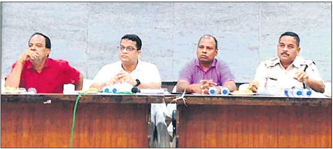
ଢେଙ୍କାନାଳ ପ୍ରସିଦ୍ଧ ଲକ୍ଷ୍ମୀପୂଜା ଉତ୍ସବ ପାଇଁ ବିତରଣ ପ୍ରଣାଳୀ ଉପରେ ଆଧାରଣାମାଳୀ

ଭାର୍ଗବୀୟ ଚଳାଚଳ ବନ୍ଦ ପାଇଁ କଟକ ଓ ଅନୁଗୋଳ ଜିଲ୍ଲାପାଳଙ୍କୁ ପତ୍ର ଦିଆଯିବ