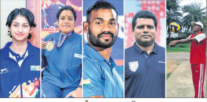
ପୁରସ୍କାର ପାଇଁ ମନୋନୀତ ଖେଳାଳିମାନେ ।

ଭୁବନେଶ୍ୱର, ୮।୧୦ (ପଦ୍ମ ସାହି) ଦୀର୍ଘ ୪ ବର୍ଷର ବ୍ୟବଧାନରେ ଖୋର୍ଦ୍ଧା ଲବ୍ଧ ଅନ କ୍ରୀଡ଼ା ପୁରସ୍କାର ପ୍ରଦାନ ପାଇଁ ନିଷ୍ପତ୍ତି ହୋଇଛି। ଅଲିମ୍ପିଆନ ଡଃ. ଏସିଆନ ରେଗୁରେ ଚିରାୟ