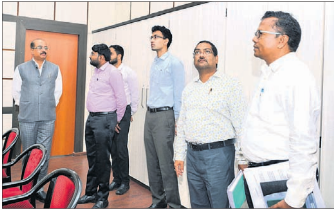
ଉତ୍କଳ ନିର୍ମାଣ ପ୍ରକଳ୍ପର ସମୀକ୍ଷା ପାଇଁ ଭୁବନେଶ୍ୱରରେ ଉପସ୍ଥିତ ଉଚ୍ଚ ଅଫିସରମାନେ।