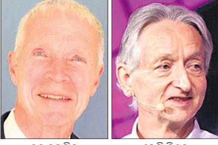
ଜନ୍ ହସ୍ପିଟାଲ୍, ଜେପ୍ଟି ହିଷ୍ଟର୍

ଷ୍ଟକହୋମ, ୮୧୦ ରୟାଲ୍ ବ୍ରିଟିଶ୍ ଏକାଡେମୀ ଅଫ୍ ସାଇନ୍ସ୍ ପକ୍ଷରୁ ମଙ୍ଗଳବାର ପଦାର୍ଥ ବିଜ୍ଞାନ କ୍ଷେତ୍ରରେ ନୋବେଲ ପୁରସ୍କାର ଘୋଷଣା କରିଛି। ଆମେରିକୀୟ ବୈଜ୍ଞାନିକ ଜନ୍ ହସ୍ପିଟାଲ୍ (୯୧) ଓ ବ୍ରିଟିଶ୍ କାନାଡାୟ ବୈଜ୍ଞାନିକ ଜେପ୍ଟି ହିଷ୍ଟର୍ (୭୬)ଙ୍କୁ ମିଳିତ ଭାବେ ଚଳିତ ବର୍ଷର ପଦାର୍ଥ ବିଜ୍ଞାନ କ୍ଷେତ୍ରରେ ନୋବେଲ ପୁରସ୍କାର ପାଇଁ ମନୋନୀତ କରାଯାଇଛି। ମେଣିନ ଲନିଂର୍ ମୂଳତଃ ପକାଇଥିବା ଅବିଷ୍କାର ଓ ଉତ୍ତାପନ କରିବା ପାଇଁ ନୋବେଲ କର୍ମିତ୍ ପକ୍ଷରୁ ଉଭୟଙ୍କ ନାମ ଘୋଷଣା କରାଯାଇଛି। ଉଭୟ ହସ୍ପିଟାଲ୍ ଓ ହିଷ୍ଟର୍ ବିଭିନ୍ନ ପରୀକ୍ଷା କରି ଫୋଟୋ-୨