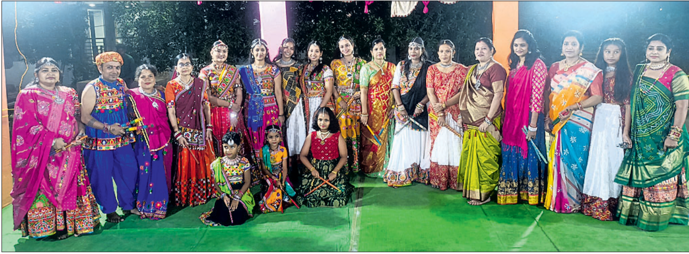
କଳାକାରଙ୍କ ଦ୍ୱାରା ଦାଣ୍ଡିଆ ନୃତ୍ୟ ପରିବେଷଣ।

ଧରଣୀପତ୍ର ପାଇଁ ପ୍ରସ୍ତୁତି ବୈଠକ କୋମନା, ୮୧୦ (ସୋବିନି ଛତ୍ରପା) - ନୂଆପଡ଼ା ଜିଲ୍ଲା କୋମନା ବ୍ଲକ୍ କାନ୍ଦେରା ଧରଣୀପତ୍ର ପାଇଁ ପ୍ରସ୍ତୁତି ବୈଠକ ଅନୁଷ୍ଠିତ ହୋଇଯାଇଛି।