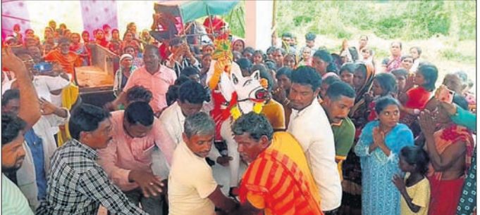
ପ୍ରଭୁ ବୁଢ଼ାଋଜାଙ୍କ ପ୍ରତିମୂର୍ତ୍ତିକୁ ସ୍ଥାପନ କରାଯାଇଛି।

ସ୍ଥାପନ କରାଯାଇଛି। ସମ୍ପାଦକ ବାଘେର ଚୁପୁ ପୂଜାର୍ଚ୍ଚନା କରିଥିଲେ। ଅପରାହ୍ନରେ ଗାଁର ଝାଙ୍କର ଘରୁ ବୁଢ଼ାଋଜାଙ୍କ ପ୍ରତିମୂର୍ତ୍ତିକୁ ମନ୍ଦିରକୁ ନେଇ ସ୍ଥାପନ କରାଯାଇଥିଲା।