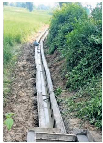
କାଣ୍ଡେଲ - ୨ର ସମ୍ପୂର୍ଣ୍ଣ କାର୍ଯ୍ୟକ୍ରମ କେନାଲ।

ଜଳ ସମ୍ପଦ ବିଭାଗ ସେବାଶଳ ଉନ୍ନୟନ ବିଭାଗର ୬-ଭବାନୀପାଟଣା ପକ୍ଷରୁ କେସିକା ବ୍ଲକ୍ କାଣ୍ଡେଲ ଗ୍ରାମପଞ୍ଚାୟତ କେନାଲ କାଣ୍ଡେଲ-୨ରେ ଚାଷୀଙ୍କ ଜମିକୁ ଜଳସେଚନ ପାଇଁ କେନାଲ କାମ ଲଢ଼ାଯାଉଛି।