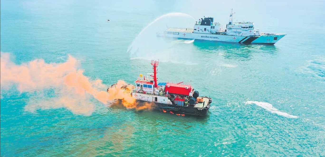
ଓଡ଼ିଶା ବୋର୍ଡଗାର୍ଡ ମୁଖ୍ୟମନ୍ତ୍ରୀ-୭ ପାରାଦୀପ ପକ୍ଷରୁ ମଙ୍ଗଳବାର ସମୁଦ୍ର ଭିତରେ ଶେଡ଼ିଘା ସଂଗ୍ରହ ଓ ଉତ୍ସାର ଅଭ୍ୟାସ କାର୍ଯ୍ୟକ୍ରମ ଆୟୋଜନ କରାଯାଇଛି। ଏଥିରେ ଏନ୍ଟିଆର୍ଏସ୍, କିଲ ପ୍ରଶାସନ, ପାରାଦୀପ ବନ୍ଦର, କଷ୍ଟଗୁ, ନୌସେବା, ମେରାଇନ ଯୋଜିସ, ଓଡ଼ିଶା ଯୋଜିସ, ସିଆଇଏସ୍ଏସ୍, ମସ୍ୟ ବିଭାଗ, ବନ ବିଭାଗ, ସ୍ୱାସ୍ଥ୍ୟ ବିଭାଗ ପ୍ରତିନିଧିମାନେ ସାମିଲ ହୋଇଥିଲେ।