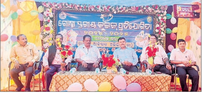
କାର୍ଯ୍ୟକ୍ରମରେ ମଞ୍ଚାସୀନ ଅତିଥିମାନେ।

ଲକ୍ଷ୍ମଣୀପଡ଼ା, ୮୧୦ (ବାଗରପ ଘଣ୍ଟା): ସୁନ୍ଦରଗଡ଼ ଲିମା ଲକ୍ଷ୍ମଣୀପଡ଼ା ବୁକ୍ସରୀୟ କୁଇଜ୍ ପ୍ରତିଯୋଗିତା ପ୍ରଥମ ସରକାରୀ ଉଚ୍ଚ ବିଦ୍ୟାଳୟରେ ରାଷ୍ଟ୍ରୀୟ ଅଭିଯାନ (ରା) ପକ୍ଷରୁ ବୁକ୍ସରୀୟ କୁଇଜ୍ ପ୍ରତିଯୋଗିତା ମଙ୍ଗଳବାର ଗୋଷ୍ଠୀ ଶିକ୍ଷା ବିଭାଗ ପକ୍ଷରୁ ରାଷ୍ଟ୍ରୀୟ ଆଦିଷ୍ଟର ଅଭିଯାନ କାର୍ଯ୍ୟକ୍ରମ ମାଧ୍ୟମରେ ଅନୁଷ୍ଠିତ ହୋଇଯାଇଛି।