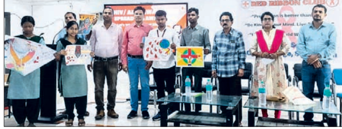
ଏଡ୍ସ ସଚେତନତା କାର୍ଯ୍ୟକ୍ରମରେ ଅଧ୍ୟାପକ, ଅଧ୍ୟାପକଙ୍କ ସହ ଛାତ୍ରୀ।

ସୁନ୍ଦରଗଡ଼, ୮୧୦ (କନ୍ୟା ନାରାୟଣ ମେଡିକାଲ): ସୁନ୍ଦରଗଡ଼ ସରକାରୀ ଉଚ୍ଚ ମାଧ୍ୟମିକ ବିଦ୍ୟାଳୟ ଓ ମହାବିଦ୍ୟାଳୟରେ ମଙ୍ଗଳବାର ଏଡ୍ସ ସଚେତନତା କାର୍ଯ୍ୟକ୍ରମ ଅନୁଷ୍ଠିତ ହୋଇଯାଇଛି।