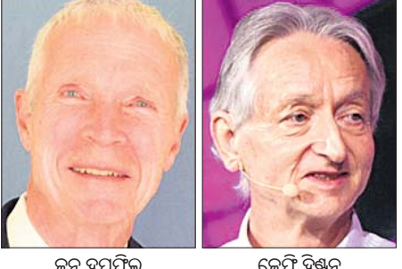
ଜନ୍ ହପ୍‌ପିଲ୍ସ୍, ଜେପ୍ଟି ହିଷ୍ଟରୀ

ଷ୍ଟକହୋମ୍, ୮୧୦ ଉତ୍ତମପୁର ବୃକ୍ଷା ଏକାଡେମୀ ଅଫ୍ ସାଇନ୍ସ୍ ପକ୍ଷରୁ ମଙ୍ଗଳବାର ପଦାର୍ଥ ବିଜ୍ଞାନ କ୍ଷେତ୍ରରେ ନୋବେଲ ପୁରସ୍କାର ଘୋଷଣା କରାଯାଇଛି। ଆମେରିକୀୟ ବୈଜ୍ଞାନିକ ଜନ୍ ହପ୍‌ପିଲ୍ସ୍(୯୧) ଓ ବ୍ରିଟିଶ୍ କାନାଡୀୟ ବୈଜ୍ଞାନିକ ଜେପ୍ଟି ହିଷ୍ଟରୀ(୭୬)ଙ୍କୁ ମିଳିତ ଭାବେ ଚଳିତ ବର୍ଷର ପଦାର୍ଥ ବିଜ୍ଞାନ କ୍ଷେତ୍ରରେ ନୋବେଲ ପୁରସ୍କାର ପାଇଁ ମନୋନୀତ କରାଯାଇଛି। ମେରିନ ଲର୍ନର ମୂଳତଥ୍ୟ ପକାଇଥିବା ଆବିଷ୍କାର ଓ ଉଦ୍ଧାର କରିବା ପାଇଁ ନୋବେଲ କମିଟି ପକ୍ଷରୁ ଉଭୟଙ୍କ ନାମ ଘୋଷଣା କରାଯାଇଛି। ଉଭୟ ହପ୍‌ପିଲ୍ସ୍ ଓ ହିଷ୍ଟରୀ ପରୀକ୍ଷା କରି ଫ୍ଲେପ୍‌ସ୍‌-୨