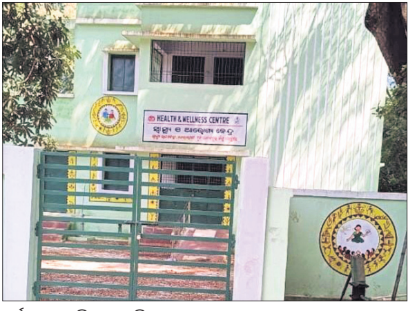
ଦୁର୍ଘଟଣା ଘଟିଲେ ଏହି ସ୍ୱାସ୍ଥ୍ୟ ଉପକେନ୍ଦ୍ର ଉପରେ ଭରସା କରିଥାନ୍ତି ।

କେନ୍ଦୁଝର ଜିଲ୍ଲା ଆନନ୍ଦପୁର ବ୍ଲକ ବେଳାହାଣ୍ଡି ଗ୍ରାମରେ ଥିବା ସ୍ୱାସ୍ଥ୍ୟ ଓ ଆରୋଗ୍ୟ କେନ୍ଦ୍ର ଦୀର୍ଘ ୧୫ଦିନ ହେବ ବନ୍ଦ ରହିଛି ।