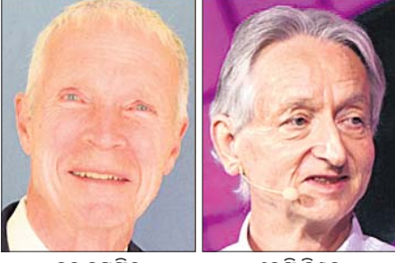
ଜନ୍ ହସ୍‌ପିଟାଲ୍, ଜେପ୍ଟି ହିଷ୍ଟିନ୍

ଷ୍ଟକହୋମ୍, ୮୧୦ ରୟାଲ୍ ସ୍ୱିଡିଶ୍ ଏକାଡେମୀ ଅଫ୍ ସାଇନ୍ସ୍ ପକ୍ଷରୁ ମଙ୍ଗଳବାର ପଦାର୍ଥ ବିଜ୍ଞାନ କ୍ଷେତ୍ରରେ ନୋବେଲ ପୁରସ୍କାର ଘୋଷଣା କରାଯିବ। ଆମେରିକୀୟ ବୈଜ୍ଞାନିକ ଜନ୍ ହସ୍‌ପିଟାଲ୍ (୯୧) ଓ ବ୍ରିଟିଶ୍ କାନାଡୀୟ ବୈଜ୍ଞାନିକ ଜେପ୍ଟି ହିଷ୍ଟିନ୍ (୭୭)ଙ୍କୁ ମିଳିତ ଭାବେ ଚଳିତ ବର୍ଷର ପଦାର୍ଥ ବିଜ୍ଞାନ କ୍ଷେତ୍ରରେ ନୋବେଲ ପୁରସ୍କାର ପାଇଁ ମନୋନୀତ କରାଯାଇଛି। ମେଡିନ ଲନିଂର ମୂଳତଥ୍ୟ ପକାଇଥିବା ଆବିଷ୍କାର ଓ ଉଦ୍ଭାବନ କରିବା ପାଇଁ ନୋବେଲ କମିଟି ପକ୍ଷରୁ ଉଭୟଙ୍କ ନାମ ଘୋଷଣା କରାଯାଇଛି। ଉଭୟ ହସ୍‌ପିଟାଲ୍ ଓ ହିଷ୍ଟିନ୍ ବିଭିନ୍ନ ପରୀକ୍ଷା କରି ଫ୍ଲୋ ପୃଷ୍ଠା-୨