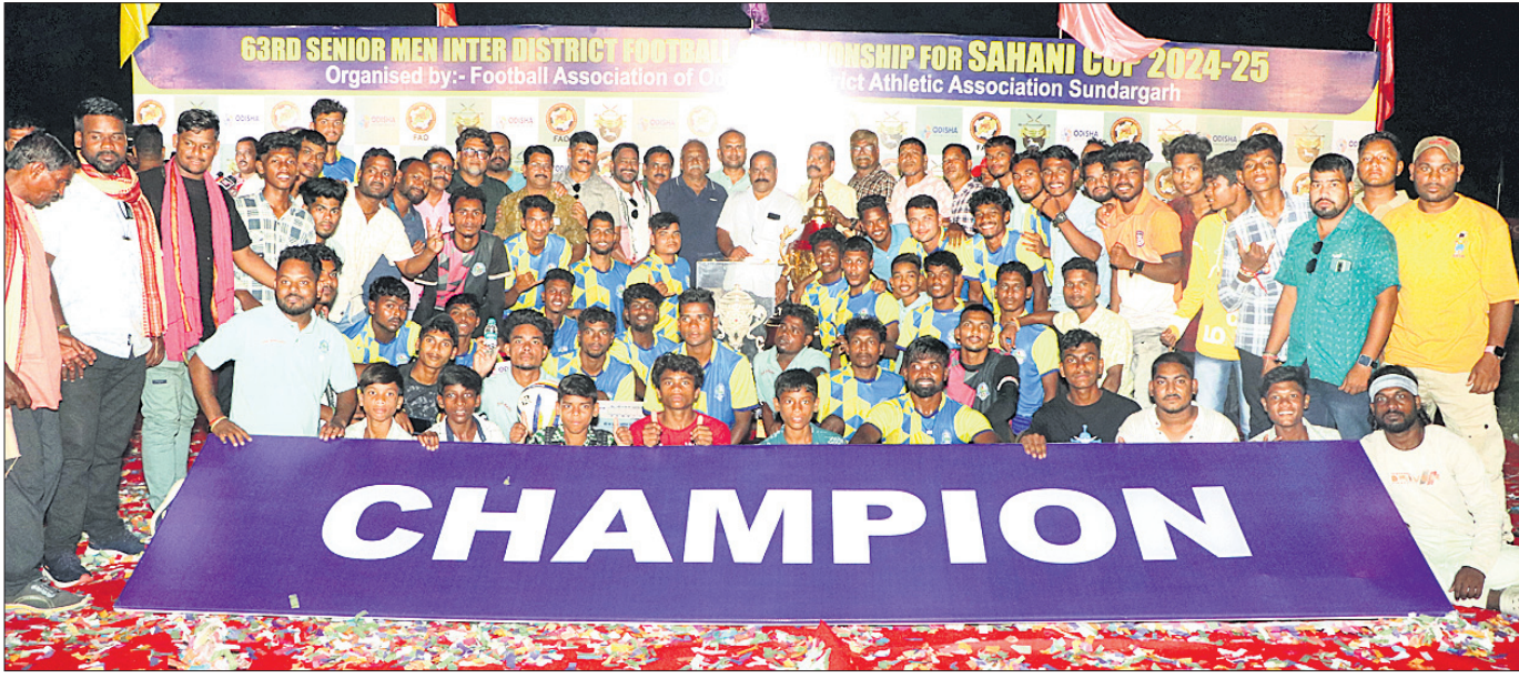
ଅତିଥିଙ୍କ ଗହଣରେ ସାହାଣୀ କପ୍ ଫୁଟବଲ୍ ଚାମ୍ପିୟନ ବରଗଡ଼ ଦଳ ।