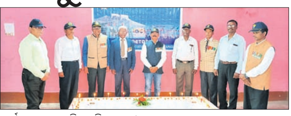
କାର୍ଯ୍ୟକ୍ରମରେ ଉପସ୍ଥିତ ଅତିଥିମାନେ ।