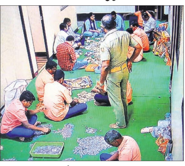
ହୁଣ୍ଡି ଖୋଲାଯାଇ ଗଣତି କାର୍ଯ୍ୟ ଚାଲିଛି ।