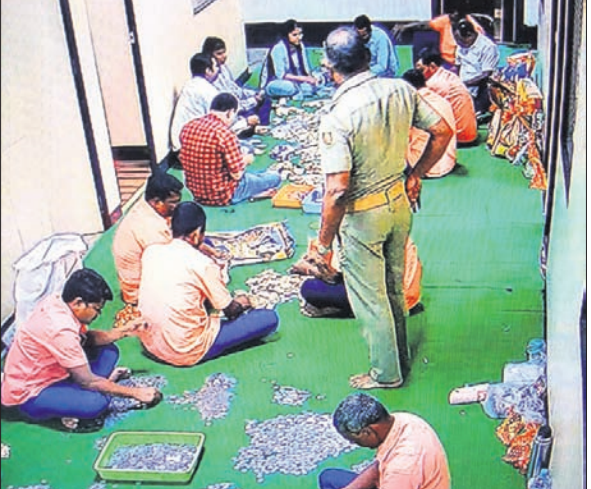
ହୁଣ୍ଡି ଖୋଲାଯାଇ ଗଣତି କାର୍ଯ୍ୟ ଚାଲିଛି ।