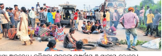
ରାତ୍ରୀ ଅବରୋଧ କରିଥିବା ମୃତକଙ୍କ ସମ୍ପର୍କୀୟ ଓ ସ୍ଥାନୀୟ ଲୋକେ ।