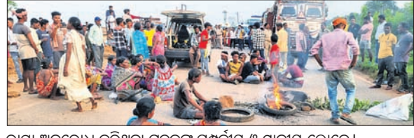
ରାସ୍ତା ଅବରୋଧ କରିଥିବା ମୃତକଙ୍କ ସମ୍ପର୍କୀୟ ଓ ସ୍ଥାନୀୟ ଲୋକ ।

ଦୁର୍ଘଟଣା ଘଟିଲେ ଏହି ସ୍ୱାସ୍ଥ୍ୟ ଉପକେନ୍ଦ୍ର ଉପରେ ଭରସା କରିଥାନ୍ତି ।