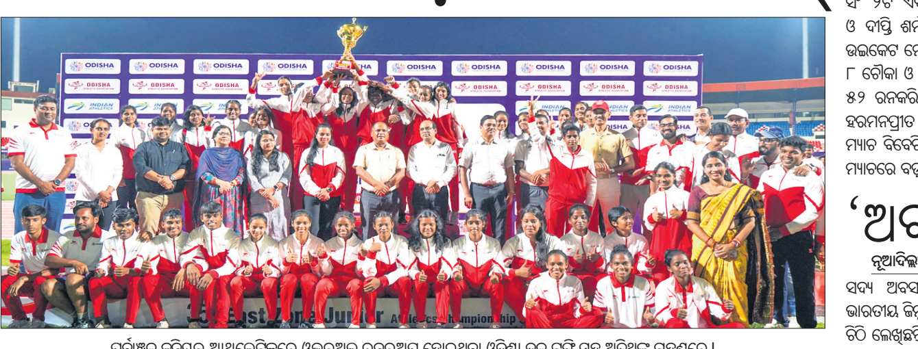
ପୂର୍ବାଞ୍ଚଳ କୁନିୟର ଆଥଲେଟିକ୍ସରେ ଓଭରଥଲ୍‌ ରନରଥ ହୋଇଥିବା ଓଡ଼ିଶା ଦଳ ଟ୍ରଫି ସହ ଅତିଥିକ ଗହଣରେ।

ଭୁବନେଶ୍ୱର, ୧୧୧୦ (ତପନ ସାଲ୍) କଳିଙ୍ଗ ଷ୍ଟାଡ଼ିୟମ୍‌ରେ ୩୫ତମ ଇଣ୍ଡୋନେସିଆନ୍ ଚାମ୍ପିୟନଶିପ୍‌ରୁ ରୁଧିବାର ଉନ୍ନୟାପିତ ହୋଇଛି। ୨୫୫ ବାବଦ ସହ ପଶ୍ଚିମବଙ୍ଗ ଓଭରଥଲ୍‌ ଚାମ୍ପିୟନ ଏବଂ ୨୯୯ ପଏଣ୍ଟ ସହିତ ଓଡ଼ିଶା ରନରଥ ହୋଇଛି। ୧୨୬ ପଏଣ୍ଟ ସହିତ ଓଡ଼ିଶା ପୁରୁଷ ବର୍ଗରେ ଓଭରଥଲ୍‌ ଚାମ୍ପିୟନ୍ ହୋଇଥିବା ବେଳେ ପଶ୍ଚିମବଙ୍ଗ ୧୦୨ ପଏଣ୍ଟ ସହ ଦ୍ୱିତୀୟ ସ୍ଥାନରେ ରହିଛି। ଅନ୍ୟପକ୍ଷରେ ପଶ୍ଚିମବଙ୍ଗ ଓଭରଥଲ୍‌ ଚାମ୍ପିୟନ୍ ହୋଇଛି ଏବଂ ଓଡ଼ିଶା ୯୩ ପଏଣ୍ଟ ସହ ଦ୍ୱିତୀୟ ସ୍ଥାନ ହାସଲ