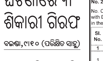
ବଜରା, ୯।୧୦ (ପରିକ୍ଷିତ ସାହୁ)

ଅନୁଗୋଳ ଜିଲ୍ଲା ଆଠମଲିକ ବନଖଣ୍ଡ ଧଣ୍ଡାଡୋପା ରେଖା ଶିକାରୀ ଫରେଷ୍ଟ ବିଲ୍ ନିକଟ ବିଲରେ ବାରହା ଶିକାରୀ ପାଇଁ ବସାଯାଇଥିବା ବିଦ୍ୟୁତ୍ ଫାଶରେ ପଡ଼ି ଏକ ଦକ୍ଷାହୀନ ହାତୀ ମୃତ୍ୟୁ ଘଟଣାରେ ୩ ଶିକାରୀ ଗିରଫ ହୋଇଛନ୍ତି।