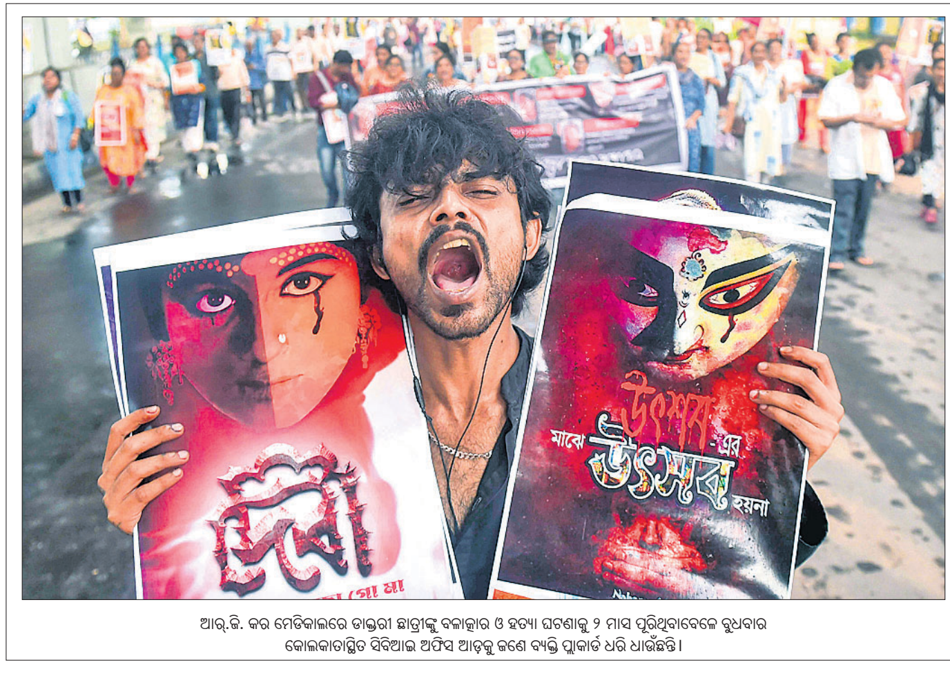
ଆର୍.ଜି. କର ମେଡିକାଲରେ ଚାକରୀ ଛାତ୍ରୀଙ୍କୁ ବଳାହାର ଓ ହତ୍ୟା ଘଟଣାକୁ ୨ ମାସ ପୂରିଥିବାବେଳେ ରୁଧିରର କୋଲକାତାସ୍ଥିତ ସିବିଆଇ ଅଫିସ୍ ଆଡ଼କୁ ଜଣେ ବ୍ୟକ୍ତି ପୁଲକାଟ ଧରି ଯାଇଛନ୍ତି।