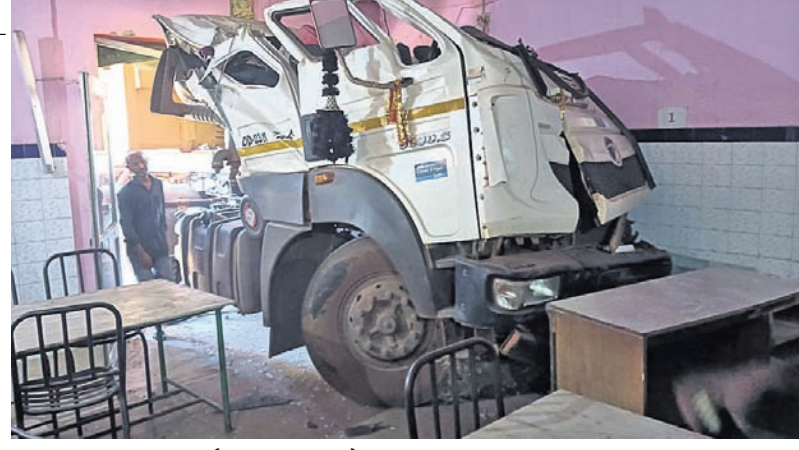
ଭେଙ୍ଗାଳାଳ, ୯।୧୦ (ରତନ ନାୟାର) ଭେଙ୍ଗାଳାଳ ସହର ୫୫ନଂ ଜାତୀୟ ରାଜପଥର ମହିଷାପାତ ଛକଠାରେ ବୁଧବାର

ରାସ୍ତା କଡ଼ରେ ଥିବା ଏକ ହୋଟେଲ ଭିତରକୁ ପଶିଯାଇଥିଲା। ଏଥିରେ ୫ଜଣ ଆହତ ହୋଇଛନ୍ତି। ଦୁର୍ଘଟଣାରେ କାର୍ତ୍ତିରାସ୍ତା ଉପରେ ଓଲଟି ପଡ଼ିଥିଲା। ଏକ ଦାଣ୍ଡିଆ କାର୍ଯ୍ୟକ୍ରମରେ ଯୋଗଦେବା ପାଇଁ ଏକ କାର୍ରେରେ ୫ଜଣ କଳାକାର କଟକକୁ ଚାଳନେ ଯାଉଥିଲେ। ଆହତମାନଙ୍କୁ ଜିଲା ମୁଖ୍ୟ ଚିକିତ୍ସାଳୟରେ ଭର୍ତ୍ତି କରାଯାଇଥିଲା। ଦୁର୍ଘଟଣା ପରେ ଟ୍ରେଲରଟି ହୋଟେଲ ଭିତରେ ପଶିଯିବାରୁ ସେଠାରେ ଖାଇବାକୁ ବସିଥିବା ଲୋକମାନେ ଜୀବନ ବିକଳରେ ଦୋହାଁ ପଳାଇଥିଲେ। ଘଟଣାସ୍ଥଳରେ କିଛି ସମୟ ପାଇଁ ଉଭେଜନା ପ୍ରକାଶ ପାଇଥିଲା। ଖବରପାଇ ଚାଉଳ ଥାନା ପୋଲିସ ପହଞ୍ଚି ତଦନ୍ତ ଆରମ୍ଭ କରିଥିଲା। ବହୁ ସମୟ ଧରି ଜାତୀୟ ରାଜପଥରେ ଯାନବାହାନ ଚଳାଚଳ ବ୍ୟାହତ ହୋଇଥିଲା।