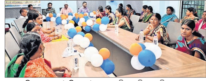
ଛେଡ଼ିପଦା, ୯।୧୦ (ଅଜିତ ଧଳ)

ଆହୁରି ଦେଖିଲେ। ଏହି ଅବଦାନରେ ଗ୍ରାମବାସୀଙ୍କୁ ୨୧ଟି ସମସ୍ୟାର ସମାଧାନ ପାଇଁ ଭବିଷ୍ୟତ ପଦକ୍ଷେପ ନିଆଯିବ ବୋଲି ପ୍ରକାଶ କରିଥିଲେ। ବିଭାଗ ବେହେରା ରାମ୍ଭା ସରକାରଙ୍କ ବିଜ୍ଞାନ ଜନ କଲ୍ୟାଣ ଯୋଜନା ସମ୍ପର୍କରେ ଜନସାଧାରଣଙ୍କୁ ଅବଗତ କରିଥିଲେ।