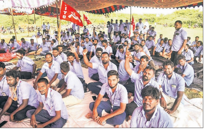
ଚେନ୍ନାଇରେ ବିଭିନ୍ନ ଦାବି ନେଇ ସାମ୍ବଲ ଇସିଆର କର୍ମଚାରୀମାନେ ଧାରଣାରେ ବସିଛନ୍ତି। ଯୁନିୟନ ମାନ୍ୟତା ମିଳିବା ଦାବି ପୂରଣ ନ ହେଲା ଯାଏ ଧର୍ମଘଟ ଜାରି ରହିବ ବୋଲି ଆନ୍ଦୋଳନରତ କର୍ମଚାରୀ କମ୍ପାନୀକୁ ଚେତାଇଛନ୍ତି। ଚେନ୍ନାଇସ୍ଥିତ

ଚେନ୍ନାଇ ସ୍ଥିତ ସାମ୍ବଲ ଇଲେକ୍ଟ୍ରୋନିକ୍ସ କାରଖାନାର ୧ ହଜାରରୁ ଅଧିକ କର୍ମଚାରୀ ଦରମା ବୃଦ୍ଧି ଓ ଯୁନିୟନ ମାନ୍ୟତା ଦାବି ନେଇ ଗତ ସେପ୍ଟେମ୍ବର ୯ରୁ ଧର୍ମଘଟ କରି ଆସୁଛନ୍ତି। ରୁଧିରର ଏହି ଧାରଣାରେ କର୍ମଚାରୀମାନେ କମ୍ପାନୀ ପକ୍ଷରୁ ଦିଆଯାଇଥିବା ସମାଧାନ ଅଫରକୁ ପ୍ରତ୍ୟାଖାନ କରିଛନ୍ତି। ଆସନ୍ତା ମାସ ପର୍ଯ୍ୟନ୍ତ ଧାରଣାରେ ବସିଥିବା କର୍ମଚାରୀଙ୍କ ମାସିକ ଦରମା ୫ ହଜାର ଟଙ୍କା ପର୍ଯ୍ୟନ୍ତ ବୃଦ୍ଧି କରିବାକୁ ପଠାଯାଇ ସେଠାରୁ ସୁରକ୍ଷିତ ଭାବେ ପ୍ରତ୍ୟାଖାନ କରାଯାଇଛି। ତେବେ ଏହି ଅଫରକୁ ଆନ୍ଦୋଳନରତ କର୍ମଚାରୀମାନେ ପ୍ରତ୍ୟାଖାନ କରିଛନ୍ତି।