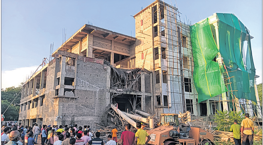
ମହିଷାପାତ ଛକ ନିକଟରେ ନିର୍ମାଣାଧୀନ ହୋଟେଲ।

ଭୁବନେଶ୍ୱର, ୯।୧୦ (ପୁନିଃ ମିଶ୍ର) ରାଜ୍ୟ ସରକାରଙ୍କ ବିଭିନ୍ନ ଉଦ୍ୟୋଗରେ କାର୍ଯ୍ୟରତ କର୍ମଚାରୀମାନଙ୍କ ମହଙ୍ଗା ଭଡା ପରିମାଣ ୪୬%ରୁ ୫୦%କୁ ବୃଦ୍ଧି କରାଯାଇଛି। ଏହି ବର୍ଦ୍ଧିତ ମହଙ୍ଗା ଭଡା ପିଛଲା ଭାବେ ୨୦୨୪ ଜାନୁଆରୀ ପହିଲାରୁ ଲାଗୁ ହେବ। ସାଧାରଣ ନିର୍ବାଚନକୁ ଦୃଷ୍ଟିରେ ରଖି ତତ୍କାଳୀନ ବିଜେଡି ସରକାର ଗତ ମାର୍ଚ୍ଚ ୧୪ ତାରିଖରେ ରାଜ୍ୟ ସରକାରୀ କର୍ମଚାରୀମାନଙ୍କ ମହଙ୍ଗା ଭଡାକୁ ୪୬%ରୁ ୫୦%କୁ ବୃଦ୍ଧି କରିଥିଲେ। ସାଧାରଣ ଉଦ୍ୟୋଗ ବିଭାଗ ପକ୍ଷରୁ ରୁଧିରୀ ଭାବେ ବିଜେପି ଅନୁଯାୟୀ, ରାଜ୍ୟ ସରକାରୀ ଉଦ୍ୟୋଗ କର୍ମଚାରୀମାନଙ୍କ ପାଇଁ ୨୦୧୭ ଦରମା ହାର ଆଧାରରେ ମହଙ୍ଗା ଭଡା ପରିମାଣକୁ ୪୬%ରୁ ୫୦%କୁ ବୃଦ୍ଧି କରାଯାଇଛି, ଯାହା ୨୦୨୪ ଜାନୁଆରୀ ୧ରୁ ପିଛଲା ଭାବେ ଲାଗୁ ହେବ। ତେବେ ଏହି ବର୍ଦ୍ଧିତ ମହଙ୍ଗା ଭଡା ରାଜ୍ୟ ଉଦ୍ୟୋଗରେ କାର୍ଯ୍ୟରତ ଯୋଗ୍ୟ କର୍ମଚାରୀଙ୍କୁ ହିଁ ମିଳିବ। ସେଥିପାଇଁ ସାଧାରଣ ଉଦ୍ୟୋଗ ବିଭାଗ ମୋଟ ୯ଟି ସର୍ତ୍ତ ରଖିଛି। ଏହି ସର୍ତ୍ତ ପୂରଣ କରୁଥିବା ରାଜ୍ୟ ସରକାରଙ୍କ ଉଦ୍ୟୋଗଗୁଡ଼ିକ ନିଜ କର୍ମଚାରୀମାନଙ୍କୁ ବର୍ଦ୍ଧିତ ମହଙ୍ଗା ଭଡା ନିକ ପାଣ୍ଟିକୁ ଦେଇପାରିବେ। ଏଥିପାଇଁ ରାଜ୍ୟ ସରକାର କୌଣସି ଆର୍ଥିକ ସହାୟତା ଦେବେ ନାହିଁ। ଯେଉଁ ୯ଟି ସର୍ତ୍ତ ରଖାଯାଇଛି ସେଥିରେ ୨୦୨୩-୨୪ ଆର୍ଥିକ ବର୍ଷ ପାଇଁ ସମ୍ପୂର୍ଣ୍ଣ ସରକାରୀ ଉଦ୍ୟୋଗ ବିଧାନିକ ଅତିବିଶେଷ କରିଥିବା ଜରୁରୀ। ଏହି ଉଦ୍ୟୋଗ ସରକାର, ବ୍ୟାଙ୍କ ଓ ଆର୍ଥିକ ସଂସ୍ଥା ରଖି ପରିଶୋଧରେ ଖୁଲାସ କରି ନ ଥିବା ଆବଶ୍ୟକ। କର୍ମଚାରୀମାନଙ୍କ ଇତିପଦ ଓ ଇସ୍ତଫା ପାଣ୍ଟି ଦାଖଲରେ ମଧ୍ୟ ଖୁଲାସ ହୋଇ ନ ଥିବା ଦରକାର। ଏହାଛଡ଼ା କେବଳ ଲାଭରେ ଚାଲୁଥିବା ଉଦ୍ୟୋଗଗୁଡ଼ିକ ନିଜ କର୍ମଚାରୀଙ୍କୁ ମହଙ୍ଗା ଭଡା ଦେଇପାରିବେ ବୋଲି ଉଲ୍ଲେଖ କରାଯାଇଛି।