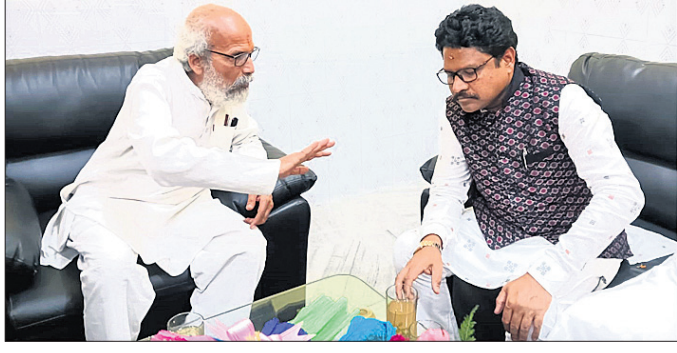
ସ୍ୱାସ୍ଥ୍ୟମନ୍ତ୍ରୀଙ୍କ ସହ ଆଲୋଚନାରେ ଏମ୍ପି।