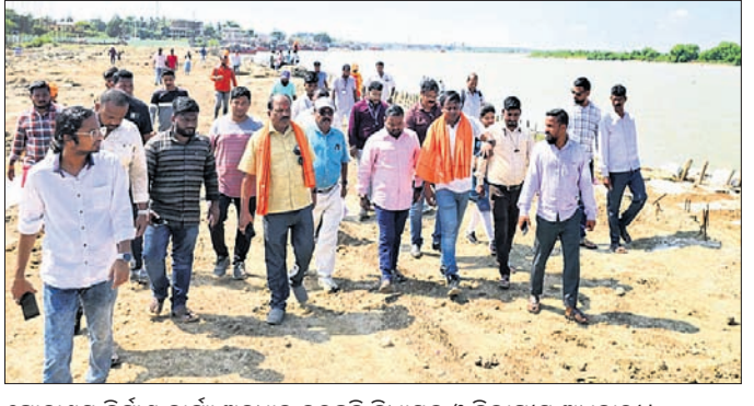
ପୋଡ଼ାଗ୍ରାମ୍ୟ ନିର୍ମାଣ କାର୍ଯ୍ୟ ଅନୁଧ୍ୟାନ କରୁଛନ୍ତି ବିଧାୟକ ଓ ବିଭାଗୀୟ ଅଧିକାରୀ।