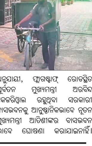
ଅନୁଯାୟୀ, ଫ୍ଲୋରସ୍ତାଟ୍ ରୋଡସ୍ଥିତ ପୂର୍ବତନ ମୁଖ୍ୟମନ୍ତ୍ରୀ ଅରବିନ୍ଦ କେଜ୍ରିୱାଲ ରହୁଥିବା ସରକାରୀ ବାସଭବନକୁ ଆନ୍ତଃସ୍ଥାନିକଭାବେ ନୂତନ ମୁଖ୍ୟମନ୍ତ୍ରୀ ଆତିଶୀଙ୍କର ବାସଭବନ ଭାବେ ଘୋଷଣା କରାଯାଇନାହିଁ।