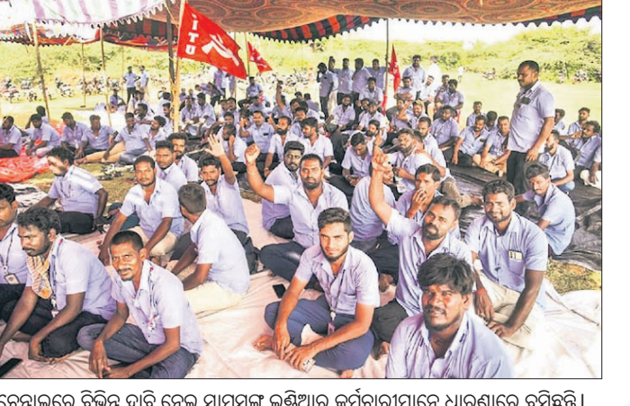
ଚେନ୍ନାଇରେ ବିଭିନ୍ନ ଦାବି ନେଇ ସାମ୍ବଲ ଇଣ୍ଡିଆ କର୍ମଚାରୀମାନେ ଧାରଣାରେ ବସିଛନ୍ତି। ୟୁନିୟନ ମାମ୍ୟତା ନିକିବା ଦାବି ପୂରଣ ନ ହେଲା ଯାଏ ଧର୍ମଘଟ ଜାରି ରହିବ ବୋଲି ଆନ୍ଦୋଳନରତ କର୍ମଚାରୀ କମ୍ପାନୀକୁ ଚେତାଇଛନ୍ତି। ଚେନ୍ନାଇସ୍ଥିତ

ଚେନ୍ନାଇ ସ୍ଥିତ ସାମ୍ବଲ ଇଲେକ୍ଟ୍ରୋନିକ୍ସ କାରଖାନାର ୧ ହଜାରରୁ ଅଧିକ କର୍ମଚାରୀ ଦରମା ବୃଦ୍ଧି ଓ ୟୁନିୟନ ନାମ୍ୟତା ଦାବି ଗତ ସେପ୍ଟେମ୍ବର ୯ରୁ ଧର୍ମଘଟ କରି ଆସୁଛନ୍ତି। ରୁସ୍‌ବାର ଏହି ଧାରଣାରେ କର୍ମଚାରୀମାନେ କମ୍ପାନୀ ଅଫରକୁ ପ୍ରତ୍ୟାଖାନ କରନ୍ତୁ। ଆସନ୍ତା ମାସ ପର୍ଯ୍ୟନ୍ତ ଧାରଣାରେ ବସିଥିବା କର୍ମଚାରୀଙ୍କ ମାସିକ ୫ ହଜାର ଟଙ୍କା ପର୍ଯ୍ୟନ୍ତ ବୃଦ୍ଧି କରିବାକୁ ସାମ୍ବଲ ଇଣ୍ଡିଆ ପ୍ରସ୍ତାବ ଦେଇଥିଲା। ତେବେ ଏହି ଅଫରକୁ ଆନ୍ଦୋଳନରତ କର୍ମଚାରୀମାନେ ପ୍ରତ୍ୟାଖାନ କରିଛନ୍ତି।