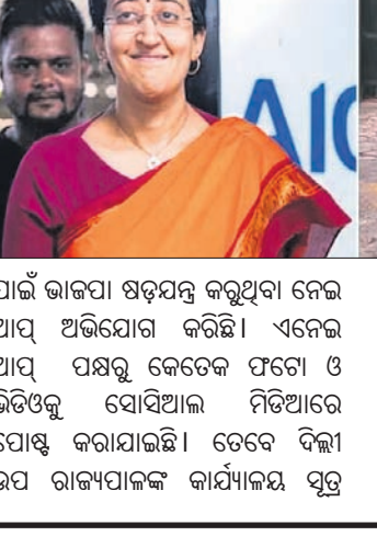
ପାଇଁ ଭାଜପା ଷଡ଼ଯନ୍ତ୍ର କରୁଥିବା ନେଇ ଆପ୍ ଅଭିଯୋଗ କରିଛି। ଏନେଇ ଆପ୍ ପକ୍ଷରୁ କେତେକ ଫଟୋ ଓ ଭିଡିଓକୁ ସୋସିଆଲ ମିଡିଆରେ ପୋଷ୍ଟ କରାଯାଇଛି। ତେବେ ଦିଲ୍ଲୀ ଉପ ରାଜ୍ୟପାଳଙ୍କ କାର୍ଯ୍ୟକାଳ ସ୍ୱତ୍ୱ

ଦିଲ୍ଲୀ ଉପ ରାଜ୍ୟପାଳ ଭି.କେ. ସଙ୍କେତାଙ୍କ ନିର୍ଦ୍ଦେଶରେ ମୁଖ୍ୟମନ୍ତ୍ରୀ ଆତିଶୀଙ୍କର ଆସବାବପତ୍ରକୁ ସିଲିଲ ଲାଗିବାରୁ ଫ୍ଲୋରସ୍ତାଟ୍ ରୋଡସ୍ଥିତ ମୁଖ୍ୟମନ୍ତ୍ରୀଙ୍କ ସରକାରୀ ନିବାସକୁ ଫିଙ୍ଗାଯାଇଥିବା ନେଇ ରୁସ୍‌ବାର ଆମ୍ ଆଦମୀ ପାର୍ଟି(ଆପ)ପକ୍ଷରୁ ଅଭିଯୋଗ କରାଯାଇଛି। ଦିଲ୍ଲୀ ମୁଖ୍ୟମନ୍ତ୍ରୀଙ୍କ ସରକାରୀ ବାସଭବନକୁ କନ୍ଦା କରିବା