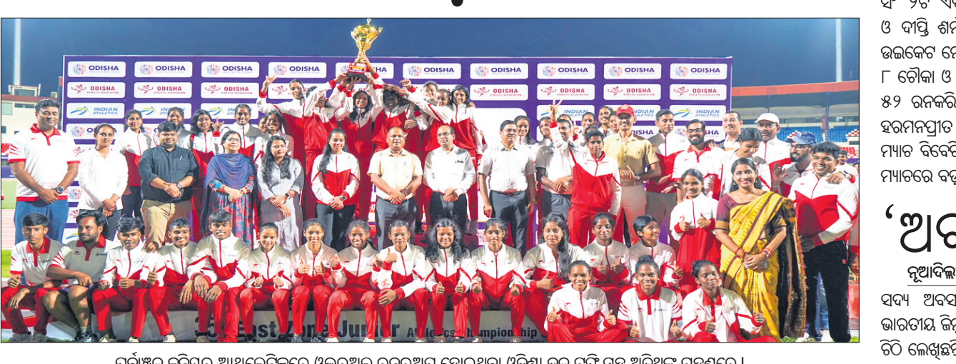
ପୂର୍ବାଞ୍ଚଳ କୁନିୟର ଆଥଲେଟିକ୍ସରେ ଓଭରଥଲ୍ ରନରଥ ହୋଇଥିବା ଓଡ଼ିଶା ଦଳ ଟ୍ରଫି ସହ ଅତିଥିକ୍ ଗହଣରେ।

ଭୁବନେଶ୍ୱର, ୧୧୧୦ (ତପନ ସାଲ୍) କଳିଙ୍ଗ ଷ୍ଟାଡିୟମ୍‌ରେ ୩୫ତମ ଇଣ୍ଡୋନେସିଆନ୍ କୁନିୟର ଆଥଲେଟିକ୍ସ ଚାମ୍ପିୟନଶିପ୍‌ରୁ ରୁଧିର ଅନୁଷ୍ଠିତ ହୋଇଛି। ୨୫୫ ବାବଦ ସହ ପଶ୍ଚିମବଙ୍ଗ ଓଭରଥଲ୍ ଚାମ୍ପିୟନ ଏବଂ ୨୧୯ ପଏଣ୍ଟ ସହିତ ଓଡ଼ିଶା ରନରଥ ହୋଇଛି। ୧୨୬ ପଏଣ୍ଟ ସହିତ ଓଡ଼ିଶା ପୁରୁଷ ବର୍ଗରେ ଓଭରଥଲ୍ ଚାମ୍ପିୟନ୍ ହୋଇଥିବା ବେଳେ ପଶ୍ଚିମବଙ୍ଗ ୧୦୨ ପଏଣ୍ଟ ସହ ଦ୍ୱିତୀୟ ସ୍ଥାନରେ ରହିଛି। ଅନ୍ୟପକ୍ଷରେ ପଶ୍ଚିମବଙ୍ଗ ଓଭରଥଲ୍ ଚାମ୍ପିୟନ୍ ହୋଇଛି ଏବଂ ଓଡ଼ିଶା ୯୩ ପଏଣ୍ଟ ସହ ଦ୍ୱିତୀୟ ସ୍ଥାନ ହାସଲ