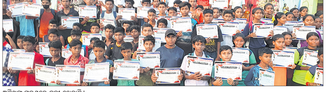
ଅତିଥିକ ଗହଣରେ କୃତୀ ଖେଳାଳି।