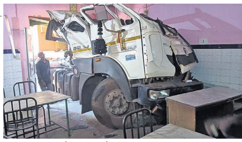
ତେଜାନାଳ, ୯।୧୦ (ରତନ ନାୟର) ତେଜାନାଳ ସହର ୫୫ନଂ ଜାତୀୟ ରାଜପଥର ମହିଷାପାଟ ଛକରେ ବୁଧବାର

ରାସ୍ତା କଡ଼ରେ ଥିବା ଏକ ହୋଟେଲ ଭିତରକୁ ପଶିଯାଇଥିଲା। ଏଥିରେ ୫ଜଣ ଆହତ ହୋଇଛନ୍ତି। ଦୁର୍ଘଟଣାରେ କାର୍ତ୍ତିରାସ୍ତା ଉପରେ ଓଲଟି ପଡ଼ିଥିଲା। ଏକ ଦାଣ୍ଡିଆ କାର୍ଯ୍ୟକ୍ରମରେ ଯୋଗଦେବା ପାଇଁ ଏକ କାର୍ରେ ୫ଜଣ କଳାକାର କଟକରୁ ଚାଳକରେ ଯାଉଥିଲେ। ଆହତମାନଙ୍କୁ ଜିଲ୍ଲା ମୁଖ୍ୟ ଚିକିତ୍ସାଳୟରେ ଭର୍ତ୍ତି କରାଯାଇଥିଲା। ଦୁର୍ଘଟଣା ପରେ ଟ୍ରେଲରଟି ହୋଟେଲ ଭିତରେ ପଶିଯିବାରୁ ସେଠାରେ ଖାଇବାକୁ ବସିଥିବା ଲୋକମାନେ ଜୀବନ ବିକଳରେ ଦୋହାଁ ପଳାଇଥିଲେ। ଘଟଣାସ୍ଥଳରେ କିଛି ସମୟ ପାଇଁ ଉଭେଜନା ପ୍ରକାଶ ପାଇଥିଲା। ଖବରପାଇ ଚାଉଳ ଥାନା ପୋଲିସ୍ ପହଞ୍ଚି ତଦନ୍ତ ଆରମ୍ଭ କରିଥିଲା। ବହୁ ସମୟ ଧରି ଜାତୀୟ ରାଜପଥରେ ଯାନବାହାନ ଚଳାଚଳ ବ୍ୟାହତ ହୋଇଥିଲା।