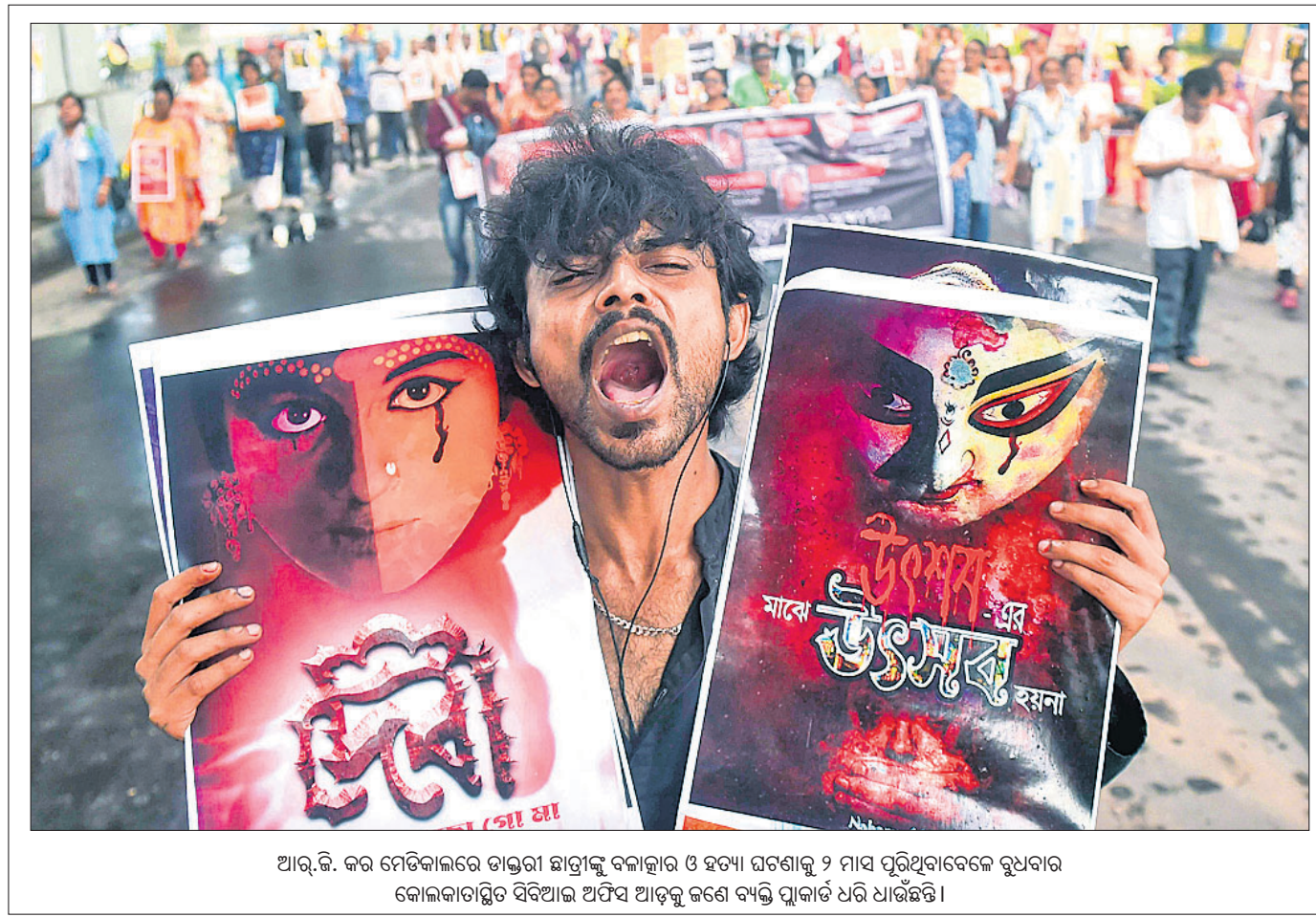
ଆର୍.ଜି. କର ମେଡିକାଲରେ ଚାନ୍ଦ୍ରା ଛାତ୍ରୀଙ୍କୁ ବଳାହାର ଓ ହତ୍ୟା ଘଟଣାକୁ ୨ ମାସ ପୂରିଥିବାବେଳେ ରୁସ୍‌ବାର କୋଲକାତାସ୍ଥିତ ସିବିଆଇ ଅଫିସ୍ ଆଡ଼କୁ ଜଣେ ବ୍ୟକ୍ତି ପୁଲିସ୍ ଠାକୁ ଧରି ଯାଇଛନ୍ତି।

ବିଶିଷ୍ଟ ଶିଳ୍ପପତି ତଥା ଟାଟା ସମୂହ ଚେୟାରମ୍ୟାନ ରତନ ଟାଟାଙ୍କର ସ୍ୱାସ୍ଥ୍ୟାବସ୍ଥା ଗମ୍ଭୀର ରହିଛି। ତାଙ୍କୁ ମୁଖ୍ୟ ଭାବେ ହସ୍ପିଟାଲର ଇଣ୍ଟେନ୍ସିଭ କେୟାର ୟୁନିଟ୍ (ଆଇସିୟୁ)ରେ ଭର୍ତ୍ତି କରାଯାଇଛି। ୨ ଦିନ ପୂର୍ବରୁ ମଧ୍ୟ ସେ ହସ୍ପିଟାଲରେ ଭର୍ତ୍ତି ହୋଇଥିଲେ। ତେବେ ତାଙ୍କ ସ୍ୱାସ୍ଥ୍ୟାବସ୍ଥାକୁ ନେଇ କୌଣସି ଗୁରୁତ୍ୱପୂର୍ଣ୍ଣ ଉପରେ ବିଶ୍ୱାସ କରୁ ନାହିଁ ବୋଲି ସେତେବେଳେ ସେ ଜନସାଧାରଣଙ୍କୁ ସୂଚନା ଦେଇଥିଲେ। ସ୍ୱତନ୍ତ୍ର ଆଇସିୟୁରେ, ବୟସ୍କଙ୍କୁ ସମୟରେ ଚିକିତ୍ସା ପାଇଁ ସେ ହସ୍ପିଟାଲରେ ଭର୍ତ୍ତି ହୋଇଛନ୍ତି।