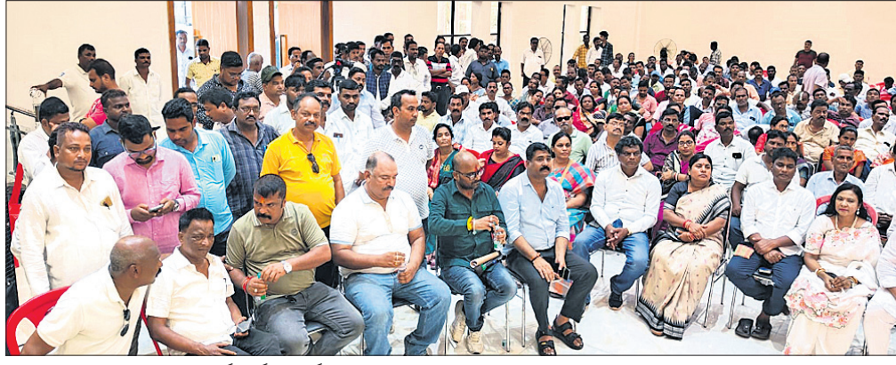
ବୈଠକରେ ଉପସ୍ଥିତ ବିଜେଡି କାର୍ଯ୍ୟକର୍ତ୍ତା ଓ କର୍ମୀମାନେ।

ଉତ୍କଳମଣି ପଣ୍ଡିତ ଗୋପବନ୍ଧୁ ଦାସଙ୍କ ଜୟନ୍ତୀ ଅବସରରେ ବିଜୁ ଜନତା ଦଳ ପକ୍ଷରୁ ବୁଧବାର ଠାରୁ ସଭ୍ୟ ସଂଗ୍ରହ ଅଭିଯାନ ଆରମ୍ଭ ହୋଇଛି। ଏହି ଅବସରରେ ବାରିପଦାର ବାରୋବାହାରିସ୍ଥିତ ନର୍ମଦା ଗାର୍ଡେନଠାରେ ଜିଲାପ୍ରଧାନ କାର୍ଯ୍ୟକ୍ରମର ଶୁଭାରମ୍ଭ ହୋଇଥିବା ବେଳେ ବିଜେଡି କମିଟିରୁ କର୍ମୀମାନେ ବିଜେଡି ସଭାପତି ତଥା ବିରୋଧୀ ଦଳ ନେତା ନବୀନ ପଟ୍ଟନାୟକ ଯୋଗଦେଇ ଆନୁଷ୍ଠାନିକ ଭାବେ କାର୍ଯ୍ୟକ୍ରମକୁ ଉଦ୍‌ଘାଟନ କରିଥିଲେ।