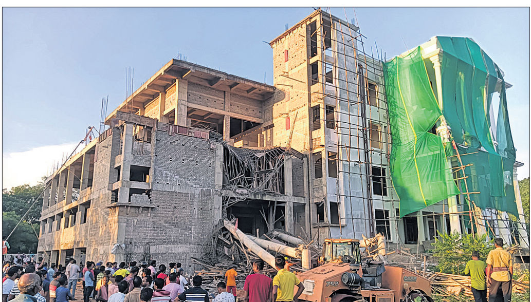
ମହିଷାପାଟ ଛକ ନିକଟରେ ନିର୍ମାଣାଧୀନ ହୋଟେଲ।

ତେଜାନାଳ, ୯।୧୦ (ରତନ ନାୟର) ତେଜାନାଳ ସହର ୫୫ନଂ ଜାତୀୟ ରାଜପଥର ମହିଷାପାଟ ଛକ ନିକଟରେ ଏକ ୫ ମହଲା ବିଶିଷ୍ଟ ହୋଟେଲର ନିର୍ମାଣ କାର୍ଯ୍ୟ ଚାଲିଥିବା ବେଳେ ବୁଧବାର ଅପରାହ୍ଣ ସାଢ଼େ ୪ଟା ସମୟରେ ବିଫଳ ହୋଇଥିଲା ଛାଡ଼ ଭୁଗୁଡ଼ି ପଡ଼ିଲା।