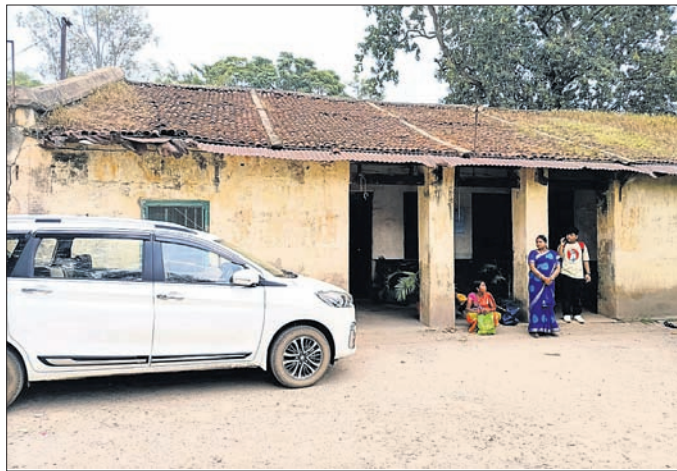
ଜିଲା ପରିବହନ ପରିଚାଳକଙ୍କ କାର୍ଯ୍ୟାଳୟ।

କେନ୍ଦୁଝର ଜିଲା ସଦର ମହକୁମା ତଥା ଜିଲାପାଳଙ୍କ କାର୍ଯ୍ୟାଳୟ ସମ୍ମୁଖରେ ଥିବା ଓଡ଼ିଶା ରାଜ୍ୟ ସଡ଼କ ପରିବହନ ନିଗମର ଜିଲା ପରିବହନ ପରିଚାଳକଙ୍କ କାର୍ଯ୍ୟାଳୟ ଏବଂ ମୁଖ୍ୟାଳୟ ବ୍ୟତୀତ ଜରାଜୀର୍ଣ୍ଣ ଅବସ୍ଥାରେ ରହିଛି। ଚାଲିଥିବା ଅଧିକାଂଶ ସମୟରେ ଏହି କାର୍ଯ୍ୟାଳୟରୁ କେନ୍ଦୁଝର ପହଞ୍ଚିବା ପାଇଁ ଯାତ୍ରୀମାନଙ୍କୁ ଅନାବଶ୍ୟକୀୟ ଅସୁବିଧା ସମ୍ଭାବନା ରହିଛି।