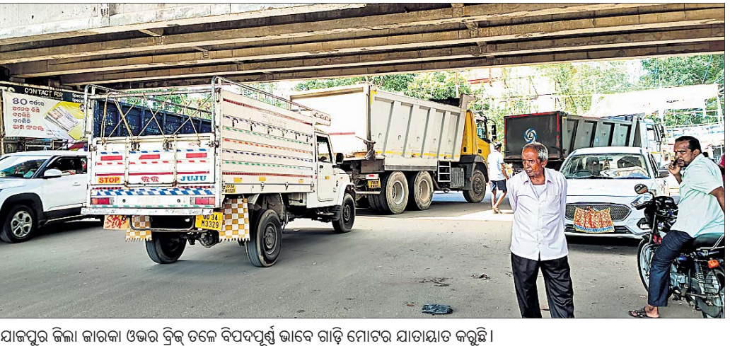
ଯାକପୁର ଜିଲା ଜାଗରା ଓଭର ବ୍ରିକ୍ ତଳେ ବିପଦପୂର୍ଣ୍ଣ ଭାବେ ଗାଡ଼ି ମୋଟର ଯାଚାଯାଉ କରୁଛି।