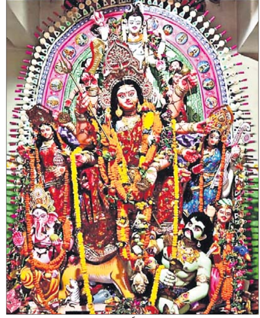
ଏଣ୍ଡରେ ପୂଜା ପାଉଥିବା ମା' ଦୁର୍ଗା।