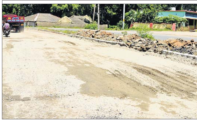
ଦର୍ଦ୍ଦିଗଲା ରାସ୍ତା ।