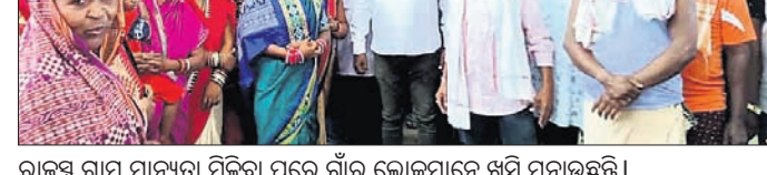
ରାଜ୍ୟ ଗ୍ରାମ ମାନ୍ୟତା ମିଳିବା ପରେ ରାଜ୍ୟ ଗୋପବନ୍ଧୁଙ୍କୁ ଉତ୍ତମପଣି ଶିଶୁ ଶିକ୍ଷା ମନ୍ଦିରରେ ପ୍ରଦାନ କରାଯାଇଥିଲା ।

ନାଉରୀ ବୃକ୍ଷରେ ଗୋପବନ୍ଧୁ ଦାସଙ୍କ ଜୟନ୍ତୀ ପାଳିତ ହୋଇଯାଇଛି । ଏହି ଅବସରରେ ନାଉରୀ ବନ୍ଦାରେ ଥିବା ଗୋପବନ୍ଧୁଙ୍କ ପ୍ରତିମୂର୍ତ୍ତିରେ ଉତ୍ତମପଣି ଶିଶୁ ଶିକ୍ଷା ମନ୍ଦିରର ପିଲାମାନେ ପୁସ୍ତକ ପ୍ରଦାନ କରିଥିଲେ ।