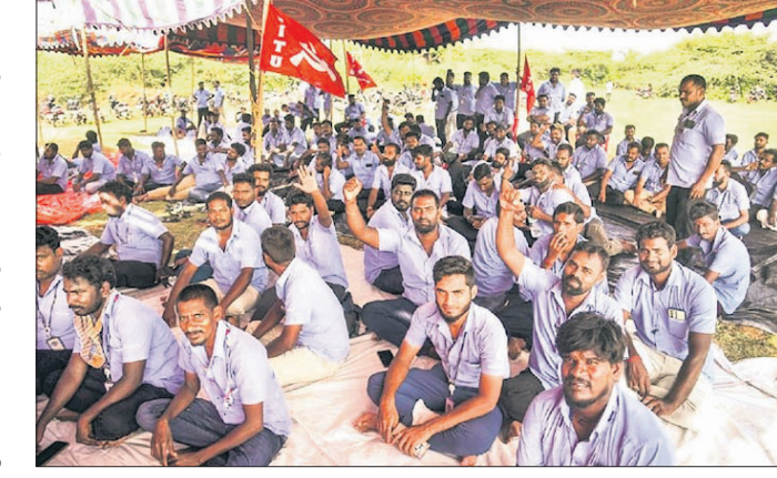
ଚେନ୍ନାଇରେ ବିଭିନ୍ନ ଦାବି ନେଇ ସାମ୍ବଲ ଇଣ୍ଡିଆ କର୍ମଚାରୀମାନେ ଧାରଣାରେ ବସିଛନ୍ତି। ଯୁନିୟନ ମାନ୍ୟତା ମିଳିବା ଦାବି ପୂରଣ ନ ହେଲା ଯାଏ ଧର୍ମଘଟ ଜାରି ରହିବ ବୋଲି ଆନ୍ଦୋଳନରତ କର୍ମଚାରୀ କମ୍ପାନୀକୁ ଚେତାଇଛନ୍ତି। ଚେନ୍ନାଇସ୍ଥିତ

ଚେନ୍ନାଇ ସ୍ଥିତ ସାମ୍ବଲ ଇଲେକ୍ଟ୍ରୋନିକ୍ସ କାରଖାନାର ୧ ହଜାରରୁ ଅଧିକ କର୍ମଚାରୀ ଦରମା ବୃଦ୍ଧି ଓ ଯୁନିୟନ ମାନ୍ୟତା ଦାବି ନେଇ ବଡ଼ ସେପ୍ଟେମ୍ବର ୯ରୁ ଧର୍ମଘଟ କରି ଆସୁଛନ୍ତି। ରୁଧିର ଏହି ଧାରଣାରେ କର୍ମଚାରୀମାନେ ଅଫରକୁ ପ୍ରତ୍ୟାଖାନ କରିଛନ୍ତି। ଆସନ୍ତା ମାସ ପର୍ଯ୍ୟନ୍ତ ଧାରଣାରେ ବସିଥିବା କର୍ମଚାରୀଙ୍କ ମାସିକ ଦରମା ୫ ହଜାର ଟଙ୍କା ପର୍ଯ୍ୟନ୍ତ ବୃଦ୍ଧି କରିବାକୁ ପଠାଯାଇ ସେଠାକୁ ପ୍ରସ୍ତାବ ଦେଇଥିଲା। ତେବେ ଏହି ଅଫରକୁ ଆନ୍ଦୋଳନରତ କର୍ମଚାରୀମାନେ ପ୍ରତ୍ୟାଖାନ କରିଛନ୍ତି।