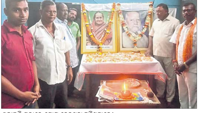
ଶ୍ରଦ୍ଧାଞ୍ଜଳି ସଭାରେ ଯୋଗ ଦେଇଥିବା ଅତିଥିମାନେ।