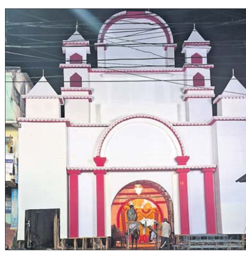
ପୋଖରୀଆପଡ଼ାରେ ନିର୍ମିତ ଚୋରଣ।

କେନ୍ଦ୍ରାପଡ଼ା ଜିଲାର ପଟ୍ଟାମୁଣ୍ଡାଲ ସହର ଓ ଏହାର ଆଖପାଖ ଅଞ୍ଚଳ ଦୁର୍ଗାପୂଜା ପାଇଁ ଉତ୍ସବପୂର୍ଣ୍ଣ ହୋଇଉଠିଛି। ମା'ଙ୍କ ଧରାବତରଣକୁ ସ୍ମାରଣ ପାଇଁ କାଶିଚଣ୍ଡୀରେ ସଜେଇ ହୋଇଛି ପରିବେଶ। ମହାକାୟାଠାରୁ ମା'ଙ୍କ ମୂର୍ତ୍ତିରେ ଖଡ଼ି ଚଢ଼ା ହୋଇ ଗୁରୁବାର ଶାନ୍ତିପାଠ ପଢ଼ା ହୋଇ ଆରମ୍ଭ ହୋଇଯାଇଛି। ପୋଖରୀଆପଡ଼ା ଗାୟତ୍ରୀ ମନ୍ଦିରରେ ଜଗଜନନୀ ପ୍ରତ୍ୟେକ ଦିନ ଭିନ୍ନଭିନ୍ନ ବେଶରେ ଭକ୍ତଙ୍କୁ ଦର୍ଶନ ଦେଉଛନ୍ତି। ରୁଧିରାଣୀ ଶକ୍ତିପୀଠରେ ପୂଜା ମଞ୍ଚପରେ ଆରମ୍ଭ ହେଉଛି ଷଷ୍ଠୀ ପୂଜା। ଚିକିତ୍ସିକ ଆଲୋକମାଳାରେ ପଟ୍ଟାମୁଣ୍ଡାଲ ସହର ଝଲସୁଛି। ପଟ୍ଟାମୁଣ୍ଡାଲ ଅଞ୍ଚଳର ପ୍ରମୁଖ ପୂଜା ମଞ୍ଚପରେ ପୂଜା ବିଧି