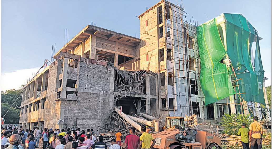
ମହିଷାପାତ ଛକ ନିକଟରେ ନିର୍ମାଣାଧୀନ ହୋଟେଲ।

ଭୁବନେଶ୍ୱର, ୯।୧୦ (ସୁନିବ ମିତ୍ରି) ରାଜ୍ୟ ସରକାରଙ୍କ ବିଭିନ୍ନ ଉଦ୍ୟୋଗରେ କାର୍ଯ୍ୟରତ କର୍ମଚାରୀମାନଙ୍କ ମହଙ୍ଗା ଭଡା ପରିମାଣ ୪୬%ରୁ ୫୦%କୁ ବୃଦ୍ଧି କରାଯାଇଛି। ଏହି ବର୍ଦ୍ଧିତ ମହଙ୍ଗା ଭଡା ପିଛଲା ଭାବେ ୨୦୨୪ ଜାନୁଆରୀ ପହିଲାରୁ ଲାଗୁ ହେବ। ସାଧାରଣ ନିର୍ବାଚନକୁ ଦୃଷ୍ଟିରେ ରଖି ତତ୍କାଳୀନ ବିଜେଡି ସରକାର ଗତ ମାର୍ଚ୍ଚ ୧୪ ତାରିଖରେ ରାଜ୍ୟ ସରକାରୀ କର୍ମଚାରୀମାନଙ୍କ ମହଙ୍ଗା ଭଡାକୁ ୪୬%ରୁ ୫୦%କୁ ବୃଦ୍ଧି କରିଥିଲେ। ସାଧାରଣ ଉଦ୍ୟୋଗ ବିଭାଗ ପକ୍ଷରୁ ରୂପବାର କାରି ବିଜ୍ଞପ୍ତି ଅନୁଯାୟୀ, ରାଜ୍ୟ ସରକାରୀ ଉଦ୍ୟୋଗ କର୍ମଚାରୀମାନଙ୍କ ପାଇଁ ୨୦୧୭ ଦରମା ହାର ଆଧାରରେ ମହଙ୍ଗା ଭଡା ପରିମାଣକୁ ୪୬%ରୁ ୫୦%କୁ ବୃଦ୍ଧି କରାଯାଇଛି, ଯାହା ୨୦୨୪ ଜାନୁଆରୀ ୧ରୁ ପିଛଲା ଭାବେ ଲାଗୁ ହେବ। ତେବେ ଏହି ବର୍ଦ୍ଧିତ ମହଙ୍ଗା ଭଡା ରାଜ୍ୟ ଉଦ୍ୟୋଗରେ କାର୍ଯ୍ୟରତ ଯୋଗ୍ୟ କର୍ମଚାରୀଙ୍କୁ ହିଁ ମିଳିବ। ସେଥିଲାଗି ସାଧାରଣ ଉଦ୍ୟୋଗ ବିଭାଗ ମୋଟ ୯ଟି ସର୍ତ୍ତ ରଖିଛି। ଏହି ସର୍ତ୍ତ ପୂରଣ କରୁଥିବା ରାଜ୍ୟ ସରକାରଙ୍କ ଉଦ୍ୟୋଗଗୁଡ଼ିକ ନିଜର କର୍ମଚାରୀଙ୍କୁ ବର୍ଦ୍ଧିତ ମହଙ୍ଗା ଭଡା ନିକ ପାଣ୍ଟିକୁ ଦେଇପାରିବେ। ଏଥିପାଇଁ ରାଜ୍ୟ ସରକାର କୌଣସି ଆର୍ଥିକ ସହାୟତା ଦେବେ ନାହିଁ। ଯେଉଁ ୯ଟି ସର୍ତ୍ତ ରଖାଯାଇଛି ସେଥିରେ ୨୦୨୩-୨୪ ଆର୍ଥିକ ବର୍ଷ ପାଇଁ ସମ୍ପୂର୍ଣ୍ଣ ସରକାରୀ ଉଦ୍ୟୋଗ ବିଧାନିକ ଅତିବିଶେଷ କରିଥିବା ଜରୁରୀ। ଏହି ଉଦ୍ୟୋଗ ସରକାର, ବ୍ୟାଙ୍କ ଓ ଆର୍ଥିକ ସଂସ୍ଥା ରଖି ପରିଶୋଧରେ ଖୁଲାସ କରି ନ ଥିବା ଆବଶ୍ୟକ। କର୍ମଚାରୀମାନଙ୍କ ଇତିପଦ ଓ ଇସ୍ତଫା ପାଣ୍ଟି ଦାଖଲରେ ମଧ୍ୟ ଖୁଲାସ ହୋଇ ନ ଥିବା ଦରକାର। ଏହାଛଡ଼ା କେବଳ ଲାଭରେ ଚାଲୁଥିବା ଉଦ୍ୟୋଗଗୁଡ଼ିକ ନିଜର କର୍ମଚାରୀଙ୍କୁ ମହଙ୍ଗା ଭଡା ଦେଇପାରିବେ ବୋଲି ଉଲ୍ଲେଖ କରାଯାଇଛି।