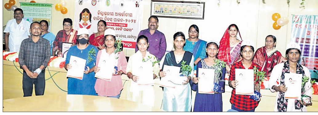
ଅତିଥିକ ଗହଣରେ ସମ୍ବର୍ଦ୍ଧିତ ହୋଇଥିବା କୃତୀ ପ୍ରତିଯୋଗୀମାନ ।