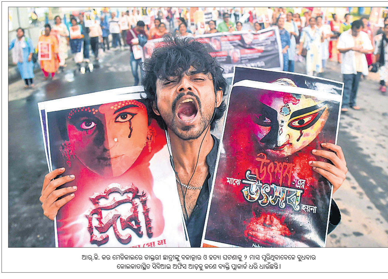
ଆର୍.ଜି. କର ମେଡିକାଲରେ ଚାନ୍ଦ୍ରା ଛାତ୍ରୀଙ୍କୁ ବଳାହାର ଓ ହତ୍ୟା ଘଟଣାକୁ ୨ ମାସ ପୁରିଥିବାବେଳେ ରୁଧିର ଭାଜପାତାସ୍ଥିତ ସିବିଆଇ ଅଫିସ୍ ଆଡ଼କୁ ଜଣେ ବ୍ୟକ୍ତି ପୁଲ୍କାଟ୍ ଧରି ଧାଇଁଛନ୍ତି।