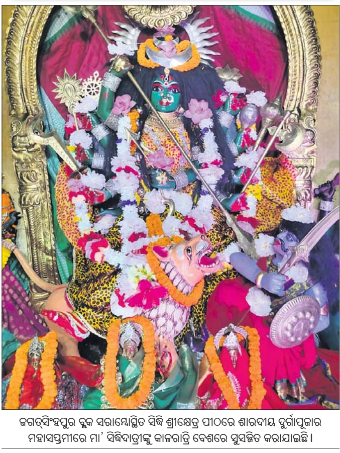
କରବିହୀନଙ୍କୁ ରୁକ୍ମିଣୀ ସରାଧେୟାସ୍ଥିତ ବିଳି ଶ୍ରୀକ୍ଷେତ୍ର ପୀଠରେ ଶାରଦୀୟ ଦୁର୍ଗାପୂଜାର ମହାସପ୍ତମୀରେ ମା' ସିଦ୍ଧାତ୍ରୀଙ୍କୁ କାକରାଦ୍ୱି ବେଶରେ ସୁସଜ୍ଜିତ କରାଯାଇଛି।