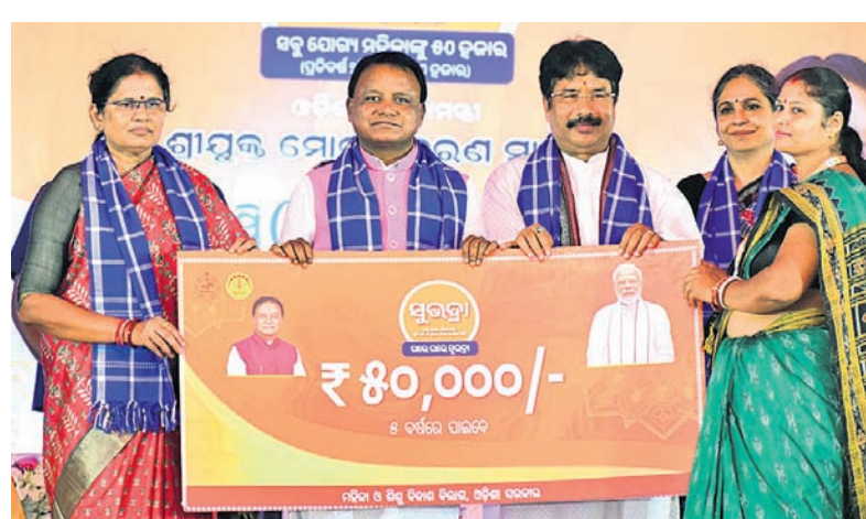
କର୍ମ ହିତାଧିକାରୀଙ୍କୁ ସୁଭଦ୍ରା ଯୋଜନା ପ୍ରଥମ କିସ୍ତିର ବିତରଣ ପର୍ଯ୍ୟାୟ ଅର୍ଥରାଶି ବଣ୍ଟନ କରୁଛନ୍ତି ମୁଖ୍ୟମନ୍ତ୍ରୀ ମୋହନ ଚରଣ ମାଝୀ। ନିକଟରେ ଅଛନ୍ତି ଉପ ମୁଖ୍ୟମନ୍ତ୍ରୀ ପ୍ରଭାତୀ ପରିଡ଼ା, ମନ୍ତ୍ରୀ କୁଞ୍ଜବ୍ରତ ମହାପାତ୍ର।