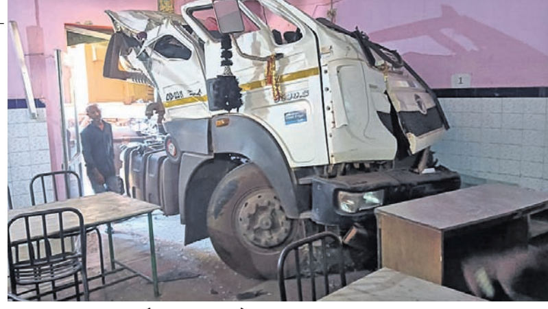
ଭେଙ୍ଗାମାଳ, ୯।୧୦ (ରତନ ନାୟାର) ଅପରାହ୍ନ ୪ଟା ସମୟରେ ଏକ ଟ୍ରେଲର ଭେଙ୍ଗାମାଳ ସହର ୫୫ନଂ ଜାତୀୟ ରାଜପଥର ମହିଷାପାତ ଛକଠାରେ ରୁଧିରାତ ଦିଗରୁ ଆସୁଥିବା ଏକ କାର୍ (ସୁମୋ)କୁ ଧକାଦେଇ

ରାସ୍ତା କଡ଼ରେ ଥିବା ଏକ ହୋଟେଲ ଭିତରକୁ ପଶିଯାଇଥିଲା। ଏଥିରେ ୫ଜଣ ଆହତ ହୋଇଛନ୍ତି। ଦୁର୍ଘଟଣାରେ କାର୍‌ଟି ରାସ୍ତା ଉପରେ ଓଲଟି ପଡ଼ିଥିଲା। ଏକ ଦାଣ୍ଡିଆ କାର୍ଯ୍ୟକ୍ରମରେ ଯୋଗଦେବା ପାଇଁ ଏକ କାର୍‌ରେ ୫ଜଣ କଳାକାର କଟକକୁ ଚାଳନାରେ ଯାଉଥିଲେ। ଆହତମାନଙ୍କୁ ଜିଲା ମୁଖ୍ୟ ଚିକିତ୍ସାଳୟରେ ଭର୍ତ୍ତି କରାଯାଇଥିଲା। ଦୁର୍ଘଟଣା ପରେ ଟ୍ରେଲରଟି ହୋଟେଲ ଭିତରେ ପଶିଯିବାରୁ ସେଠାରେ ଖାଇବାକୁ ବସିଥିବା ଲୋକମାନେ ଜୀବନ ବିକଳରେ ଦୋହାଁ ପଳାଇଥିଲେ। ଘଟଣାସ୍ଥଳରେ କିଛି ସମୟ ପାଇଁ ଉଭେଜନା ପ୍ରକାଶ ପାଇଥିଲା। ଖବରପାଇ ଗାଉନ ଥାନା ପୋଲିସ୍ ପହଞ୍ଚି ତଦନ୍ତ ଆରମ୍ଭ କରିଥିଲା। ବହୁ ସମୟ ଧରି ଜାତୀୟ ରାଜପଥରେ ଯାନବାହାନ ଚଳାଚଳ ବ୍ୟାହତ ହୋଇଥିଲା।