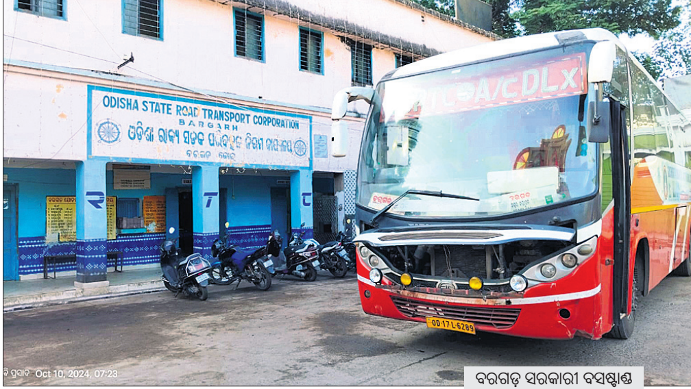
ବରଗଡ଼ ସରକାରୀ ବସ୍ଷାଣ

ବରଗଡ଼ ସରକାରୀ ବସ୍ଷାଣ ସର୍ବ ପ୍ରକାରରେ ଅନ୍ୟ ବସ୍ଷାଣଗୁଡ଼ିକର ନକାକରଣ, ରୂପାନ୍ତରାଜରଣ ହେଉଛି। କିନ୍ତୁ ବରଗଡ଼ ସହରର ପୁଖ୍ୟ ପେଣ୍ଡୁଳୀରେ ରହିଥିବା ଏହି ବସ୍ଷାଣରେ ତାହା ହେଉନାହିଁ। ଅପରପକ୍ଷେ ରାଜ୍ୟର ଏହି ପ୍ରମୁଖ ବସ୍ଷାଣ ଦିନକୁ ଦିନ ଚା'ର ଅସ୍ଥିତ ହେଉ ଚାଲିଛି। ବସ୍ଷାଣ ପରିସରରେ ଥିବା ପେଟ୍ରୋଲ ପମ୍ପ କେଉଁକାଳକୁ ଉପଯୋଗୀ ଏଠାରେ ରହିଥିବା ଗ୍ୟାରେଜ୍ ମଧ୍ୟ ଆଉ ନାହିଁ। ସେହିପରି ବସ୍ଷାଣ ପରିସରରେ ଥିବା କ୍ୟାଣ୍ଟିନରେ ଦାର୍ଯ୍ୟବର୍ଷ ହେଲା ତାଲା ଖୁଲିଛି। ଭେନେଜ୍ ବ୍ୟବସ୍ଥା ଠିକ୍ ନ ଥିବା ଯୋଗୁଁ ସାମାନ୍ୟ ବର୍ଷାରେ ବସ୍ଷାଣ ଜଳାଣି ହୋଇପଡ଼ୁଛି। କେବଳ ସେତିକି ନୁହେଁ, ଏଠାରେ ଯାତ୍ରାମାନଙ୍କୁ ଅନେକ ସମସ୍ୟାରେ ସମ୍ବନ୍ଧିତ ମୌଳିକ ସୁବିଧା ସୁଯୋଗରୁ ମଧ୍ୟ ବଞ୍ଚିତ ହେବାକୁ ପଡ଼ୁଥିବା ଅଭିଯୋଗ ହେଉଛି। ଯାତ୍ରୀବାହୀ ବସ୍ ଯାତାୟତ ସମ୍ପର୍କିତ ସୂଚନା ଆଉ ଡାକବାକି ଯନ୍ତ୍ରରେ କୁଣ୍ଠିବାକୁ ମିଳୁନାହିଁ। ଏହାସତ୍ତ୍ୱେ ଓଡ଼ିଶା ରାଜ୍ୟ ସଡ଼କ ପରିବହନ ନିଗମ (ଏସ୍ଏଆର୍ଟିସି) ଏଥିପ୍ରତି ଆଖି ବୁଜିଦେଇଛି। ଜିଲ୍ଲାବାସୀଙ୍କ ଆବଶ୍ୟକତା ଦୃଷ୍ଟିରୁ ବରଗଡ଼ ସରକାରୀ ବସ୍ଷାଣ ୧୯୫୨ ମସିହାରେ ପ୍ରତିଷ୍ଠା ହୋଇଥିଲା। ସେତେବେଳେ ବସ୍ଷାଣ ପରିସରରେ ବିଭିନ୍ନ ବିଭାଗ ପାଇଁ ୨ମହଲା ବିଶିଷ୍ଟ କୋଠାଘର ହୋଇଥିଲା। ତଳ ମହଲାରେ ୬ ଏବଂ ଉପର ମହଲାରେ ୪ଟି କୋଠାଘର ରହିଥିଲା। ଉଭୟ ମହଲା