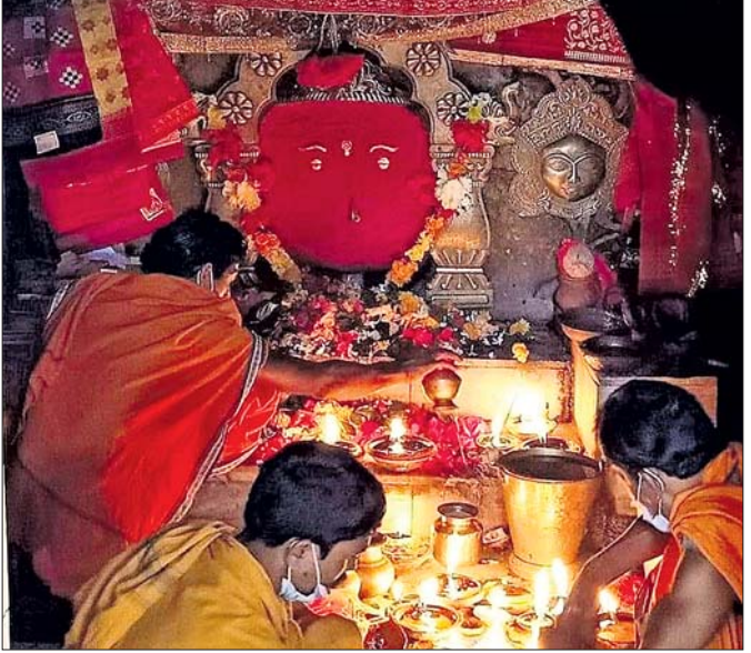
ମା' ବରାଳଦେବୀଙ୍କ ପୂଜାର୍ଚ୍ଚନା କରାଯାଇଛି ।