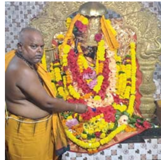
ସହ ୧୦୮ ଆକଡି କରି ପୁଷ୍ପାଞ୍ଜଳି ପ୍ରଦାନ କରାଯିବ। ମଙ୍ଗଳ ମହାଗ୍ରହଙ୍କ ଲକ୍ଷ୍ମଦେବୀ ହୋଇଥିବାରୁ ବହୁ ବିପଦରୁ ମାଁ ଉଦ୍ଧାର କରନ୍ତି। ଲୋକନାଥପୁର ଶାସନ ପୂର୍ବକ ମାନେ ଏହି ପୀଠରେ ପୂଜାକରି ଆସୁଥିଲେ । ଏହି ପୀଠର ନବାକରଣ ହୋଇଛି। ରାଜ୍ୟ ଓ ଆନ୍ଧ୍ରକୁ ବହୁ ଶ୍ରଦ୍ଧାକୁ ଆସୁଛନ୍ତି।

ବ୍ରହ୍ମପୁର ୧୦।୧୦ (ସୁବାସ ଚନ୍ଦ୍ର ପାଠୀ) ଗାନ୍ଧୀ ଜିଲ୍ଲା ଚଳିତ ଲୋକନାଥପୁର ଶାସନ ଭୋଜାସିତି ରୋଡ଼ରେ ପୁରାତନ କାଳରୁ ପୂଜା ପାଇ ଆସୁଥିବା ବରଳାପୁଞ୍ଜୀଙ୍କ ପୀଠରେ ନବଦିନାମ୍ଭୁକ ପୂଜା ମଧ୍ୟରୁ ଗୁରୁବାର ମହାଷ୍ଟମୀ ଭିତ ହୋଇଛି। ନଅ ଦିନ ବ୍ୟାପୀ ପୀଠରେ ସୂର୍ଯ୍ୟପୂଜା, ମାଁଙ୍କୁ ପାର୍ଶ୍ୱ ବିଗ୍ରହ ପୂଜା, ମାଁଙ୍କୁ କ୍ଷୀର, ଦହି, ଘିଅ, ମହୁ, ଗଜାଳକ, ଆଖୁରସ, ନବାତ, ଲୋଡିବ ବୋଲି ତେତାବନା ଦେଇଛି।