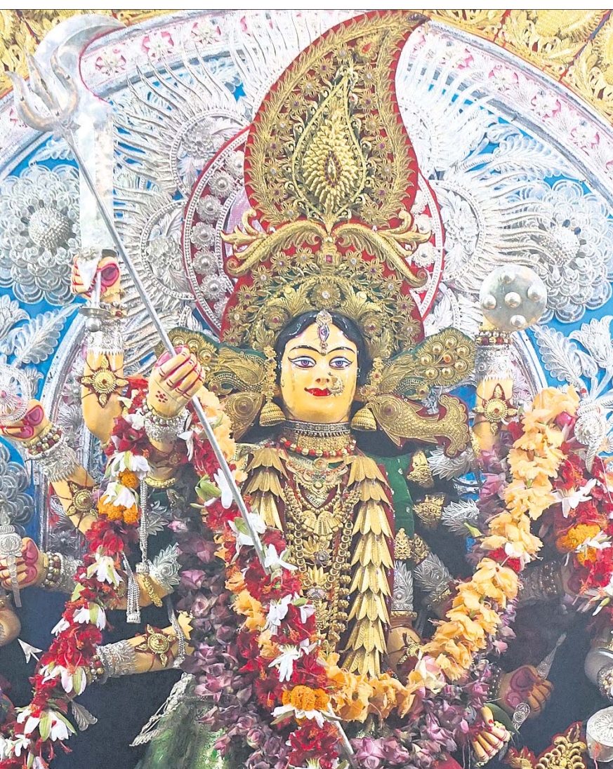
ମହାସପ୍ତମୀରେ ଗୁରୁବାର କଟକ ଚୌଧୁରୀ ବଜାର ପୂଜା ମଣ୍ଡପରେ ସୁନା ଅଳଙ୍କାର, ସୁନା ଓ ଚାନ୍ଦି ମେଡ଼ରେ ପୂଜା ପାଉଛନ୍ତି ମା' ବୁର୍ଗା।