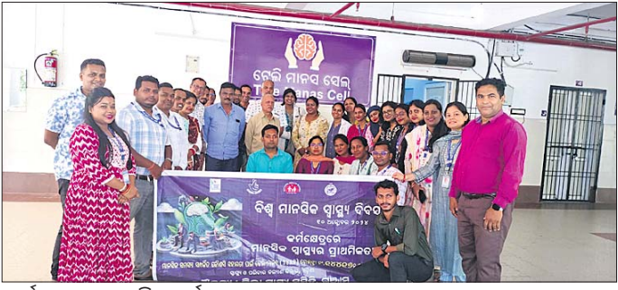
କାର୍ଯ୍ୟକ୍ରମରେ ଉପସ୍ଥିତ କର୍ମଚାରୀ।