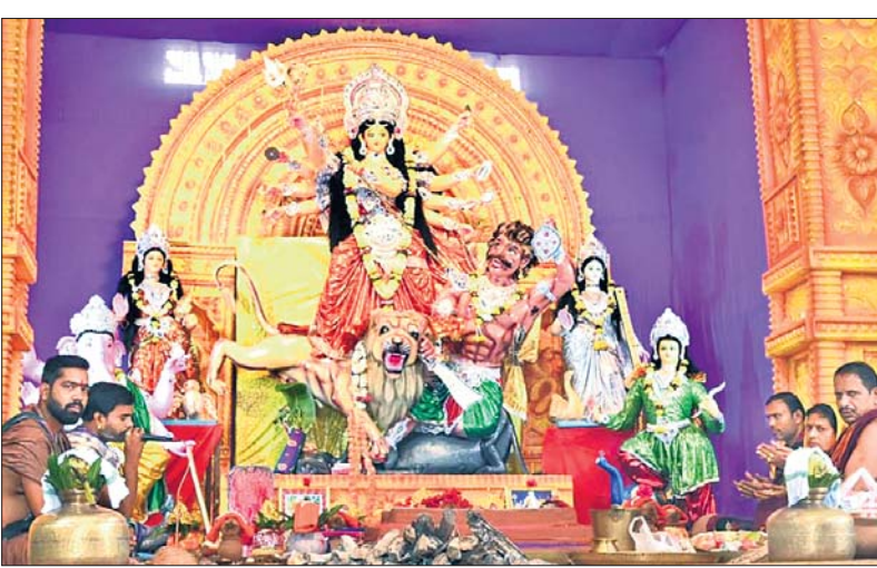
ମା ଦୁର୍ଗାଙ୍କ ଧରାବତରଣ: