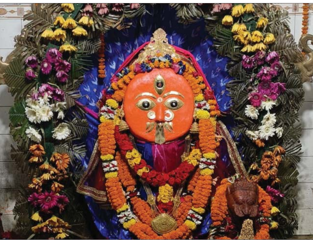
ମହାଷ୍ଟମୀ ଅବସରରେ ଆସିକାର ଆରାଧ୍ୟା ମା' ଖଣ୍ଡେଶରୀଙ୍କ ପୂଜାବେଶ ।