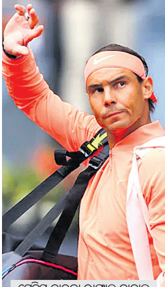
ଚେନ୍ନିସ ଚାରକା ରାଫାଲ ନାଡ଼ାଲ

ଭାରତରେ ଲୋକ ସଭା ନିର୍ବାଚନ ସହିତ ଏକକାଳୀନ ସମସ୍ତ ରାଜ୍ୟର ବିଧାନସଭା ଭୋଟ କରାଇବା ପାଇଁ କେନ୍ଦ୍ର ସରକାର ଗୁରୁତ୍ୱ ଦେଇଆସୁଛନ୍ତି। ରାମନାଥ କୋବିନ୍ଦ କମିଟିର ଏସମ୍ପର୍କିତ ପ୍ରସ୍ତାବକୁ ୨୦୨୪ ସେପ୍ଟେମ୍ବର ୧୮ରେ କେନ୍ଦ୍ର କ୍ୟାବିନେଟ ମଞ୍ଜୁରୀ ଦେଇଥିଲା। ଭାଜପାର ନିର୍ବାଚନୀ ଇସ୍ତାହାରରେ ସ୍ଥାନ ପାଇଥିବା 'ଝୁନ୍‌ନେଶ୍‌ନ୍ ଝୁନ୍‌ଲେକ୍‌ନ୍' ପ୍ରସ୍ତାବକୁ ଜାତୀୟ ଗଣତାନ୍ତ୍ରିକ ମେଣ୍ଟ (ଏନ୍‌ଡିଏ) ସରକାରଙ୍କ ତୃତୀୟ ପାଲିରେ ହିଁ କାର୍ଯ୍ୟକାରୀ କରାଯିବ ବୋଲି ନିକଟରେ ପ୍ରଧାନମନ୍ତ୍ରୀ ନରେନ୍ଦ୍ର ମୋଦି ସ୍ପଷ୍ଟ କରିଥିଲେ। ତେବେ ଅଣଭାଜପା ଶାସିତ ରାଜ୍ୟଗୁଡ଼ିକର ବିରୋଧ ଯୋଗୁ କେନ୍ଦ୍ରର ଏହି ପ୍ରସ୍ତାବ କାର୍ଯ୍ୟକାରୀ ହେବା ନେଇ ଆଶଙ୍କା ପ୍ରକାଶ ପାଇଲାଣି। କେରଳ ବିଧାନସଭାରେ ଏହା ବିରୋଧରେ ଗୁରୁବାର ଏକ ପ୍ରସ୍ତାବ ପାରିତ ହୋଇଛି। ଏକସଙ୍ଗେ ନିର୍ବାଚନ କରାଗଲେ ରାଜ୍ୟଗୁଡ଼ିକର ଅଧିକାର ଖୁଣ୍ଟ ହେବ। ଏହା ସଂଘୀୟ ବ୍ୟବସ୍ଥା ପ୍ରତି ବିପଦ ସୃଷ୍ଟି କରିବା ସହ ଗଣତାନ୍ତ୍ରିକ ଓ ସାମ୍ପ୍ରଦାୟିକ ସିଦ୍ଧାନ୍ତଗୁଡ଼ିକୁ ଦୁର୍ବଳ କରିଦେବ ବୋଲି ସଂକଳ୍ପନାମାରେ କୁହାଯାଇଛି। ପ୍ରସ୍ତାବକୁ ପ୍ରତ୍ୟାହାର ପାଇଁ ପିନାରାୟା ବିଜୟନ୍ ସରକାର କେନ୍ଦ୍ର ନିକଟରେ ଦାବି ଜଣାଇଛନ୍ତି।