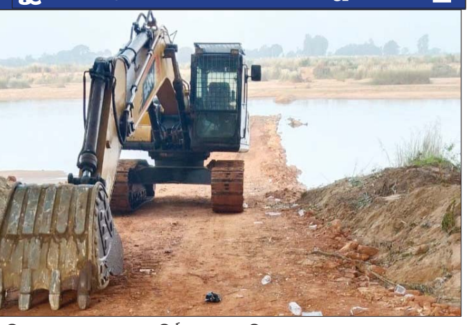
ଗଣିକୂଳ୍ୟା ନଦୀ ମଧ୍ୟରେ ରାସ୍ତା ନିର୍ମାଣ କରାଯାଇଛି ।

ନଦୀ ସହଯାଇଛି । ନଦୀ ତଟ ନିକଟରେ ଜନସମୂହ ଅଛି । ବନ୍ୟା ଆସିଲେ ରାସ୍ତାକୁ ଲାଗି ପାଣି ପ୍ରବାହିତ ହେବା ସହ ବେଳେ