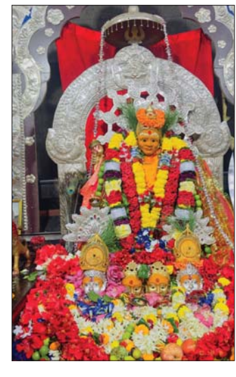
ପୁରୁଷୋତ୍ତମପୁର, ୧୦/୧୦ (ସିମାନ୍ତକ ମିଶ୍ର)

ଗଞ୍ଜାମ ଜିଲ୍ଲା ତଥା ଦକ୍ଷିଣ ଓଡ଼ିଶାର ପ୍ରସିଦ୍ଧ ଇନ୍ଦ୍ରଦେବୀ ମା' ତାରା ଅଞ୍ଚଳବାସୀଙ୍କ ସହଯୋଗ ରହିଛି ।